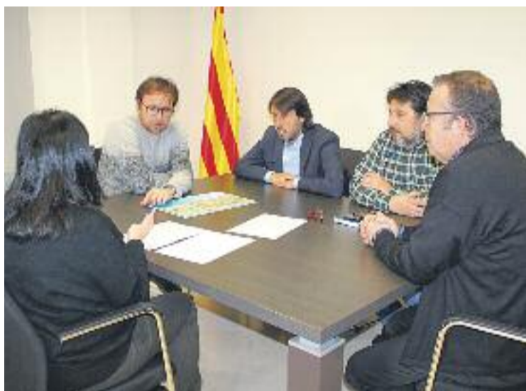
Reunió dels representants municipals amb la Diputació.

Per altra banda, a la trobada també es va parlar sobre el barri de Valldaina. El consistori va explorar la possibilitat que la Diputació també doni suport a projectes de millora en aquella