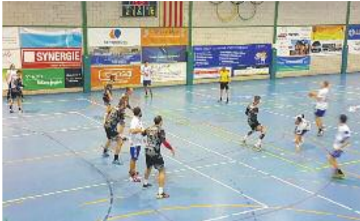
L'última derrota de l'equip va ser a finals de novembre.

De fet, aquesta segona posició que l'equip manté des de fa gairebé tres mesos li asseguraria la presència a la post temporada, ja que només les dues primeres posicions de cadascun dels sis grups de la Primera Estatal són els únics que jugarien la fase final i optarien a pujar a la Divisió d'Honor de plata.