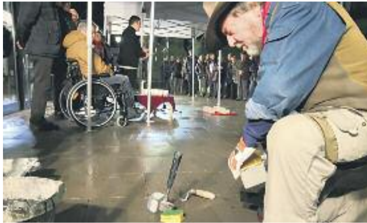
Demnig col·locant una de les llambordes del record.

Es tracta d'una iniciativa que va arrencar fa més de dues dècades de la mà de l'artista alemany Gunter Demnig, que pretén aturar els vianants per fer-los pensar en la persona a la qual fa referència la llamborda memorialística. Persones que van desaparèixer, van ser torturades o