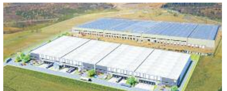
Imatge virtual de la nau de Mercadona.

L'anunci de Mercadona es va fer públic a principis de mes. Però el passat dia 21 es va saber que el grup murcià Baraka Capital Global invertirà 15 milions per adquirir una parcel·la de 30.000 metres quadrats al polígon industrial de Ca n'Estella, on vol edificar també una plataforma logística d'un total de 19.200 metres quadrats.