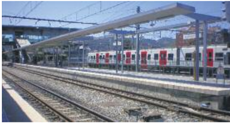
L'estació de Martorell-Enllaç.

Pel que fa a la construcció de l'estació intermodal, Martorell reclamarà al Ministeri de Foment del govern espanyol que finalitzi les obres, previstes des de