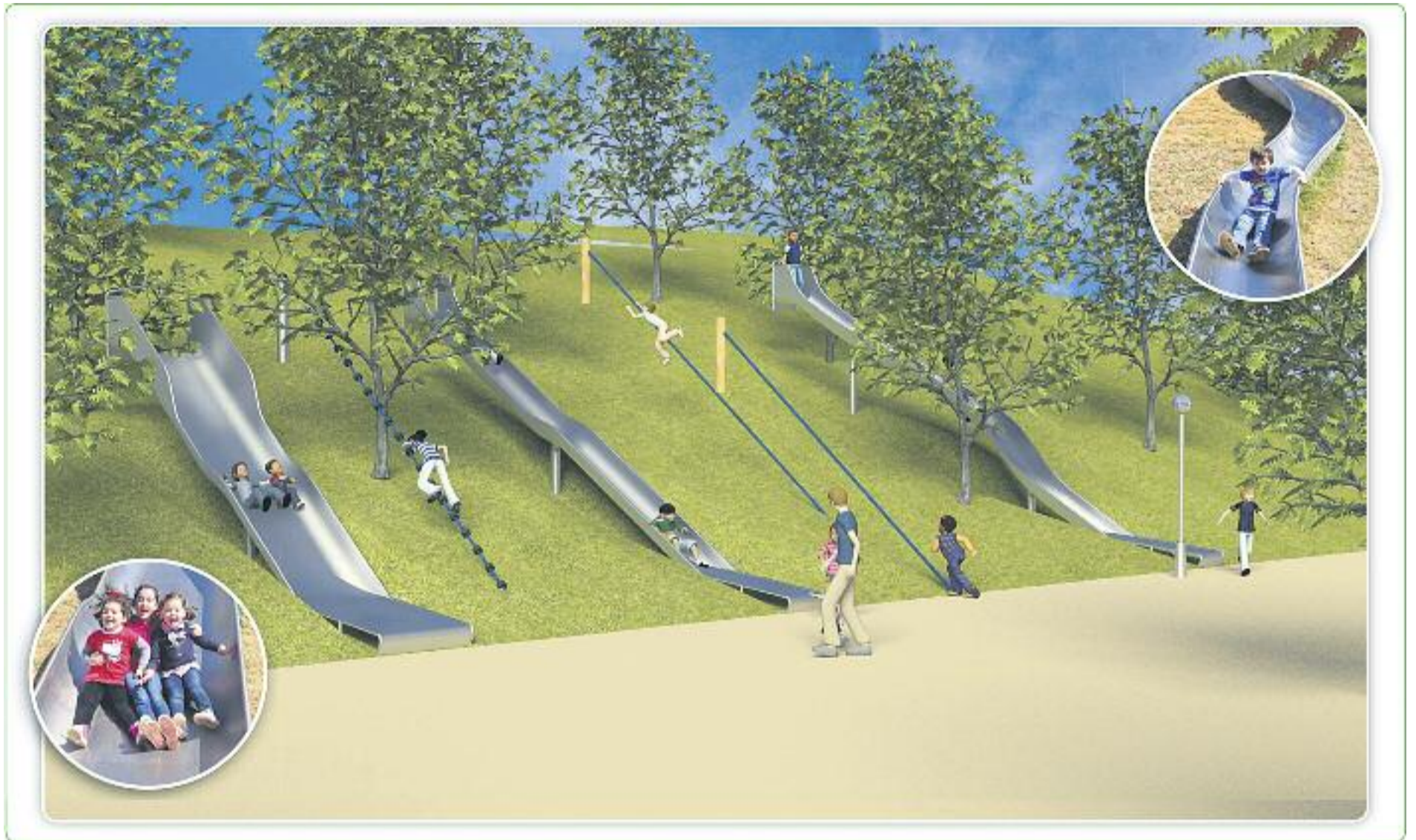
El parc inclusiu estarà adaptat per tal que hi puguin jugar junts nens i nenes amb diferents capacitats.

» Comencen les obres del Parc d'Europa, un espai adaptat per a infants amb diferents capacitats » Fonollosa: "Volem que sigui un lloc de referència per gaudir amb nens des d'un any fins als 12"