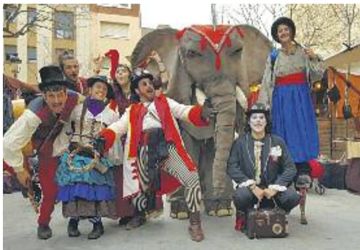
El gran Elefant, tot un clàssic de la fira.

Entre les activitats més destacades de la fira hi ha el Mercat Modernista, el qual tindrà lloc al llarg dels dos dies de celebració, la fideuada popular del dia 3 al migdia al carrer dels arbres, els passis de cinema o els espectacles itinerants, com ara el circ dels Freak Show del dia 3 a les