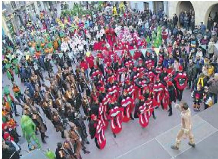
Una imatge del carnaval 'Martorell Bestial'.

Ca n'Oliveras va acollir el lliurament de premis i el sopar de colles. El premi a la millor disfressa, dotat amb 600 euros, se'l va emportar la colla Las Gárgaras per la disfressa 'Gàrgola', una de les més originals de la rua. El segon premi, de 400 euros, se'l va endur la colla Pop Corn, per la disfressa 'Bosc bes-