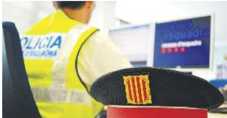
Simular un delictes està castigat pel Codi Penal.

L'agent local que la va atendre la va informar que fets com aquest no són coberts per les pòlisses d'assegurances. Va ser en aquest moment, expliquen les mateixes fonts, que la dona va canviar la versió dels fets, asse-