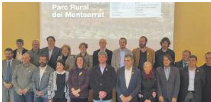
Els alcaldes dels 16 municipis fundadors del Parc Rural.

Com ho volen fer? Doncs recuperant terrenys agrícoles, consolidant i augmentant la producció, elaborar productes de qualitat i foment de l'agricultura ecològica i de les infraestructures de regadiu que donin suport als cultius de secà. A tot això cal afegir la creació d'un banc de terres i mesures per prevenir incendis forestals, entre altres.