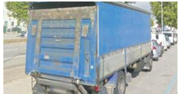
El camió sostret a Castellbisbal.

SEGURETAT ▶ Els Mossos van emetre un avís a totes les policies locals i forces i cossos de seguretat de l'Estat pel robatori d'un camió d'unes 3,5 tones que va ser robat el dia 6 d'una empresa de Castellbisbal.