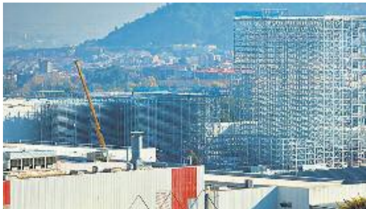
Serà el centre logístic més alt d'Espanya.

INDÚSTRIA ▶ Després de setmanes d'incertesa sobre el futur de Seat a terres martorellenes, els dubtes s'han esvaït definitivament amb l'anunci d'una gran inversió per millorar la planta que l'empresa té a Martorell. Seat ha assegurat que hi construirà un nou centre logístic automatitzat en el qual emmagatzemarà components i que estarà dotat amb tecnologia intel·ligent que permetrà un procés totalment automàtic.