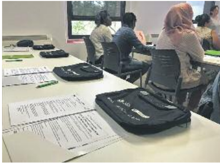
Les dones rebran formació i faran pràctiques laborals.

Aquest projecte, de 12 mesos de durada, combina accions d'orientació i formació tant transversal com a professionalitzadora amb pràctiques professionals no laborals en empreses, tutories, accions ocupacionals i promoció de l'ús de les noves tecnologies. Segons ha explicat l'Ajuntament, totes les accions integrades en aquest programa segueixen uns fils conductors