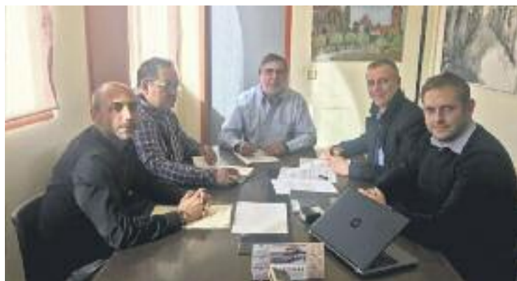
El moment de la signatura de la compra de l'equipament.

Aquestes classes es reproduïxen automàticament i estan adaptades a diversos nivells de dificultat i resistència.