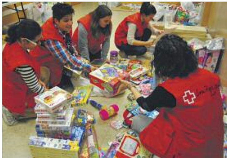
L'entitat vol igualar les xifres de l'any passat.

Centre Penitenciari Brians 1 i 2. La Creu Roja demana als veïns i veïnes que portin joguines noves, no bèl·liques, no sexistes i que a poder ser promoguin el joc cooperatiu. L'entitat promou iniciatives com aquesta per fomentar l'activisme i el compromís de la població amb la situació de desavantatge social i econòmic, principalment dels infants. Les joguines es recullen a la seu de l'entitat, que està ubicada al carrer Revall.