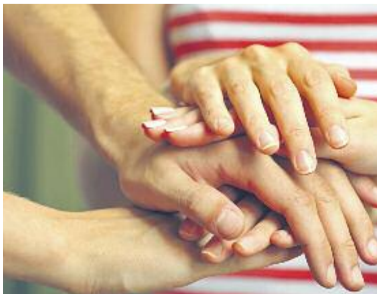
Esparreguera dedica 186 euros per habitant a despesa social.

El rànquing de municipis en excel·lència social classifica els ajuntaments tenint en compte la despesa acreditada en serveis socials i promoció social per habitant, a la variació interanual del mateix i al grau de transparència amb que aquesta in-