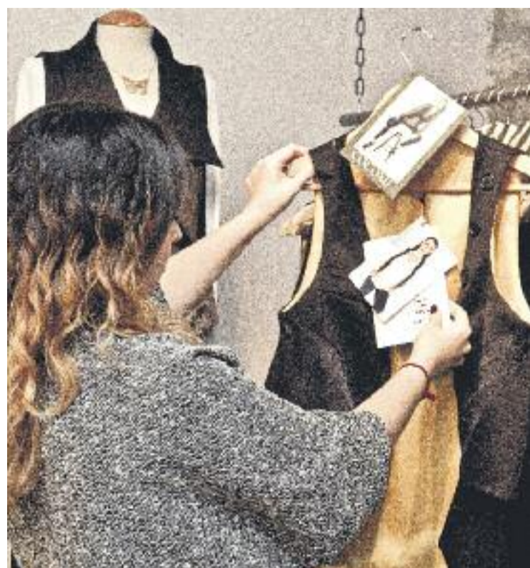
El comerç de proximitat torna a posar tota la carn a la graella per millorar els resultats de Nadal.