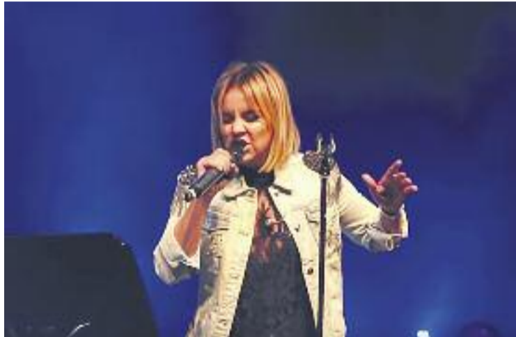
La cantant Chenoa va omplir el Núria Espert.

Com és tradicional, durant la Festa va tenir lloc l'encesa dels llums de Nadal, i també hi va haver espai per a la solidaritat. Durant la Festa de Sant Andreu