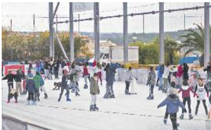
El primer cap de setmana va ser un èxit de visitants.

MARTORELL ▶ Fins al 7 de gener, una pista de gel annexa al pavelló farà gaudir els martorellencs que s'hi apropin. Es tracta d'una iniciativa que es porta a terme per primer cop al municipi, amb l'objectiu no només de promocionar l'esport, sinó també d'animar i dinamitzar les compres nadalenques. En aquest sentit, els paradistes del Mercat Municipal Les Bòbiles i els comerços de les associacions Nou Martorell i Fem Vila ofereixen tiquets amb descomptes en les entrades per patinar-hi.