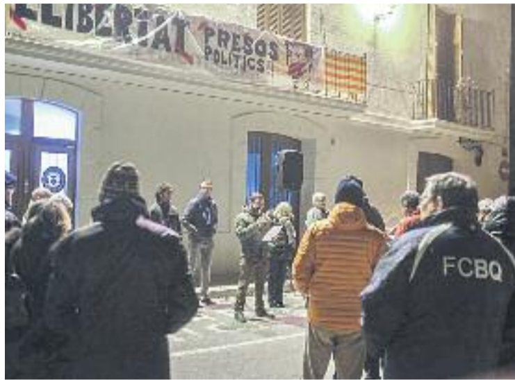
Concentració pels presos on es veuen les pancartes retirades.