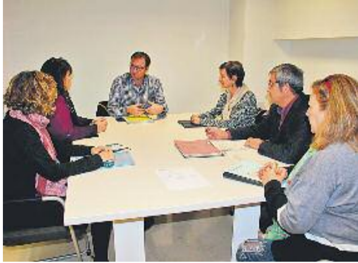
Les reformes pendents a l'escola van centrar la reunió.

Igualment, en la reunió es van comentar les millores que des de l'Ajuntament s'han fet