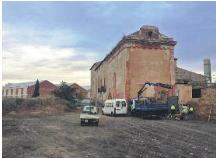
Dos operaris hi treballaran per evitar la seva degradació.

La Torre de Santa Llúcia és una antiga masia del segle XII, que va viure la seva esplendor en el període renaixentista, sota el domini de la família Requesens. A la Torre hi van fer estada Felip II i Carles I i va ser una masia que va tenir una gran productivitat de vi. De fet, la finca va ser centre d'una extensa plana de conreus, que va començar a desaparèixer l'any 1963, amb l'expropiació de terrenys per a fer-