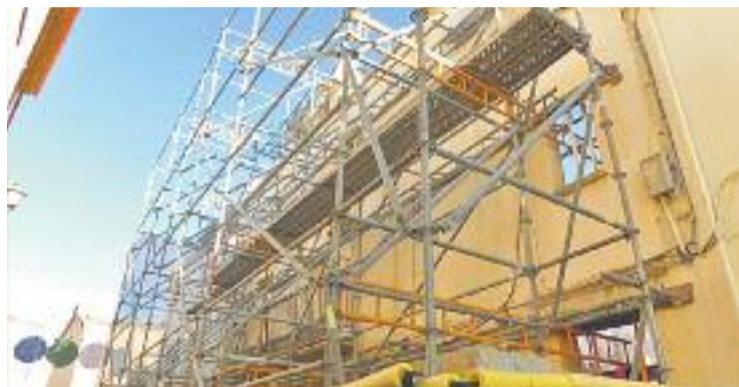
De l'Ajuntament vell només en quedarà la façana.

El nou edifici serà d'estructura metàl·lica, amb espais més amplis i lluminosos i accessibles per a persones amb mobilitat reduïda amb ascensor a les tres plantes de l'edifici. També disposarà de noves instal·lacions de climatització, electricitat, il·luminació i ventilació. L'edifici