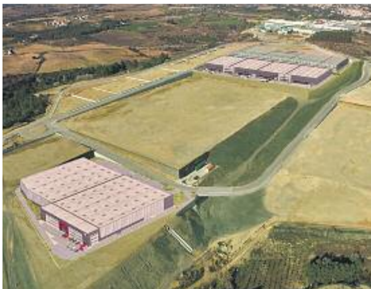
El desenvolupament de Can Margarit es destinarà a pagar deute.

Els comptes del 2018 mantenen com a prioritat l'assignació d'aportacions significatives a partides socials. Així, es destinen 200.000 euros a dependència, 98.000 per llar d'infants, o 85.000 en ajuts socials i emer-