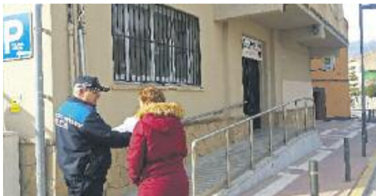
La nova unitat té l'objectiu d'apropar-se als ciutadans.

L'Ajuntament considera que d'aquesta manera, la nova unitat de la Policia Local podrà donar una resposta de qualitat, efectiva i sobretot preventiva, que permetrà actuar davant els problemes abans que aquests es produeixin. La nova unitat patrollarà a peu per tal que el contacte amb els ciutadans i ciu-