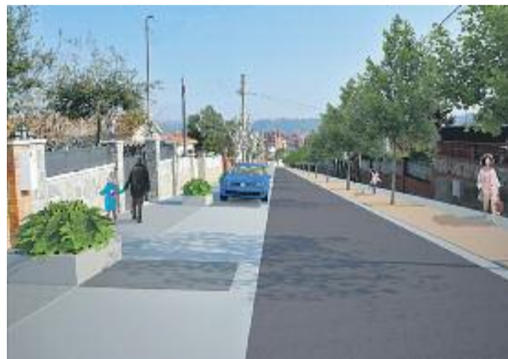
A molts carrers no hi caben voreres amples i aparcament.

L'alcalde Enric Llorca ha explicat en un comunicat que durant aquest mandat es remodelaran tots els carrers del barri de la Colònia per fases, ja que s'ha de mantenir la circulació de vehicles.