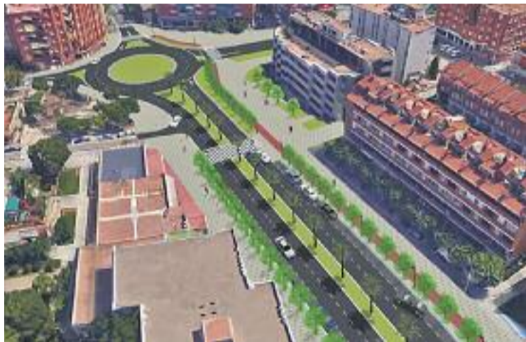
El consistori vol que els veïns siguin els protagonistes de l'espai.