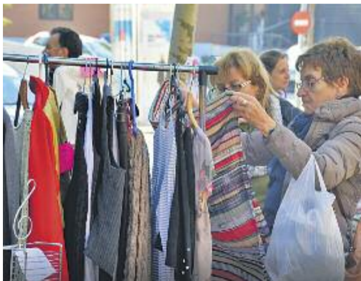
El Mercat d'Intercanvi de Martorell.

guany va ser la celebració del mercat en dissabte, i no en diumenge, com s'havia fet fins aleshores.