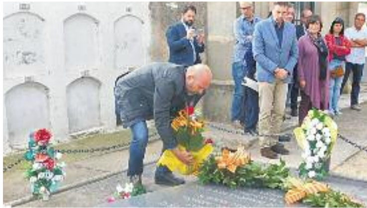
Representants polítics i familiars van homenatjar les víctimes.