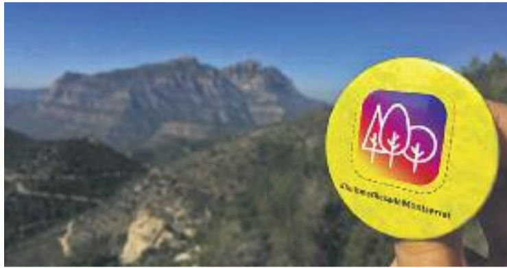
Olesa es vol perfilar com a destí turístic de la comarca.

El Pla d'Acció destaca el potencial turístic natural i actiu d'Olesa, així com el seu patrimoni immaterial amb festes, rutes i representacions amb l'objectiu de revifar la cultura popular i més tradicional del municipi. Segons l'esborrany de l'estudi, altres aspectes a treballar i que actualment estan en creixement són el turisme agrogastronòmic i rural, o el turisme