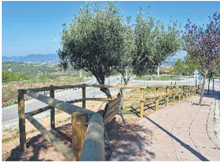
S'ha instal·lat una tanca i un banc per millorar la zona.

Una que ja s'ha enllestit és l'entrada a Castellví per l'avinguda Mare de Déu de Montserrat, que ha estat objecte d'un necessari rentat de cara. Concretament s'hi ha instal·lat una tanca de fusta tractada que protegeix la vorera del carrer amb el talús que dona a la carretera C-243b. En un tram d'aquest recorregut, entre oliveres i mirant cap a la muntanya de Montserrat, s'hi ha instal·lat un banc per seure, tal com es va fer ara fa un temps a l'entorn de la creu de terme, situada uns metres més amunt. L'Ajuntament ha explicat que també té la vista fixada en la rotonda d'accés al nucli antic de Castellví, ja que no té cap tipus d'arranjament ni d'element iden-