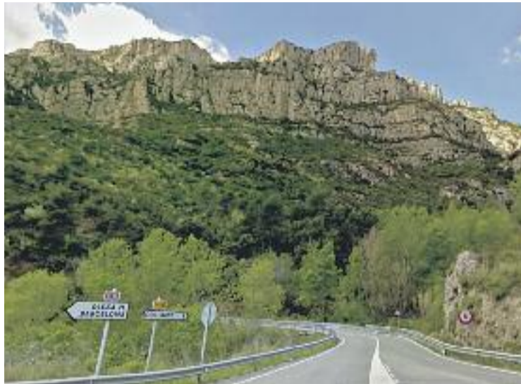
L'enllaç amb la B-112 serà un dels punts que es millorarà.

MOBILITAT ▶ La Generalitat ha adjudicat per 4,7 milions d'euros les obres de millora a la C-55 i a la C-58, entre els termes municipals de Collbató i Castellbell i el Vilar (Bages). Els treballs, que abasten un total de 8,5 quilòmetres, ja estan en marxa i tenen un termini d'execució de nou mesos. En concret, pel que fa al tram de la C-55 que passa per Collbató, es preveu la remodelació de la intersecció existent entre la C-55 i la B-112, on també se situa l'accés cap al pont que comunica amb l'Aeri de Montserrat.