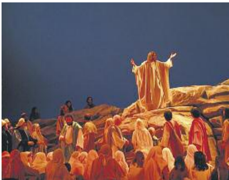
L'emblematíc teatre no passa pels millors moments financers.