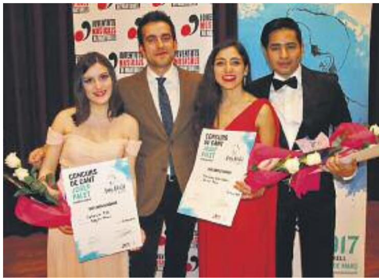
Els guanyadors de l'edició inaugural.