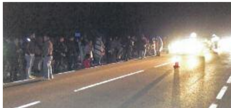
Evacuació dels viatgers enmig de la carretera.

MOBILITAT ▶ L'enèsima incidència en el servei de Rodalies es va cobrar desenes d'afectats la nit del 17 de novembre, quan un comboi es va avariar entre les estacions de Martorell i Gelida. El tren de la línia R4 amb destinació Sant Vicenç de Calders va quedar aturat a causa d'una avaria elèctrica a la catenària, i els passatgers van estar més d'una hora tancats i mitja hora a les fosques. Els Bombers de la Generalitat, els Mossos d'Esquadra i el personal de seguretat de Renfe van haver d'auxiliar els