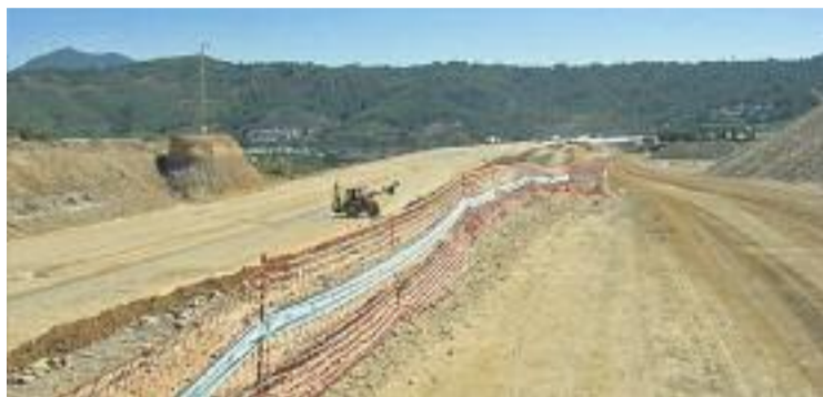
Finalment s'aposta per ampliar l'A-2 entre Martorell i Abrera.

Davant les reiterades protestes dels ajuntaments de la zona, en especial el d'Olesa, finalment la Generalitat va incloure a l'estudi de mobilitat una alternativa menys agressiva pel territori. Aquesta proposta no contempla crear un nou viaduc-