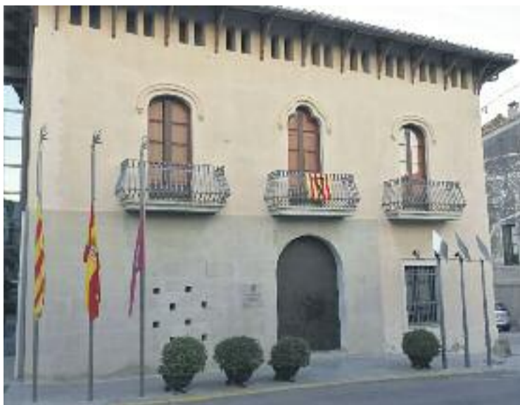
Les finances estaran sota tutela fins al 2027.

El Pla d'Ajustament aprovat pel Ministeri contempla la sortida del Fons de Finançament de Pagament a Proveïdors i reduir els interessos del 5 fins a l'1%. D'aquesta manera, s'obté un estalvi per a les finances municipals de fins a 350.000 euros i l'ingrés, en la