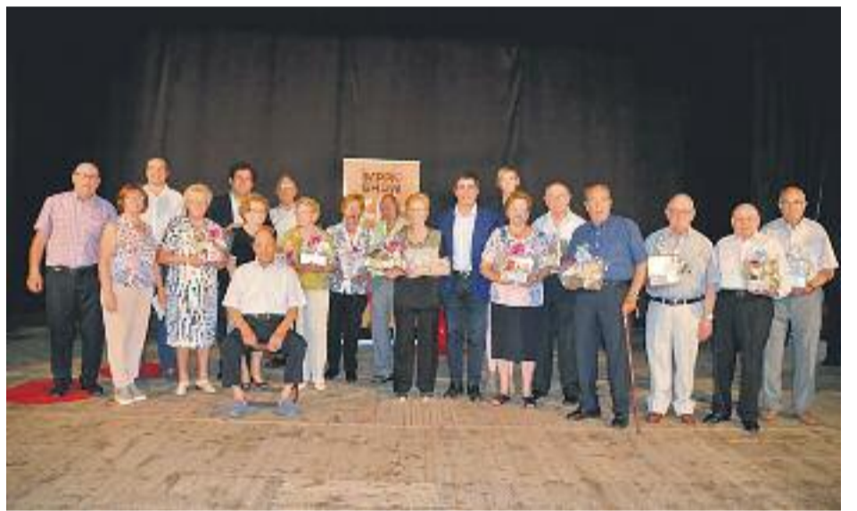
Moments del 31è aniversari dels esplais de gent gran celebrat a La Vila i cloenda de la Setmana de la Gent Gran (dreta, a sota).

SALUT ▶ Mantenir-se actiu, tant físicament com mental, aconseguir alenar o atenuar els efectes de l'edat, i repercuteix favorablement en les persones i en la societat. Sota aquesta premissa, els esplais de gent gran de Martorell brinden una àmplia oferta de tallers, accions de voluntariat, xerrades i excursions per a aquest curs 2017-18. De fet, i com a novetat, incorporen activitats intergeneracionals als centres escolars.