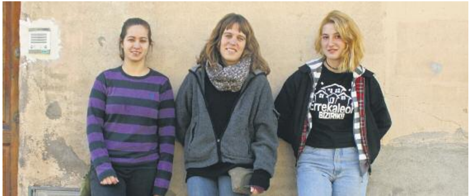
Tres noies comparteixen vivències i reflexions sobre la violència masclista amb aquesta publicació.

Les tres asseguren que els seus punts de vista han canviat des que participen en el grup de dones i Panyella explica que ha començat a veure el feminisme com "una vacuna". "De vegades et permet de