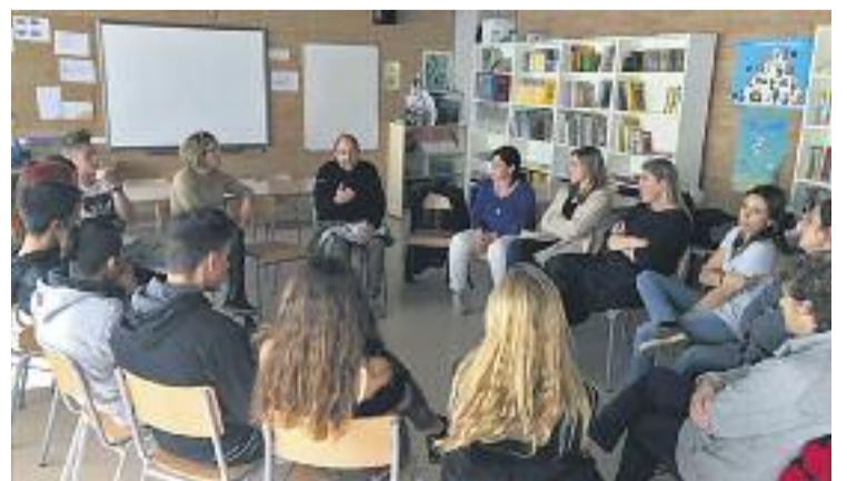
El projecte 'Vincles' va néixer el curs 2009-2010.

contribució de l'èxit acadèmic que els permeti l'acreditació i obtenció del graduat escolar, i així pretén facilitar-los la integració escolar, social i laboral. Els alumnes realitzen un pla de treball fora del centre educatiu, en un dels centres col·laboradors que tenen assignat i sota la supervisió d'un tutor. En aquesta edició, els centres col·laboradors són la Llar d'Infants Municipal La Ginesta, el Complex Esportiu, RTV10, i les escoles La Roureda i Vinya del Sastret.