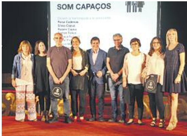
L'entitat farà la presentació oficial el pròxim 25 de gener.

Segons ha explicat l'Ajuntament a través d'un comunicat, l'entitat neix "de la demanda de moltes famílies a Martorell que