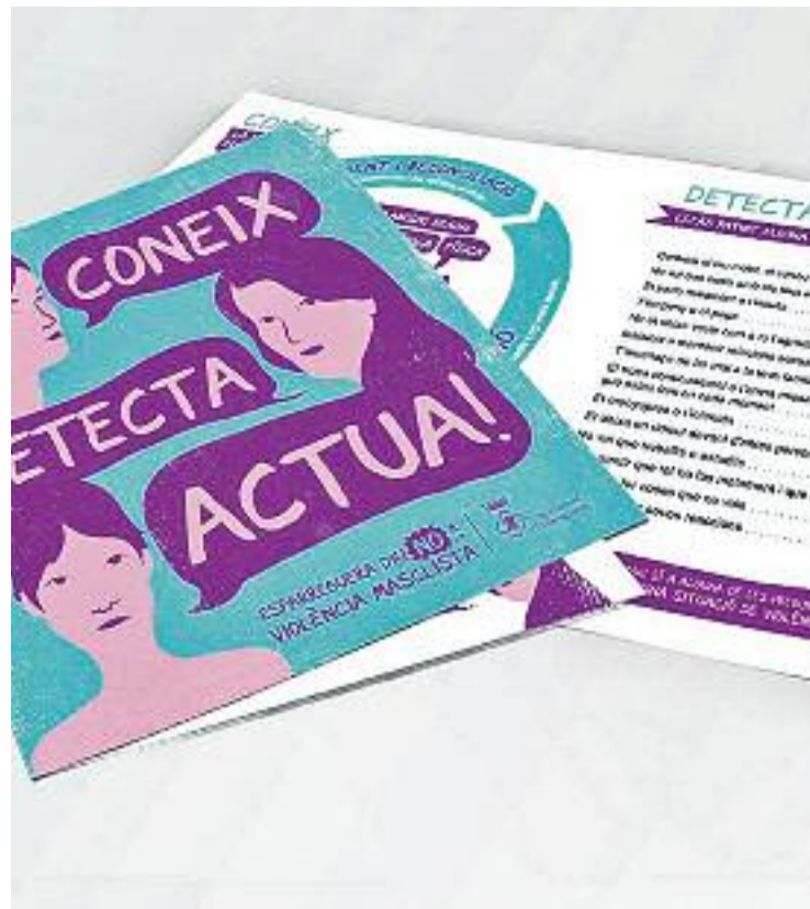
Els actes reivindicatius i les campanyes de sensibilització han tornat a centrar el 25 de novembre.