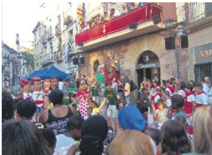
Presentació de dos capgrossos l'any passat.

Just després del pregó, la colla de Diables i el Drac, la colla de Geganters, l'Esbart Dansaire i els Capgrossos s'apoderaran de la plaça, i faran planter amb la Festa Major Petita, on els més menuts recorreran la plaça de la Vila, el carrer de Santacana i la plaça de l'Església, realitzant una cercavila de cultura popular que s'espera que els engresqui a col·laborar amb aquestes entitats. A la nit, els joves i més grans prendran el relleu a la Cercanit, un correbars amb el Diable, la Vellea i els Capgrossos, que ballaran al ritme de Ze-Brass Marxing Band pels carrers de la vila. A la plaça del Portal d'Anoia, els diables i el grup de