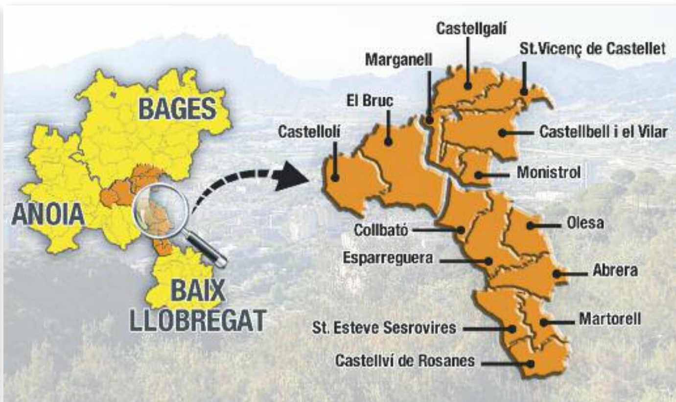
Eduard Pujol llegeix el manifest (esquerra) de la plataforma que aposta per la creació de la comarca del Montserratí (dreta). Infografia: Línia