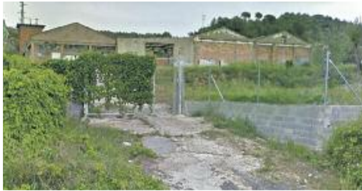
Aquesta nau del sector de les Rubiroles és l'objecte de la polèmica.

POLÈMICA ▶ "Així va el país! A Olesa l'Ajuntament dona permís per construir una mesquita (...) i no per ampliar a una residència d'avis (...) A on anirem a parar! Passa-ho perquè aquest missatge arribi a algú que pugui parar aquesta injustícia!". Aquest missatge ha estat corrent pels telèfons mòbils dels veïns d'Olesa, i s'ha generat tota una polèmica que ha obligat l'equip de govern a sortir a donar explicacions. El fet és que la residència Sant Agustí fa anys que està intentant ampliar la seva planta baixa per tal d'oferir nou places més de residència a persones grans, però els terrenys on està ubicada no admeten usos d'aquests tipus de caràcter permanent, i la Generalitat no els dona permís. En canvi, la comunitat islàmica d'Olesa ha sol·licitat instal·lar un centre de culte en una antiga nau industrial situada a la mateixa zona, i com que