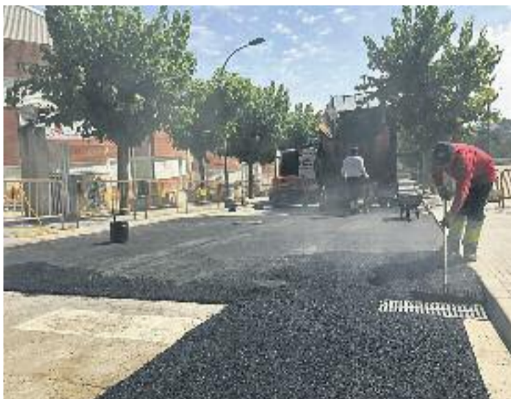
El carrer Marta Mata també ha estat objecte de reforma.

Un altre dels equipaments en el qual es realitzaran millores serà el Camp de Futbol Municipal, on es farà un manteniment de la gespa del terreny de joc.