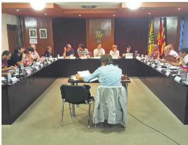
Les diverses visions del municipi es van fer paleses al Ple.