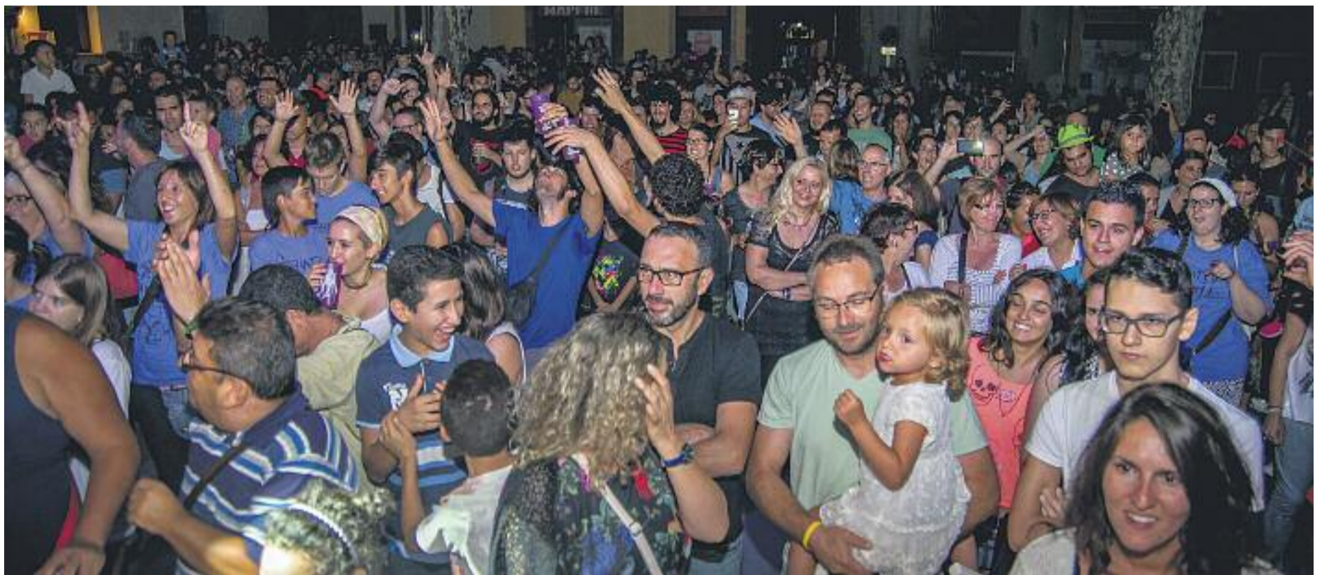
La ciutat ja compta els dies que falten per començar la Festa Major.