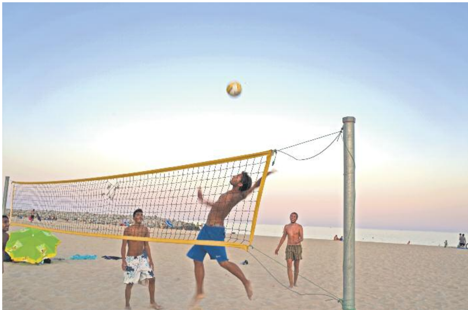
La Diputació dedica 830.000 euros a garantir la qualitat i la seguretat de les platges.

► La Diputació de Barcelona ha portat a terme l'innovador 'Estudi de reputació online de les platges de la demarcació de Barcelona 2016', el qual reflecteix, amb un índex de 8,47 sobre 10, l'elevada satisfacció respecte de "l'experiència platja". Això vol dir que els usuaris de la xarxa han posat un notable alt a les platges dels municipis del litoral barceloní, que com cada any reben el suport de la Diputació de Barcelona per garantir-ne la seguretat i la salubritat.