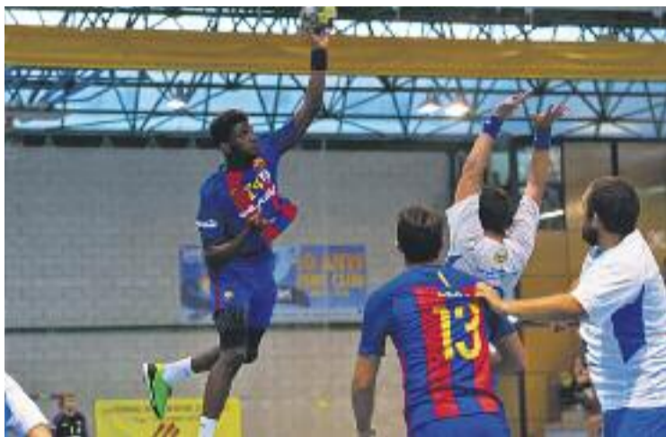
Un moment del partit de l'any passat.

CALENDARI DE LLIGA DEFINIT Aquesta nova participació en la Supercopa servirà per comprovar l'estat de forma de l'equip de cara a l'inici d'una nova tempo-