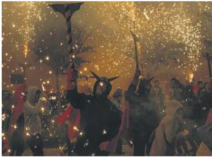
La tradicional lluita contra el Marmotot, acte central.

ments importants, gràcies a la tradicional Salnitrada i el castell de focs final. El 17 de setembre la lluita dels collbatonins contra el Marmotot es farà realitat de la mà dels Diables, que any rere any rememoren aquesta llegenda popular. De la programació de cultura tradicional també destaca la cercavila i la trobada