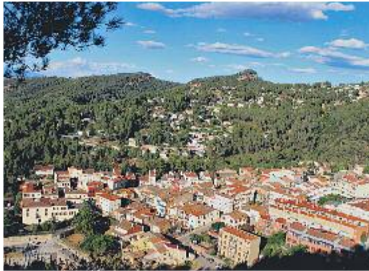
El poble comptarà amb un document únic d'emergències.

El document, que es redactarà durant els pròxims mesos, inclourà entre altres els plans relatius a incendis, inundacions, riscos derivats del transport –l'AP-7 passa per terme de Castellví–, risc químic, risc radiològic, nevades i terratrèmols.