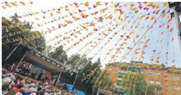
Sant Pere és el tret de sortida a les festes de barri.

Les tradicions catalanes també van tenir un paper molt rellevant durant la Festa Major. Els grallers de l'Agrupació Cultural i Folklorica d'Abbrera van fer la