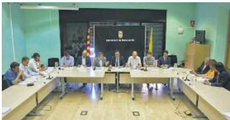
Molins de Rei ha estat la seu de la trobada.

INCOMPLIMENT ▶ La Generalitat i els ajuntaments del Baix Llobregat i el Vallès Occidental han fet pinya per reclamar al Ministeri de Foment que finalitzi les obres de connexió de l'autopista AP-7 i l'A-2, a l'altura del Papiol, les quals estan aturades. Les administracions han decidit crear una taula de treball conjunta, en la qual posaran en comú la informació disponible i faran pressió perquè el Ministeri es comprometi a acabar els treballs, adjudicats fa 10 anys.