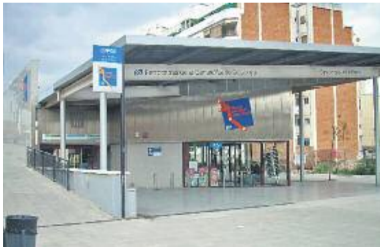
La T-10 es reduirà pràcticament un 50% a partir del gener.