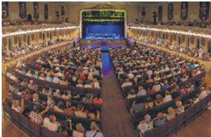
L'escenari del Pont estrenava il·luminació.