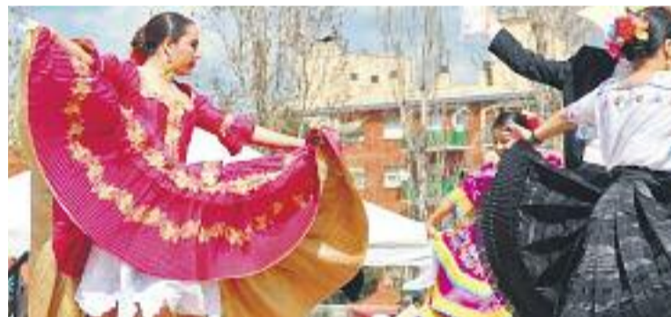
Un moment de la jornada de diversitat.

FESTA ▶ L'esplanada del mercat setmanal va acollir, el 19 de març passat, la primera jornada de la diversitat, fins ara coneguda com a mostra intercultural. La jornada va servir per als assistents poder conèixer la riquesa cultural i gastronòmica de les diferents nacionalitats que conviuen a la ciutat. Durant tot el matí es van poder degustar plats i gaudir de balls típics de diferents països a càrrec dels mateixos veïns.