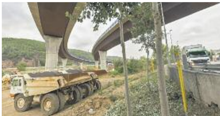
El pas que connectarà el Baix Nord amb el Vallès.

La nova connexió entre l'autovia del Baix Llobregat (A-2) i l'Autopista del Mediterrani (AP-7), de 2,4 km, permetrà estalviar 12 kilòmetres de recorregut pel viari del Baix Llobregat. Unirà l'A-2 i l'AP-7 a l'altura de Castellbisbal i el Papiol. També connectarà amb la C-1413a a través d'una rotonda a diferent nivell. Bona part del traçat estarà format per dos viaductes sobre el riu Llobregat.