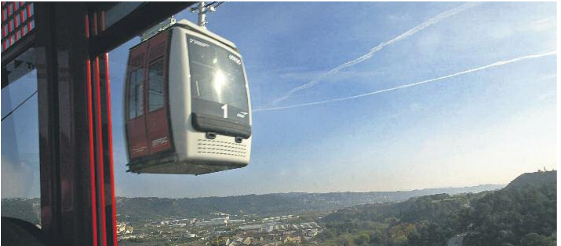
L'aeri que recorre el trajecte entre Olesa i Esparreguera no circula des de fa cinc anys.