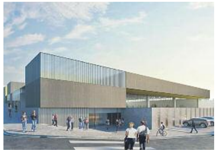
Imatge virtual de com serà la part exterior del pavelló.

Aquest nou equipament complementarà l'àrea esportiva més gran del municipi, a tocar del Complex Esportiu Torrent de Llops. Està previst que les obres comencin l'estiu vinent.