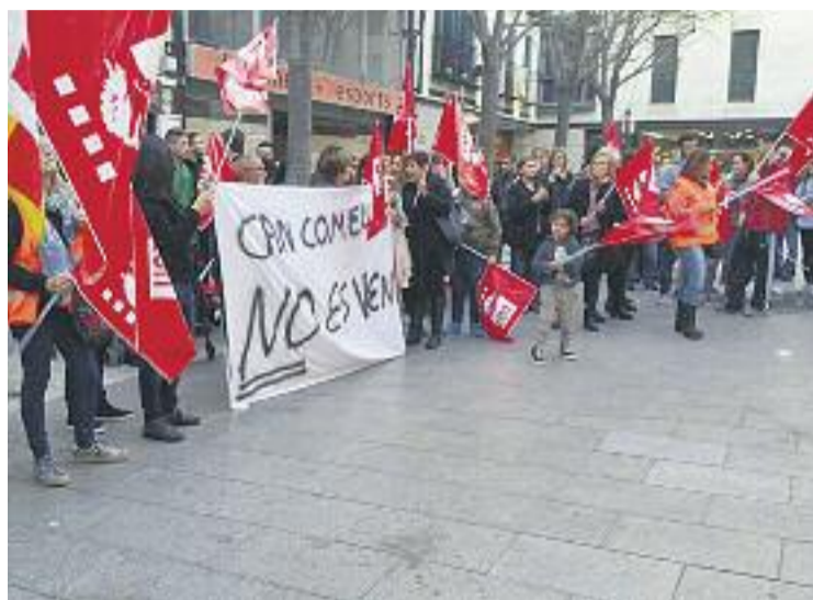
Manifestants davant de la plaça de l'Ajuntament.

MANIFESTACIÓ ▶ Prop d'un centenar de persones van manifestar, el 15 de març passat, davant de l'Ajuntament per demostrar el seu desacord amb la voluntat del govern municipal d'externalitzar la gestió de la Residència Can Comelles. La manifestació va ser convocada pel comitè unitari de treballadors de l'Ajuntament d'Esparreguera, integrat pels sindicats UGT, CCOO i SPPM-CAT. El govern municipal, però, garanteix que es mantindran els llocs de treball i les condicions laborals.