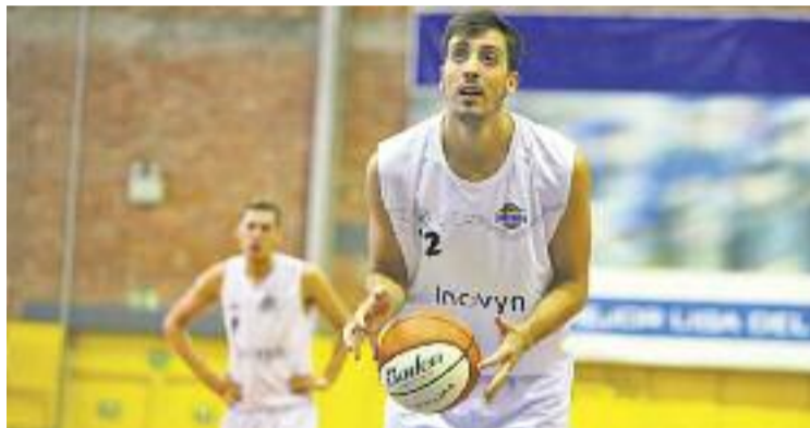
Els martorellencs signen la millor temporada de la història.