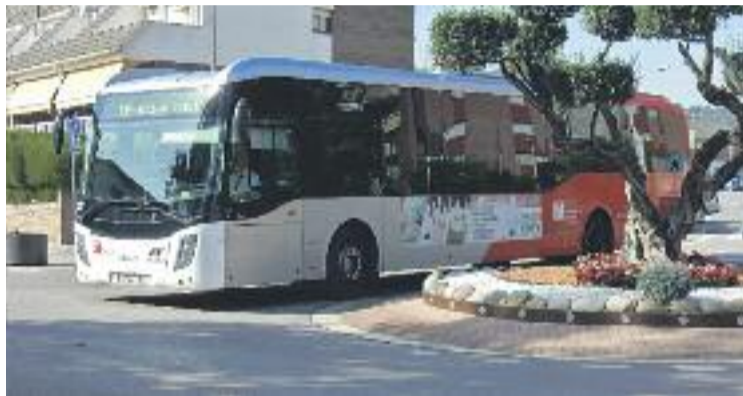
Un comboi del transport urbà a Sant Andreu.