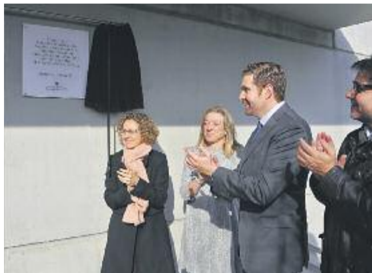
La consellera Ruiz durant la inauguració del centre.

El curs 2010-2011 va iniciar el seu funcionament la tercera escola del municipi, amb el nom provisional d'Escola Abbrera. Fins al curs 2015-2016, el centre va estar ubicat en un dels patis de l'Escola Ernest Lluch. I el curs 2016-2017 es va començar a l'edifici nou, inaugurat ara. El