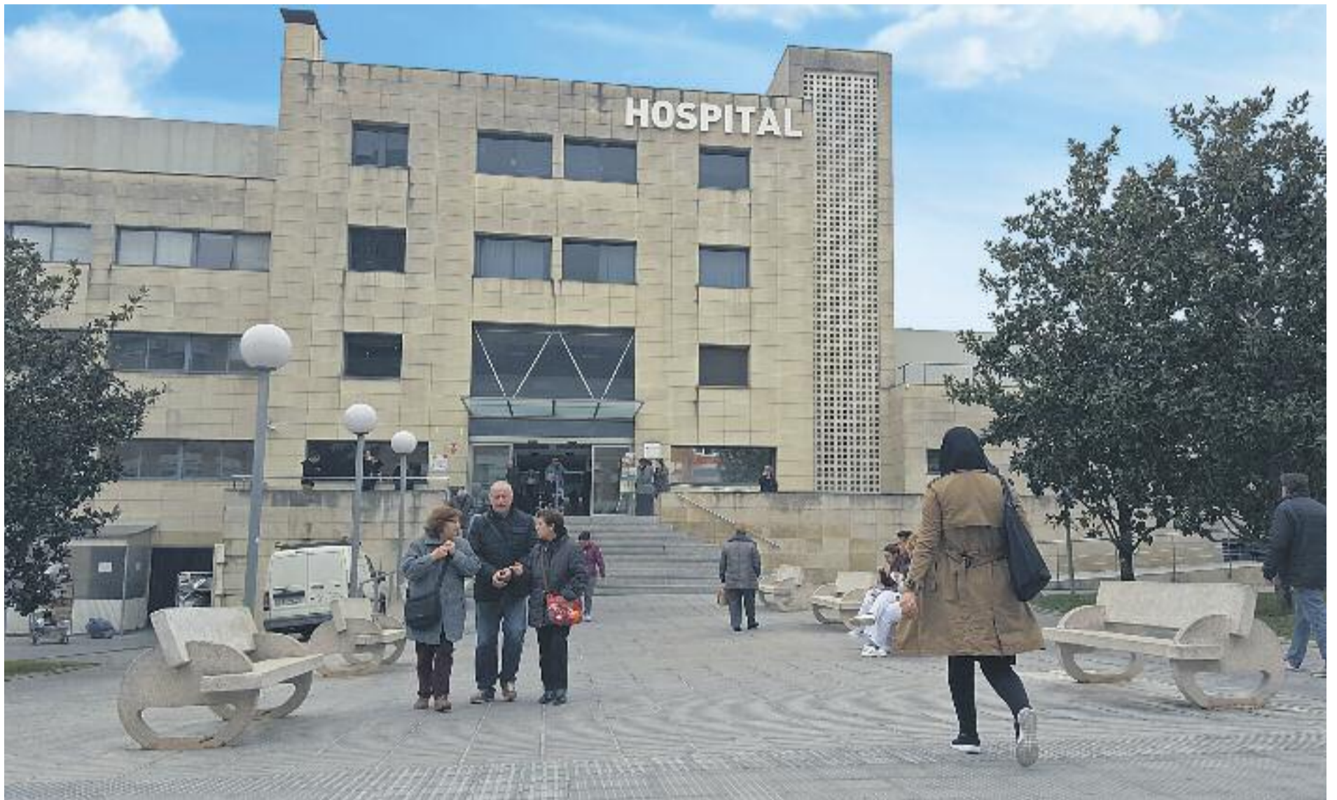
L'Hospital comarcal Sant Joan de Déu de Martorell és el centre triat per la majoria de residents a la zona nord del Baix Llobregat.

» Martorell demana una resposta immediata a les necessitats reals de l'Hospital comarcal » El consistori reclama la construcció d'un centre d'urgències d'atenció primària les 24 hores