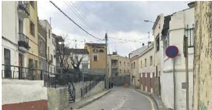
La riera de Can Carreras travessa el nucli antic d'Olesa.

Aquesta actuació suposarà millorar la comunicació del nucli antic amb el carrer d'Anselm Clavé i la consolidació d'un nou eix estructural urbà. A més,