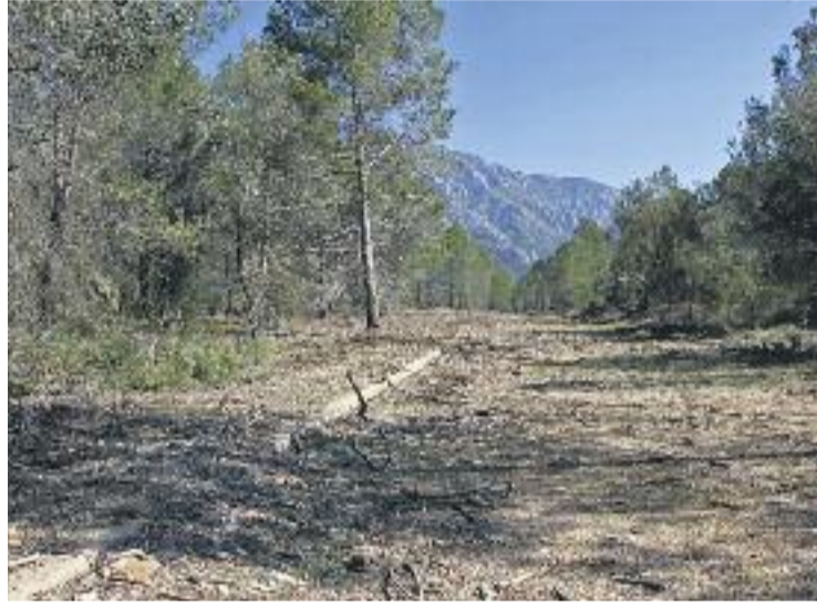
Terrenys on es projecta la construcció del càmping.

La proposta inicial dels promotors de l'anomenat 'eco-glàmping' –model de càmping que incorpora elements de glamur i sostenibilitat– constava de 30 hectàrees i 141 unitats d'acampada. Amb les modificacions fetes pels impulsors, la darrera proposta preveu 14 hectàrees amb 38 unitats d'acampada i la