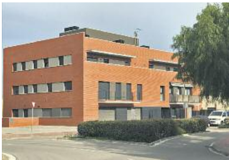
Habitatges del sector A Migdia de ca n'Amat.

Fa dos anys, el Ple va votar l'aprovació inicial de les bases per a l'adjudicació dels 43 pisos a uns preus notablement rebaixats respecte a la convocatòria del 2012. L'Ajuntament també ha demanat en reiterades ocasions a la SAREB, propietària dels immobles, que els pisos s'oferissin en lloguer per poder