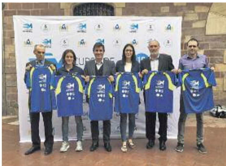
El cartell de la Cursa dels 5 i 10 quilòmetres.

El preu de la inscripció a les curses de 5 i 10 quilòmetres és de 8€ per als corredors amb xip groc i de 10€ per als que no en tenen, mentre que en la de 10 quilòmetres el preu és de 12€ amb xip i de 14€ per aquells que no en tinguin. En el cas de les curses de promoció, el preu és de 2€. Les inscripcions es podran fer a www.championchip.cat . La sortida i l'arribada de totes les curses serà al carrer Josep Vilar, da-