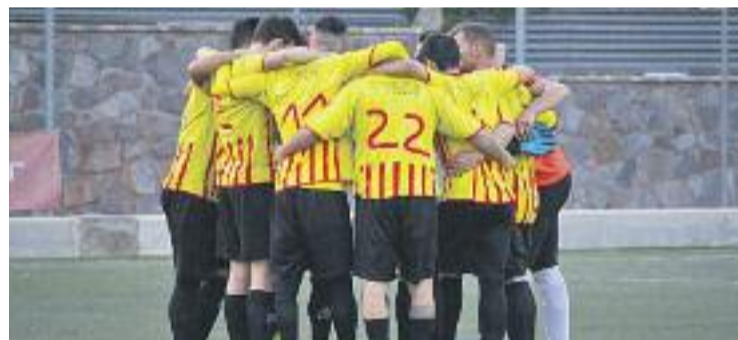
El Sant Esteve persegueix el liderat.

BAIX LLOBREGAT ▶ A falta de 8 jornades per acabar el campionat al grup vuitè de Tercera Catalana, dos equips de la comarca -Sant Andreu de la Barca i Sant Esteve Sesrovires- es troben frec a frec en la lluita per ascendir a Segona en un final de curs que es preveu apassionant.