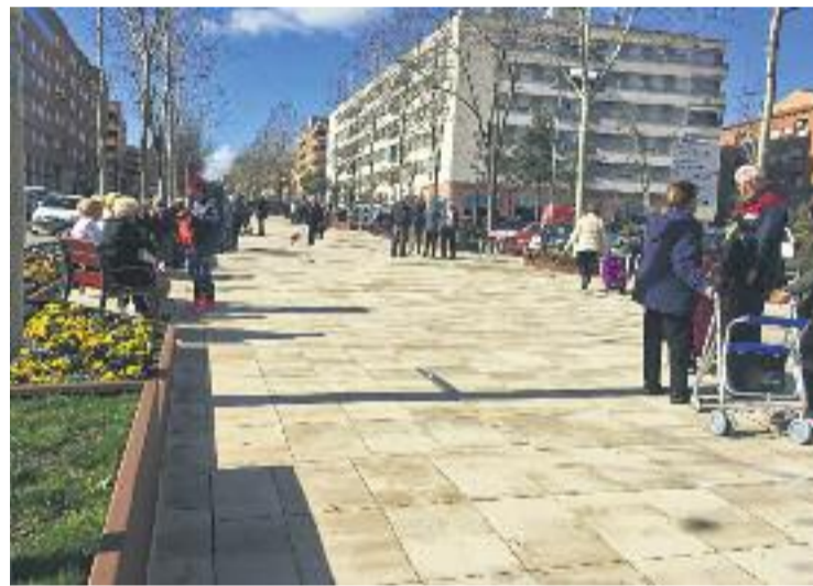
Nou aspecte de la rambla de les Bòbiles.

Els grups de l'oposició, tanmateix, critiquen les obres constants que pateix la rambla.