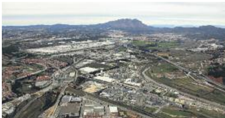
La ròtula Abrera-Martorell-Esparreguera.

INFRAESTRUCTURES ▶ D'ençà que la Generalitat de Catalunya va aprovar el Pla Territorial Metropolità (PTM), l'any 2010, i va iniciar la redacció del Pla Director Urbanístic Infraestructures (PDU), conegut més popularment com la ròtula Martorell-Abrera-Sant Esteve, han aparegut divergències entre els pobles que conformen la zona nord del Baix Llobregat. Mentre Martorell, Sant Esteve Sesrovires i Esparreguera ho veuen com una gran oportunitat, Olesa de Montserrat mostra més reticències i, en el cas d'Abrera, oposició.