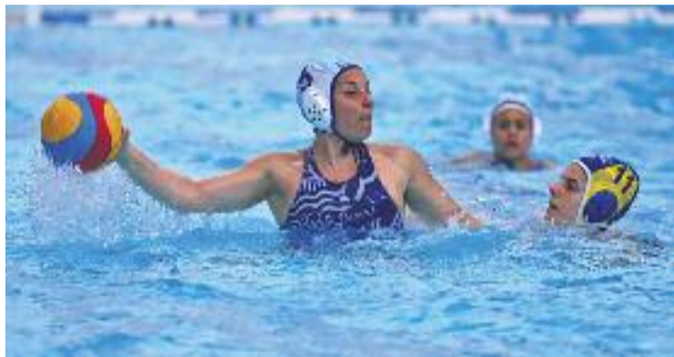
Les martorellenques persegueixen l'ascens.

WATERPOLO ▶ A finals del mes de maig, una fatídica tanda de penals a L'Hospitalet va impedir que l'equip absolut femení del Club Natació Martorell ascendís a la màxima categoria estatal. Aquelles llàgrimes van ser l'última decepció de les martorellenques que, en cinc mesos de competició, encara no coneixen la derrota a Primera Divisió. L'equip de Rafa López no ha canviat el xip i s'ha convertit, aquest curs, en el gran aspirant a l'ascens de categoria. Aquest any sí?