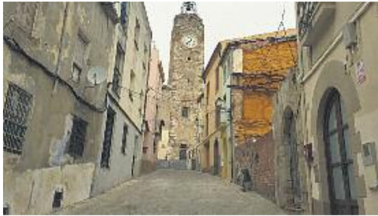
La Torre del Relotge és un element distintiu d'Olesa.