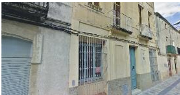
L'Escola de les Monges es convertirà en un hotel d'entitats.

L'Ajuntament pretén convertir l'Escola de les Monges en un hotel d'entitats, un viver d'empreses i, a més a més, aglu-