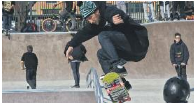
El nou skate park, estrenat el mes de febrer.