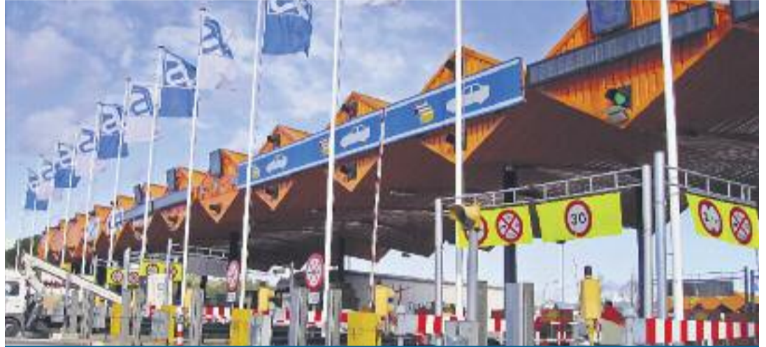
Peatge de Martorell

No tan sols això, sinó que el model mixt es va incrementar amb la concessió d'autopistes de titularitat regional al final dels anys 80 i principi dels 90 i amb concessions estatals noves al final dels anys 90 i principi del 2000. Les deficitàries autopistes radials de Madrid que l'estat espanyol rescatarà –amb un trànsit un 62% inferior a la mitjana de les 28 autopistes i túnels de peatge de l'Estat–, formen part d'aquest segon grup de concessions.