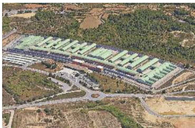
La presó de Sant Esteve de Sesrovires.

El segon pas serà traslladar els presos que quedin de Brians 1 a Brians 2 deixant buida la primera per acollir els interns de la Model. A partir del 20 d'abril, començarà l'èxode dels interns de la Model cap a Brians 1, que