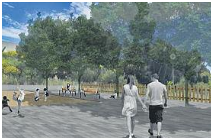
Així quedaria un dels espais.

Collbató, situat al peu de Montserrat, està dividit pel pas de l'autovia A2 i té una població de 4.389 habitants que es localitza en dos nuclis originaris i un seguit d'urbanitzacions de baixa densitat. El Pla proposa unes estratègies per cohesionar els diversos teixits del municipi com són la creació d'una xarxa de prioritat de vianants i bicicletes que connectin els nuclis i equipaments amb uns itineraris amables i adients que en fomentin el seu ús, i la distribució d'uns nodes d'espai públic pel territori urbà que assegurin