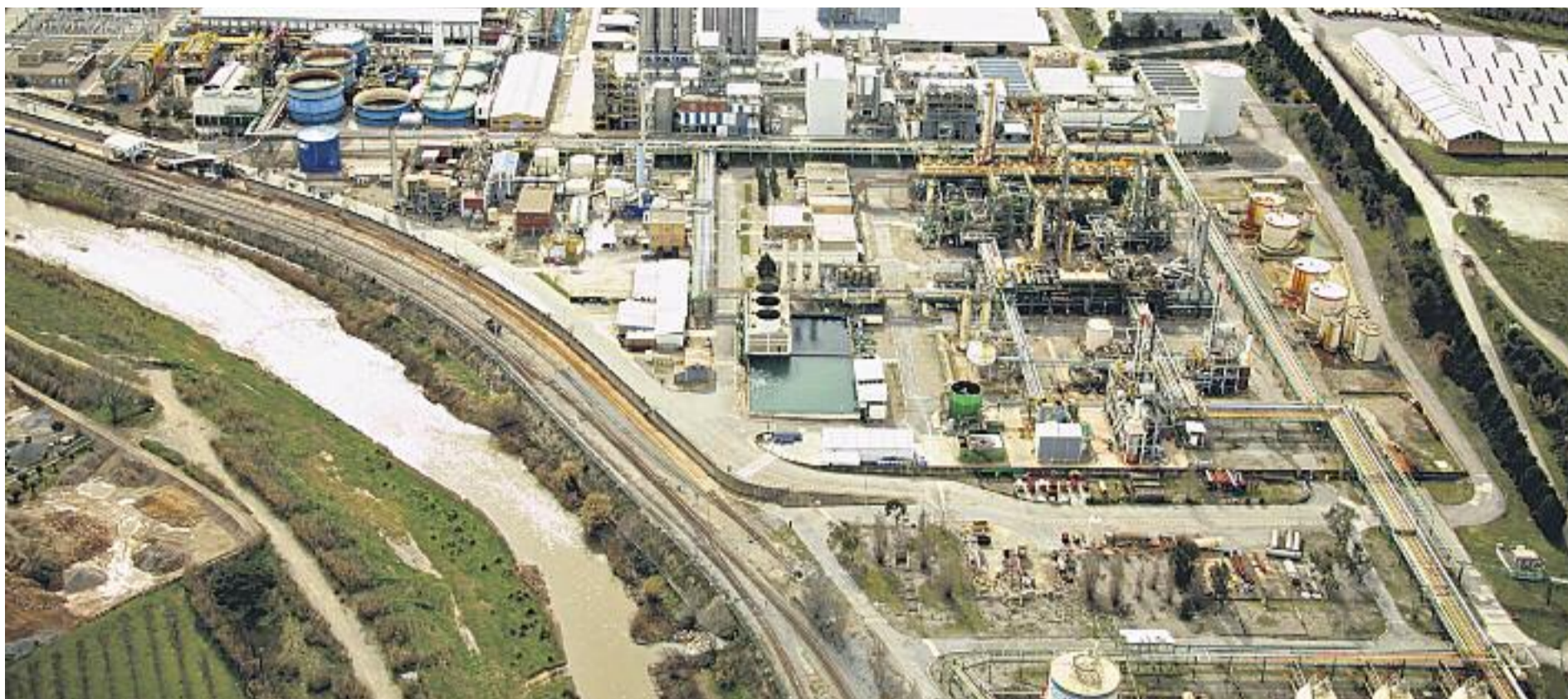
L'antiga empresa Solvay, ara Inovyn, és un dels motors econòmics de la zona nord del Baix Llobregat.