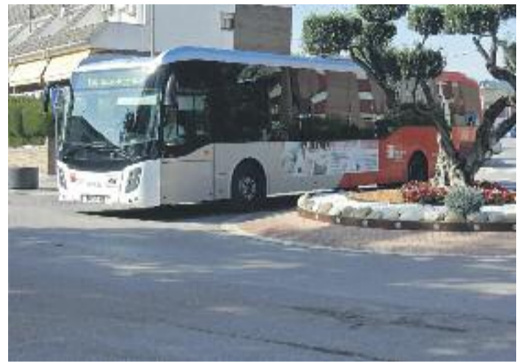
El bus urbà, en una avinguda principal a Sant Andreu.

El 2007, el Govern va incloure aquesta línia d'autobús en la redacció del pla de mobilitat i accessibilitat dels polígons industrials de les dues poblacions però que, arran de la crisi econòmica, no va arribar a executar-se.