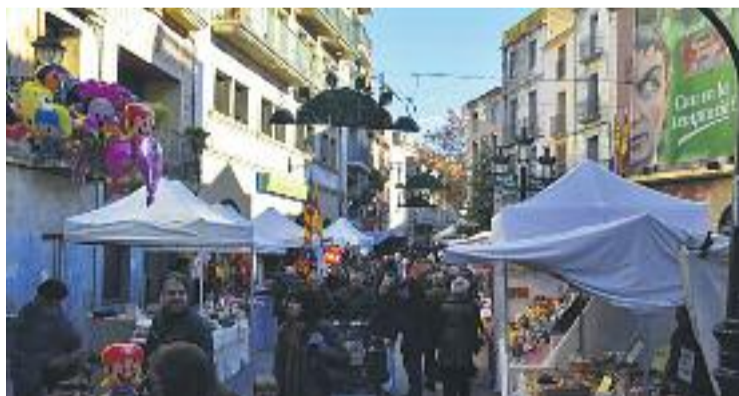
La comarca es prepara per celebrar Nadal.

Per altra banda, els comerciants locals estan repartint durant aquests dies entre els seus clients unes butlletes per participar en el sorteig d'una panera gegant, en la confecció de la qual hi han participat més de 50 establiments locals. Conté jo-