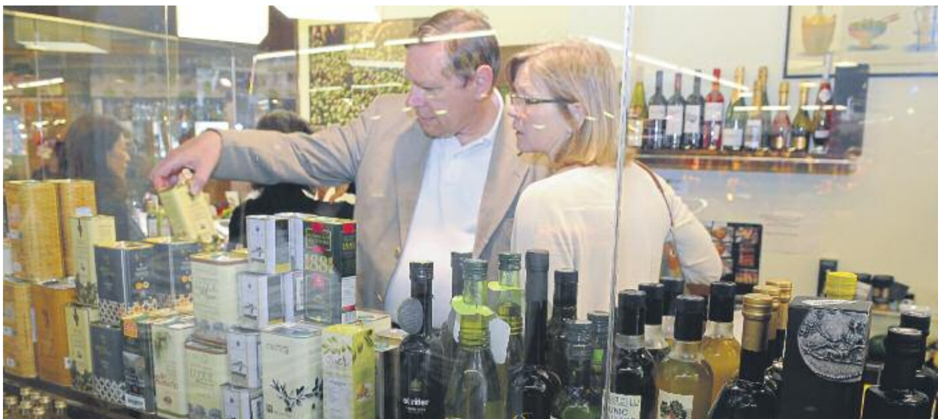
Els botiguers esperen que les vendes creixin aquest Nadal.