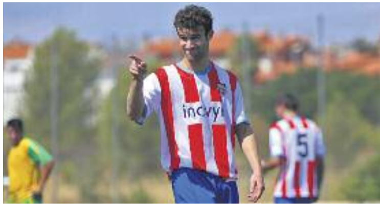
Els martorellencs han de trobar l'equilibri aquest curs.

Una de les claus per entendre la situació que viu el CF Martorell és el pobre balanç en els partits a casa. Del CE Torrent de Llops s'han esfumat 19 dels 24 punts possibles en joc que es tradueix amb cinc derrotes (Can Vidalet, Ciutat Cooperativa, Unificació Bellvitge, Atlètic Sant