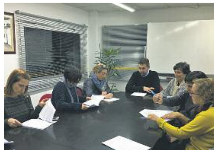
Signatura dels convenis amb les AMPA i les escoles.

Per als alumnes matriculats en escoles d'educació especial, l'ajut és del 50% del cost del material didàctic. Les persones que hagin comprat els llibres a través d'un comerç o per qualsevol altre mitjà, hauran de sol·licitar l'ajut a l'Oficina d'Atenció Ciutadana de l'Ajuntament fins al 31 de desembre. El consistori ho va confirmar amb un conveni amb els centres educatius i les AMPA.