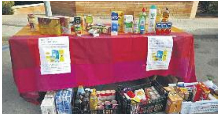
Sant Esteve s'ha implicat en la recollida d'aliments.

La campanya d'aquest any s'ha fet coincidint amb el Gran Recapte, que va tenir lloc a tot Catalunya els dies 25 i 26 de novembre. A Sant Esteve, el Banc d'Aliments va posar un parell de punts de recollida durant aquests dos dies, però la iniciativa s'ha allargat en el temps gràcies a que hi ha associacions que han col·laborat abans i després de la data del Gran Recapte.