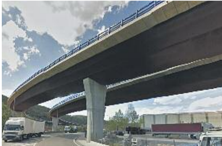
Les obres d'enllaç entre l'A2 i l'AP7 s'allarguen.