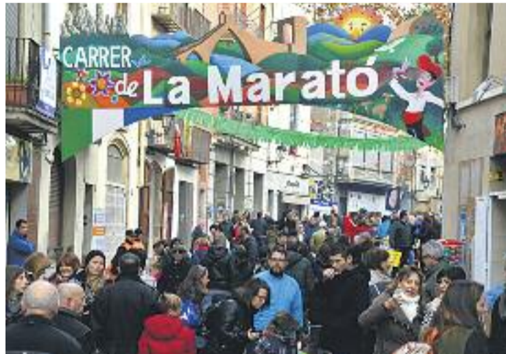
Els ciutadans es van bolcar amb La Marató de TV3.