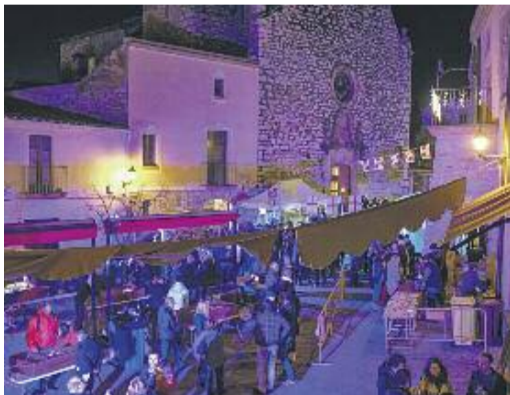
La plaça de l'Era va aplegar la Fira de Nadal.

Durant tot el dia, els més petits van poder visitar el corrallet de la fira, passejar amb ponis, ser un ceramista amb el taller "Enfanga't a la Fira". Un dels principals atractius per als infants va