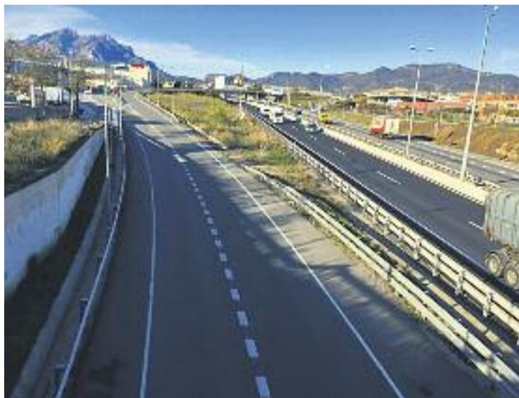
Obres al carril d'incorporació a l'A2.

L'accés al nucli urbà per part dels turismes i motocicletes, es pot realitzar per les sortides, sentit Lleida, número 585 (Ca n'Amat i polígons industrials d'Abdera), 582A (C55 direcció Manresa) i 582B (polígon industrial Sant Ermengol i el Rebató). Pel que fa a l'accés dels camions als polígons, només poden utilitzar les sortides, sentit Lleida, número 585 (Ca n'Amat i polígons industrials d'Abdera), i 582B (polígon industrial Sant Ermengol i el Rebató), també en sentit Lleida.