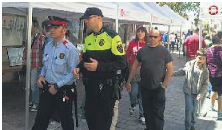
Policia local i Mossos es coordinen per vigilar els eixos comercials.