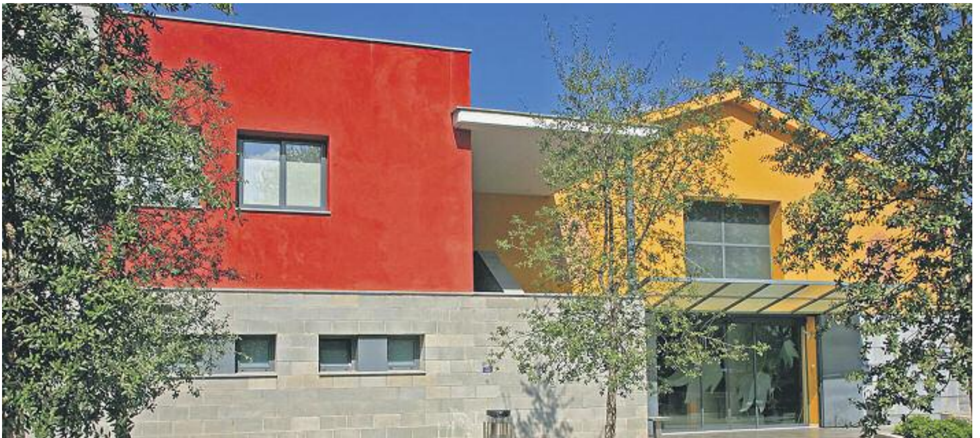
Pomfusa va establir el primer tanatori de la zona nord del Baix Llobregat a Martorell.