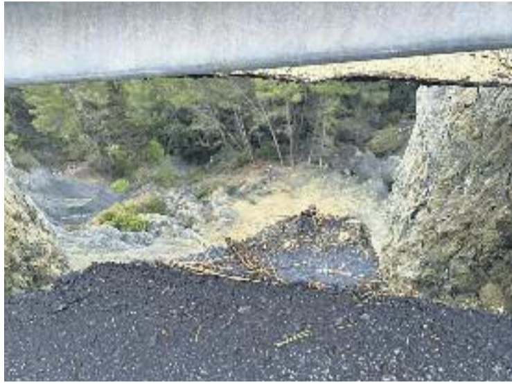
L'esvoranc, a la urbanització Ribes Blaves, des de 2015.

Actualment, la carretera a Ribes Blaves té l'accés restringit i aquesta situació crea incomoditats en el pas dels turismes dels veïns com també per als vehicles d'emergència que han d'acudir a fer serveis a la zona. Quan va aparèixer l'esvoranc, l'Ajuntament va buscar una solució que ja inicialment es veia costosa i que es dilatava en el temps, sobretot per la complexitat orogràfica de la zona. Per aquesta raó, el consistori olesà va recórrer a la Diputació per trobar una solució immediata. "És una prioritat per a Olesa que des de l'Ajuntament no es pot abordar de forma íntegra. Cal que la Diputació l'entengui, també, com a prioritària", apunta Puimedon. Fruit de la trobada, Conesa s'ha