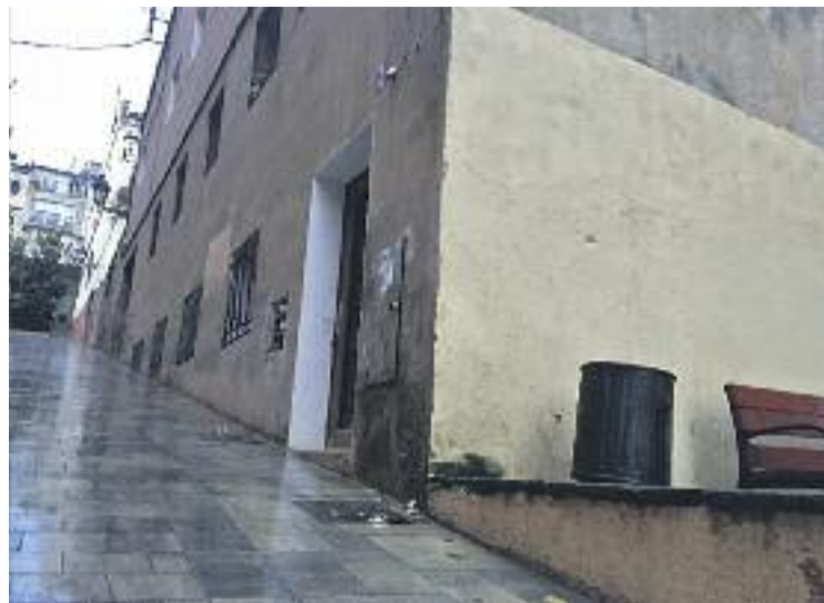
L'assassinat va ser en aquesta casa del carrer Cambreta.

Durant la convivència amb la mare, el jove l'havia sotmès a diferents atacs físics i psicològics. La mare havia denunciat alguns dels episodis violents i, com a conseqüència, el jove havia estat condemnat a penes lleus. Entre