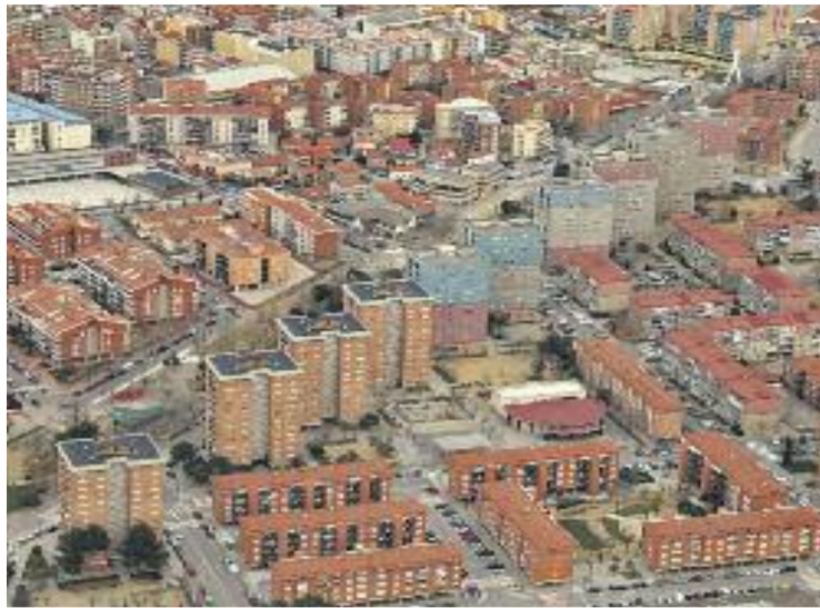
Buenos Aires és un dels barris més emblemàtics.