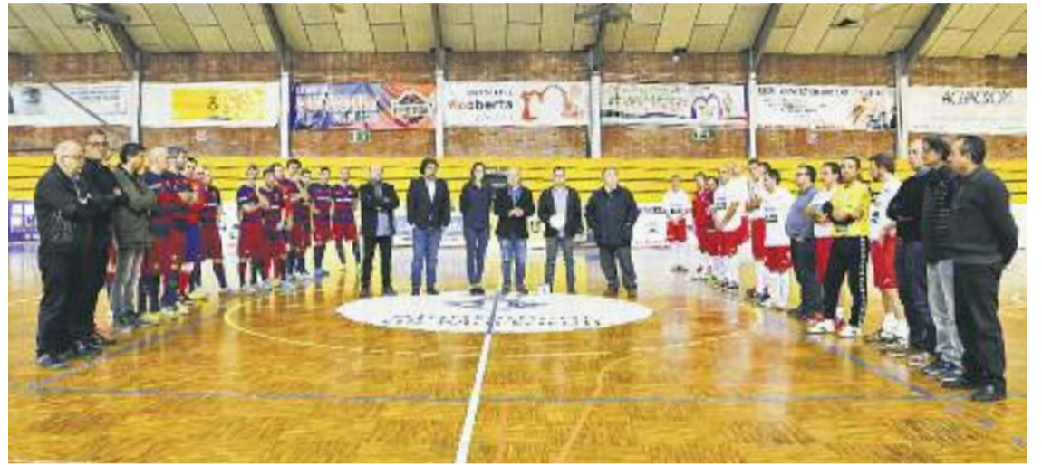
Els exjugadors del FS Martorell i del FC Barcelona, plegats, en un partit benèfic.