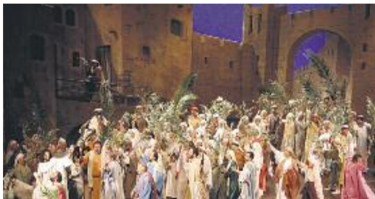
L'anunciació de Jesús, a Esparreguera.

El 12 de març s'obrirà el calendari de representacions de La Passió a Esparreguera. La Junta del Patronat de La Passió ha programat tres de les representacions en horari de tarda –una sessió de les 17 a les 22 hores– els dies 18 de març i el 8 i 22 d'abril. La resta de representacions de la temporada seran de jornada completa –la vida pública de Jesús en sessió de matí de 10.30h a 13h, i la Passió, mort i resurrecció a la tarda, de 15.30h a 18h–. Seran els dies 26 de març; 2, 14 (Divendres Sant) i 30 d'abril i 7 de maig, sent la darrera representació de la temporada. La d'Esparreguera és l'única Passió catalana que manté el format de jornada teatral amb tres entreactes.