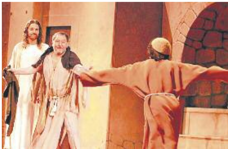
Escena del guariment d'un leproso.

Les novetats d'enguany són moltes. Una d'elles és la col·laboració de La Passió amb l'ONG Mans Unides sota el lema Passió Solidària . Amb aquest acord,