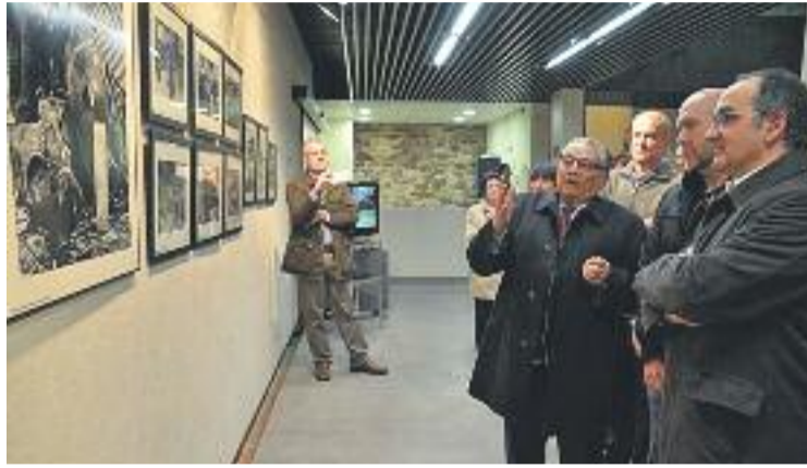
La mostra ha estat produïda pel fill i el nét de Centelles.