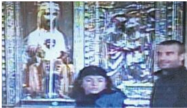
Captura del vídeo de la visita dels dos anarquistes a Montserrat.

El 2 d'octubre del 2013 un artefacte compost d'una bombona de butà, dos quilograms de pólvora i un rellotge activador va esclatar al temple saragossà, oca-