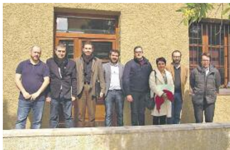
Els alcaldes de l'entorn de Montserrat durant la trobada.

Tots els alcaldes i alcaldesses van signar un manifest, amb el qual es reivindica la creació