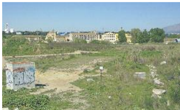
Zona de Can Bros, on es va fer la festa.

Els agents van col·locar un altre control a la sortida de Can Bros Vell, en direcció a Martorell