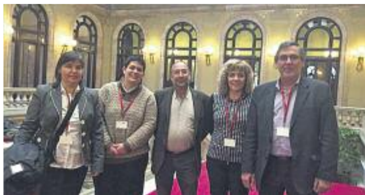
Delegació sesrovirena al Parlament.