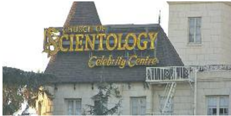
La cienciologia és una doctrina que va néixer als Estats Units.

La cienciologia és una creença religiosa que està reconeguda com a tal per l'Estat espanyol des de l'any 2007. Fins aleshores, feia vint anys operava com a associació cultural.