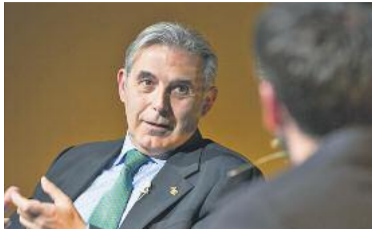
L'alcalde durant la conferència.

Durant la jornada Llorca va anunciar nous plans d'ocupació "per generar llocs de treball al municipi", amb els quals, segons va dir, "es podrà contractar un centenar de persones o bé continuar subvencionant la contractació de joves per part de les empreses". Una altra prioritat de l'alcalde és facilitar l'accés a l'habitatge i va remarcar que el consistori està treballant per crear un parc d'habitatges proce-