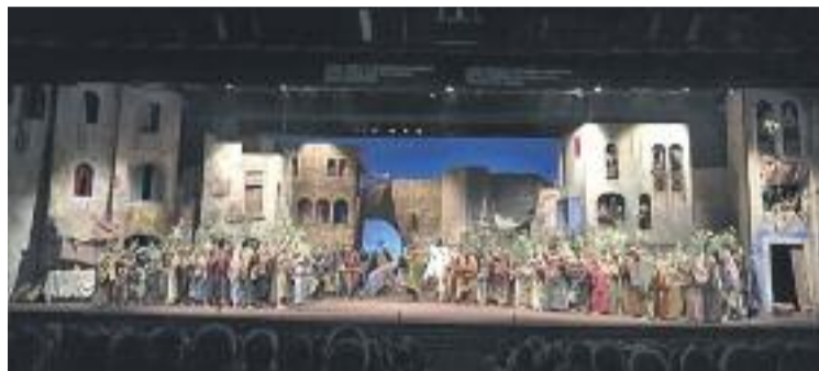
Escena de l'entrada a Jerusalem.