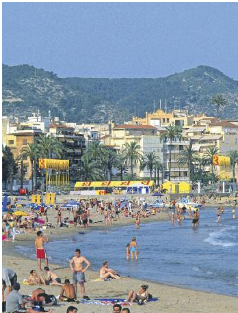
La demarcació de Barcelona continua sent la més exportadora (esquerra) al mateix temps que segueix atraient milions de turistes (dreta).