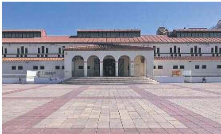
L'objectiu del consistori és impulsar el mercat municipal.

Les parades que s'han obert a noves concessions estan ara buides. Els nous paradistes que s'estableixin al mercat municipi-