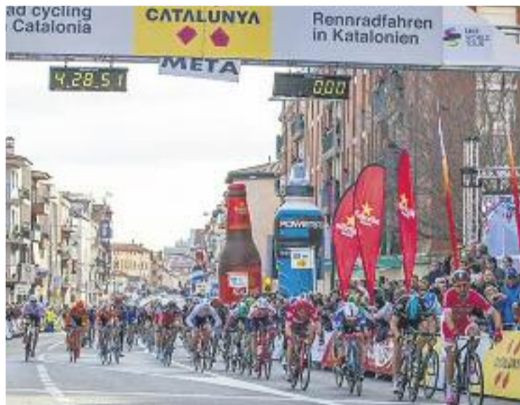
Una imatge de la primera etapa de la ronda.

Un cop superat aquest tram, els candidats a la victòria a la ge-