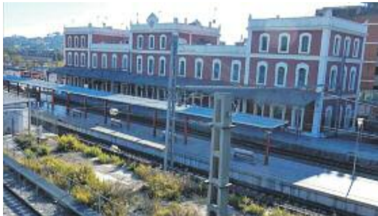
Tram no connectat entre la Renfe i els FGC.

L'intercanviador entre les dues xarxes està prevista des de fa uns anys, quan va entrar en funcionament l'estació de Martorell Central, entre les de la Vila i Enllaç, l'any 2007. Aquestes parades pertanyen als FGC i l'enllaç directe entre l'estació de Renfe i la dels FGC s'havia de fer a través de Foment. "En