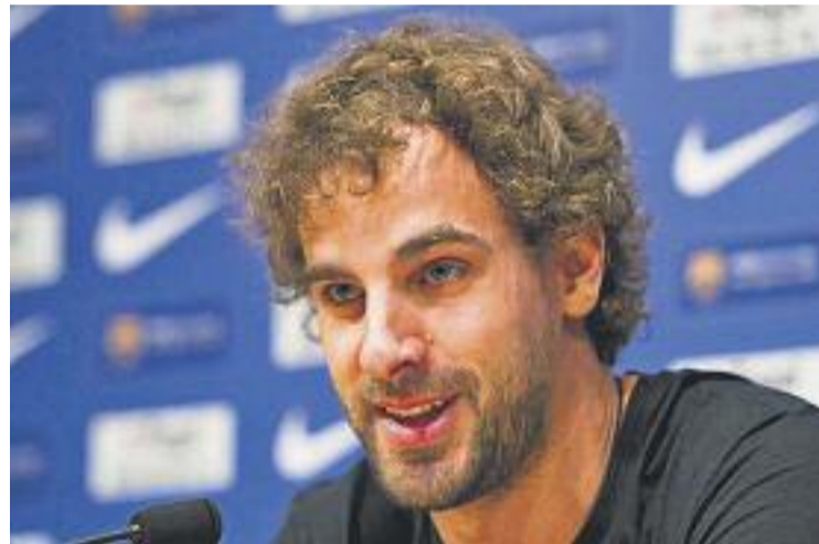
Grimau va anunciar la seva retirada el passat mes de juliol.

Grimau va aconsellar els joves esportistes que no s'obsessionin gaire en les debilitats del seu joc i que treballin per millorar individualment i col·lectiva-