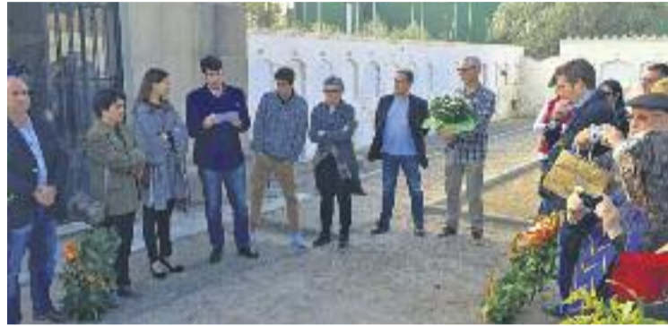
A l'acte hi van assistir els alcaldes d'Abrera i Olesa.

Representants dels ajuntaments dels dos municipis del Baix Llobregat Nord, partits polítics i ciutadans de les dues poblacions van prendre part en l'homenatge als represaliats pel franquisme al municipi un cop acabada la Guerra Civil, amb flors i parlaments en record de les víctimes. Els familiars d'aquestes, per la seva banda, van agrair la celebració de l'acte i van destacar el fet que, tot i haver passat més de 70 anys, molts ciutadans "encara es reuneixen per recordar-ho".