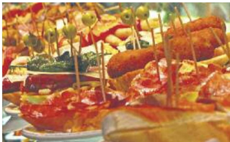
Els tasts s'oferiran per sectors alimentaris.

Els tasts es classificaran per àmbits alimentaris, tal com ha avançat Gomà. "Els tastos s'oferiran agrupats per sectors: xar-