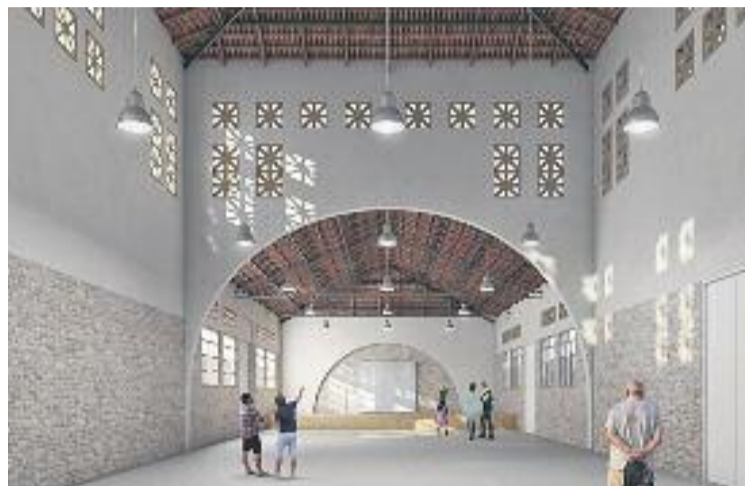
Imatge virtual de l'aparença del futur equipament.

Es tracta d'un projecte ideat pel Servei d'Equipaments, Infraestructures Urbanes i Patrimoni Arquitectònic de la Diputació. Ara, l'Ajuntament ja està duent a terme la primera fase, que consisteix a rehabilitar una superfície de 585,5 metres quadrats de superfície.