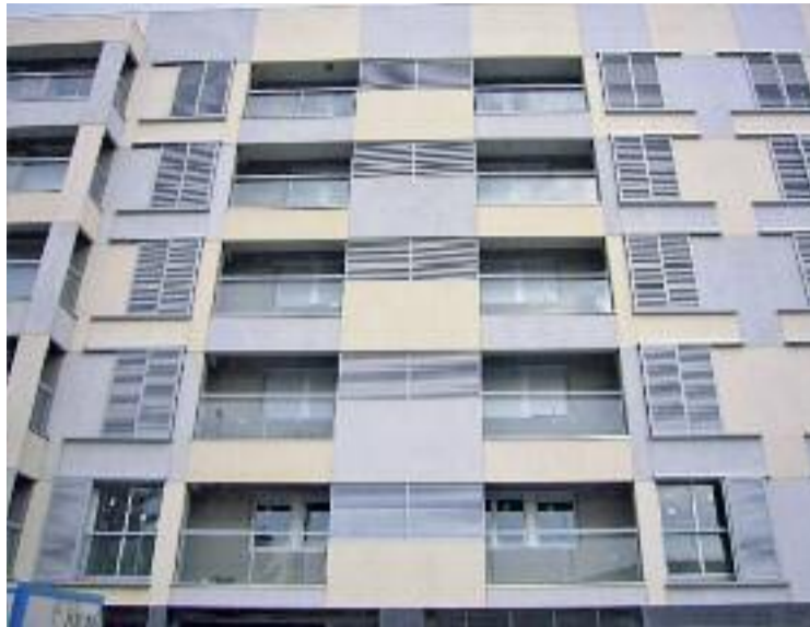
A Martorell hi ha 90 pisos buits.

A més de comptar amb l'assessorament de l'OLH sobre habitatge, l'Ajuntament va crear el desembre del 2014 el Servei d'Intermediació en Deutes de l'Habitatge (SIDH), que té com a destinataris les persones amb dificultats per pagar la hipoteca del seu domicili habitual i permanent.