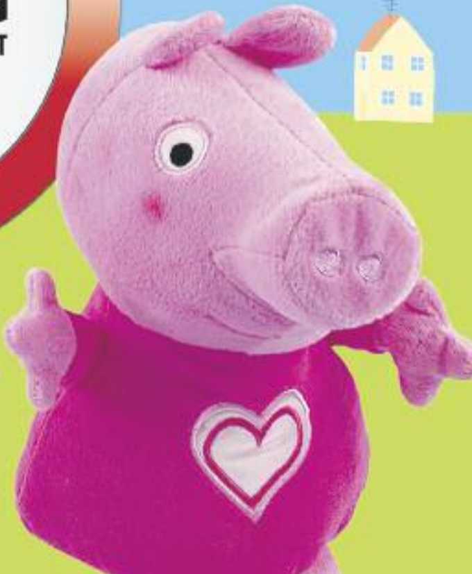
Peluixos assortits. Ref. 397000081. 3,35€/unitat