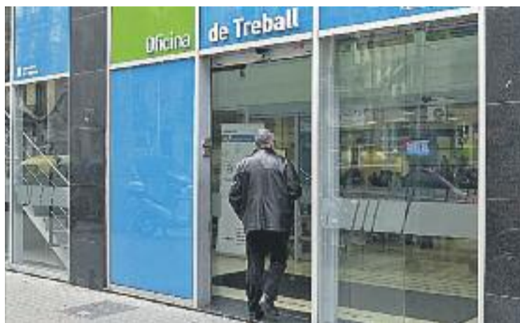
Al Baix Nord ha baixat l'atur en 21 persones.

Els municipis del Baix Nord on ha disminuït l'atur han estat Abrera, Esparreguera, Olesa i Sant Esteve. A Abrera hi ha 804 persones desocupades registrades a les oficines comarcals, set menys respecte del mes anterior.