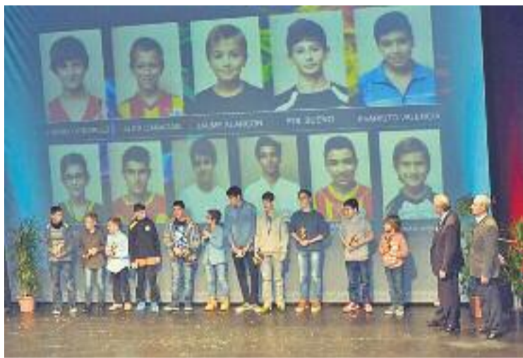
Sant Andreu premia cada any els seus millors esportistes.