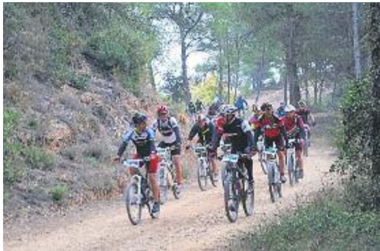
Una imatge de la cursa en BTT.