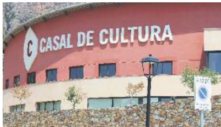
El Casal de Cultura va oferir una taula rodona i un refrigeri.

L'acte va estar organitzat pel mateix consistori collbatoní i va comptar, a més de les peces audiovisuals del mateix festival, amb la celebració d'una taula rodona en la qual va poder participar el públic assistent, i un petit refrigeri que es va oferir al final de l'esdeveniment. L'entrada era gratuïta i l'entrada, lliure per a tothom.