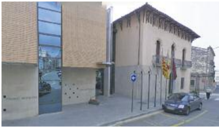
La proposta va quedar aprovada a l'últim Ple.

La proposta ha estat batejada com a Garantia +55 i té l'objectiu que es creï una prestació