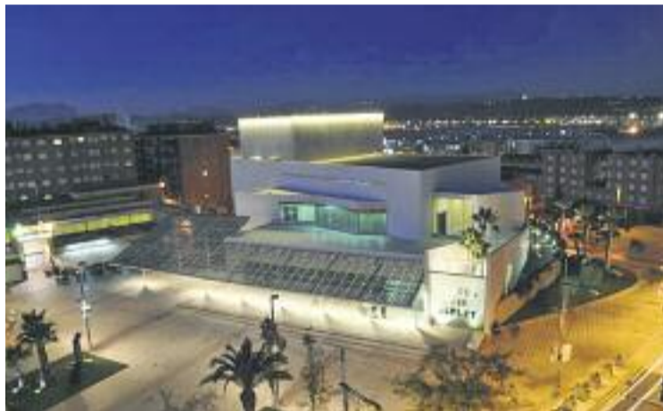
Edifici del Teatre Núria Espert.

Però a més d'acollir un ampli ventall d'obres de primera fila, el