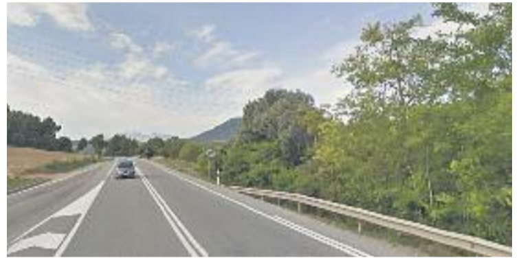
Tram de la C-55 entre Abrera i Manresa.

Una de les mesures previstes és construir una barrera especial en un tram de vuit quilòmetres. Tot i això, els manifestants ho consideren insuficient.