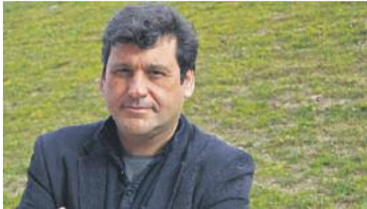
Adolf Bargués, cap de llista d'ERC.

Ara per ara, els republicans són la clau de la governabilitat a Martorell amb els seus 3 regidors, i tenen obertes totes les possibilitats de pactes. Avui a les set de la tarda la formació farà públic en una roda de premsa a l'Ajuntament si subscriuen un pacte d'esquerres amb el PSC –segona força més votada amb 4 regidors–, Movem Martorell –tercera força amb 4 regidors també– i Som Martorell –amb un regidor– o bé decideixen arribar a un acord perquè CiU segueixi al