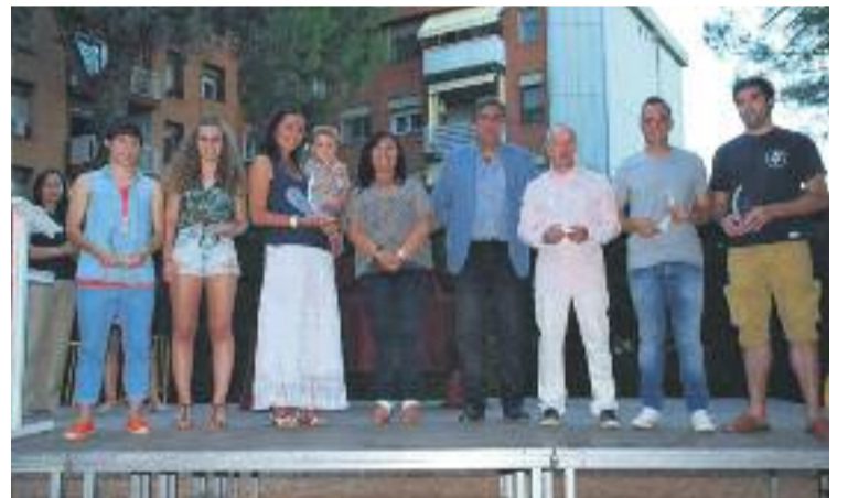
Alguns dels triomfadors de la nit.

SANT ESTEVE ▶ Els jardins de l'Ajuntament van lluir la seva millor imatge el passat divendres 5 de juny per convertir-se en l'escenari de l'entrega de premis de la vuitena Nit de l'Esport de la ciutat.