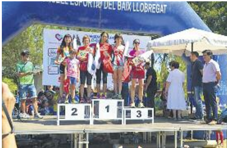
El podi de la cursa.

La diada va consistir en una doble prova, una cursa i dues marxes no competitives sota el lema Entre tots per la salut mental , i es va organitzar en col·laboració amb l'Hospital Neuropsiquiàtric Sagrat Cor, gestionat per les Germanes Hos-