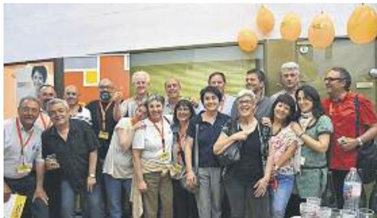
El BO va agrair els suports amb un comunicat.

En un comunicat emès poc després de conèixer-se els resultats, el BO va agrair el suport dels electors, "tant a través dels vots emesos com per l'escalf que ens heu donat quan hem sortit al carrer per donar-nos a conèixer". La formació va detallar que de