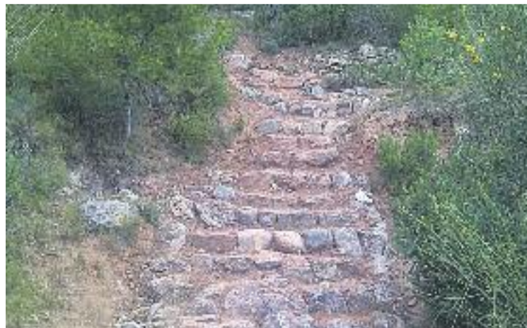
Aspecte de com ha quedat el camí.

L'actuació es fa perquè les escales d'accés a les coves estaven molt deteriorades. Segons ha explicat el consistori, el camí tenia esglaons i plataformes que salvaven el desnivell d'una manera abrupta, fet que dificultava l'accessibilitat a aquesta emblemàtica zona natural.