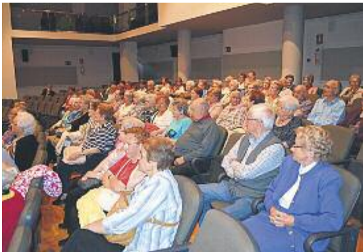
Inauguració de la Setmana de la Gent Gran.