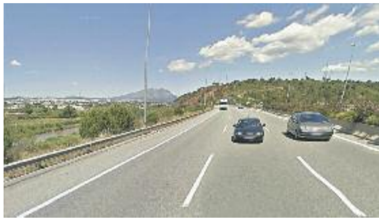
El Pla afecta part de l'A-2.

Es tracta d'un projecte estratègic per a la zona, que compta amb una posició territorial privilegiada per la seva proximitat amb l'àrea metropolitana i la seva connectivitat –on es preveu també executar l'enllaç amb el Corredor Mediterrani en un futur–. A més, el pla contempla ser un impuls a l'activitat econòmi-