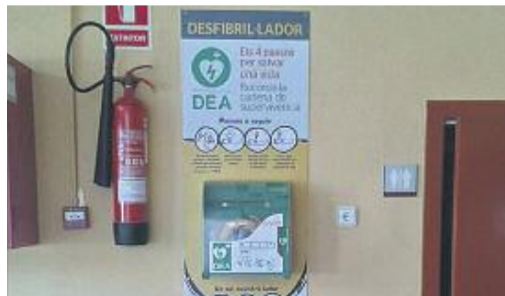
Un dels desfibril·ladors instal·lats a Abrera.

El desfibril·lador detecta quin estat té el cor de la persona afectada i programa les descàrregues de manera automàtica. A més, pot ser utilitzada en infants i té una bateria que dura quatre anys.