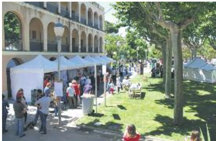
A la mostra hi van participar més de setanta paradistes.

L'objectiu de la jornada era donar a conèixer l'activitat que duen a terme les entitats del municipi, amb la idea de ser un aparador que mostri la riquesa