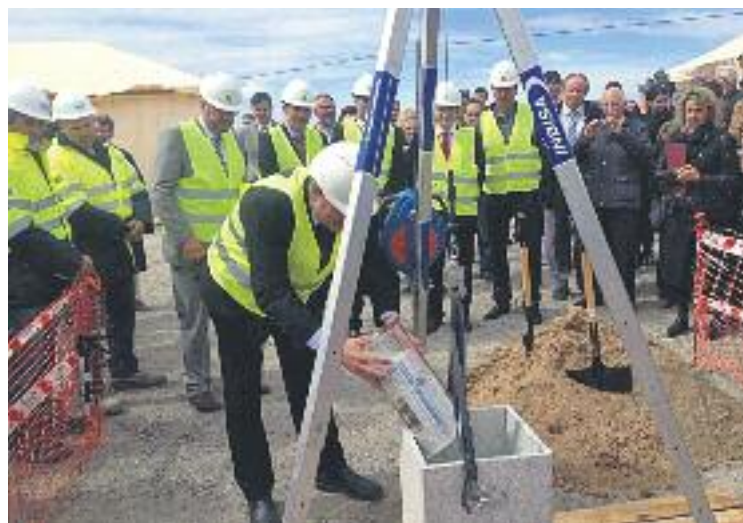
Acte de col·locació de la primera pedra.

Es calcula que les noves instal·lacions, que ocupen una su-