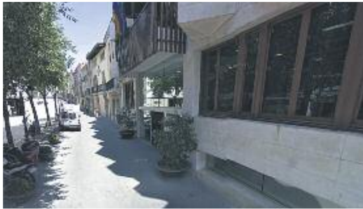
El govern es trenca a poques setmanes de les eleccions.

La tensió en el si del govern es va fer evident quan els republicans no van donar suport als pressupostos del 2015, al·legant que l'aprovació d'aquests comp-