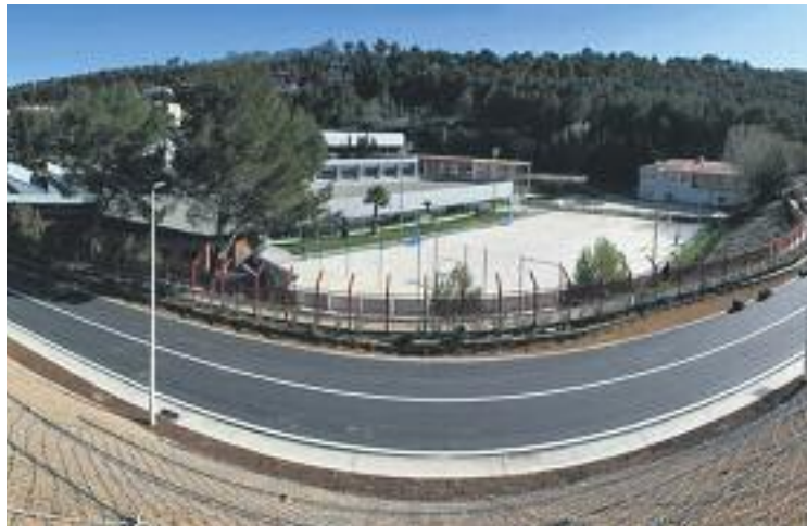
Imatge del tram renovat.

Aquesta zona renovada passa per damunt de la zona esportiva L'11 i es troba a tocar de l'antiga piscina d'estiu i de la Font de la Rana. Durant les obres de renovació s'ha eixamplat la carre-