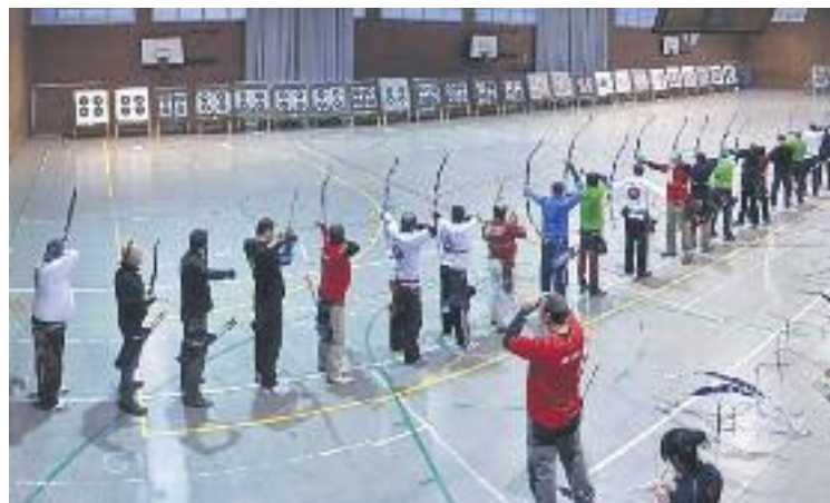
L'entitat és un referent de l'esport al municipi.

OLESA ▶ El Tir Arc Olesa està celebrant enguany el seu quart de segle de vida. En el marc d'aquesta efemèride, el passat 27 de març la Sala de la Comunitat Minera Olesana va ser l'escenari de la presentació del nou logotip i la nova samarreta del club, així com de diverses activitats commemoratives del seu vint-i-cinquè aniversari. Diferents autoritats de la política i de l'esport van ser presents a l'acte.