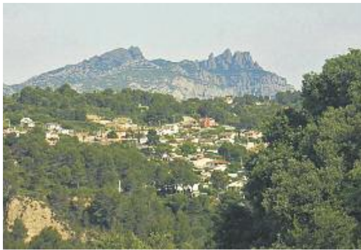
Urbanització Oasis.

Amb la implantació d'aquest sistema, es faran tres tractaments biològics que poden donar servei a un total de set-cents habitants, aproximadament, segons han informat fonts municipals. Olesa s'incorpora així als nou municipis que ja utilitzen aquest sistema a la comarca,