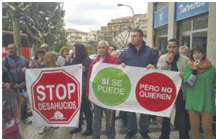
Una mobilització de la PAH.

La moció també detalla mesures adreçades a evitar la pobresa energètica relacionada