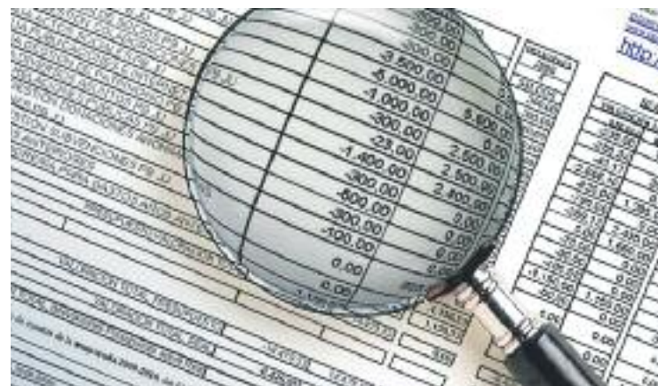
ERC troba mancances en el nou web Govern Obert.

Davant d'això, el consistori ha assegurat a Línia Nord que respecten totes les opinions, però que "una transparència del 83% és un alt nivell". A més, afegeix que el seu objectiu és "arribar al 100%".