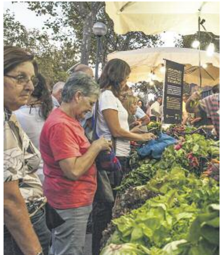
Els mercats de pagès del Baix Llobregat ofereixen productes del Parc Agrari.