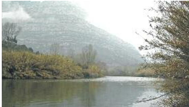
El Llobregat al seu pas per Olesa.

El projecte està completat des del naixement del Llobregat fins a Manresa i des de Martorell fins al Prat, però a la zona entre Abrera i Olesa encara no s'ha executat, de manera que la via no està connectada de dalt a baix. Ara, amb l'execució d'aquest tram a aquestes dues localitats, es completarà la Via Verda del Llobregat, que permetrà unir tot el recorregut del riu en un camí.