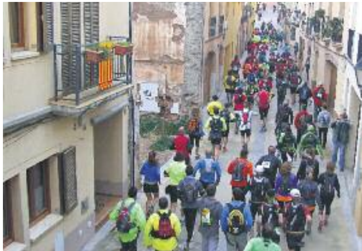
Sortida de la prova a peu.

Per una banda, dissabte 11, més de mig miler d'excursionistes van recórrer els 44 quilòmetres de la renovada ruta a peu, que