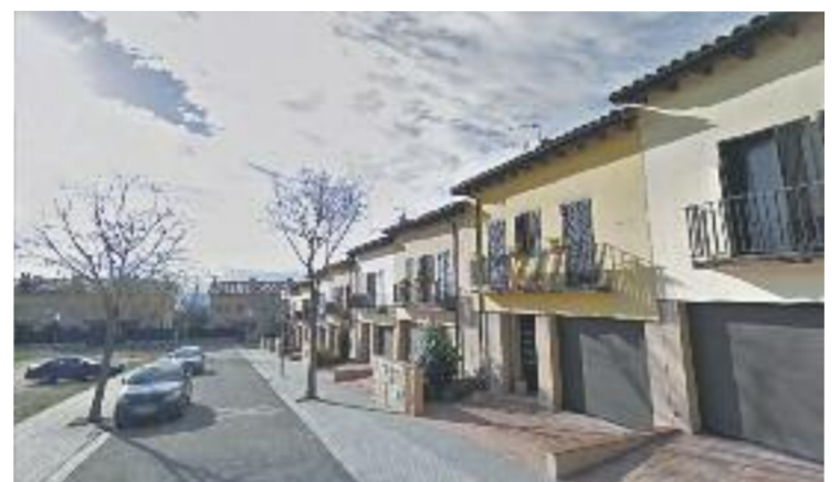
Carrer de Josep Pla.

També s'instal·larà un paviment diferent, amb capacitat d'absorbir el moviment de la terra, evitant les esquerdes i les irregularitats.