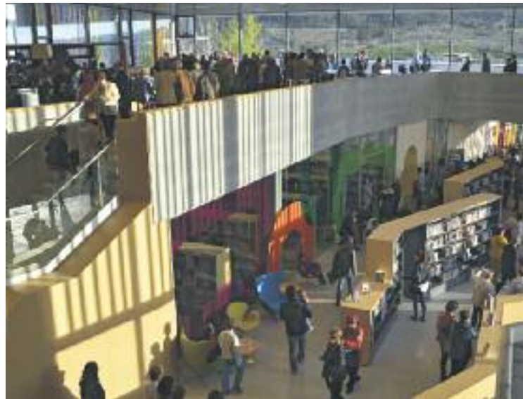
Interior de la nova biblioteca.

El projecte de la nova biblioteca ha tingut un cost de més de quatre milions d'euros i ha estat finançat, majoritàriament, per la Diputació de Barcelona.