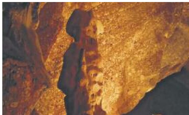
Interior de les Coves de Salnitre.

A més de les Coves de Salnitre, també s'ha adherit a la campanya el Museu de Montserrat, com també la Colònia Güell-Cripta de Gaudí, el Canal Olímpic de