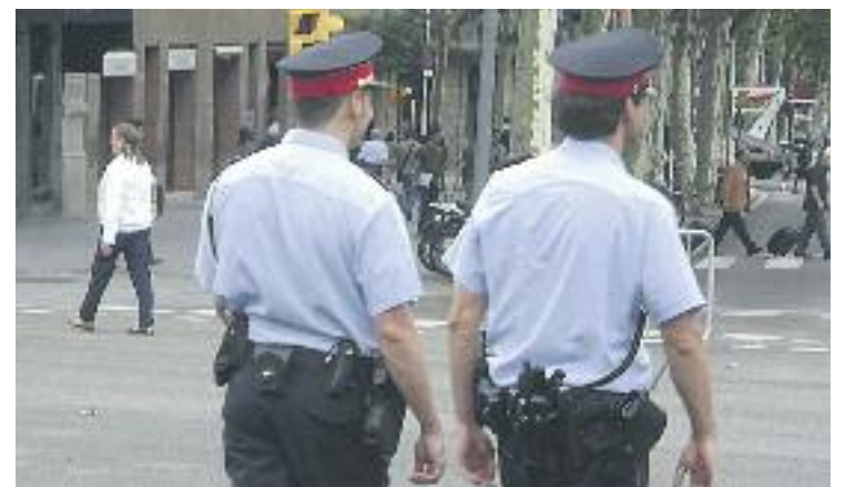
L'operació va ser duta a terme pels Mossos d'Esquadra.

En arribar, els paquets d'haixix s'emmagatzemaven en diversos domicilis i després eren traslladats fins a França. El transport de la droga es feia amb turismes i camions.