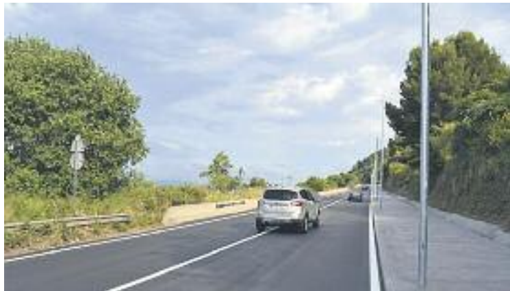
Tram de la N-II reformat durant aquest mandat.

Esteve va repassar les actuacions que s'han realitzat a la ciutat durant els últims quatre anys. Va destacar, sobretot, la transformació de l'antiga N-II, la nova biblioteca, el nou Centre de Formació Professional de l'Automoció, el Pla d'Ajuts a les Famílies i una vintena d'accions en matèria d'ocupació. També va mencionar la transformació de l'Escola Montserrat en un institut i la conversió del Molí Fariner en un Centre Integral de Promoció Econòmica, entre altres.