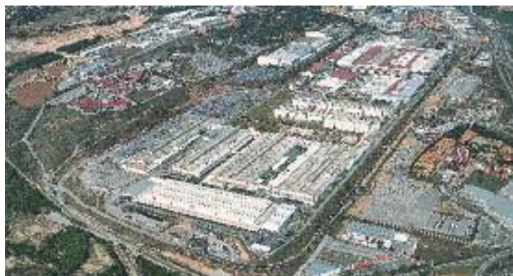
Imatge aèria de les instal·lacions de Seat a Martorell.

L'equipament ocupa una superfície de més de 10.000 metres quadrats i ha tingut un cost de 17,6 milions d'euros.