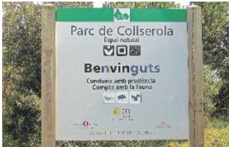
El Parc de Collserola ocupa una part del territori de la comarca.

Es tracta de l'anomenat Pla Especial de Protecció del Medi Natural i el Paisatge (PEPNat), que preveu posar en marxa un conjunt d'accions amb l'objectiu d'incrementar la protecció d'aquest espai natural, que és el més gran al territori metropolità. En total, s'ha acordat treballar en 21