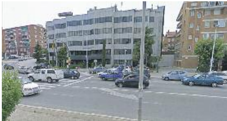
El pressupost del consistori ha augmentat un 2,6%.

Segons asseguren fonts municipals, enguany hi ha més despesa social i es destinaran "més diners a ajudar les persones i les famílies que més dificultats estan passant per la crisi econòmica". En aquest sentit, s'hi destinaran un total de 776.625 euros, que es repartiran en diferents àmbits: atenció a persones amb disca-