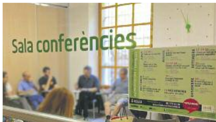
La presentació es va fer al Molí Empresa de Martorell.

Per tal d'optar a les subvencions, els municipis han de complir amb certs requisits, com tenir un mínim de 30.000 habitants.