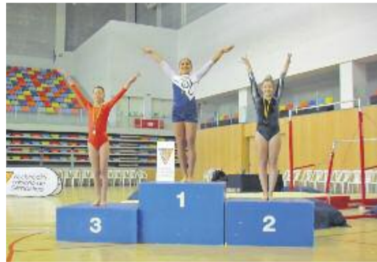
Les esparreguerines van fer un gran paper a Osona.