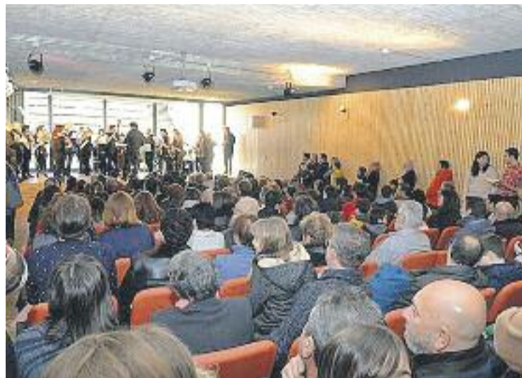
Una banda toca al nou auditori durant la inauguració.

L'edifici també compta amb una zona reservada per encabir-