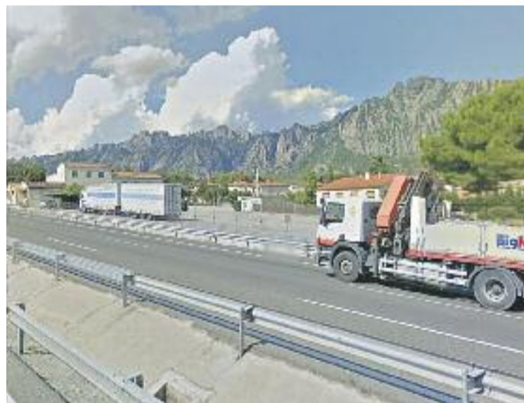
Tram de l'A2 que passa per Collbató.

Davant d'això, els sis municipis s'han posat d'acord per enviar una carta a la ministra de Foment, Ana Pastor, per reclamar actuacions en aquest tram per