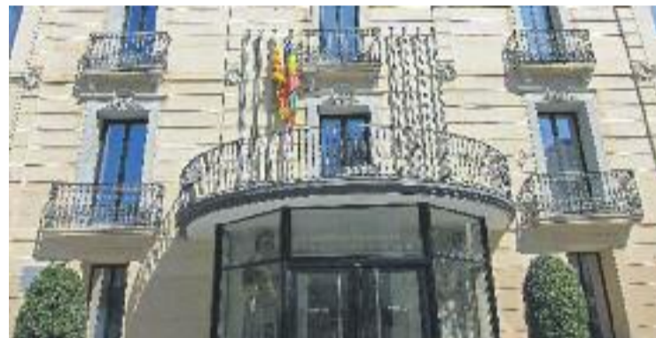
El consistori consultarà sobre dos temes d'àmbit urbanístic.

Les preguntes de la consulta són: “Els terrenys del camp de futbol d'Olesa tenen una qualificació urbanística que permet construir-hi habitatges. Voleu que es preservin aquests terrenys per a ús exclusiu d'equipament?”. La segona és: “El Pla General d'Ordenació Urbana d'Olesa vigent preserva el pla de Can Llimona, zona delimitada per la riera de Can Carreras a la dreta i per les Planes a l'esquerra, amb la qualificació d'agrícola. Voleu que en el futur el planejament urbanístic municipal mantingui aquesta qualificació d'agrícola al pla de Can Llimona?”.