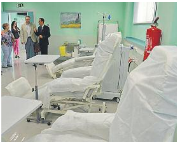
El centre d'hemodiàlisi B. Braun de Martorell.

La capacitat del nou centre és de 150 pacients i compta amb una superfície de més de mil metres quadrats. Hi ha tres sales de diàlisi amb vint-i-cinc punts de tractament. El centre, a més, disposa de màquines de tecnologia avançada i una sala de reanimació. El nou equipa-