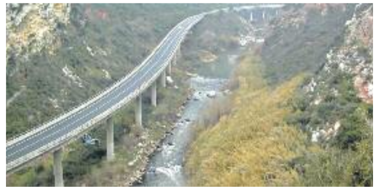
El Llobregat al seu pas per Olesa de Montserrat.

Davant d'això, el Catàleg presentat pel Departament de Territori i Sostenibilitat considera "necessari requalificar i consolidar les franges de paisatges que es disposen al llarg d'aquest corredor" per tal de millorar-lo.