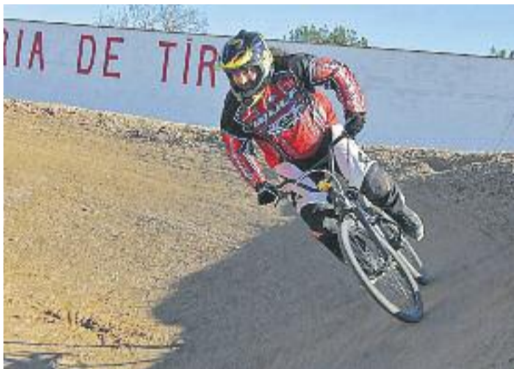
El BMX té dues modalitats, cursa i freestyle .

La següent cita per als aficionats a aquest esport extrem serà durant el mes de març a Terrassa, al Vallès Occidental.