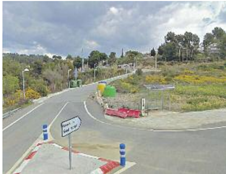
Entrada a la urbanització de Sant Miquel.

I és que fa uns dies el conducte, que passa per sota d'aquesta zona residencial d'Abrera i que abasteix d'aigua el municipi de Terrassa, va patir una avaria. Com a conseqüència d'això, alguns habitatges de la urbanització abrerenca van patir danys i es va inundar part del carrer. La pressió de l'aigua va esbotzar el mur d'un pati d'una casa i va trencar una barana d'un dels balcons. Alguns terrenys dels habitatges de la zona de Sant Miquel també van acabar coberts de fang.