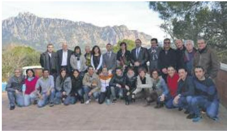
Organitzadors i personalitats després de la presentació.

La cursa constarà d'un recorregut de 44 quilòmetres pels voltants de la muntanya de Montserrat amb origen i final a Collbató. Alguns dels punts que recorreran els participants seran El Bruc, Marganell, Sant Cristòfol i