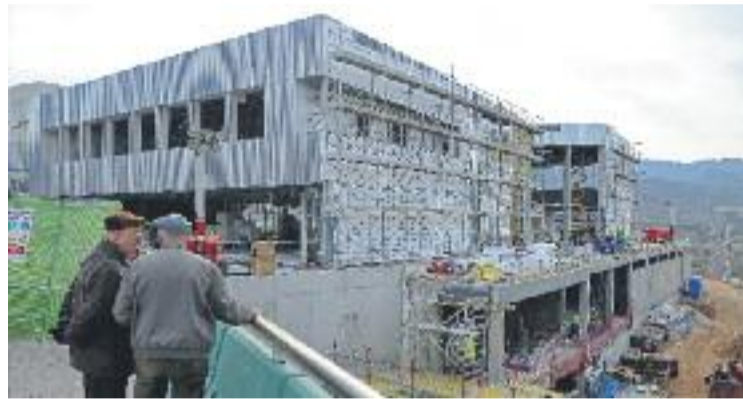
Les obres van començar el primer semestre de 2014.

El nou edifici cultural, que ocupa uns 2.500 metres quadrats de superfície, consta de dues plantes destinades a la biblioteca –que sumen un total de 1.900 metres quadrats– i dues on s'ubicarà un aparcament per