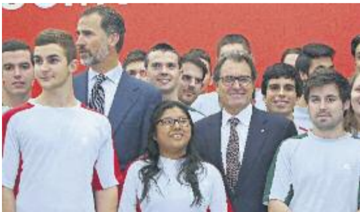
El rei Felip i el president Artur Mas, durant la visita a Seat.

Tots dos van poder parlar també amb els treballadors de la línia de muntatge. Alguns d'ells són estudiants de la primera promoció de la formació dual a Seat i altres són alumnes que l'any vinent ja s'incorporaran a la plantilla de l'empresa.