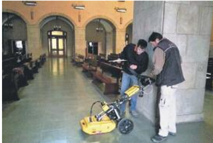
Estudi amb georadar a l'església de Santa Maria.

De moment, però, no s'ha pogut concretar amb total certesa què hi ha al subsòl de l'església olesana, a l'espera dels resultats de l'informe de les prospeccions fetes amb georadar. Tot i això, sí que s'ha pogut intuir la possible existència d'una cripta. Durant l'estudi amb georadar es va detectar un sostre de volta al subsòl que, segons els analistes, pertanyeria a la cripta.