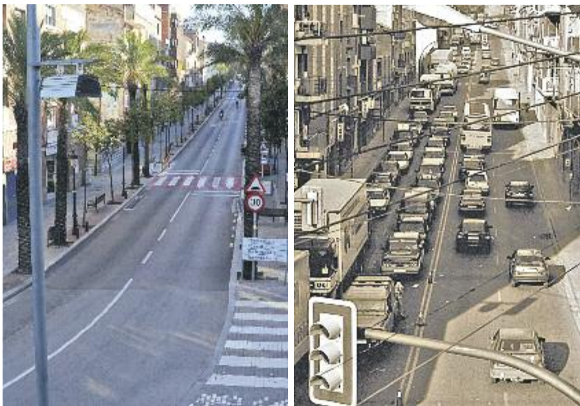
A l'esquerra, la imatge del nou passeig, on abans hi havia més trànsit i menys voreres (dreta).

» S'ha transformat la via des del polígon del Congost fins a Can Cases, ampliant voreres i renovant enllumenat i mobiliari urbà