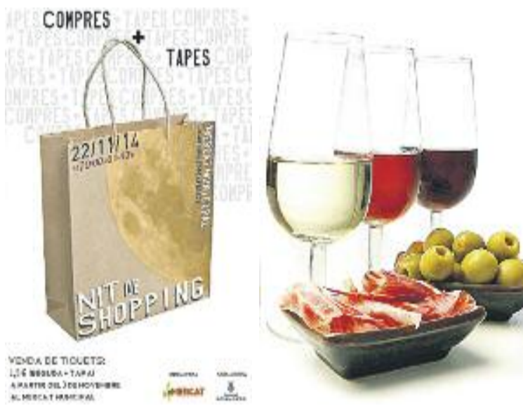
S'oferia una tapa i beguda per 1,5 euros.

Al preu simbòlic d'un euro i mig, els paradistes del mercat municipal de Sant Andreu de la