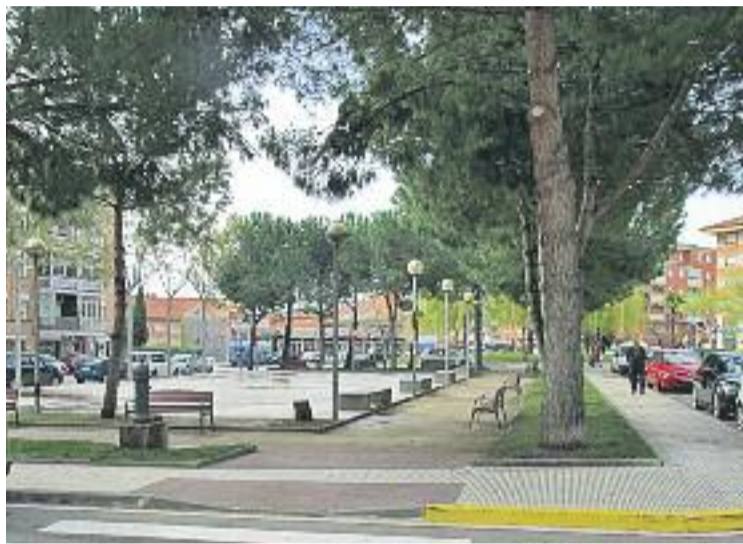
La plaça de Rafael Casanova en l'actualitat.

Les obres de millora inclouran també la construcció d'un nou sistema de recollida d'aigües pluvials, a més d'un nou sistema d'enllumenat. També es renovarà tot el mobiliari urbà de la