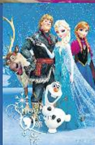
Ref. WD07226 9.368 unitats