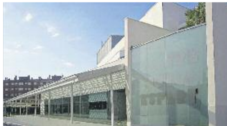
El documental es va projectar al Teatre Núria Espert.

L'Ajuntament de Sant Andreu de la Barca treballa amb projectes com aquest amb l'objectiu de recuperar el patrimoni històric del municipi. A través d'aquestes iniciatives, es pretén mostrar als més joves com era el municipi, què sentia la gent i de quina manera vivia.