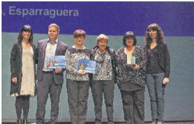
Les esparreguerines guardonades durant l'entrega.

Pel que fa a l'entitat que porta el nom de la difunta actriu