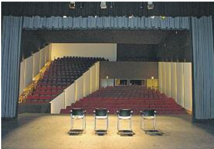
La gala va celebrar-se al teatre Núria Espert.