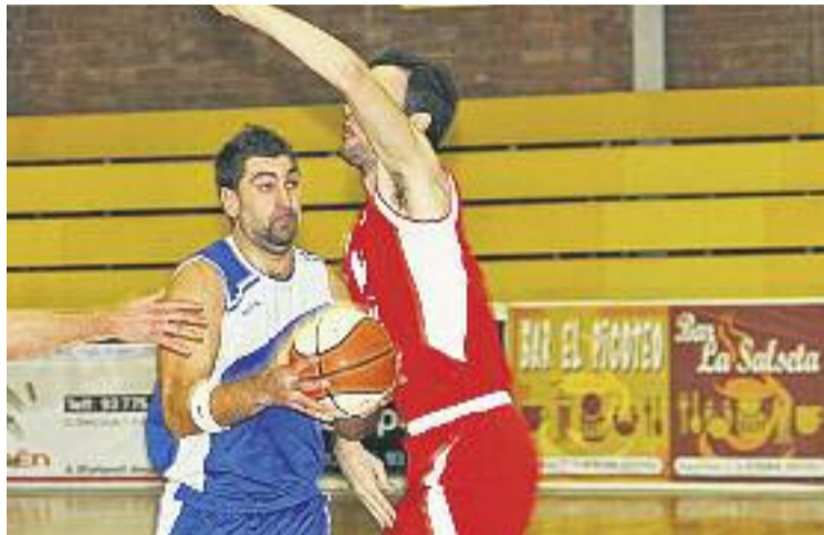
El Solvin només ha guanyat dos partits aquesta temporada.

El primer quart ja deixava entreveure el tarannà que agafaria l'enfrontament, ja que va finalitzar amb un parcial de 31 a 10 favorable als sabadellencs, que amb una defensa infranquejable i una bona anotació de tir exterior van noquejar els del Baix Llobregat. Els equips van marxar als