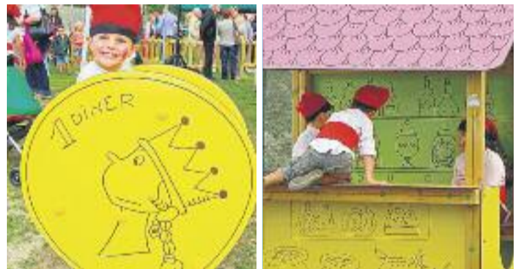
Un parc dissenyat per Bayés, com el d'Esparreguera.

Segons expliquen des del consistori esparreguerí, el nou parc temàtic infantil està pensat perquè els adults puguin explicar el conte als més petits d'una manera fàcil i divertida.