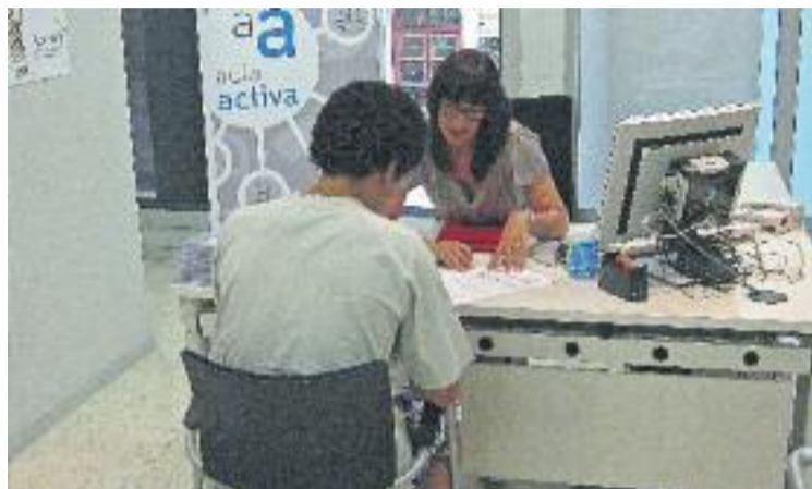
Una oficina de treball on s'ofereix orientació laboral.

Tot i augmentar el nombre d'assalariats, la contractació de