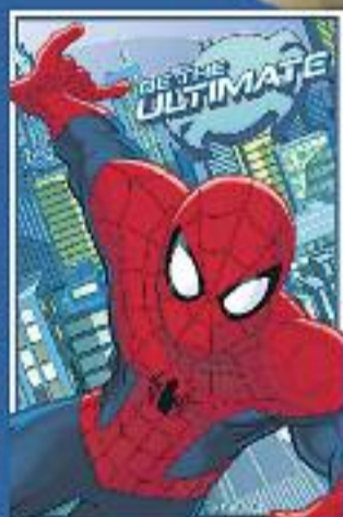
Ref. MV07227 2.453 unitats