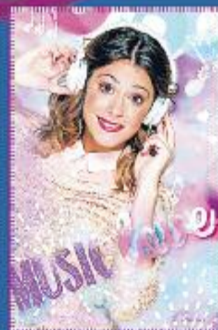
Ref. WD07228 5.725 unitats