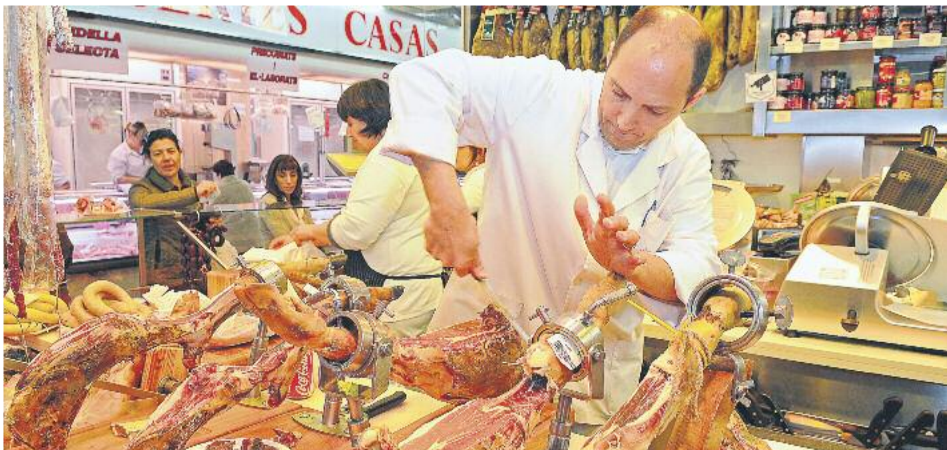
El sector comercial preveu un augment de la contractació d'entre el 2 i el 3%.