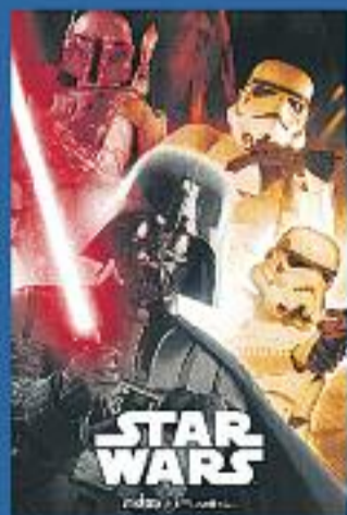
Ref. SW14052 2.635 unitats