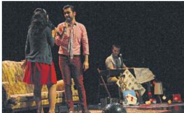
La festa va incloure l'obra Lo tuyo y lo mío .

Tot i que el gruix d'activitats es van programar els dies 28, 29 i 30, el dia 25 ja es van començar a escalfar els motors amb propostes com un taller sobre malbaratament alimentari. El dia 26 se'n va oferir un altre, sobre bijuteria i altres complements. Però quan va arrencar la fes-