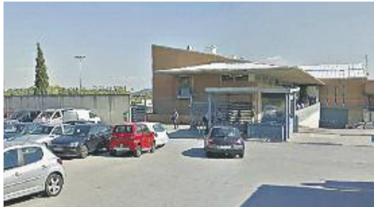
Porta d'entrada del centre penitenciari Brians 2.

El sindicat ha criticat també la gestió del Centre d'Iniciatives per a la Reinserció (CIRE) i de la Di-