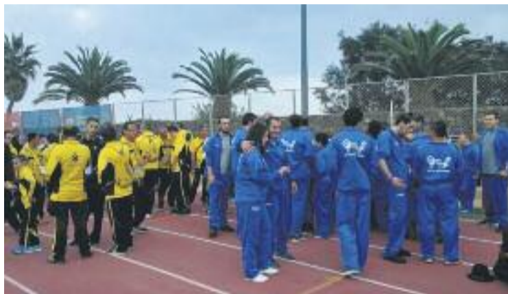
Els martorellencs van participar en la desfilada inaugural.