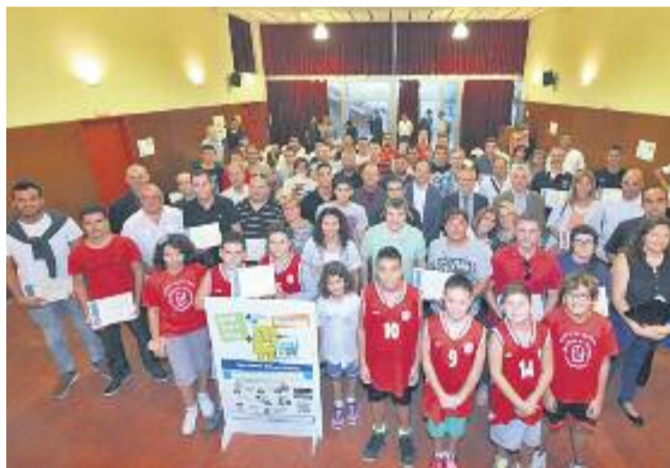
Alguns dels premiats del programa Joga Verd Play.