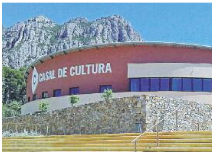
La biblioteca es troba al Casal de Cultura.

A part d'això, a la biblioteca s'instal·larà durant dos dies un planetari per als més petits. Con-