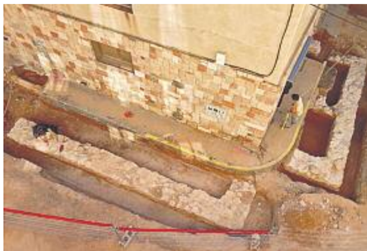
Imatge de les restes arqueològiques trobades a Olesa.

L'arqueòleg responsable de l'excavació, Oriol Achon, va assegurar a diversos mitjans que "es tracta d'una troballa molt