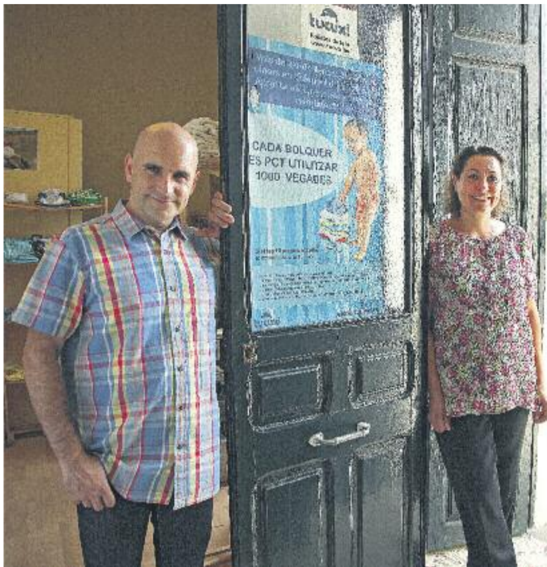
Un total de 75 empresaris han cedit a altres emprenedors la seva activitat quan l'han deixat per jubilació o altres motius.