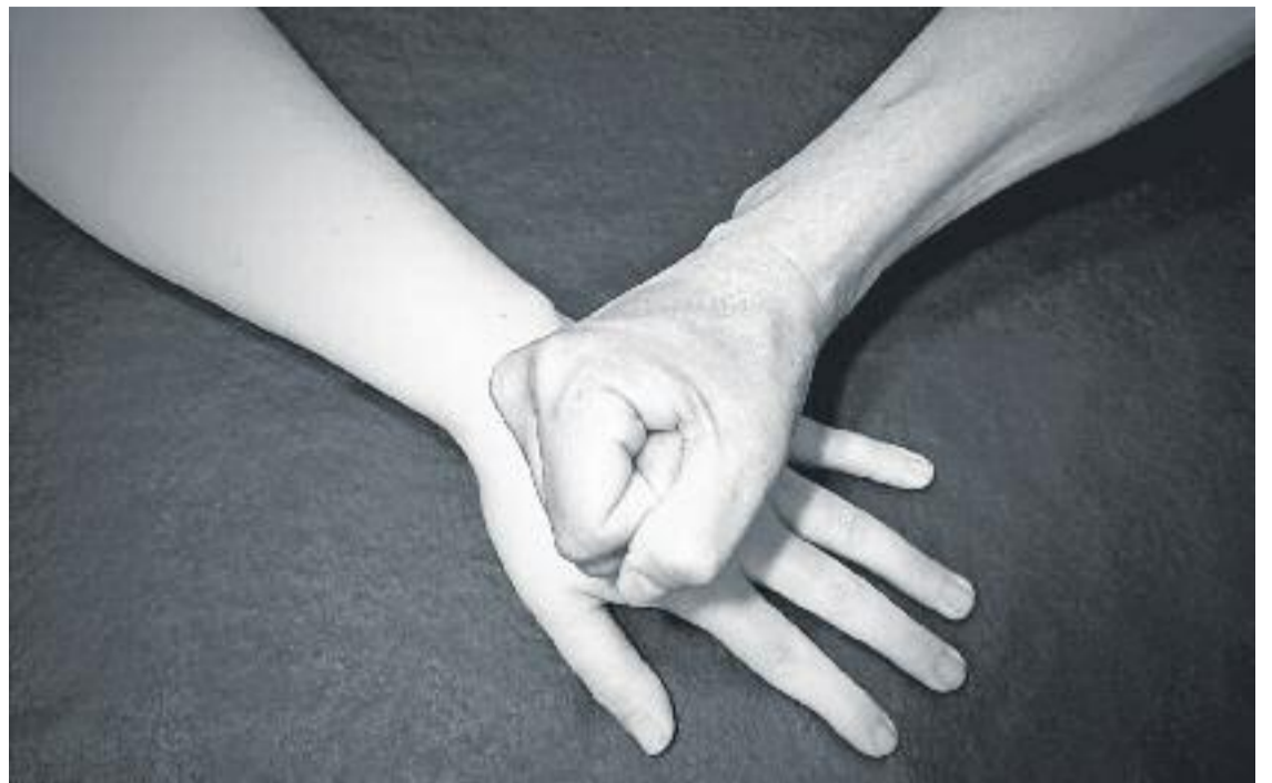
Més del 80% dels homes maltractadors a la comarca són de nacionalitat espanyola.