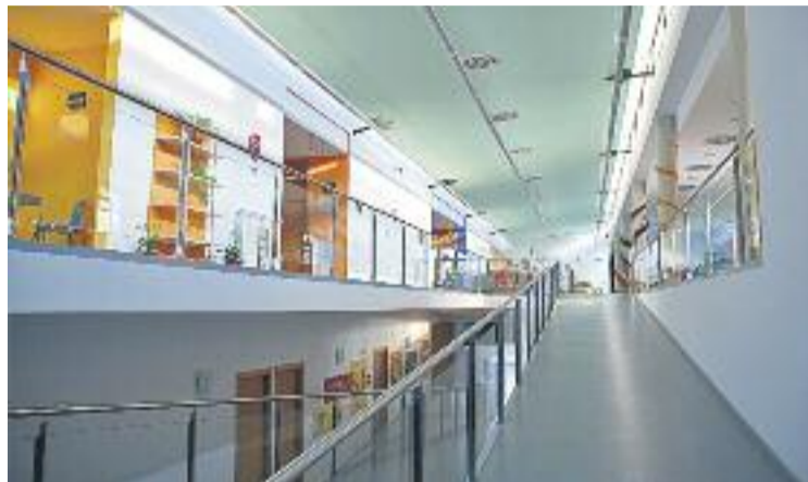
Llar d'infants La Ginesta.

Des del consistori sesrovirenç s'ha manifestat que l'Ajuntament