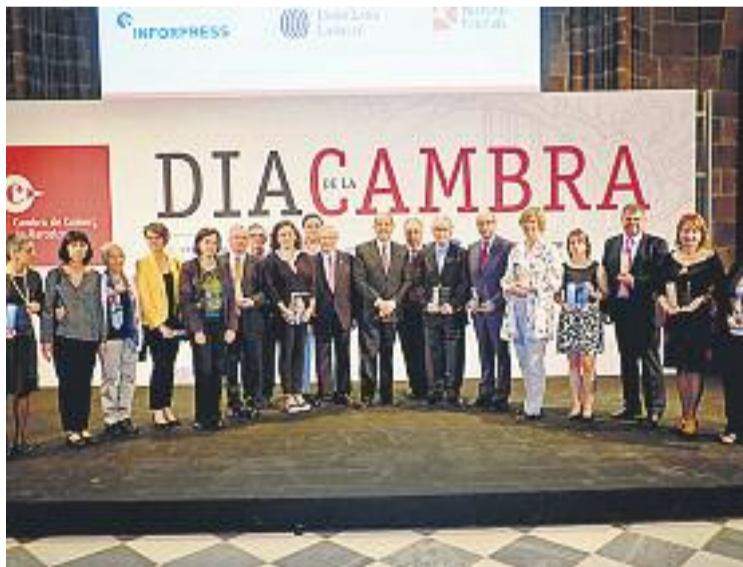
Acte d'entrega dels reconeixements.