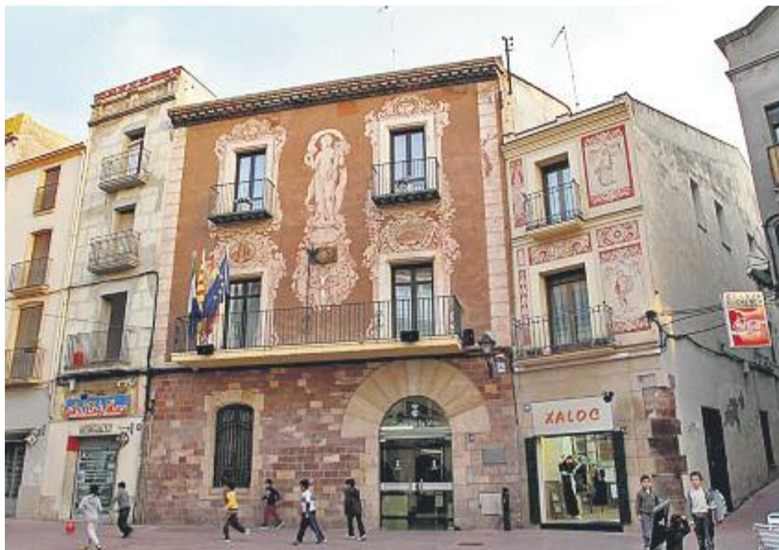
A més de l'IBI, la mesura afecta l'IAE i altres impostos.

» El consistori impulsarà una disminució de l'IBI del 13% per compensar l'augment d'aquest impost per part del govern central