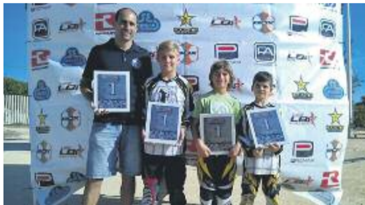
Els quatre campions de Sant Andreu.