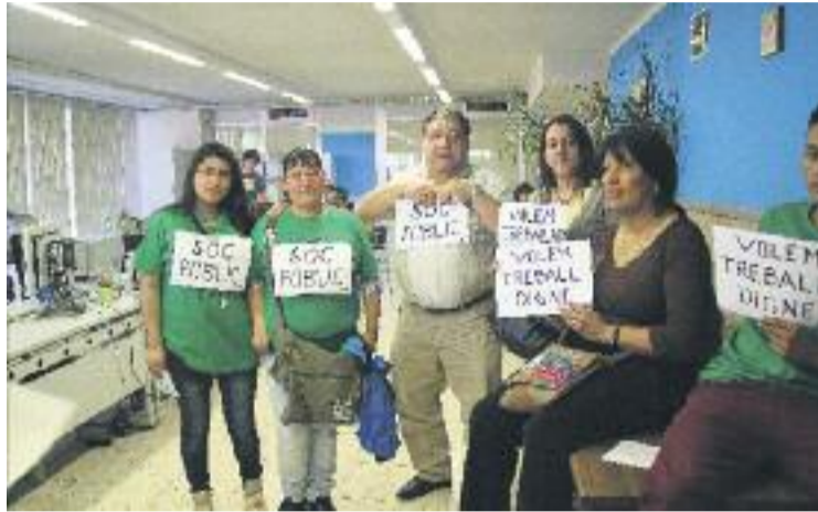
Aturats d'Esparreguera i la PAH Baix Llobregat Nord durant l'acció.

La jornada de protesta, que es va celebrar el dia abans del Dia del Treballador (1 de maig), es va