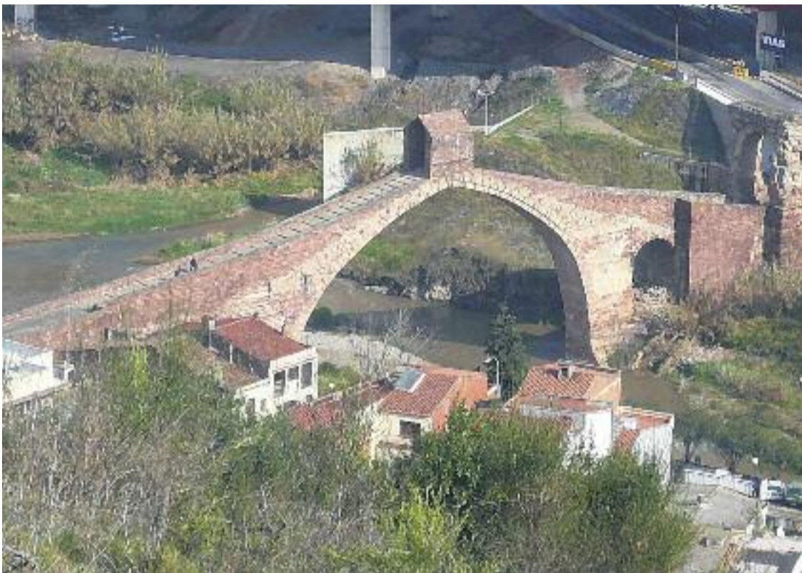
Martorell invertirà en millores en infraestructures i a la via pública.

» Només CiU ha votat a favor del nou paquet d'inversions al darrer Ple, en què la resta de grups es van abstenir i ICV va votar en contra