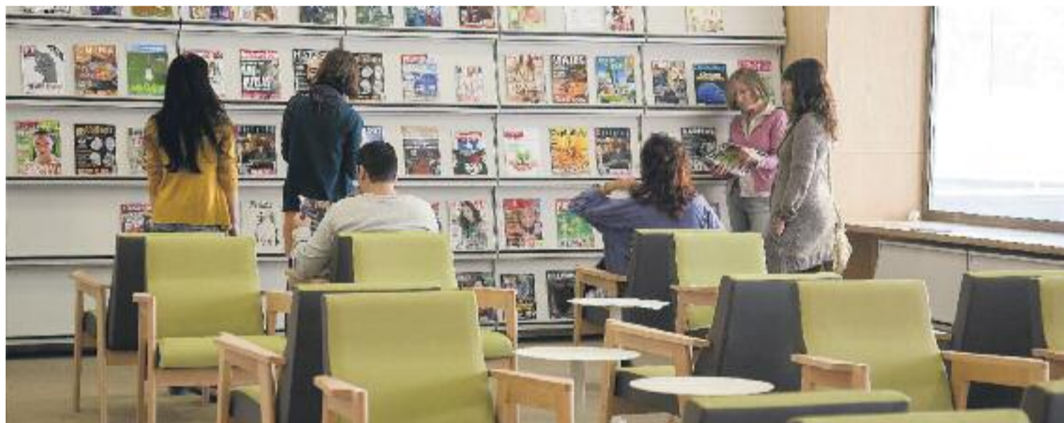
Les biblioteques del Baix Llobregat donen servei a 790.776 habitants.

província, des de la Diputació de Barcelona s'ofereix el servei de préstec interbibliotecari que permet accedir a la totalitat del fons de la XBM des de qualsevol de les biblioteques. Aquest servei ha crescut any rere any en el conjunt de la xarxa i l'any passat va suposar el moviment de 350.000 documents.