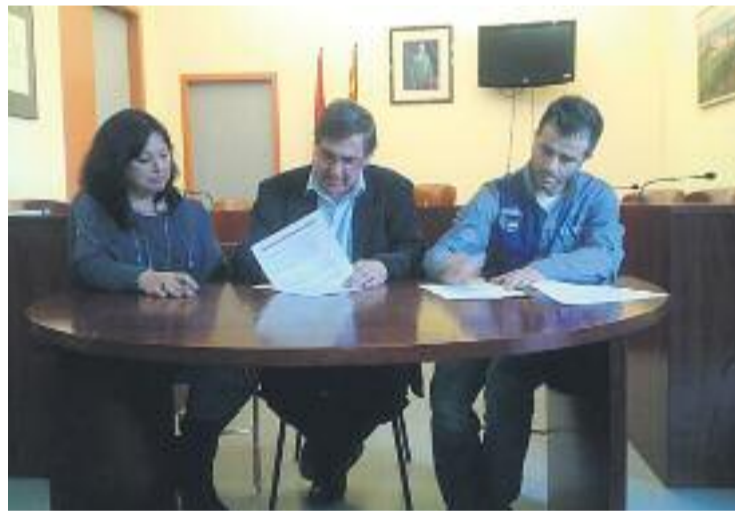
Acte de signatura del conveni.