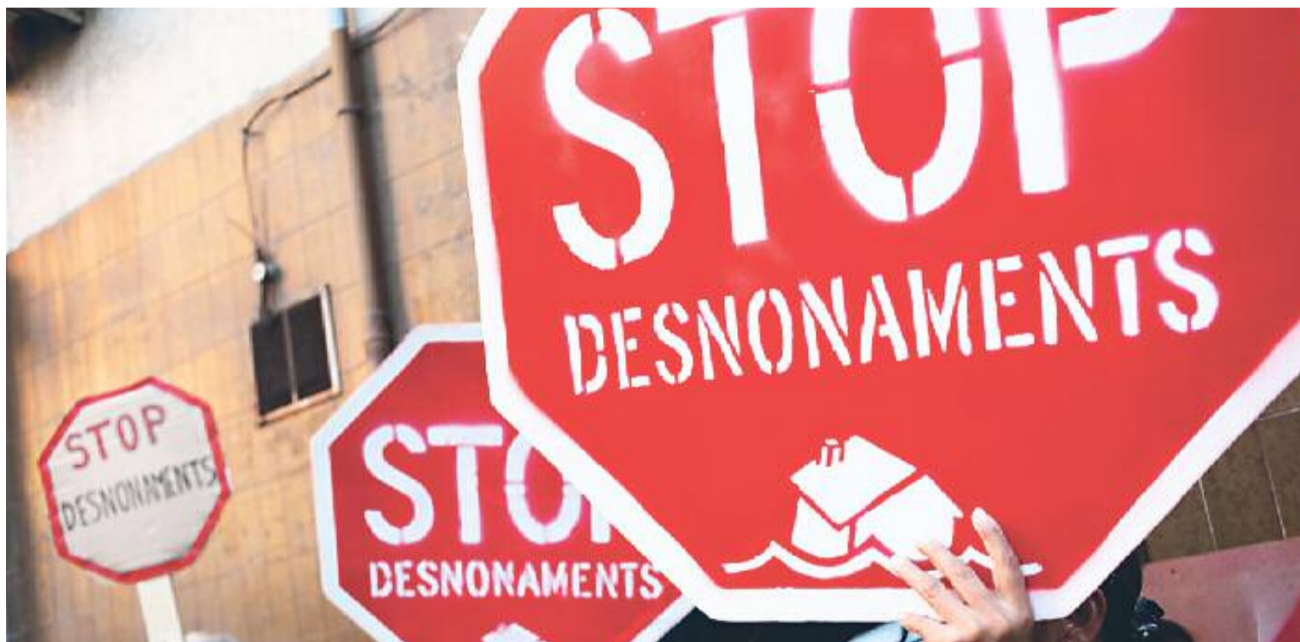
El problema de l'habitatge va en augment.