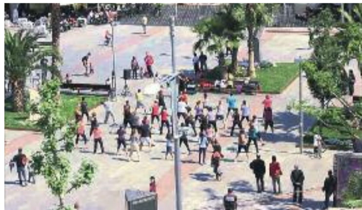
El bon temps és un incentiu per fer esport a l'aire lliure.

Pel que fa a l'aerobic a l'aire lliure, aquesta activitat es realitza a la plaça Garcia Lorca, davant del Teatre Núria Espert, i ofereix tot un seguit de modalitats com el cardiobox o l' aerodance . La pròxima cita tindrà lloc divendres 30 de maig. En aquesta mateixa plaça també s'organitzaran activitats adreçades als més petits, que podran practicar diferents modalitats esportives durant el matí del pròxim 8 de juny.