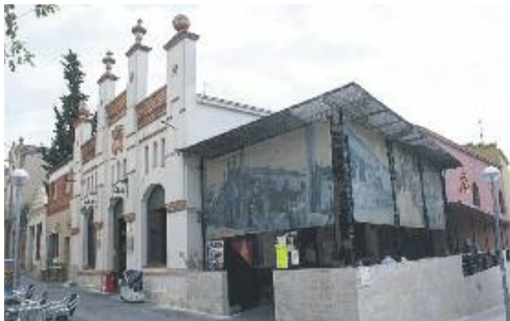
L'acte va tenir lloc al Casino de Sant Esteve.

En la categoria d'activitats, el guardó va ser per al Pessebre Vivent, "per la seva aportació a la cultura popular local, l'esforç i la participació de moltes persones