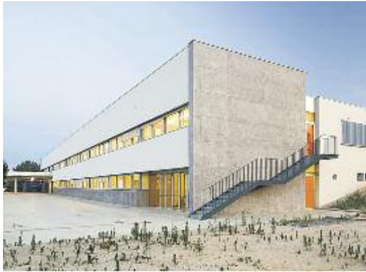
Projecte arquitectònic de l'institut.

L'Institut Montserrat Colomer del municipi es va inaugurar l'any 2006, inicialment com a centre de secundària amb tres línies d'ESO. Però a partir del se-