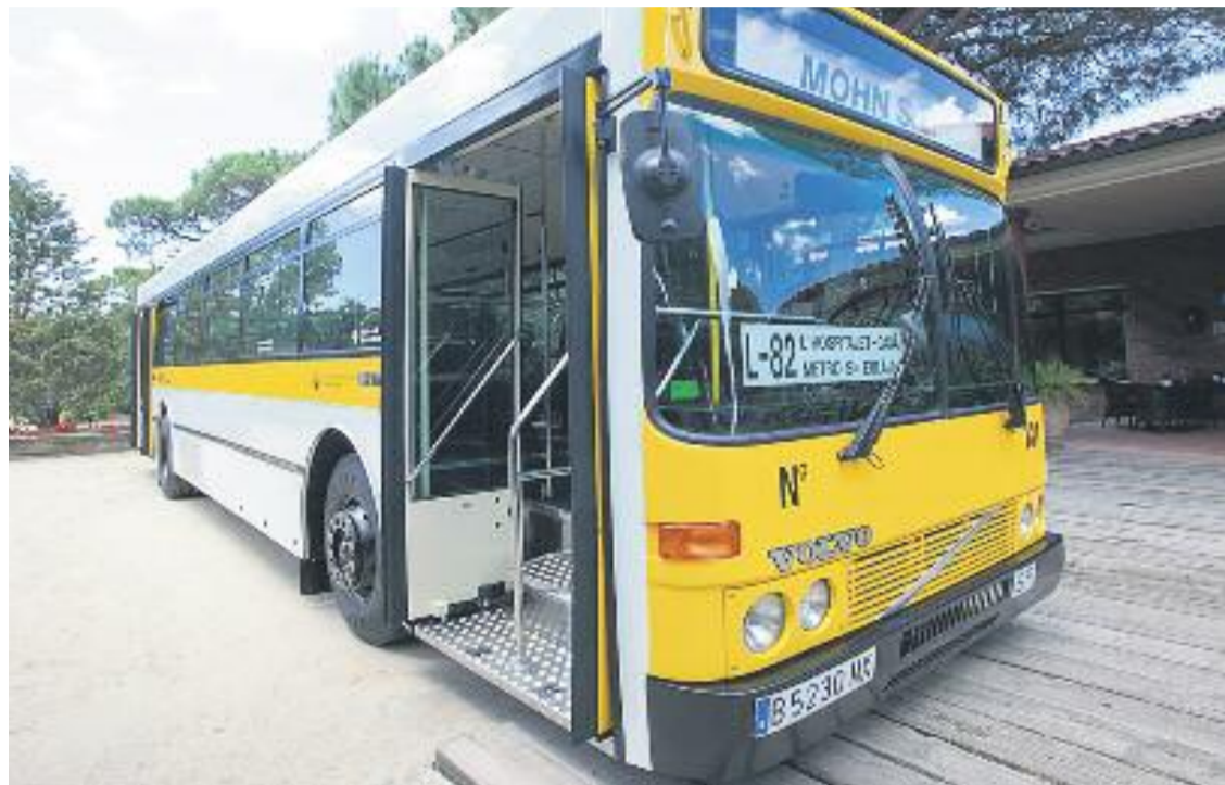
Cada any hi ha més usuaris de la xarxa d'autobusos de la comarca.

» Les línies d'autobús nocturn del Baix Llobregat creixen respecte al 2012 i arriben gairebé als dos milions d'usuaris