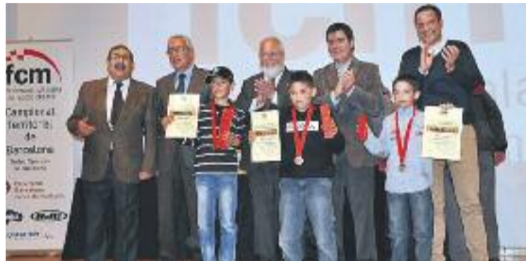
Algunes de les joves promeses guardonades.