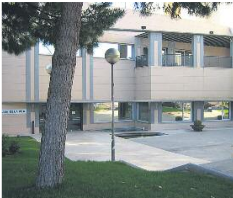
L'Ajuntament d'Abrera prioritza l'Acció Social i l'ocupació.

Una altra línia d'actuació en la qual vol prioritzar el consistori és la via pública, àmbit en el qual la partida incrementa en un 30% la seva dotació,