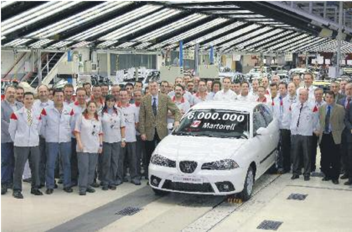
Treballadors de Seat juntament amb un model d'Ibiza.

» La mesura es deu a un increment en la producció del León i l'Ibiza » També s'ha anunciat que el Centre de Formació obrirà el setembre