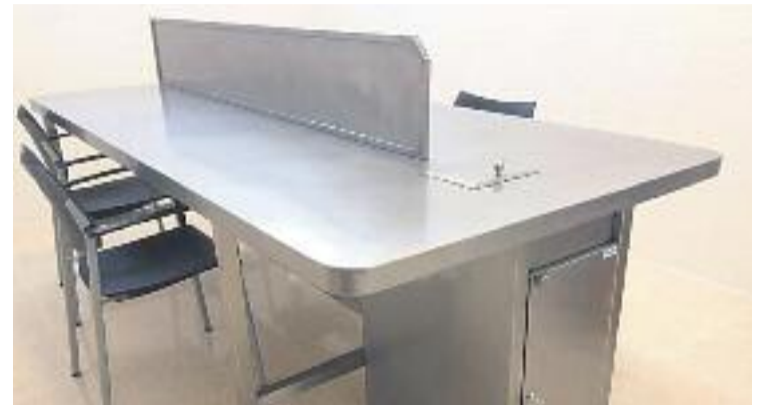
El nou espai de venopunció, amb punts de consum intravenós i una sala per a fumadors d'estupefaents (dreta), forma part del nou CAP de la Mina (esquerra).