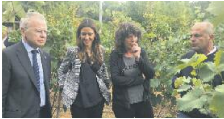
Un moment durant la visita dilluns a la Vinya d'en Sabater.

En el cas que la recerca confirmés la viabilitat de la iniciativa, es faria un informe tècnic que es portaria a la pràctica en un ter-