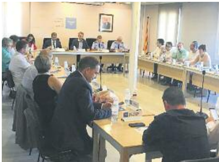
Una imatge de la trobada del Consell.

El problema dels robatoris a diferents cases del poble, prin-