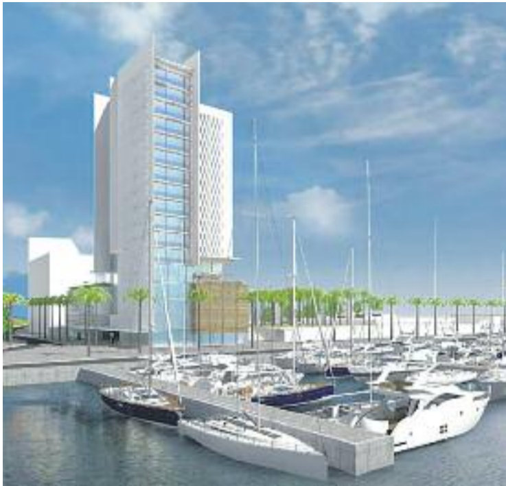
Es preveu que l'hotel sigui una realitat a finals del 2020.