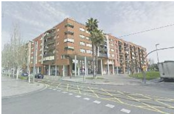
Els pisos de segona mà s'han encarit.

Les xifres formen part de l'últim informe de l'Índex Immobiliari Fotocasa, que mostra com el preu mitjà per metre quadrat d'un pis de segona mà a Ca-