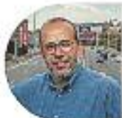
ORIO LLADÓ, Compromís amb Badalona

Oriol Lladó , candidat d'ERC a l'alcaldia de Badalona