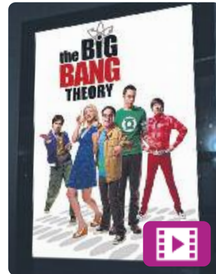
The Big Bang Theory Chuck Lorre i Bill Prady

La dotzena (i darrera) temporada d'aquesta sitcom nord-americana ja s'ha estrenat. Així, som davant dels últims 24 capítols de les aventures de Leonard, Sheldon, Penny i tota la seva colla d'amics. En els diferents episodis hi haurà les aparicions estel·lars de l'actriu Kathy Bates o de l'astrofísic Neil deGrasse Tyson, entre altres.