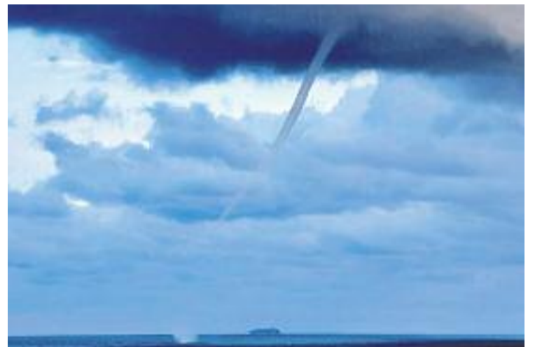
Les xarxes es van omplir de fotos del fenomen.

L'aire fred a la part superior, amb temperatures de menys de 20 graus a 5.500 metres, juntament amb l'aigua calenta del mar i poc vent són les condicions òptimes per a l'aparició d'aquest fenomen. La mànega va arribar amb una potent nuvolada a la costa, que va deixar pluja intensa en alguns barris de la ciutat.