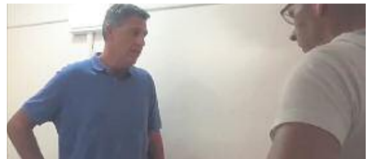
Una captura del polèmic vídeo de l'exalcalde.

POLÍTICA ▶ "Albiol planta cara als ocupes". Aquest és el títol del primer vídeo de campanya de Xavier García Albiol de cara a les pròximes eleccions municipals. Encara queden mesos, però l'exalcalde ha decidit començar ja la seva cursa per "recuperar Badalona", com diu el seu eslògan. I ho ha fet ressuscitant el seu polèmic estil. El del "Limpiando Badalona" o el del "No queremos rumanos", que sempre li han valgut per recollir crítiques i vots gairebé en la mateixa mesura.