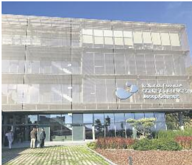
El centre té més de 10.000 metres quadrats.

La Fundació Josep Carreras, juntament amb altres empreses privades com l'Obra Social La Caixa, ha invertit 26 milions d'euros en la construcció i posada en marxa d'aquest centre, que també ha comptat amb finançament públic.