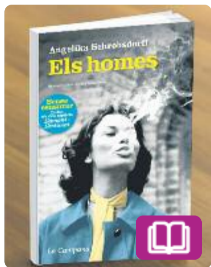
Els homes Angelika Schrobsdorff

Angelika Schrobsdorff va decidir novel·lar la vida de la seva mare, una dona que lluitava contra els canons establerts des de l'Alemanya dels anys 20 fins a l'arribada del nazisme al poder.