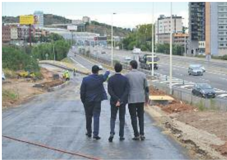
El conseller Calvet va visitar el lateral de la C-31.

L'altre gran titular que va deixar la visita del conseller va ser l'anunci de l'acord per al nou centre de la Fundació Badalona Capaç, dedicada a la integració laboral de les persones amb discapacitat intel·lectual, que es farà al barri de Pomar. L'acord permetrà, a més de la construcció d'aquest centre de dia,