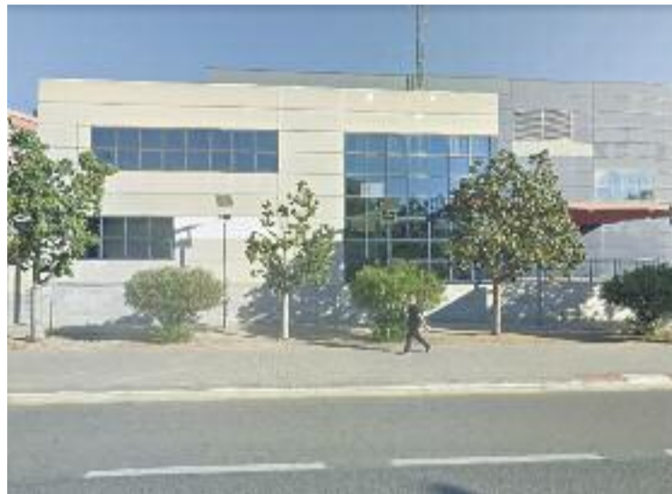
La comissaria dels Mossos de Badalona.

La Fiscalia demanava quatre anys de presó i una indemnització