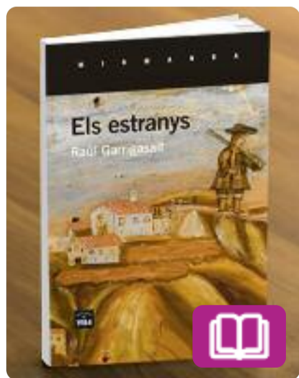
Els estranys Raul Garrigasait

Els estranys trasllada el lector a la Solsona de la guerra carlina l'any 1937. Un jove prussià travessa els Pirineus però un malentès el deixa encallat en una ciutat ruïnosa i desconcertant.