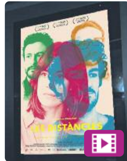
Les distàncies Elena Trapé

El primer llargmetratge estrenat a la gran pantalla d'aquesta directora barcelonina està rebent grans elogis per part de la crítica. Explica la història de quatre joves que viatgen fins a Berlín per visitar un amic comú que viu i treballa a la capital alemanya, però troben que el seu col·lega, Comas, no els rep com tots ells haurien esperat.