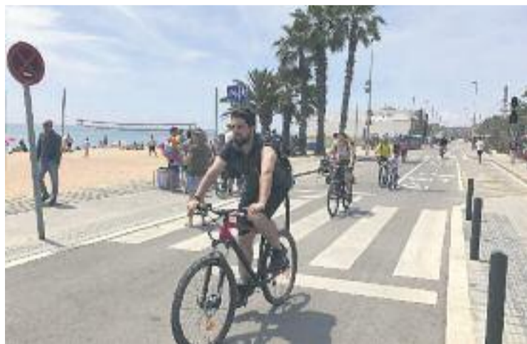
El passeig es va pacificar abans de l'estiu.