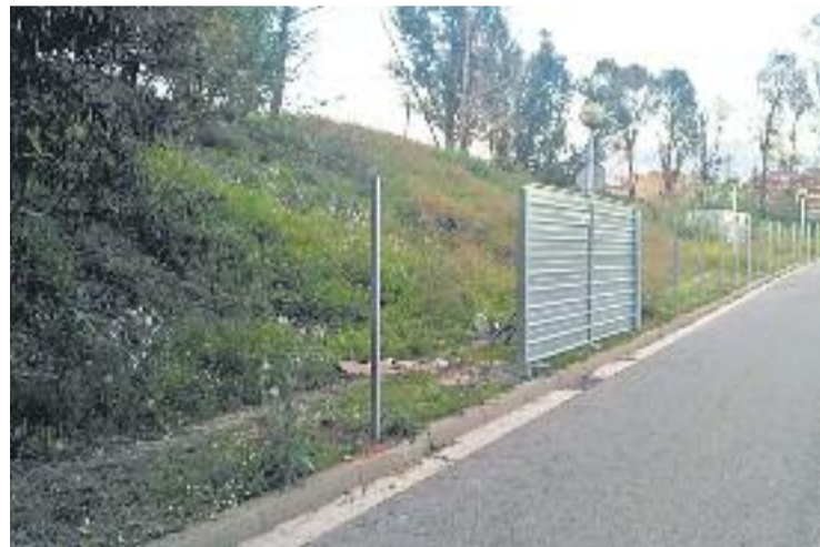
Segueix la polèmica per la construcció del crematori.

Entre els arguments que donen hi ha la creació de molts i diversos llocs de treball, tant administratius com de serveis de manteniment o floristeries. Afegeixen que molts veïns es plantegen la cremació per a ells o per a algun membre de la seva família, i que amb el nou crematori no caldria desplaçar-se. A més, desmenteixen -tal com diu Stop Crematori- que la qualitat de l'aire a Sant Adrià sigui dolenta.