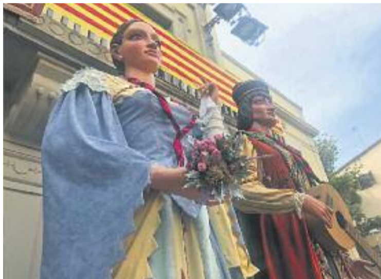
La Novícia i el Cavaller a la plaça de la Vila.

Més tard, a dos quarts de deu de la nit, el castell de focs va posar el punt final simbòlic a la festa. Tot i això, encara quedarà el torneig de futbol 11, que s'allargarà tot el cap de setmana. L'últim dissabte de setembre s'instal·larà un rocòdrom vertical a la plaça de la Vila, perquè qui vul-