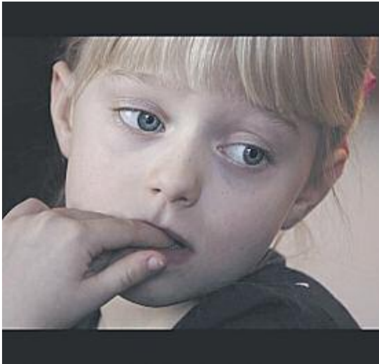
Una escena de 'The Silent Child'.