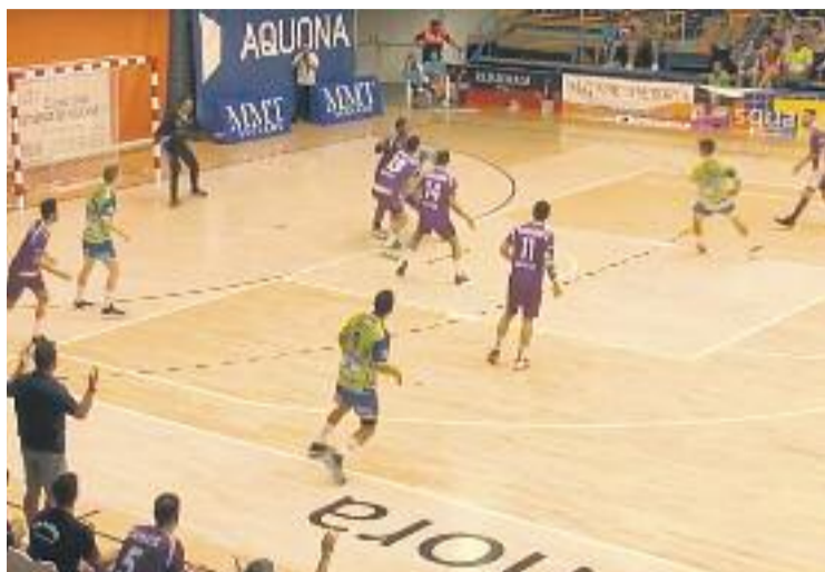
Els liles no van poder puntuar a Zamora.

L'ascens, però, planteja un repte majúscul. “La il·lusió la tenim, però haver de fer viatges molt llargs cada 15 dies serà molt dur”, explica López, que també apunta l'exigent inici de temporada que està afrontant l'equip. “El Zamora l'any passat era a l'ASOBAL, el Nava va ser un dels