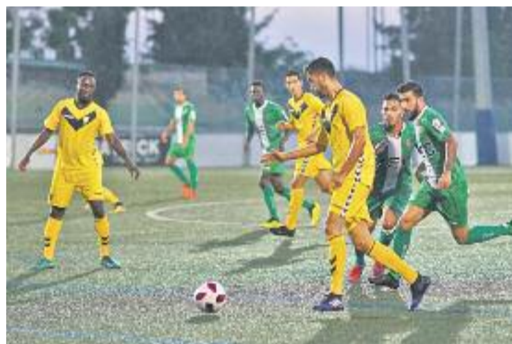
Un moment del partit al camp del Cornellà.

El matx contra l'Atlético Levante arriba després que l'equip encadenés el tercer empat consecutiu, diumenge passat a Cornellà (1-1). Aquest cop, però, l'equip sí que va veure porteria, amb la primera diana de Natalio, que va rematar una centrada passada de Robusté al minut sis de la represa. L'alegria va durar poc, ja que Pep Caballé va restablir l'empat quatre minuts més tard.