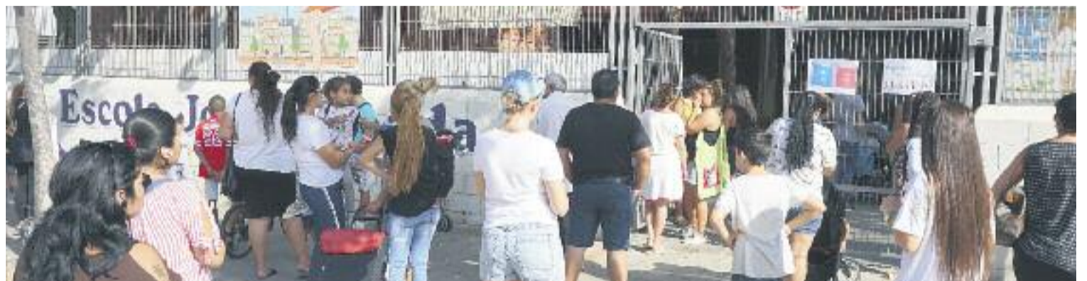
La campanya vol implicar diversos actors: veïns, comerços i entitats.

de risc. Famílies amb problemes com l'atur, desnonaments o altres situacions de vulnerabilitat són les més propenses a fomentar l'absentisme escolar entre els fills. De vegades sol ser més una conseqüència del malestar o els maldecaps dels mateixos pares, que veuen més fàcil deixar els fills dormint que portar-los a l'escola, que no pas una decisió presa a consciència.