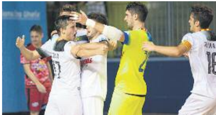
L'equip celebra un dels gols en l'estrena de la lliga.