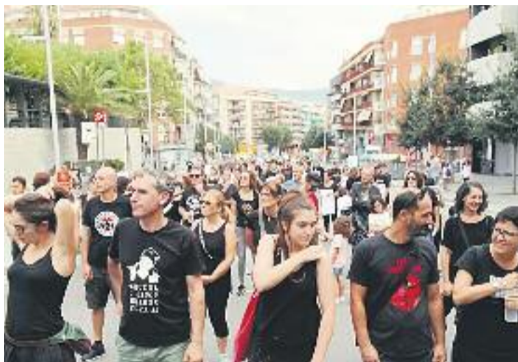
La plataforma reclama una revisió del PERI.

Durant la protesta, membres de la plataforma van explicar els arguments en contra del projecte i les peticions que fan a l'Ajuntament. "Si es construeix el Cúbics 2, deixarà sense llum del sol molts edificis del voltant, i la seva ombra no es podrà esborrar de Santa Coloma", van assegurar, alhora que feien una crida a la ciutadania implicar-s'hi. "Volem re-