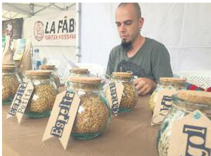
Un dels estands de la fira.

Durant el matí de diumenge, una quinzena d'estands van organitzar tallers i activitats a la plaça de la Vila, en una jornada organitzada per l'Ateneu Cooperatiu amb la col·laboració de la Xarxa d'Economia Solidària del Barcelonès Nord. Hi van participar 18 cooperatives i pro-