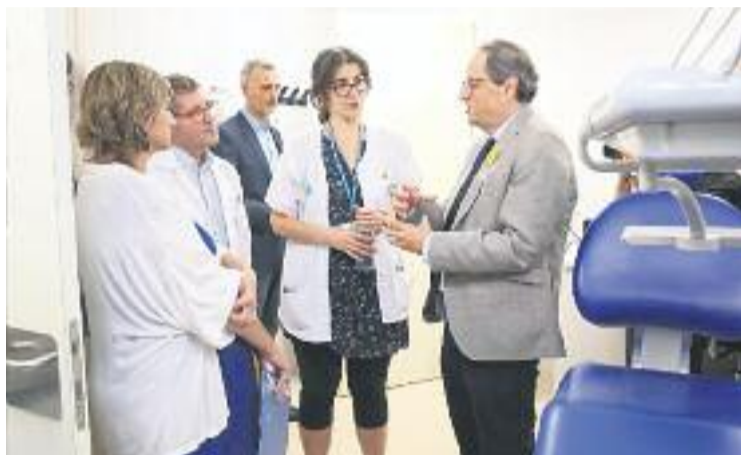
Torra i Vergés durant la visita inaugural.

La visita va servir per conèixer de primera mà les instal·lacions, que van suposar una inversió de més de nou milions d'euros, finançats pel Servei Ca-