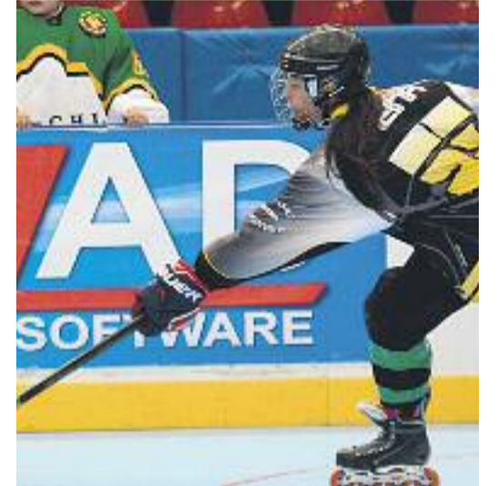
Els equips sèniors masculí i femení tanquen una temporada magnífica.

mirable trajectòria de l'hoquei local és un dels fets que els ha portat a convertir-se en els protagonistes d'aquest any. Són "un exemple de tenacitat, constància i compromís amb la ciutat", afirma l'alcalde Joan Callau. L'entitat "ha tingut un any brillant pel que fa als èxits esportius i desenvolupa una sòlida tasca de difusió d'aquest esport al municipi", apunta Callau. Unes declaracions que comparteix el