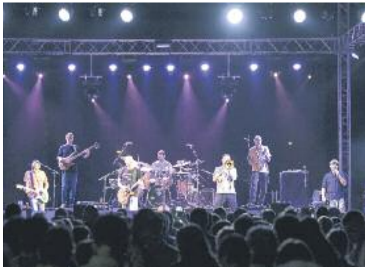
Celtas Cortos actuaran a la plaça de la Vila.

Aquest any se celebrarà la tercera edició de les Festes Radioak-