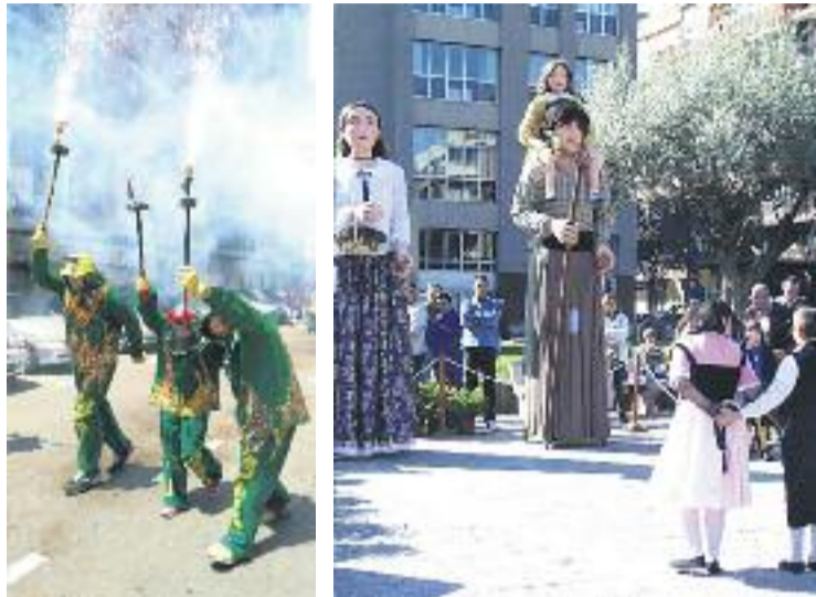
Les colles locals seran les protagonistes.

Al migdia, els bastoners de l'Esbart Dansaire de la ciutat actuaran a la plaça de l'Església. Un cop acabin l'espectacle, es farà la ballada de sardanes, a càrrec de la Cobla Premià, que deixarà pas a la Trobada gegantera. A partir de les cinc, a la porta principal de l'Ajuntament, hi haurà la plantada de gegants. Aquest any, les colles convidades són els Geganters i Grallers de Santpedor, els Gegants de