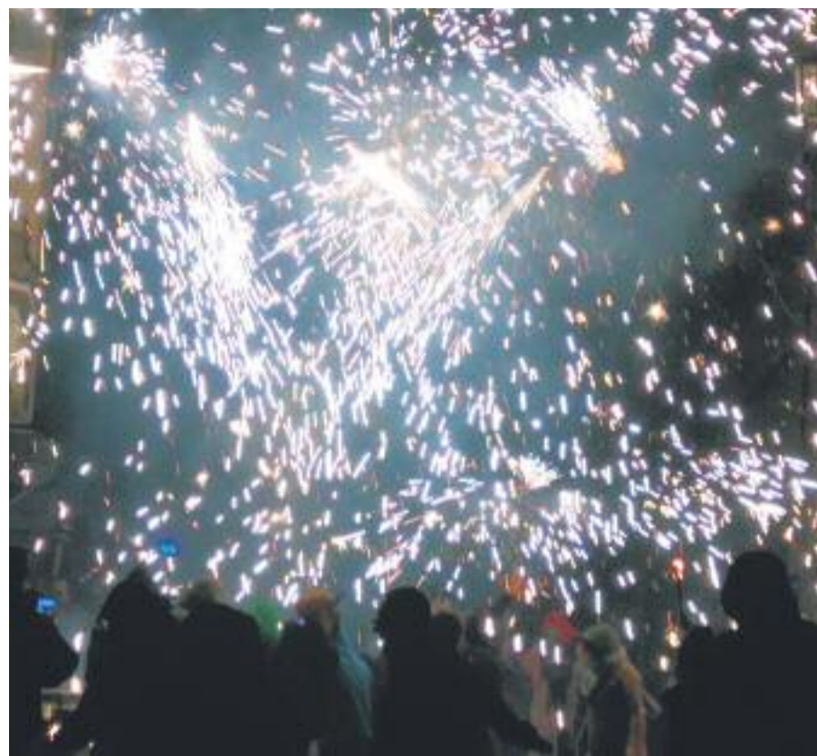
La Festa Major inclou activitats per a tots els públics.