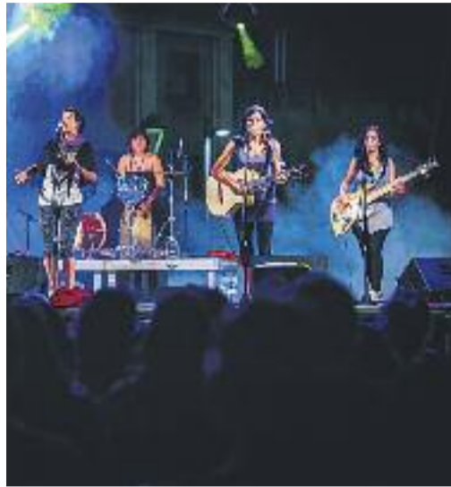
Muchachito actuarà dilluns a la plaça de la Vila.

Tarragona, arribarà fins a Santa Coloma per presentar el seu últim àlbum, Desglaç . Es defineixen com un grup de música festiva i combativa amb esperit feminista.