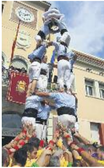
Els gegants i els castellers de la ciutat seran protagonistes.