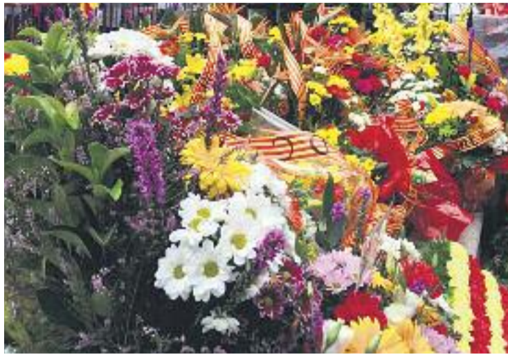
L'ofrena floral és un dels actes principals de la Diada.

El programa de Festa Major continuarà amb altres propostes com una visita guiada al Bosc de les Columnes, a la zona dels Encants de Sant Adrià, que finalitzarà amb un espectacle de beat box. Al mateix indret es podrà veure una competició de danses urbanes que començarà a les quatre de la tarda i s'allargarà fins a les nou de la nit.