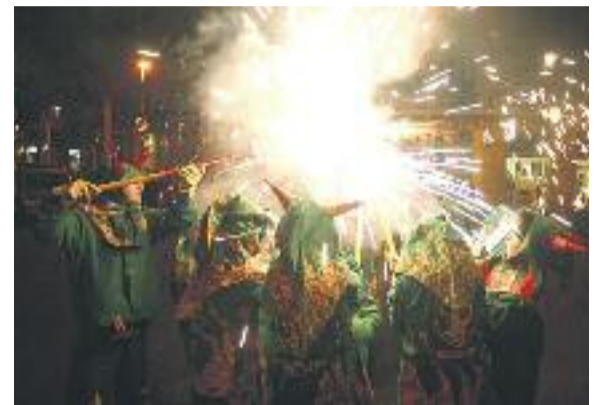
El programa de Festa Major inclou activitats per a totes les edats.