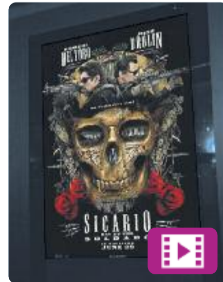
Sicario: el día del soldado Stefano Sollima

Benicio del Toro i Josh Brolin són els protagonistes d'aquesta cinta que explica la guerra que la policia i els càrtels mexicans de la droga mantenen en la frontera que separa aquest país i els Estats Units. Els agents segresten la filla d'un dels senyors de la droga, un atac de falsa bandera que vol provocar que els càrtels es barallin entre ells.