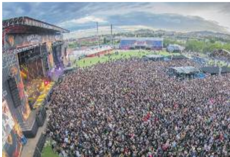
Una imatge de l'edició de l'any passat.