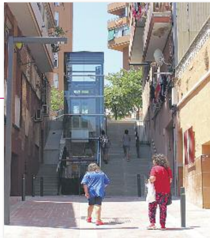
Ascensor d'Albert Llanas

Aquesta construcció valorada en 400.000€, suposa també la remodelació de les escales, renovació de l'asfalt i vorera, així com la millora de l'enllumenat i el clavegueram. S'inaugurarà durant aquest mes de juliol.