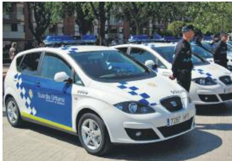
El cos de la Guàrdia Urbana incorporarà 12 nous agents.

La convocatòria es va aprovar el 7 de maig i aquesta setmana va començar el procés de selecció. Com totes les oposicions per entrar als cossos policials, hi ha