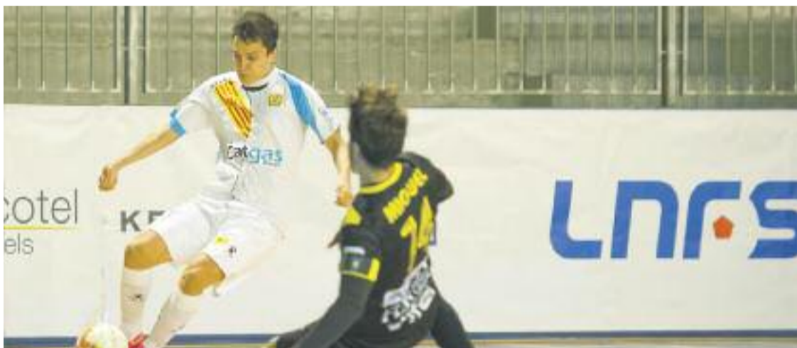
El club afronta una etapa nova, amb canvi de nom inclòs.

» El nou nom és vigent des de diumenge de la setmana passada » L'equip jugarà la semifinal de Copa Catalunya contra l'Escola Pia