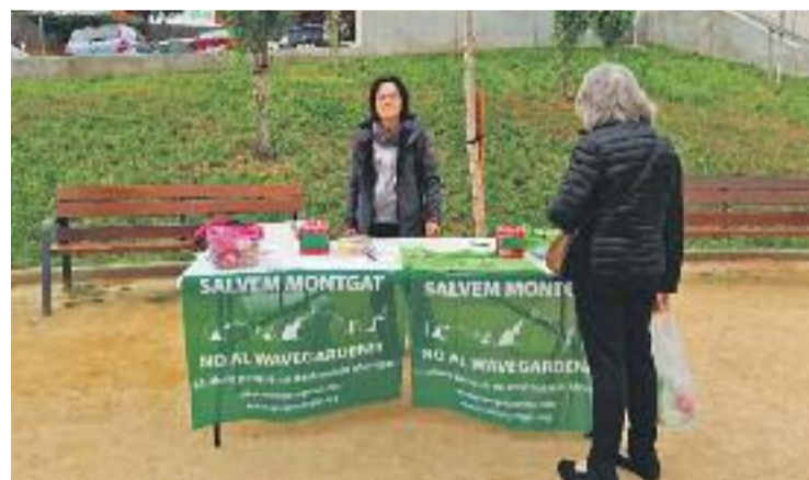
La plataforma Salvem Montgat fa temps que s'oposa al projecte.

El canvi d'opinió d'alguns grups, principalment d'ERC, fa molt difícil que el complex, de 48.500 metres quadrats, acabi instal·lant-se finalment al municipi. La decisió ha estat celebrada entre alguns veïns i la plataforma Salvem Montgat, que va néixer precisament per lluitar contra el gran complex esportiu que inevitablement transformaria la zona.