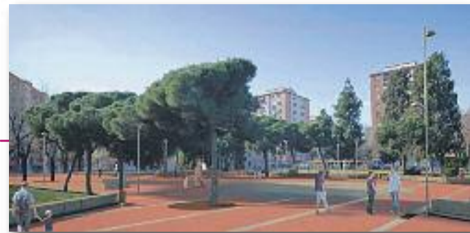
Imatge virtual de la Plaça Roja de Sant Roc

Els processos participatius han permès afegir propostes del veïnat per millorar el disseny original d'ambdues places.