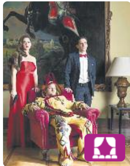
Filla del seu pare Hedda Gabler