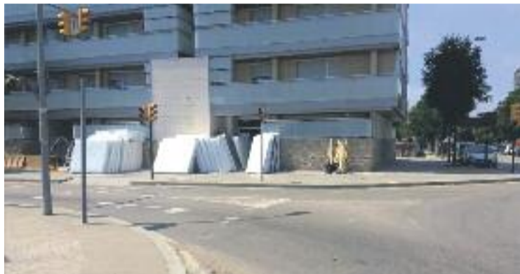
L'empresa propietària ha començat a moblar els pisos.