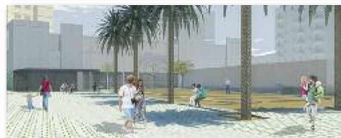
Imatge virtual de la Plaça Trafalgar