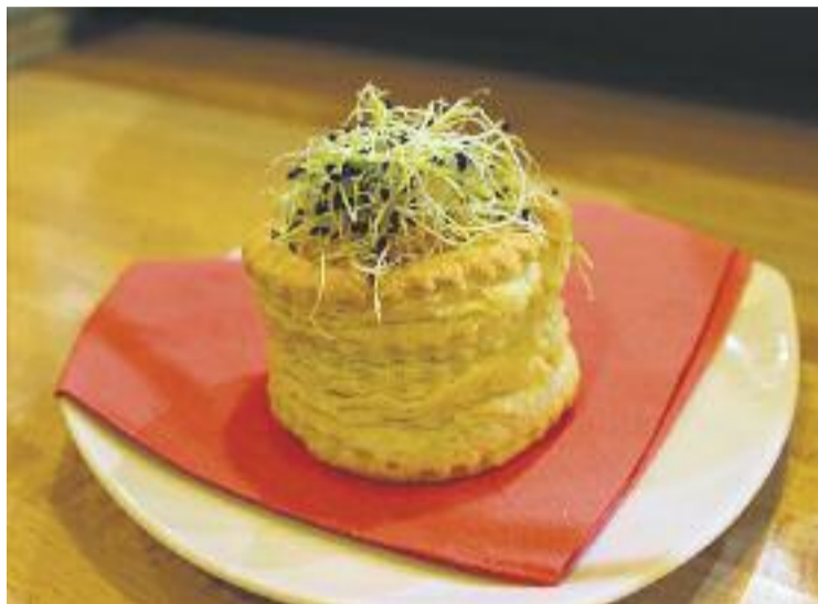
53 bars i restaurants oferien una tapa amb cervesa o vi.

El cap de setmana passat, els veïns de la ciutat van poder encarar la recta final cap al Rock Fest amb una ruta de tapes per diversos establiments del mu-