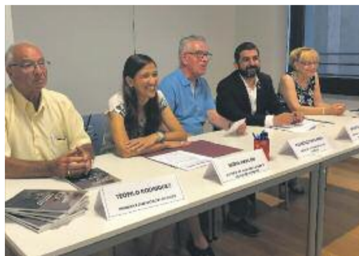
El Homrani es va reunir amb Aspanide.

El conseller es va comprometre a revisar el projecte urbanístic per convertir l'antiga escola Miguel Hernández en pisos tutelats per a persones de més de 65 anys, previst per a abans que acabi el mandat. L'antiga escola s'ha de rehabilitar per poder obrir els 57 habitatges que conformaran el primer edifici de pisos tutelats de la ciutat. Entre els projectes que es van començar a desencallar també hi ha l'obertura d'un centre de dia.