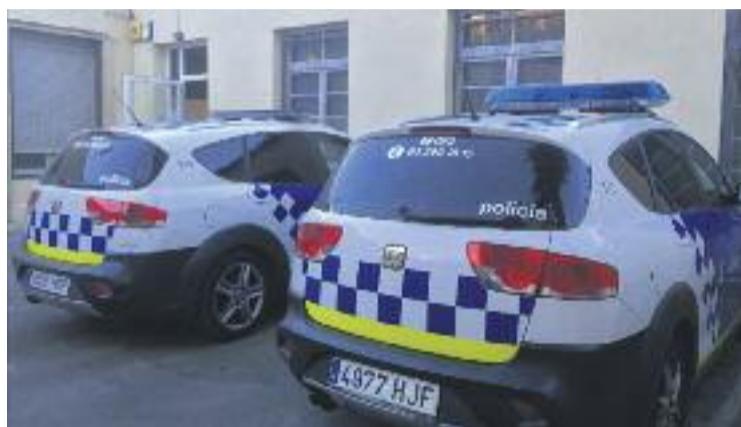
La Policia Nacional va detenir dimarts el cap de la Policia Local.

El procés judicial que està en marxa ara va arrencar el 2016 també a Montgat, on els agents investigaven el suposat frau en els contractes municipals a l'empresa Gespol, filial de SACYR. Presumptament, els consistoris contractaven els sistemes de control de trànsit de manera irregular i els caps de la Policia Local feien d'intermediaris a canvi d'una comissió. Tot i que l'operatiu es dirigeix des del jut-