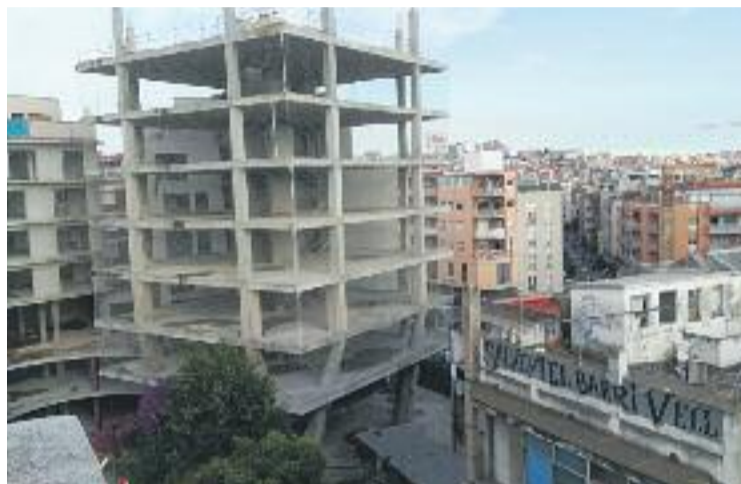
L'Ajuntament suspèn temporalment els enderrocs.

Tot i que la junta de govern va acordar la suspensió temporal dels enderrocs dels edificis antics per un màxim de sis mesos, alguns veïns de la zona no han abandonat les protestes. De fet, alguns fins i tot han començat a ocupar els edificis que han quedat buits. Són pisos que s'havien d'enderrocar per poder crear una avinguda que connecti el passeig Mossèn Jaume