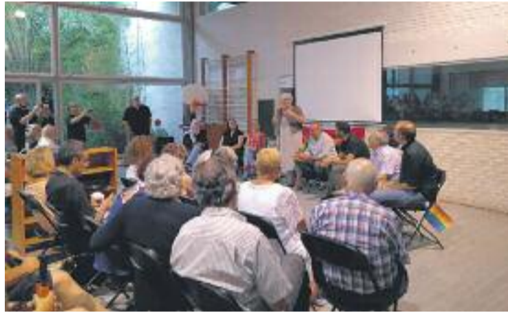
Intervencions dels regidors i l'alcalde del govern sortint.

L'acte es va celebrar una setmana després del Ple de la mo-