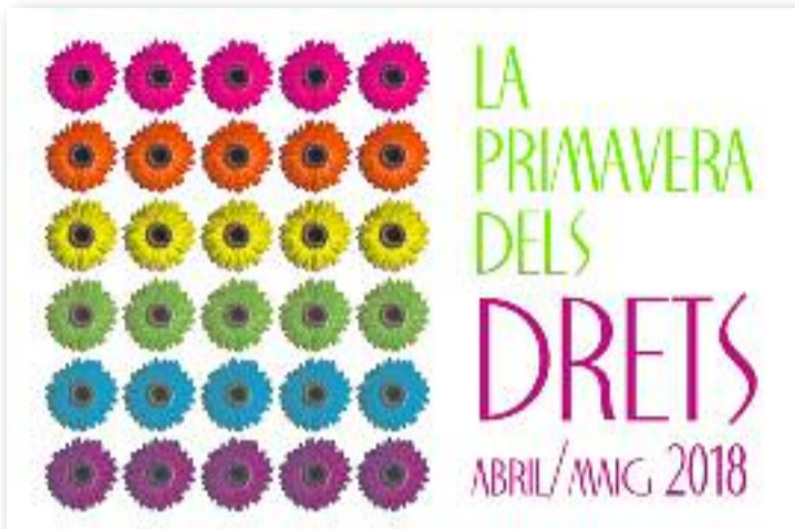
La proposta vol lluitar contra l'LGBTBifòbia a Santa Coloma.

L'acte central va tenir lloc ahir, coincidint amb el Dia de la Visibilitat Lèsbica. Es va presentar el curt 'Por Ellas' amb la presència de la directora, Shamp K, i es va fer un debat posterior. Dijous 17 de maig, coincidint amb el Dia Internacional contra l'Homofòbia, la Transfòbia i la Bifòbia, s'inaugurarà el Servei d'Atenció Integral a la Diversi-