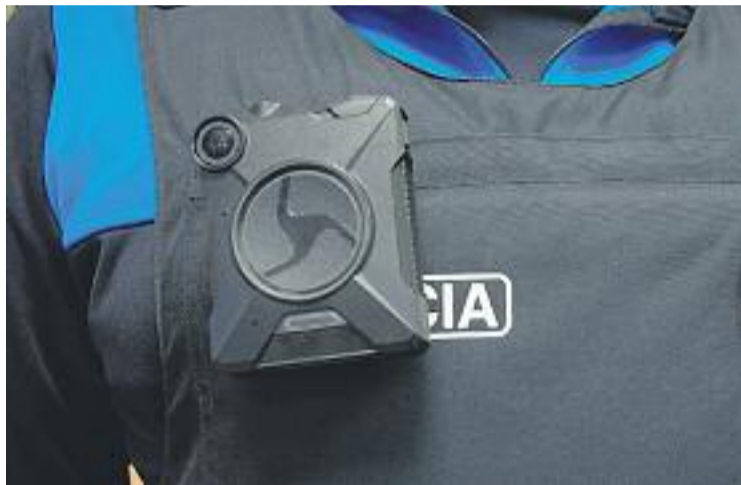
Els agents estan obligats a avisar que engegaran la càmera.

En tots aquests mesos, la policia ha activat la càmera de seguretat en dues ocasions, una al barri del Besòs i una al centre. L'avaluació que en fan és positiva: asseguren que, en avisar que connectaran la càmera, els possibles aldarulls acaben. Conclouen que malgrat haver-les engegat dues vegades, no van haver de presentar cap denúncia i, per tant, no va ser necessari