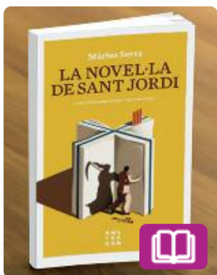
La novel·la de Sant Jordi Màrius Serra

Ambientada en el primer Sant Jordi d'una República Catalana, Serra ofereix un retrat satíric del món editorial on una sèrie de crims tenyeixen la diada en un bany de sang.