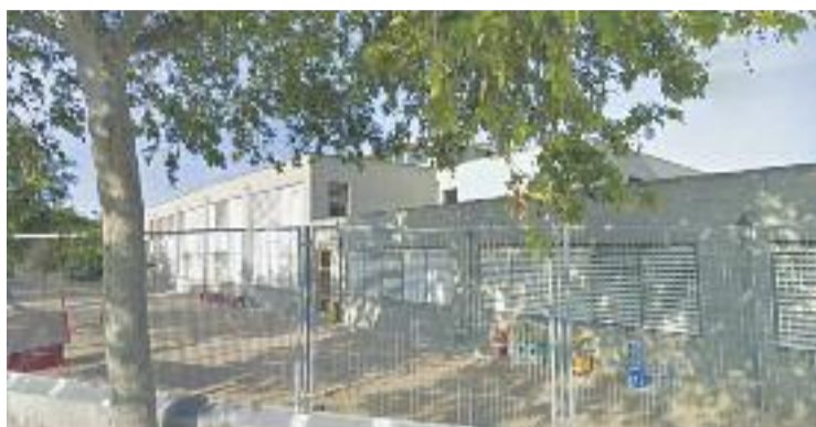
Dues propostes de millora a l'escola Salvador Espriu.

La proposta de més èxit ha estat la construcció d'una sortida d'emergència del menjador de l'escola Salvador Espriu, per