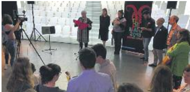
S'ha treballat per unes festes lliures de sexisme.

El vespre del 10 de maig es farà la Cremada del Dimoni i tots els actes que tradicionalment la precedeixen, com el Ball de l'Àliga o el Piromusical, on totes les cançons seran de dones vocalistes. Aquella mateixa nit hi haurà els concerts a la plaça del Centenari de Txarango, Indestructible i Tremenda Jauria, un grup que ba-