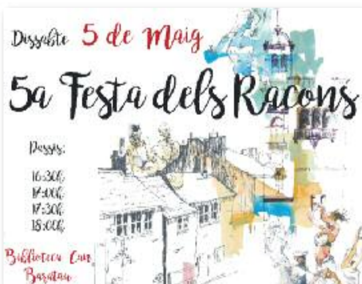
L'objectiu és trencar amb l'entorn habitual de les arts escèniques.

A cada racó hi haurà la creació artística d'una persona o grup participant. El públic les anirà descobrint tot passejant per Tiana acompanyat d'un guia. L'objectiu final és descontextualitzar les arts escèniques del seu entorn habitual per apropar-les a nous públics. Canviant els espais tradicionals, com teatres, escenaris o sales, es vol trencar la frontera entre l'artista i l'espectador i crear un clima de naturalitat i intimitat en relació a les arts. Enguany, la festa tindrà lloc dissabte 5 de maig amb quatre passos cada mitja hora: a