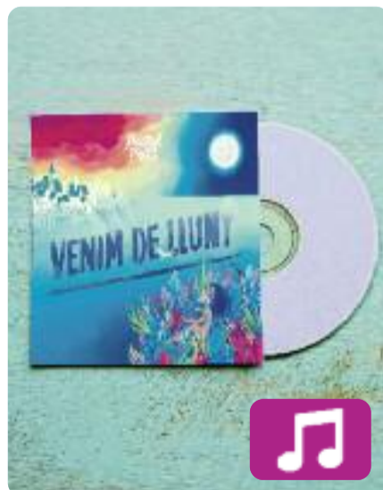
Venim de lluny Doctor Prats

Doctor Prats és una de les formacions de trajectòria més intensa del panorama musical català. El passat 11 d'abril van complir tres anys com a banda i el pròxim 4 de maig publicaran el seu tercer disc, Venim de lluny .