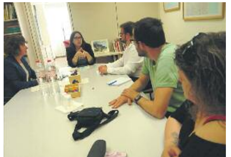
Ensenyament es manté ferm en la seva proposta de director.

A la tarda, l'AMPA de Les Palmeres es va reunir en assemblea per valorar els pròxims passos a seguir. Consideren que l'ambient "no és agradable" i no volen que repercuteixi en els alumnes. De moment, a l'espera que es posi una data a la nova reunió, mantindran la intensitat de les protestes.