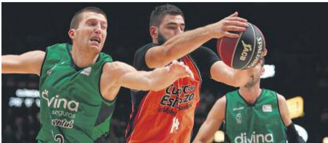
Un moment del partit d'anada a la Fonteta.

» Els verd-i-negres volen continuar fora de la zona del descens » Els de Carles Duran van guanyar 'in extremis' a la pista del San Pablo