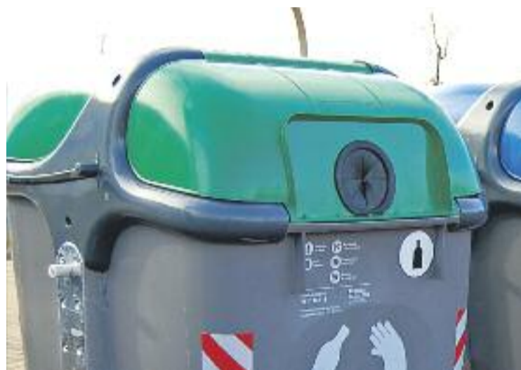
El sector hostaler consumeix la meitat del vidre que es produeix.

Amb el nou contracte engegat el 2017 s'ampliaran els punts de recollida selectiva de residus. El sector hostaler consumeix la meitat del vidre que es produeix. Per a finals de 2020, l'objectiu és reciclar la meitat dels residus generats. Segons les últimes dades de 2017, els habitants de Sant Adrià van reciclar 441 tones de vidre, una mitjana de 12 quilos per persona.