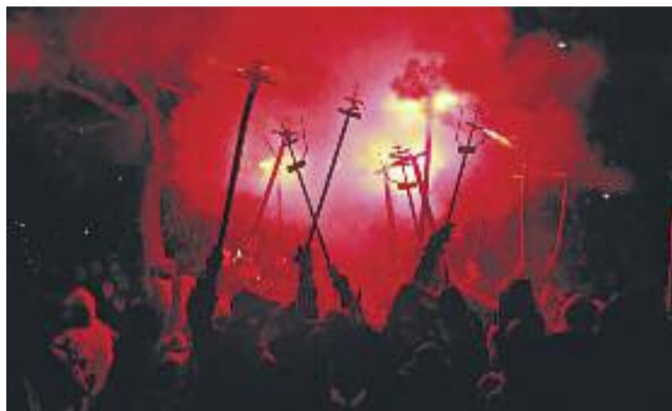
Els diables seran els protagonistes d'aquesta edició.

La Festa Major començarà aquest dissabte amb el popular concert de Sant Jordi, que aquest any arriba a la 26a edició. Els artistes convidats són la Coral del CRiC de Montgat, l'Orphéon Banyulenc i la Chorale Libera, de la Catalunya Nord. Una de les altres