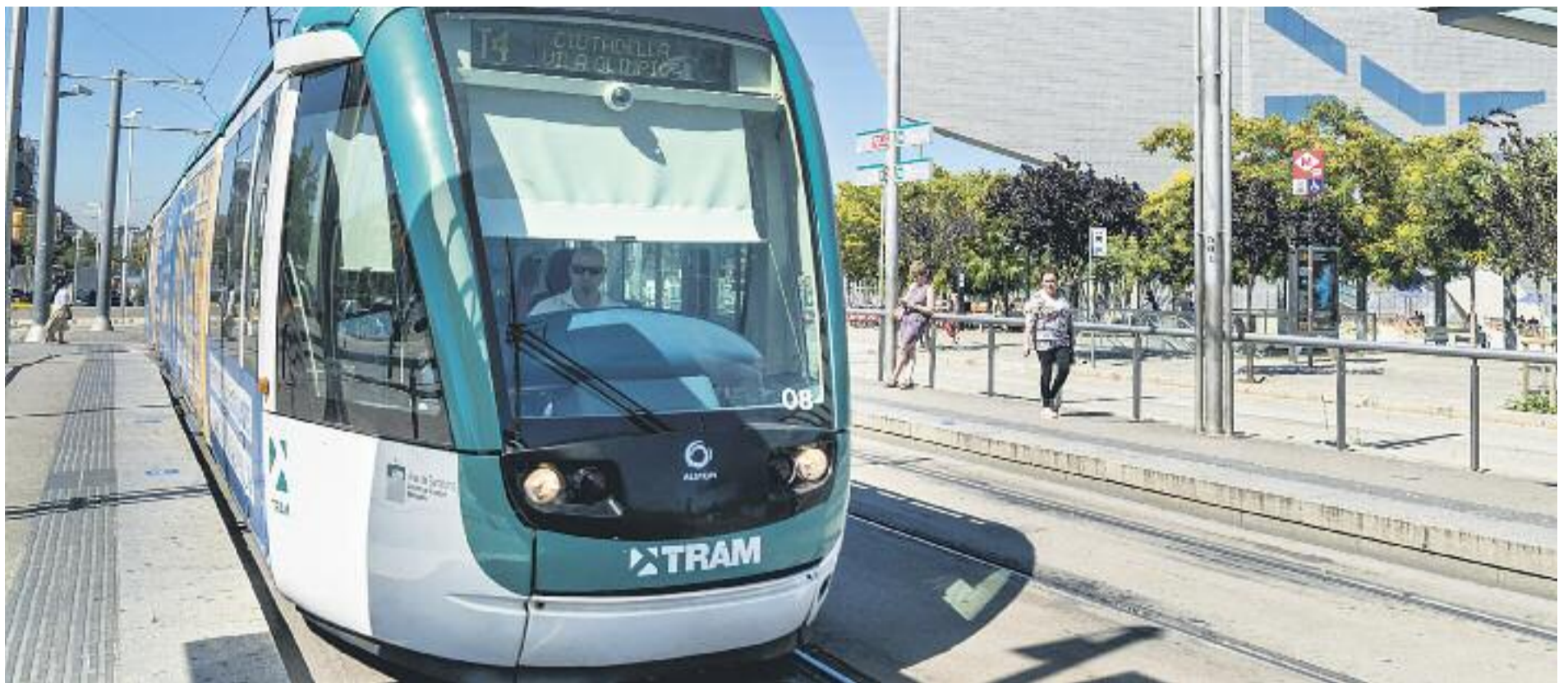
El Barcelonès Nord haurà d'esperar la unió del tram rebutjada per Barcelona.