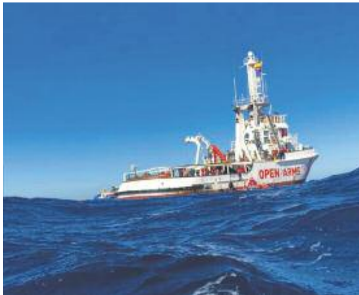
El vaixell Open Arms fa setmanes que no pot sortir al mar.