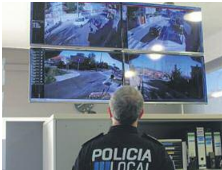
Només funcionen 7 de les 22 càmeres pressupostades.

Des de l'Associació de Veïns i Veïnes de Les Costes denuncien aquest retard i reclamen que s'acabin d'instal·lar al més aviat possible. "Ens agradaria pensar que la seguretat no té color po-