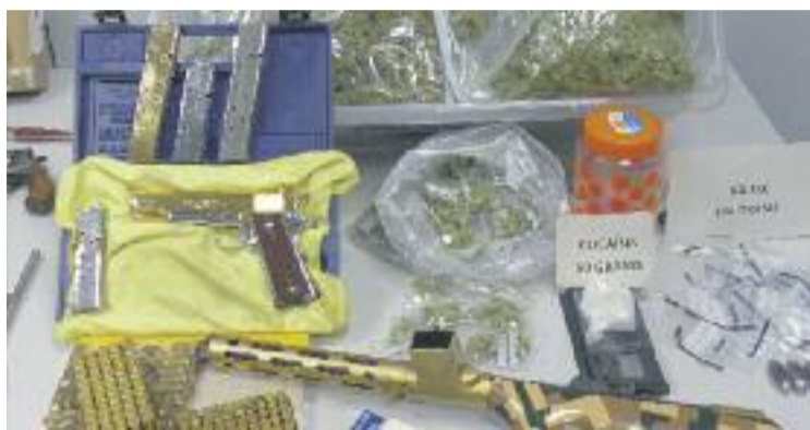
La droga requisada es podia vendre il·legalment per 70.000 euros.

En un dels pisos van detenir una dona de 32 anys, de nacionalitat espanyola i veïna de Sant Adrià del Besòs, que ja ha quedat en llibertat amb càrrecs. Se l'acusava d'un delictes de tràfic de drogues i de tenir la llum punxada. Durant la investigació, els agents van comprovar que els tres pisos estaven connectats de manera fraudulenta i precària a la xarxa elèctrica comunitària, fet que va despertar indicis que en aquests pisos s'hi