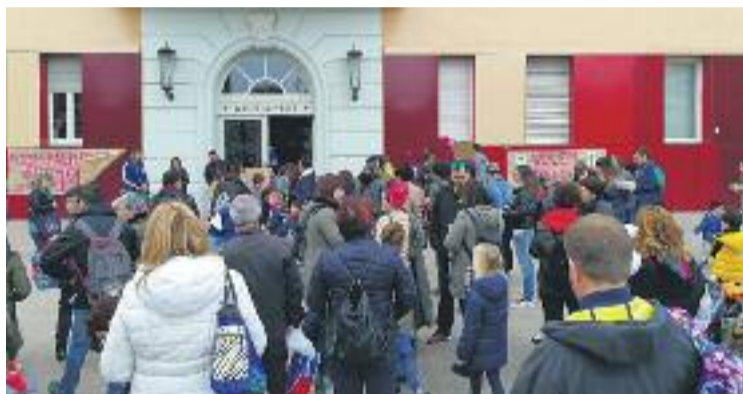
Dimarts van començar les mobilitzacions davant l'Ajuntament.

Amb el suport del 80% del claustre i de més de 250 famílies, han sol·licitat a l'administració que faci marxa enrere en el nomenament del nou equip directiu. Però l'inspector en cap, Jordi Roca, s'acull a la normativa i a la legalitat del procés.