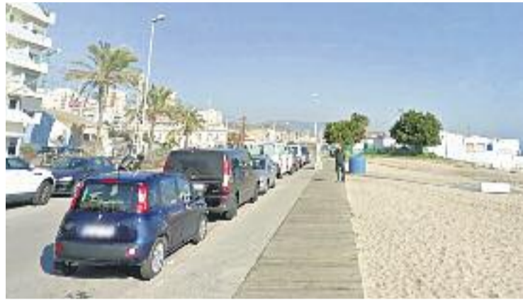
L'Ajuntament vol tancar al trànsit el Passeig Marítim.