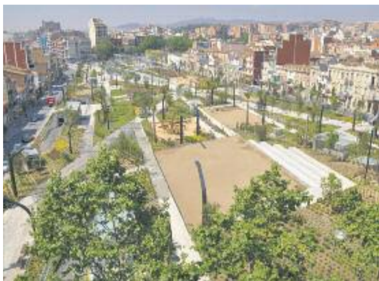
La Fira de Primavera es farà a la plaça Pompeu Fabra.