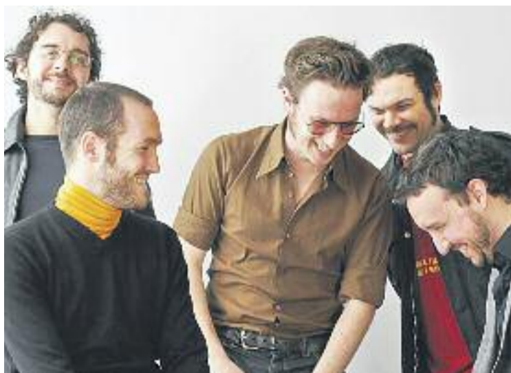
Mishima portarà el seu nou disc 'Ara i res' a la ciutat.

Un altre dels espais emblemàtics per on passaran diversos dels artistes convidats al Telefèric Fest serà El Sarau, un club de música i concerts situat a prop de la costa. L'últim dels espais és el Panoràmic de Montgat. En