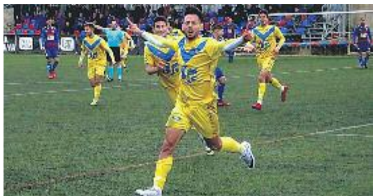
El Bada fa quatre jornades que guanya a domicili.