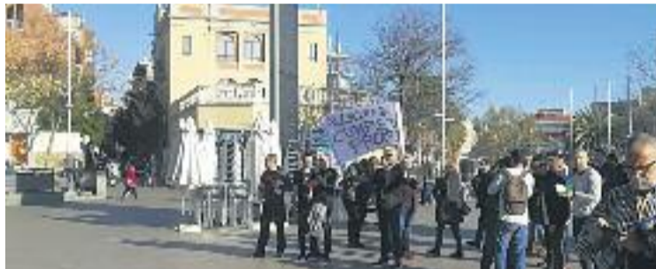
Alguns agents van protestar davant l'Ajuntament durant el Ple.

Unes reivindicacions que han rebut el suport de Ciutadans, que va portar la qüestió al Ple de