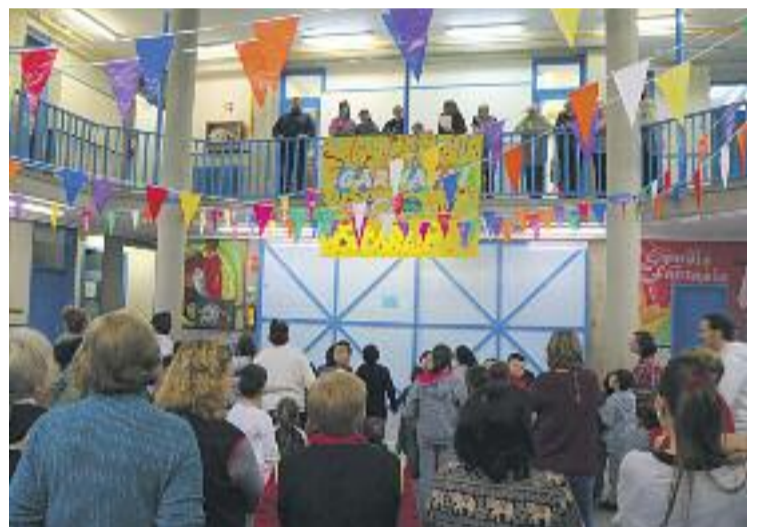
Una imatge d'arxiu del Carnestoltes organitzat pel Casal.

El Casal Infantil La Mina és una entitat sense ànim de lucre creada pels mateixos veïns i veïnes per oferir un servei d'acció social per als infants del barri.