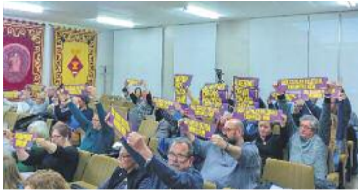
Assistents al Ple mostrant pancartes a favor dels presos.

Un alliberament que ha de servir, segons la moció, "com a