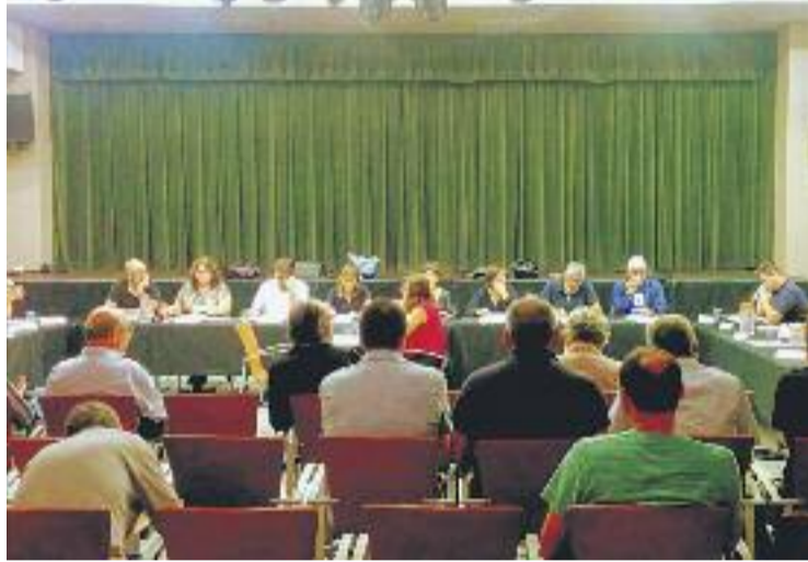
Imatge d'arxiu d'un Ple de l'Ajuntament.

Al comunicat, PDeCAT-Unió, ERC, ICV, PRE i MES exigeixen