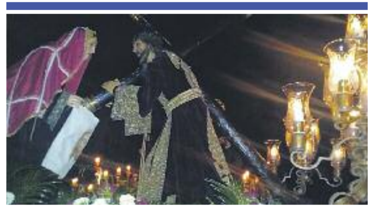
TRADICIÓ ▶ La Processó del Silenci va recórrer dijous els carrers de Badalona. Enguany celebrava els 390 anys d'història i es consolida com la més antiga de Catalunya. @RogeGoGa

La celebració es remunta a principis del segle XVI, quan disset naus pirates van desembarcar a Badalona. Des de fa vint anys, la ciutat es transforma, durant uns quants dies, en un municipi medieval per commemorar aquest esdeveniment històric.