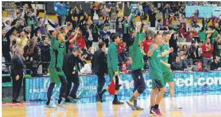
L'eufòria de l'equip després de l'últim triomf a l'Olimpic.