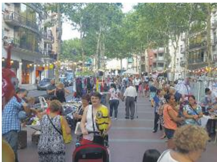
Els carrers de Santa Coloma s'omplen per Setmana Santa.

La ciutat amb més densitat d'establiments és Santa Coloma, que en té 10,99 per cada miler