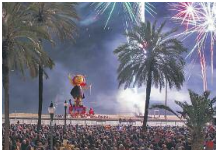
Badalona ja fa el compte enrere per a les Festes de Maig.

I és que el dimoni és l'element central de l'"Encén la metxa!", que s'allarguen tot el mes d'abril. En diverses ocasions, el dimoni pren protagonisme i es converteix en un personatge destacat, com a la Geocerca, més coneguda com La ruta del Dimoni a Badalona, una passejada històrica pel municipi més tradicional i festiu. Seguint un joc de pistes i amb l'ajuda d'un dis-