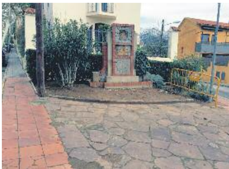
Es preveu que les obres finalitzin abans del 10 de juny.

Al Ple celebrat aquest dimarts, Junts per Tiana va presentar una moció per aturar les obres del tram final del carrer Matas fins que el Consell Municipal d'Urbanisme no les analitzi. Argumentaven que la ciutadania no estava informada dels treballs de reurbanització de la via i demanaven que se sotme-