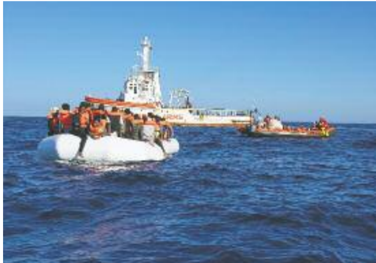
El vaixell Open Arms fa setmanes que no pot sortir al mar.