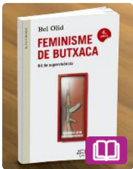
Feminisme de butxaca Bel Olid

El 8 de març es commemora el Dia Internacional de la Dona Treballadora i és un bon moment per llegir Feminisme de butxaca: kit de supervivència de Bel Olid.