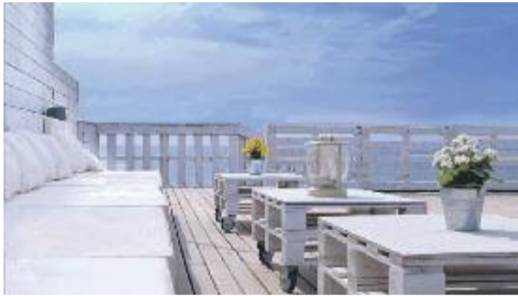
La concessió era improrrogable.

Per això, des del govern municipal es prioritza que l'activi-