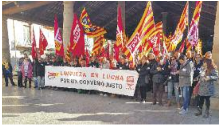
CCOO i UGT han convocat cinc dies de vaga.

Un diàleg a través del qual els sindicats volen aconseguir una revisió i un increment salarial, així com diverses reclamacions pel que fa a l'antiguitat dels treballadors, la classificació professional i els permisos. UGT i CCOO qualifiquen d'"intransigent" l'actitud de la patronal i adverteixen, a través d'un comunicat conjunt, que no con-