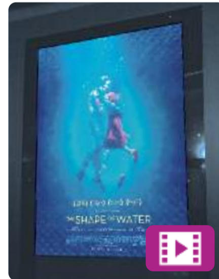
The shape of water Guillermo del Toro

La darrera guanyadora de l'Oscar a la millor pel·lícula és The shape of water . Explica la història de l'Elisa, una jove muda que treballa netejant un laboratori d'un projecte secret del govern nord-americà durant la Guerra Freda.