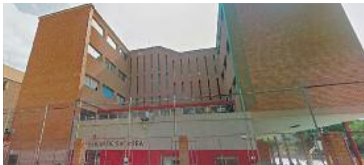
Els dos primers grups començaran a la Ferran de Sagarra.

El consistori celebra l'anunci fet per la Generalitat però recorda que la seva prioritat era impulsar a la ciutat dos nous instituts-escola. Es tracta d'un tipus de centres que aglutinen en un mateix equipa-