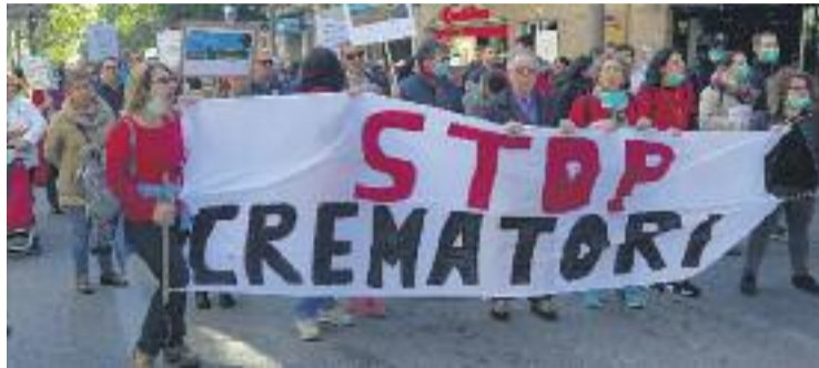
La manifestació va reunir unes 300 persones.

La marxa va sortir de l'estació de Renfe i va acabar als terrenys de la Ronda Litoral on l'empresa vol començar a aixecar el complex funerari abans de l'estiu. Allà, els activistes van explicar els pròxims passos a fer un cop han presentat el contenciós administratiu. El pri-