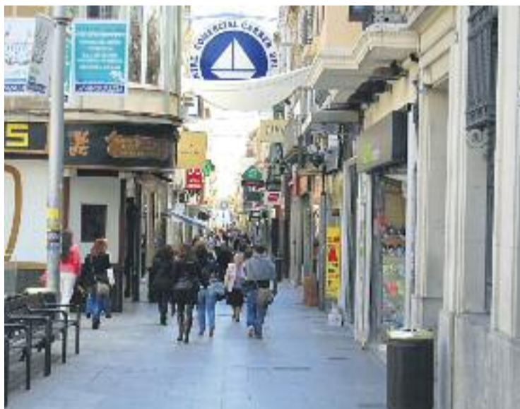
Els tècnics visitaran comerços aleatòriament.

Els encarregats de desenvolupar aquesta campanya sobre el terreny seran tècnics de la Diputació de Barcelona acreditats per l'Ajuntament de Badalona, que s'adreçaran aleatòriament als establiments comercials de tota mena d'una zona prèviament delimitada i els informa-