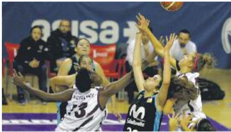
Les adrienenques ja van guanyar a la primera volta.