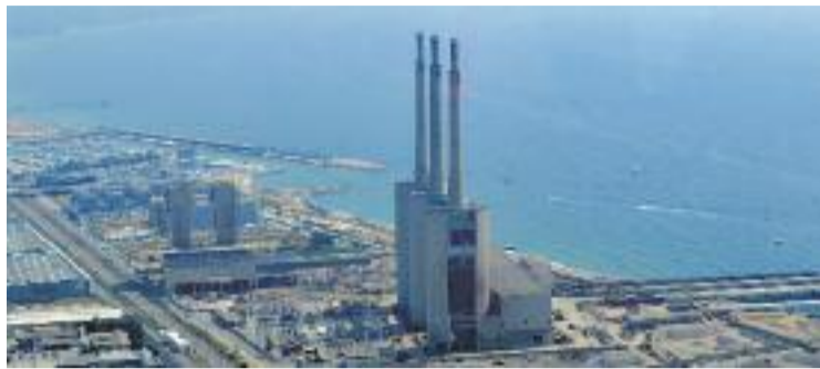
El pla preveu conservar les tres Xemeneies.

En el primer esbós del projecte redactat pel Departament de Territori i Sostenibilitat de la Generalitat, al qual ha tingut accés Línia Nord , el PDU preveu construir 1.719 habitatges. En paral·lel a la redacció de l'esbós, la Generalitat també ha encarregat un estudi ambiental estratègic que ha dut a terme la consultoria Estudi Ramon Folch & Associats. En aquest estudi, la consultoria calcula que la creació dels habitatges que preveu el departament suposaria l'arribada de 4.600 nous veïns al front litoral. L'esbós i l'estudi són orientatius i no necessàriament vinculants però són les primeres propostes sobre paper que ha