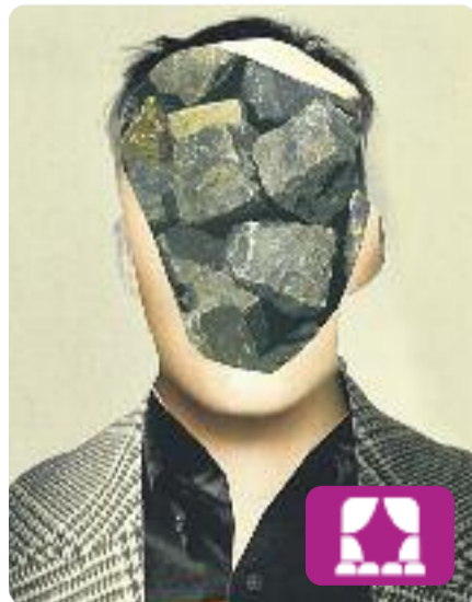
Sopa de pollastre amb ordi Arnold Wesker

Ambientada a Londres i abastant més de vint anys, de 1936 a 1956, Sopa de pollastre amb ordi explica la història d'una família de classe obrera, els Kahn, en un món que canvia a tota velocitat. L'obra mostra diferents posicionaments davant la vida, alhora que construeix un fresc familiar emocionant i colpidor.