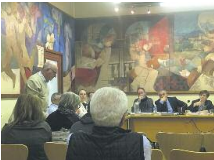
Una imatge del Ple de dimarts.