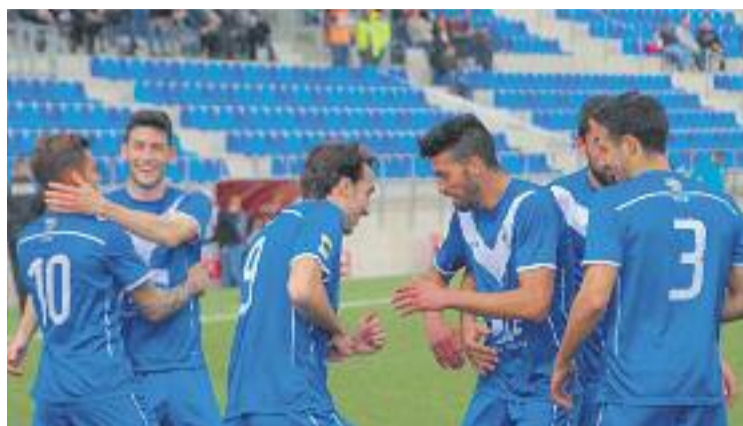
Una imatge que ho diu tot: el Bada viu un moment dolç.

Tot i aquesta bona dinàmica recent, González va voler que to-