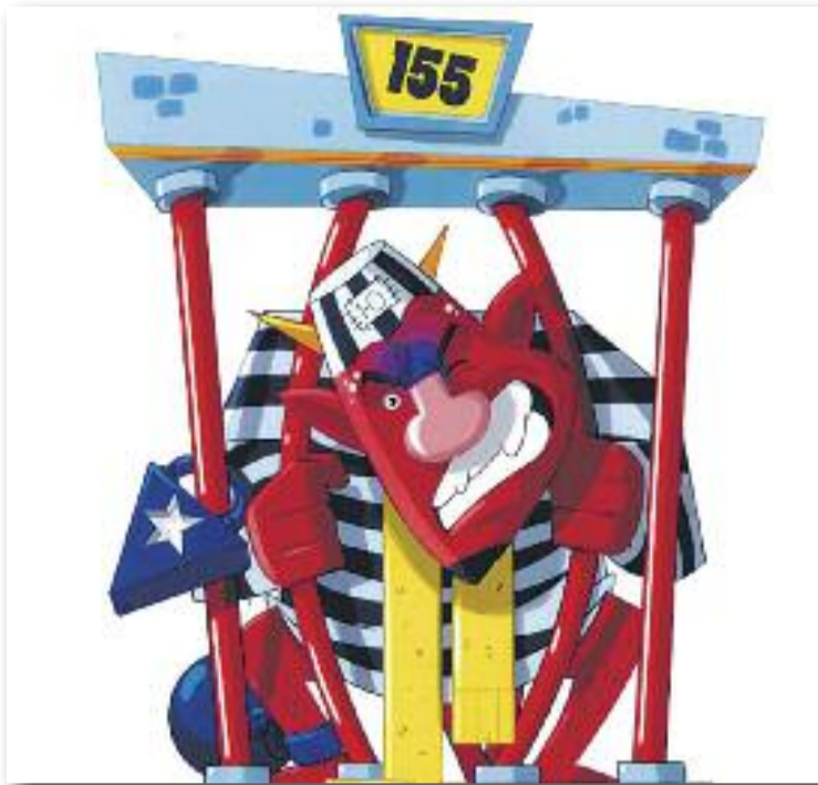
El Dimoni que va cridar llibertat és el disseny guanyador.