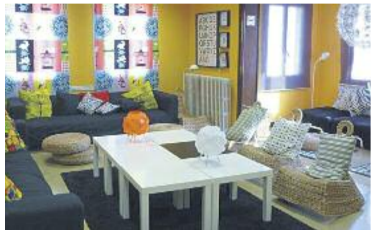
Les imatges guanyadores s'exposaran a l'Espai Jove.

El jurat decidirà els guanyadors i els finalistes el 9 d'abril. Les imatges finalistes s'exposaran a l'Espai Jove del 19 d'abril al 31 de maig i se'n publicarà una selecció a la Revista municipal de Montgat del maig.