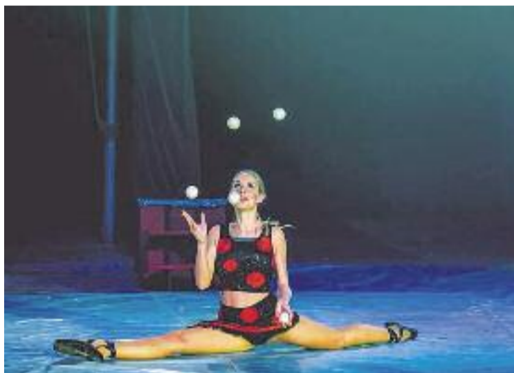
Els malabarisme seran part de l'espectacle.