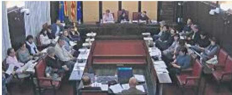
Una imatge del Ple de dilluns.

El Ple també va demanar que fins que aquesta excarceració no es produeixi, el vicepresident Oriol Junqueras, el conseller d'Interior Joaquim Forn, i els presidents de l'ANC i Òmnium, Jordi Sánchez i Jordi Cuixart, siguin traslladats a presons catalanes. "Exi-