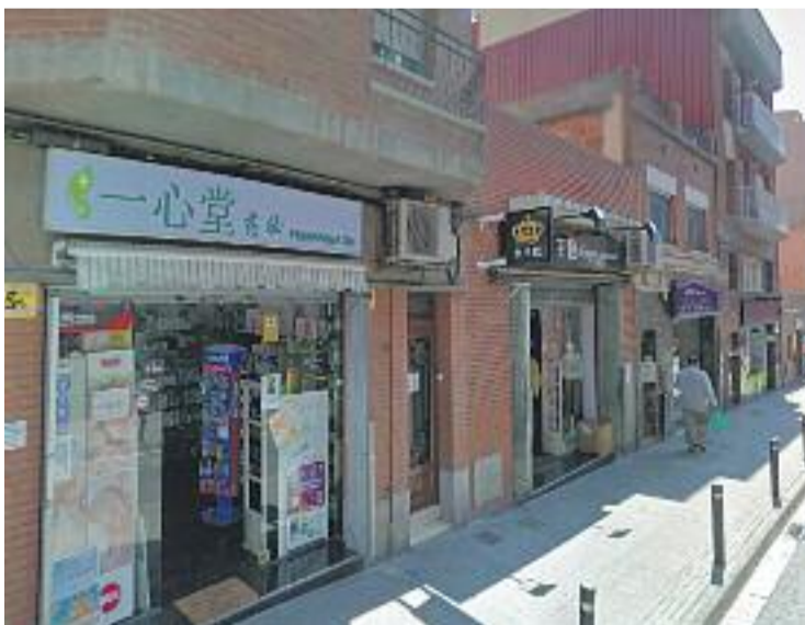
Fondo acull molts comerciants xinesos.

Aquesta és una de les mesures aprovades per l'assemblea de comerços associats celebrada dimarts. Els socis de l'ACI van valorar molt positivament la