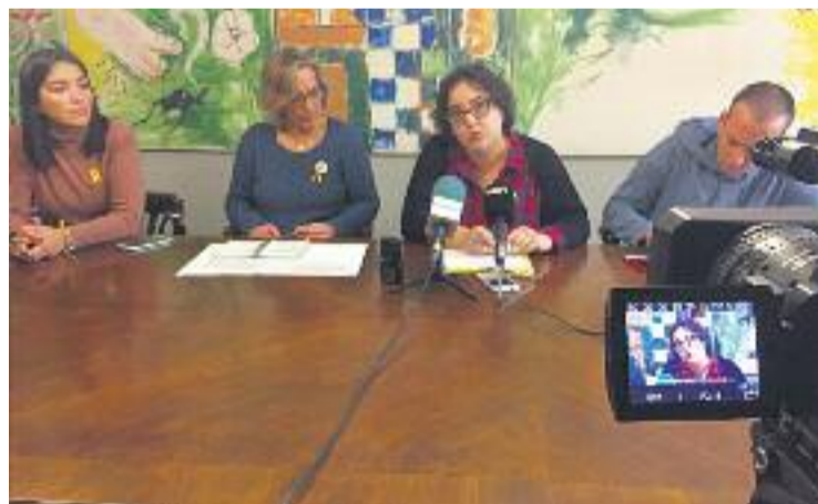
Junts, ERC i CUP es van explicar dilluns en roda de premsa.