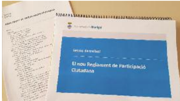
Es poden fer aportacions per via telemàtica.

L'actual reglament de participació de l'Ajuntament va ser aprovat pel Ple municipal el