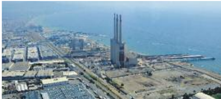
El document no detalla quin és el futur de les Tres Xemeneies.

La Plataforma per a la Conservació de les Tres Xemeneies ha tingut accés a l'esbós complet i avui han organitzat una jornada d'informació i participació al Casal de Cultura per compartir-ne els detalls amb els veïns. L'acte co-