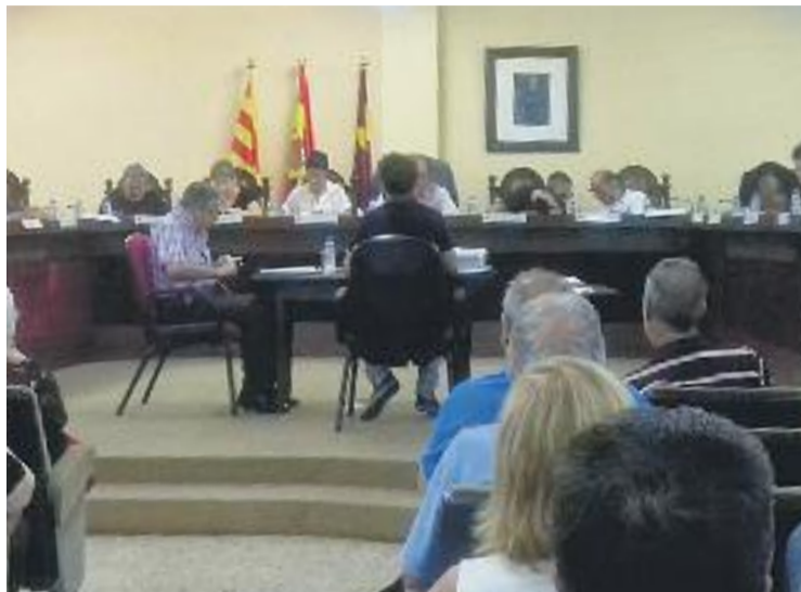
Una imatge del Ple celebrat dilluns.

D'altra banda, el Ple també va aprovar una moció del PSC, ICV-EUiA i la regidora no adscrita en defensa del model d'immersió lingüística a les escoles catalanes. Tots els grups hi van donar suport excepte Ciutadans i el PP que hi van votar en contra. D'altra banda, alguns regidors que van votar a favor van retreure alhora al PSC que donés