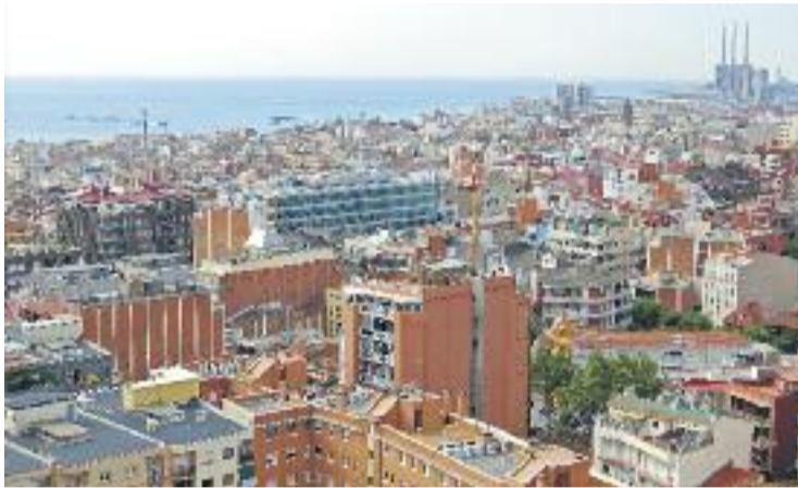
Els preus de lloguer han pujat entre el 24% i el 28% en tres anys.

L'estudi reconeix les dificultats que té la ciutadania per mantenir-se en l'habitatge propi i una de les causes que assenyalava és l'increment del preu de lloguer entre el 24% i el 28% a diverses zones de l'àrea metropolitana entre el 2014 i el 2017. "Es constata que els preus de l'oferta són clarament superiors als preus demandats i als dels contractes signats", explica l'informe. Concretament, hi ha una gran proporció de l'oferta de lloguer situada per sobre dels 1.000 euros mentre que la proporció més gran pel que fa a la