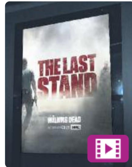
The Walking Dead Segona meitat de la 8a temporada

El passat 25 de febrer es va estrenar la segona meitat de la vuitena temporada de The Walking Dead .