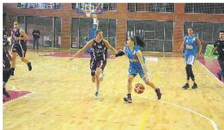
Les adrianenques van guanyar el partit que es va jugar al Marina.