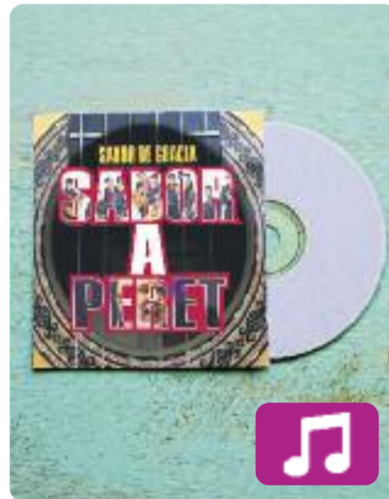
Sabor a Peret Sabor de Gràcia

Un àlbum d'homenatge al pare de la universalitat de la rumba catalana, Pere Pubill Calaf, més conegut com a Peret. Això és Sabor a Peret , el nou disc de Sabor de Gràcia, que es presentarà a la sala Luz de Gas el 15 de març.