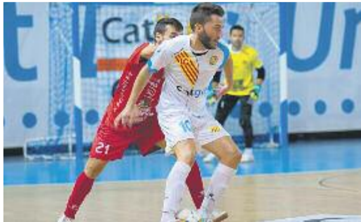
Els colomencs estan mostrant una mala versió al Pavelló Nou.

afrontaran el partit de la vint-i-tresena jornada de la Divisió d'Honor contra el cuer, el Gran Canària, que només ha sumat un punt a domicili en les 11 jornades que ha jugat lluny de l'illa.