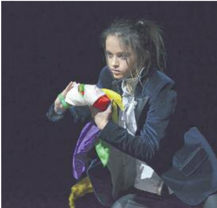
La Maga Game serà una de les protagonistes de la gala.