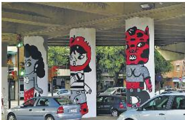
Diversos artistes ja han pintat un centenar de columnes.