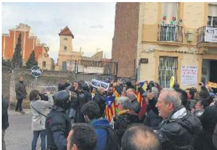
Concentració de manifestants a la Casa de l'Heura.

Durant l'acte a la Casa de l'Heura, desenes de veïns van rebre el delegat amb pancartes i llaços grocs i els Mossos d'Esquadra van intervenir per obrir un passadís que permetés a Millo i la resta d'autoritats entrar el recinte.