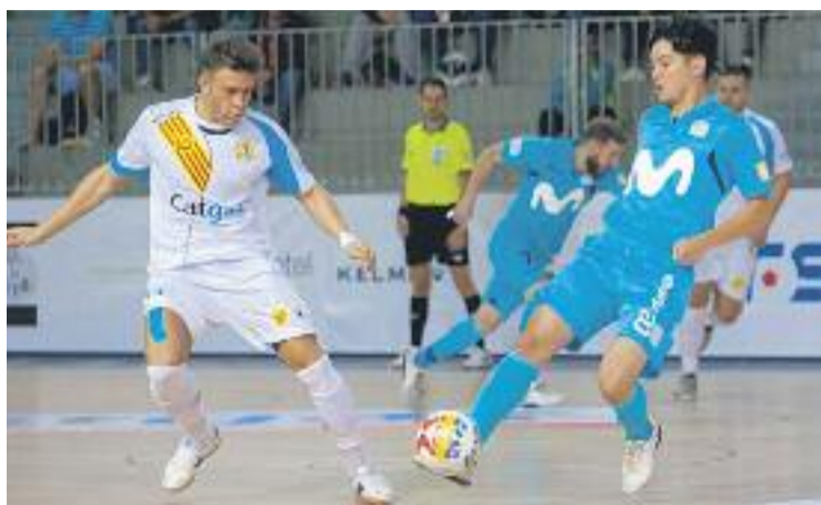
Un moment del partit de la primera volta al Pavelló Nou.