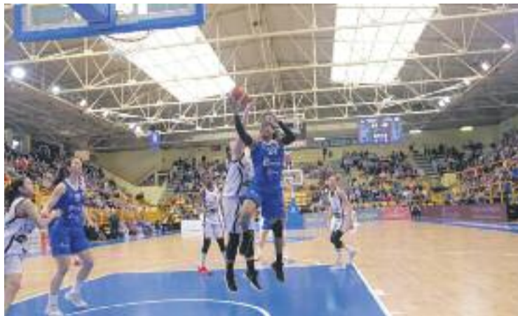
Un moment del partit al Würzburg Park.

Però l'esperit i l'orgull del conjunt lila va fer que l'equip no abaixés els braços, tot el contra-