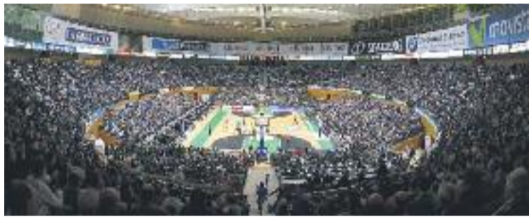
El club insisteix en la seva falta de liquiditat.

Les alarmes, doncs, continuen sonant a l'Olimpic, i el club emet aquest missatge amb un destinatari clar: l'Ajuntament. Després que la setmana passada es pogués desbloquejar el pagament de 80.000 euros del consistori al Joventut en el marc del contracte de patrocini, ara cal veure com es tramita l'ajuda generada pel cànon que paga a l'Ajuntament