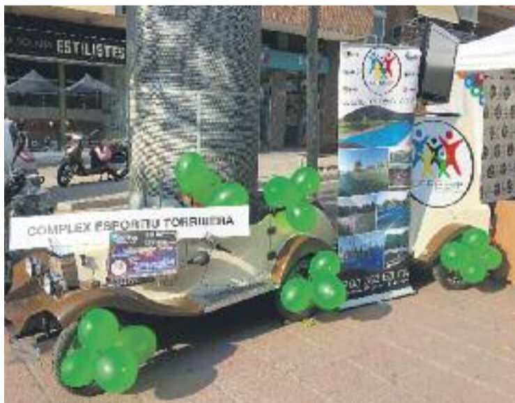
L'assemblea decidirà la data de l'Open Nigth.

A l'espera de les valoracions de l'assemblea, l'ACI considera molt positiva la feina feta durant el 2017, en què s'han pogut dur a terme totes les activitats previstes. Sens dubte, un dels obstacles més grans als quals el comerç colomenc ha hagut de fer front durant l'any passat ha estat el tancament de Fondo Comerç. Amb tot, i a l'espera de la valoració oficial, l'ACI considera bona la gestió d'aquesta fallida i els comerciants asseguren que han pogut assumir totes les activitats que organitzava aquest eix comercial. Entre altres, la tra-