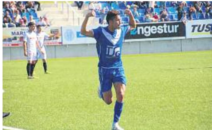
Els escapulats van guanyar per 4-1 en la primera volta.

va ser nefasta. Bona part de la transformació de l'equip illenc es basa en la solidesa que presenta al municipal de Santa Eulària, on no perd cap partit des del passat 12 de novembre, quan l'Ontinyent va aconseguir una victòria per la mínima (0-1).