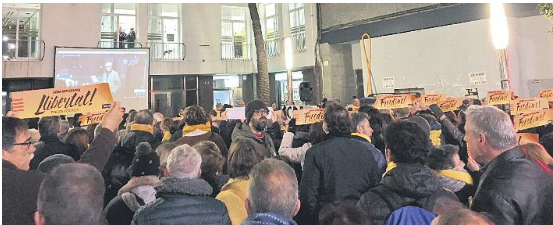
El clam per l'alliberament dels presos ha protagonitzat les darreres mobilitzacions de l'independentisme a la comarca.