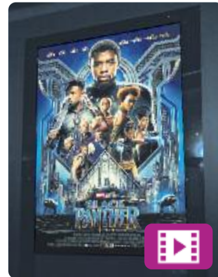
Black Panther Ryan Coogler

Black Panther és la continuació de Captain America: Civil War i explica la història del jove T'Challa, un superheroi negre que torna al seu país, Wakanda, per ser coronat rei.