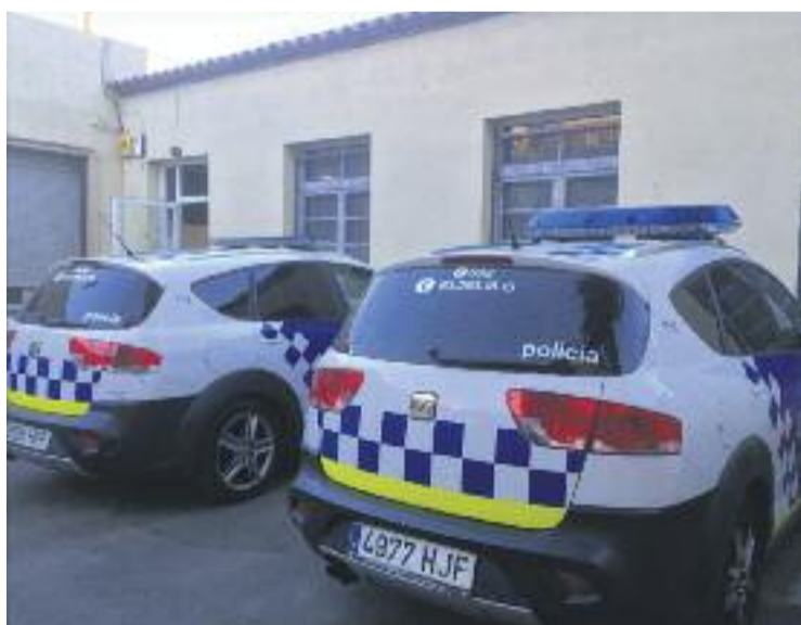
La Policia Local i els Mossos han detingut 17 persones en dos anys.

L'informe entregat a la junta reflecteix com les infraccions que s'han repetit més durant l'últim any a Tiana són els delictes contra el patrimoni, que engloben ro-