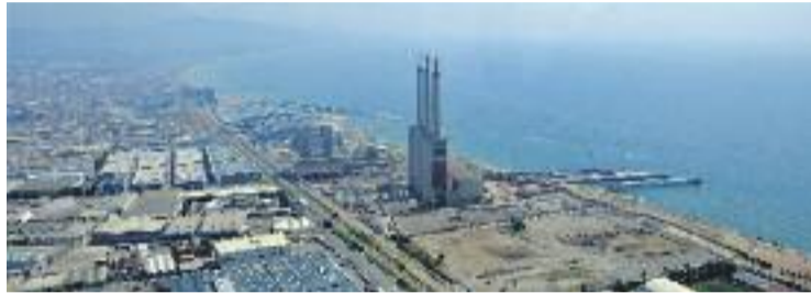
La Generalitat té enllestit el primer document del PDU.

Fonts del departament de Territori i Sostenibilitat expliquen a aquesta publicació que el document aposta per dotar els terrenys d'usos residencials i econòmics. Dit d'una altra manera, per la construcció de pisos i seus d'empreses. D'altra banda, el document també preveu un estudi ambiental de la zona, actualment en fase de