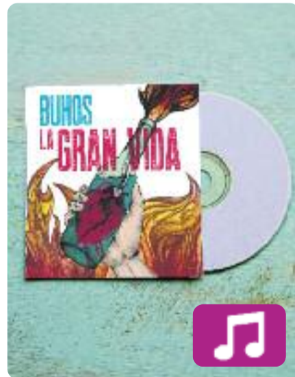
La gran vida Buhos

Buhos acaba de publicar el seu nou disc La gran vida , després que a mitjans de gener la banda llancés el seu primer avançament, el videoclip de la cançó Volcans .