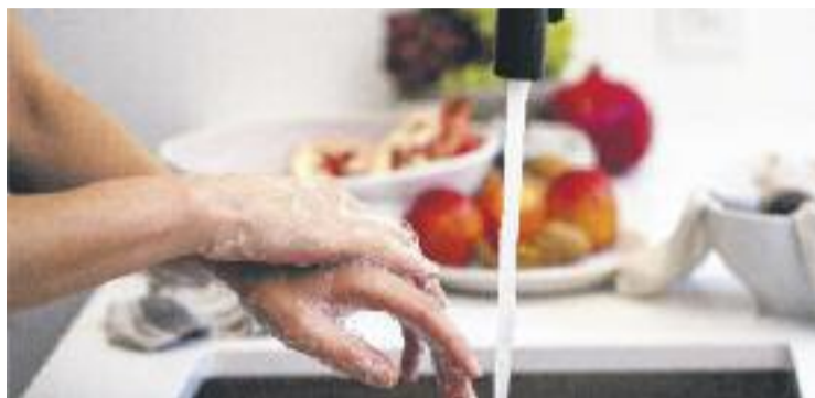
L'augment va ser aprovat al desembre per l'ACA.