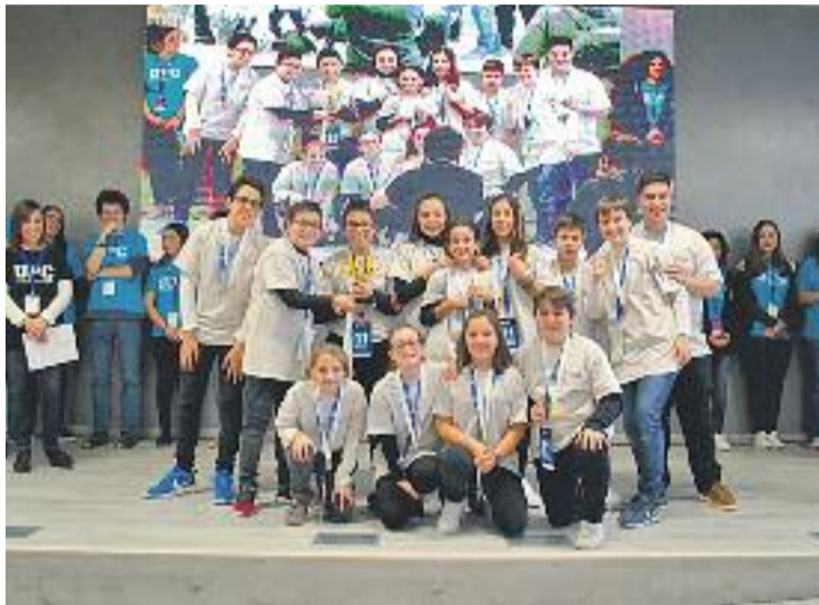
Imatge dels guanyadors del certamen.

En aquest sentit, aquesta vegada els equips participants han investigat i buscat solucions creatives per millorar el cicle humà de l'aigua. Per exemple, com millorar la manera de buscar-ne, transportar-ne o utilitzar-ne. La intenció de la iniciativa és que els joves investiguin i resolguin problemàtiques actuals, apliquin conceptes matemàtics i científics en la vida real, desenvolupin habilitats i competències com el treball en