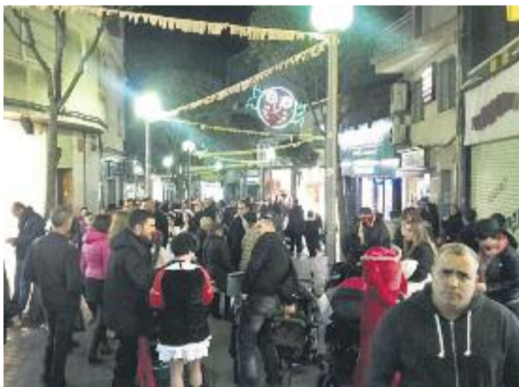
L'eix de la Salut tornarà a celebrar el concurs de disfresses.

A banda de la promoció del petit comerç, la comarca viurà les tradicionals rues de Carnestoltes. En el cas de Badalona dissabte hi haurà la 36a edició de la Rua a Llefià. La desfilada començarà al