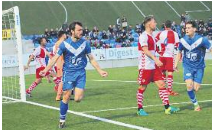
El Bada jugarà a domicili per primer cop en tres setmanes.

tar més atent que mai per no relliscar i continuar sumant per allunyar-se definitivament de les posicions de perill.