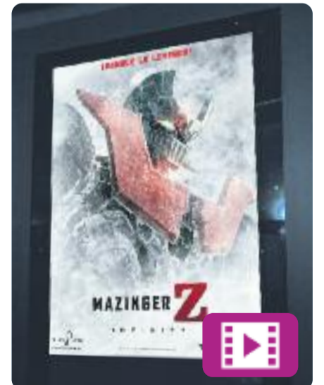
Mazinger Z: Infinity Junji Shimizu

10 anys després de l'última vegada que va pilotar el Mazinger Z, Koji Kabuto ha canviat de vida i és científic, com el seu pare.