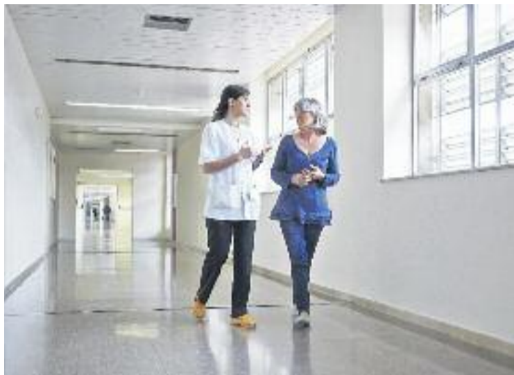
Els diners recaptats es destinaran a la Fundació Lluita contra la Sida.

Els diners que es recaptin avui i diumenge es destinaran íntegrament a la Fundació Lluita contra la Sida, establerta a l'Hospital Germans Trias i Pujol de Badalona i que atén les persones seropositives de Santa Coloma. "La fundació acull molt bé les perso-