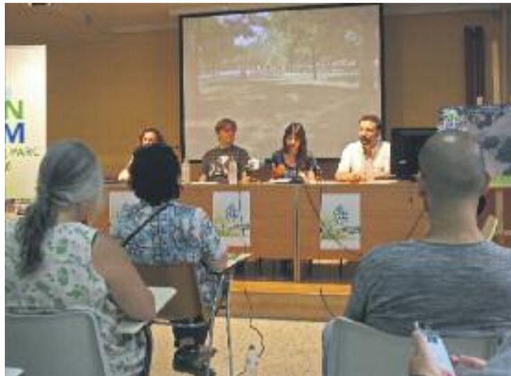
L'Ajuntament va presentar el procés al juny.