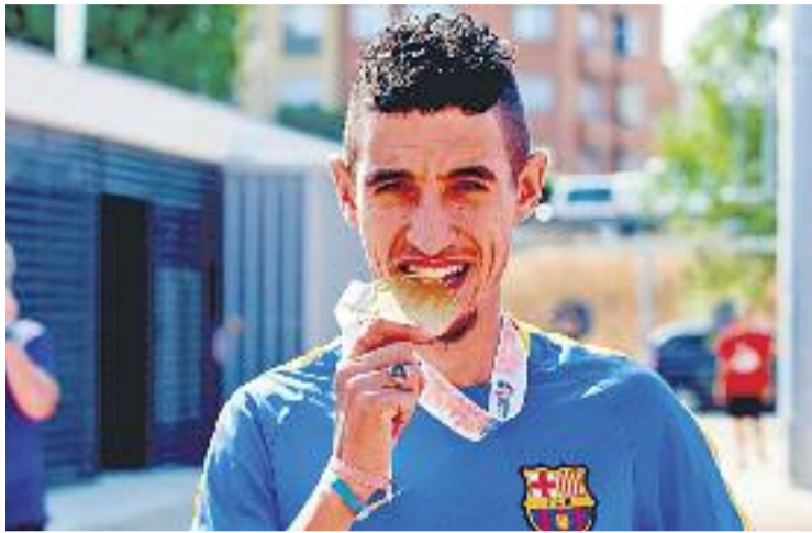
L'atleta, en una imatge d'arxiu.

L'endemà que es fes pública aquesta informació de la troballa d'aquestes substàncies prohibides al domicili de Fífa, l'AEPSAD va emetre una nota al seu