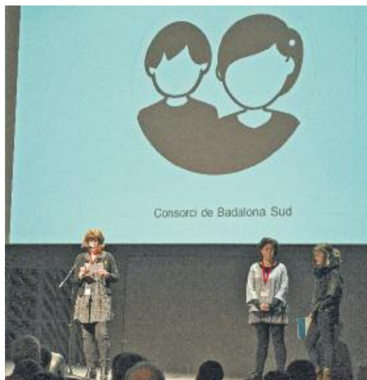
El Consorci Badalona Sud participa en el projecte Educació 360.