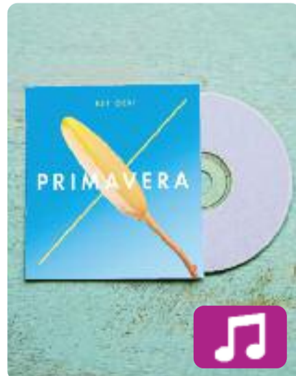
El gir Est Oest

Com el títol del disc indica, amb El gir , Est Oest vira cap al pop electrònic sense cap mania però amb molta feina al darrere. El nou treball s'ha centrat en una bona producció per obrir-se a una etapa més moderna.