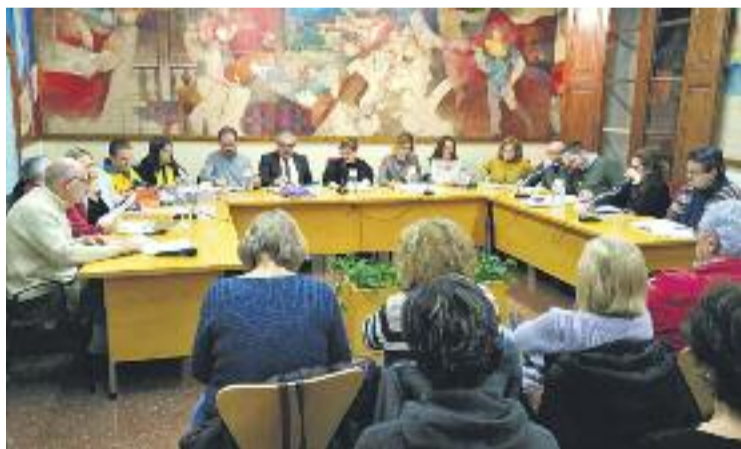
Una imatge del Ple de dimarts.

La sessió del Ple celebrada dimarts també va aprovar tornar a penjar del balcó de l'Ajuntament la pancarta amb el lema "Llibertat presos polítics". La proposta va rebre el suport de PDeCAT, Junts per Tiana, ERC i la CUP i