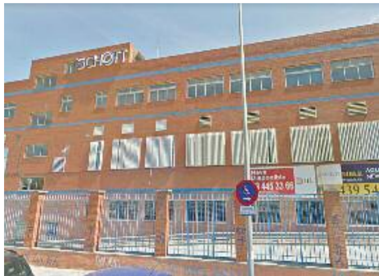
La fàbrica va tancar el 2014.

La fàbrica Schott Ibérica, que produïa tubs de vidre per a usos farmacèutics, va tancar les seves portes el 2014. Els propietaris