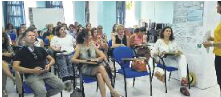
Els professionals són formats per la Fundació Wassu.

Al Barcelonès Nord, Badalona desenvolupa des de l'any 2010 un programa pioner integral de prevenció i atenció a la mutilació, en el marc d'un conveni entre Badalona Serveis Assistencials (BSA) i la Fundació Wassu de la Universitat Autònoma de Barcelona (UAB). En el cas de Santa Coloma, l'Ajuntament també treballa amb la fundació des del 2015. Entre altres coses, la tasca desenvolupada a les dues ciutats ha permès formar 711 professionals que atenen persones en risc de patir mutilació genital. A les dues ciutats hi viuen 709 dones procedents de països on es practica la mutilació,