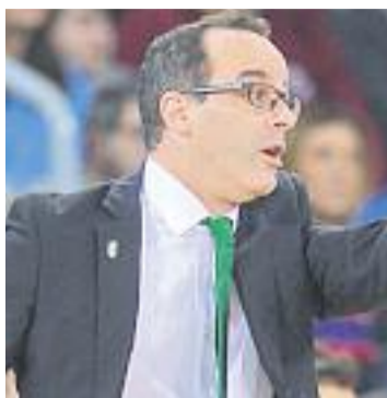
El club confia en Duran (esquerra) per millorar els resultats.

curs, a més, Ocampo va viure el relleu a la presidència, amb l'entrada de Juanan Morales.