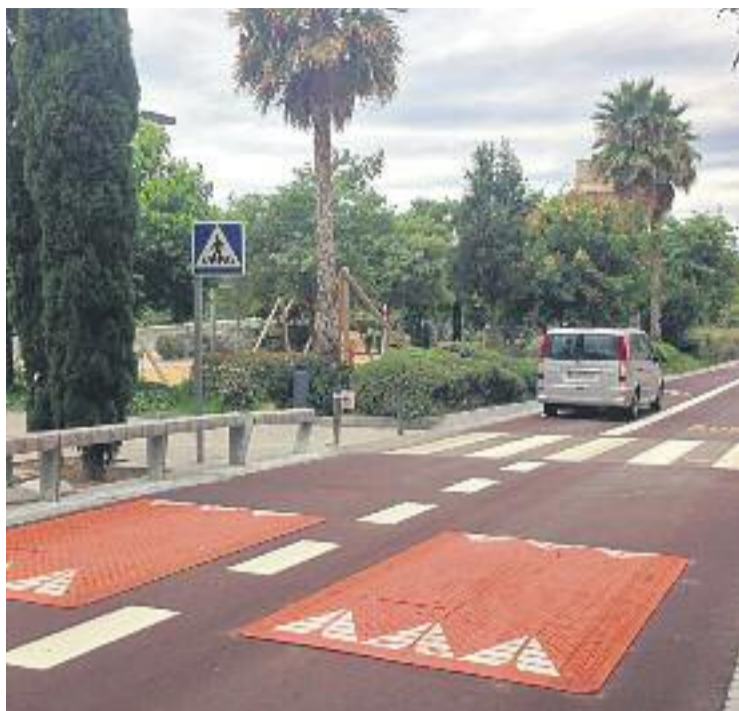
El 2017 es va tancar amb un mort en accident de trànsit.