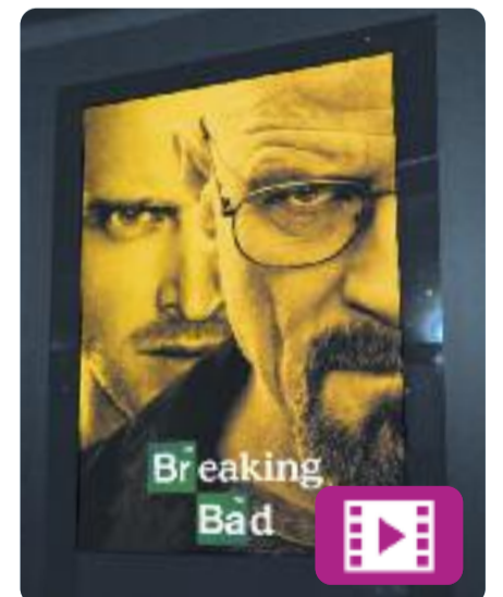
Breaking Bad Vince Gilligan

Aquest mes es compleixen 10 anys de l'estrena de Breaking Bad , una de les millors sèries del que portem de segle.