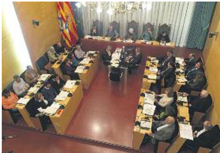
Una imatge del Ple de dimarts.

Al tuit, Guanyem enllaçava una notícia que recordava com l'expresident d'FCC José Mayor Oreja admetia davant la justícia que dues empreses participades