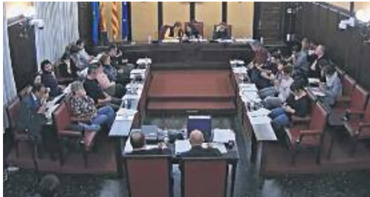
PSC, Som i ICV-EUiA hi van votar a favor.

Les reclamacions de la PAH eren principalment dues. D'una banda, destinar més recursos humans de l'Ajuntament per ajudar a resoldre els desnonaments i els conflictes que aquests generen a la ciutat. Uns recursos en forma de persones que assumeixi les negociacions necessàries amb els grans tenidors d'habitatges com són les entitats financeres, les immobiliàries i els bancs. També, treballadors municipals que es dediquin a fer un cens d'habitatges buits per, pos-