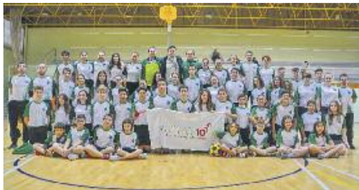
La foto de família de tots els equips del club.

El partit dels júnior va arrencar a les nou del matí i gairebé dues hores després, poc abans de les onze del matí, va arrencar el matx del primer equip, que va aconseguir una victòria per 15-8 contra el Vacarisses. “L'equip va començar molt bé, amb un parcial de 5-0 només començar. Després ens vam adormir una