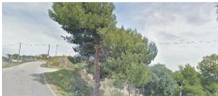
L'oposició força una comissió de treball.

En el plec de condicions del nou contracte, l'Ajuntament ha incorporat clàusules que garanteixen que si una altra empresa es fa amb el servei garanteixi la subrogació dels treballadors actuals i que les empreses que hi optin han d'acreditar serveis de suport als tre-