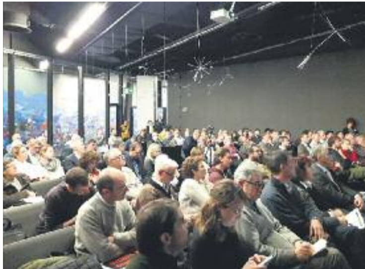
Dimarts Aire Net i l'AMB es van reunir al Museu Blau.