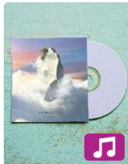
Atmosfera Senyor Oca

Guanyador de l'última edició del concurs de grups emergents Sona 9, Senyor Oca ha començat el 2018 combinant la gravació del seu nou disc amb diferents actuacions per Catalunya.