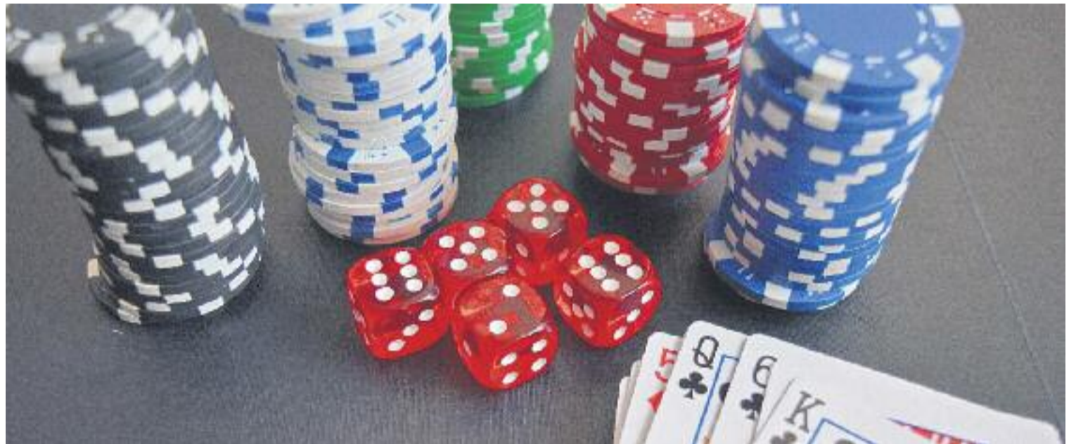
Jugadors Anònims fa trobades amb persones que pateixen ludopatia per ajudar-los a frenar la malaltia.

Un altre cas és el del Juan. Va a les reunions des del 1990 i no va poder desenganxar-se del joc fins al 2001, després de diverses recaigudes. Explica que el treball en grup li ha permès reviure després d'haver tocat fons. "Va arribar un moment en què em mirava al mirall i hi veia un monstre", recorda. A les reunions hi ha un moderador i cada assistent té un temps limitat per compartir les experiències que vulgui amb els seus companys. Tot s'emmarca en la teràpia dels 12 passos. "El pri-