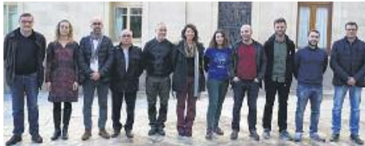
L'Amap es va constituir ahir.

Els municipis catalans que formen l'Amap ja havien anunciat la seva creació el març del 2017. Fins ara Terrassa ha estat la ciutat que ha liderat la reivindicació