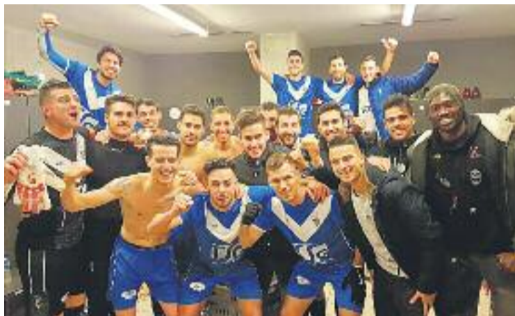
L'equip vol que a la segona volta hi hagi més imatges com aquesta.

ja que només ha guanyat un dels seus nou darrers partits (el passat 16 de desembre, per la mínima al camp del Llagostera).