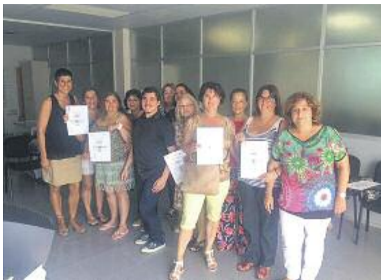
El 27% dels participants es van inserir al mercat laboral.

D'altra banda, el programa Treball als barris va organitzar un tercer curs de perruqueria i estètica de 588 hores, que va comptar amb 7 participants. En