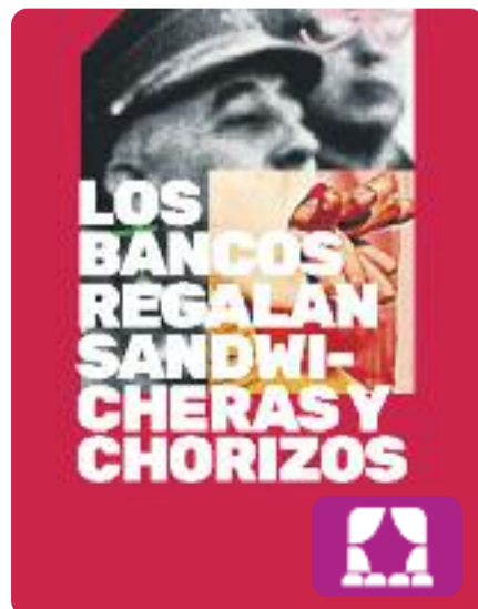
Los bancos regalan sandwicheras y chorizos

Què coneixen els joves del franquisme i de la transició? La companyia 'José y sus hermanas' representa al Teatre Tantarantana de Barcelona aquesta obra política que convida a reflexionar sobre els quaranta anys de postdictadura .