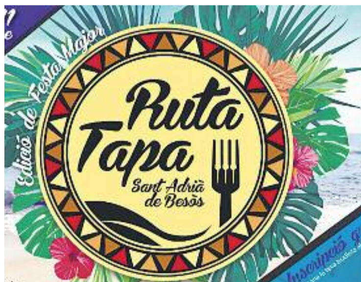
Fins ara s'han celebrat tres edicions de la Ruta Tapa.

A més, el consistori ha comunicat que està buscant patrocinis que ajudin a pagar les despeses de la Ruta, sobretot pel que fa a materials promocionals com plats, díptics o polos.