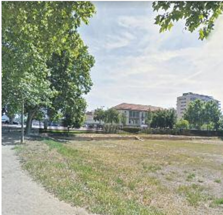
El parc acollirà els mòduls provisionals.