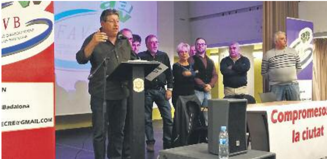
Molina, durant la presentació de les propostes.

» Els treballs del primer tram del lateral començaran a finals de mes » La FAVB estableix l'autopista com una reivindicació prioritària