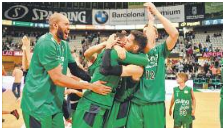
Els verd-i-negres han mostrat la seva millor versió com a locals.

Els de Porfi Isaac arribaran a l'Olímpic amb la moral pels núvols després de la victòria que van aconseguir diumenge passat contra l'Unicaja (71-63) i amb el líder de valoració de la lliga en les seves files, Henk Norel, un vell conegut de l'afició verd-i-negra. El pivot neerlandès és també un dels màxims anotadors de la competició i el millor capturador de rebots, de manera que el partit farà que l'afició pugui gaudir d'un intens duel a la pintura amb Jerome Jordan. Un altre dels ho-