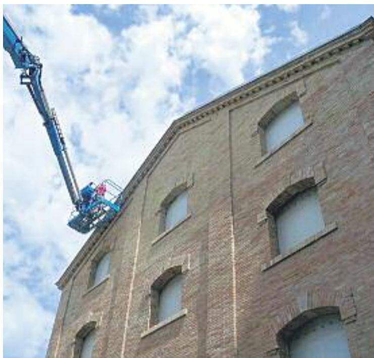
La Caci s'ha sotmès a diverses obres d'adequació.