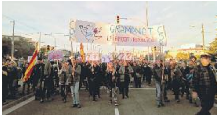
Els integrants del CDR van assistir a la manifestació del dia 11.

La participació als CDR es fa a títol individual i no en representació de cap partit o entitat i ara el comitè colomenc vol presentar-se en societat aquest diumenge amb una mobilització per demanar l'alliberament dels presos polítics. Serà en forma de concentració i tindrà lloc al marge del riu Besòs. A més, es podria comptar amb la participació d'altres comitès del Barcelonès Nord. "Primer volem impulsar aquesta mobilització per presentar-nos a la ciutat i després difondre a Santa Coloma els beneficis de la República Ca-