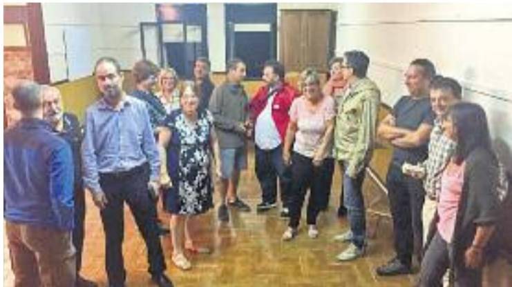
ERC podria convocar una assemblea extraordinària.

I precisament aquest segon punt és el que està encallant les converses. El PDeCAT defensa que no concep la moció que no reservi l'alcaldia per al seu partit, mentre que Junts i CUP -que negocien en bloc- demanen un gest als conservadors. "La CUP ha fet el gest de voler entrar en un govern on hi hagi el PDeCAT. Ara els demanem a ells que facin un gest", expliquen fonts del bloc ne-