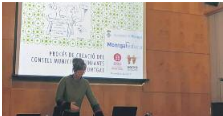
Els grups municipals han debatut recentment la creació del Consell.

La presentació en societat del nou espai per a la infància tindrà un marcat caràcter festiu. Durant el matí del diumenge, hi haurà carpes d'entitats de cooperació i solidaritat del municipi i jocs de sensibilització per a infants i joves. Pels més menuts hi haurà