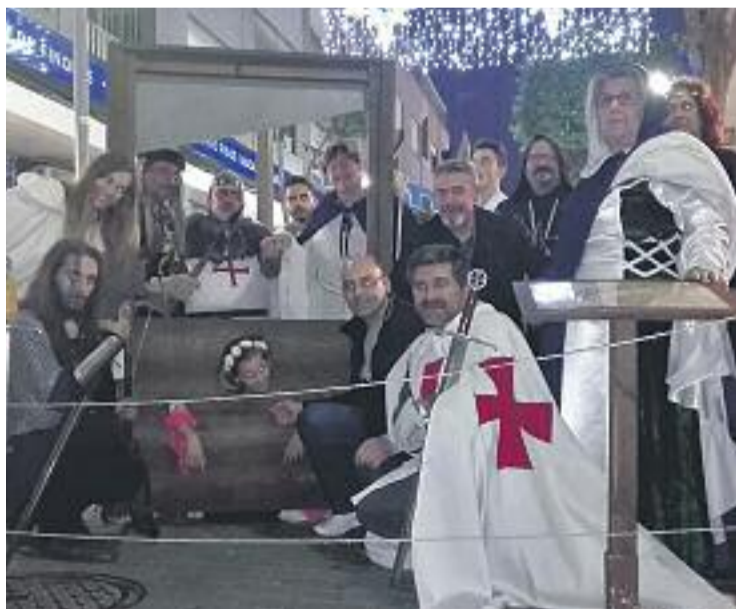
La Fira Medieval de l'any passat va ser un èxit: Foto: Associació

I l'acció no acaba aquí. Els assistents a la novena edició de la fira també podran veure de ben a prop una exposició d'armes i instruments de tortura medievals. Els comerciants també han pensat en els més petits i la fira programarà al llarg de divendres i dissabte diverses propostes d'espectacles infantils per als nens i nenes que vagin a la fira amb la seva família.