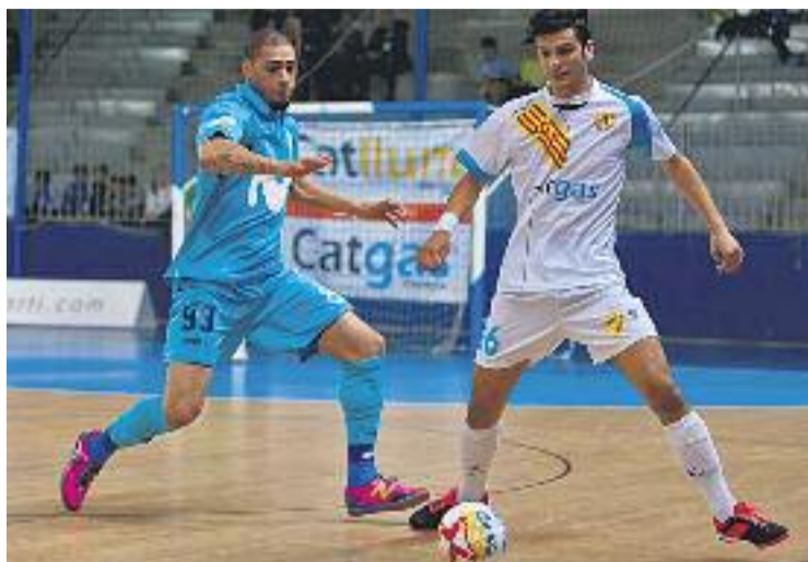
L'equip ha de guanyar si no vol despenjar-se dels vuit primers.