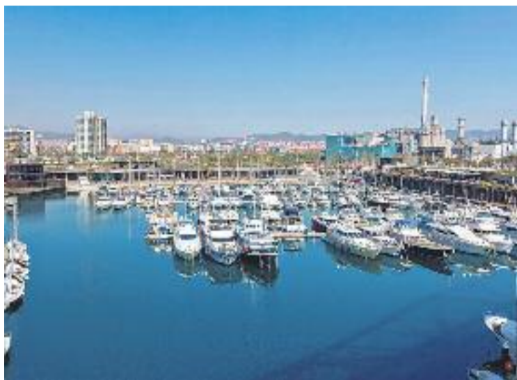
L'hotel acompanyaria el Café del Mar.

Al maig el port ja va acollir la inauguració de la nova discoteca de la franquícia Café del Mar i amb anterioritat ja s'havia especulat que el canvi d'imatge del port també implicaria la construcció d'un hotel. Mesos enre- res va especular amb l'arriba-