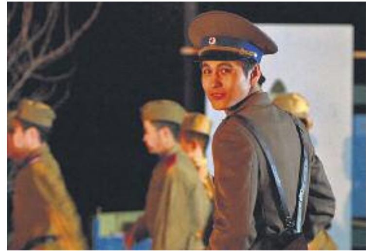
The mother , dissabte al MhiC.

L'Asian Film Festival és una iniciativa de la Casa Àsia.