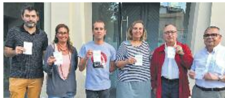
PDeCAT, Junts i CUP negocien una moció de censura.

La transparència i la participació apareixen com els principals àmbits sobre els quals cal actuar. Tot i que el detonant per engegar la moció va ser la manca de suport del govern municipal al referèn-