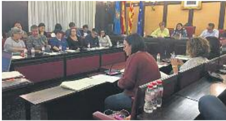
Una imatge del Ple de dilluns.

També s'ha demanat a la Generalitat la desafecció de l'espai que ocupava el CEIP Sant