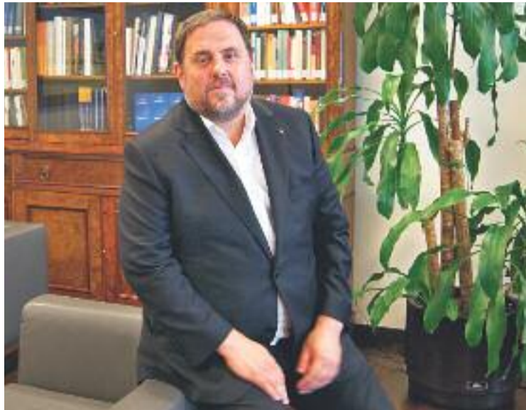
Oriol Junqueras, en una imatge d'arxiu.

En el seu comunicat, els comerciants rebutgen l'empresonament de "càrrecs polítics escollits democràticament per la ciutadania i de persones de la societat civil en el seu dret d'exercir la llibertat de pensament i la llibertat d'opinió". Des de l'entitat afirmen que no entenen "la judicialització d'un conflicte de naturalesa política", al mateix temps que afegeixen que "la llibertat d'opinió, la llibertat de pensament i complir amb el mandat d'un Parlament han de