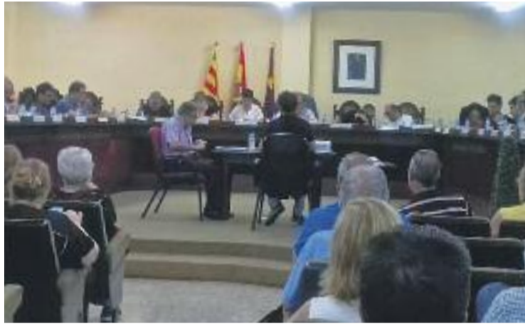
El Ple va donar llum verda a la congelació.

Per tant, queden congelats l'impost d'activitats econòmiques (IAE), l'impost de vehicles (IVTM), l'impost de plusvàlues (IIVTNU) i l'impost sobre construccions, instal·lacions i obres (ICIO). També es mantenen igual la major part de taxes excepte la dels paradistes del Mercat d'Encants -que baixa un 2%-, la del