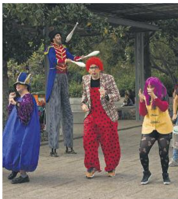
El FITI va oferir un primer tastet amb una cercavila dissabte.