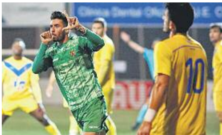
Una imatge del partit de la temporada passada.

Després que s'hagin jugat les primeres 13 jornades, els badalonins són dotzens amb 17 punts, mentre que el conjunt verd és sisè amb 20. Una victòria escapulada permetria que l'equip remuntés posicions (depèn també d'altres resultats) i que s'apropés a la quarta plaça, que actualment ocupa el Lleida Esportiu amb 21 punts. De fet, entre el conjunt del Segrià i l'Atlètic Balears, el ca-