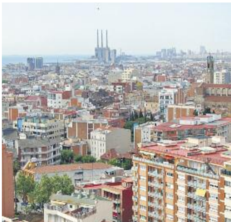
El rebut de l'IBI podria incrementar-se el 2018.