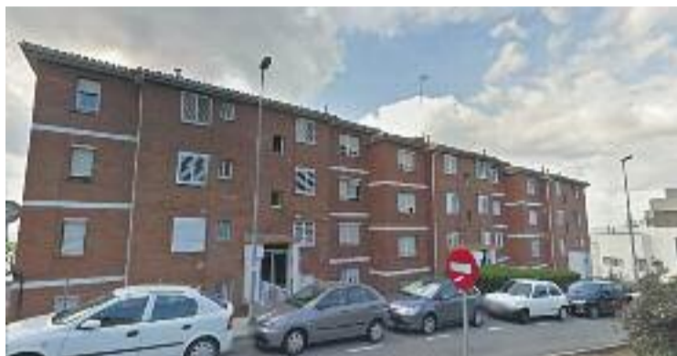
La renda estableix si es pot accedir a les ajudes per a l'IBI.

El consistori ja ha avançat que en el cas que del nombre de sol·licituds rebudes es derivi una quantia d'ajuts superior al crèdit disponible a les arques municipals, es dividirà proporcional-