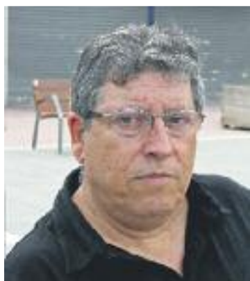
Molina, president de la FAVB.

Les associacions veïnals faran públic aviat un comunicat conjunt que aglutini totes les seves demandes a l'Ajuntament.