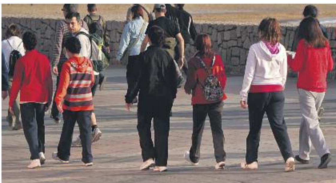
L'AMB aposta pels desplaçaments en transport públic, però també a peu i en bici.