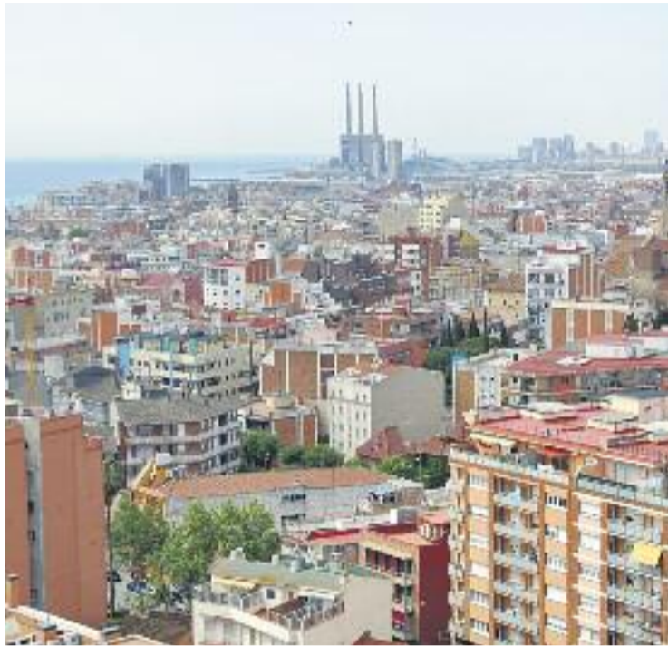
Bona resposta a les ajudes per a majors de 65 anys.