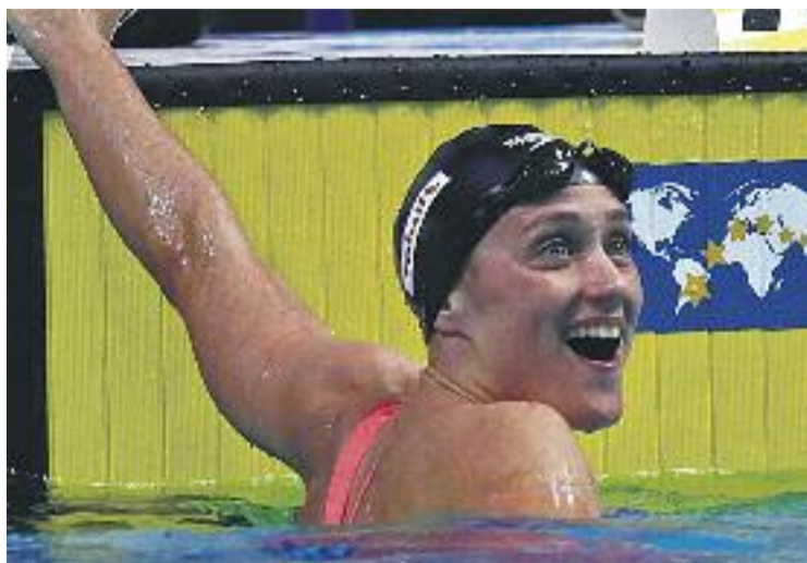
La temporada 2017-18 ha començat amb bon peu.

La badalonina va arrodonir la seva actuació adjudicant-se també la prova de 400 estils, que va completar en 4 minuts, 40 segons i 47 centèsimes, superant la