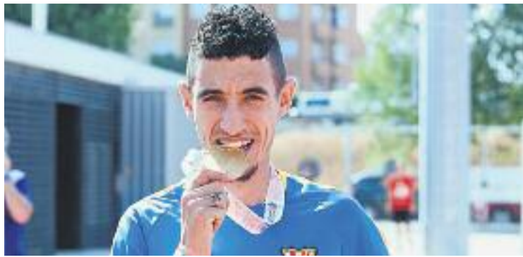
Fifa va guanyar un or a l'Europeu de l'any passat.

Aquesta operació policial hauria començat durant el mes de juny, després d'una denúncia feta pel mateix cos policial, i ja s'haurien fet també escorcolls a més localitats del país, com Mollet, Esplugues o Arenys de Mar, i altres ciutats de l'Estat espanyol, com València o Guadalajara. L'atleta i la resta de persones que van ser detingudes (ahir s'havien confirmat dos arrestos més) afrontaran càrrecs contra la salut pública pel