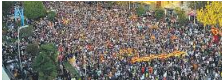
El pacte espera mantenir la intensitat de la mobilització.

Ahir el pacte va presentar públicament aquests canvis en un acte a la Cooperativa la Moral, després de la xerrada 155 i ara què? , organitzada per l'ANC i que va