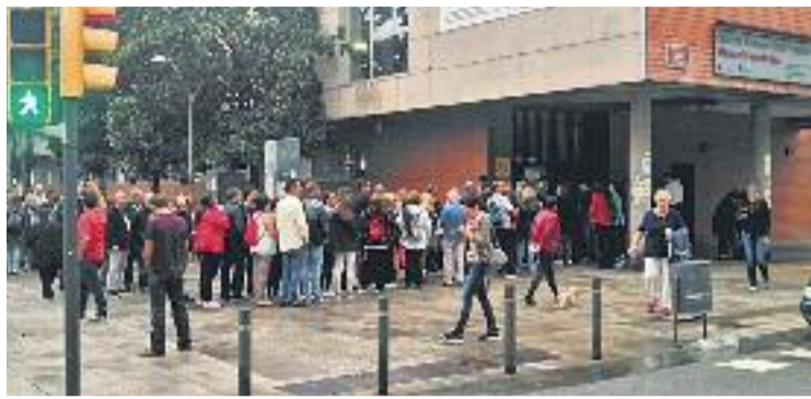
El referèndum va ser un detonant per a la creació del CDR.

Des d'aleshores, organitzades a través de grups de missatgeria mòbil, diverses persones van