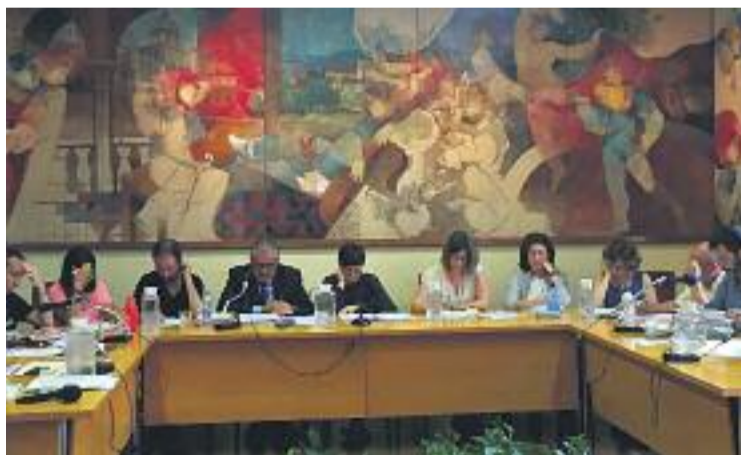
El Ple debatirà avui l'aplicació de l'article 155.

Precisament el govern, a través d'un comunicat publicat en nom de l'Ajuntament, ha manifestat també el seu rebuig a l'aplicació de l'article 155 i demana a l'executiva del PSC que s'oposi "frontalment" a la mesura. Els socialistes consideren que les conseqüències de la suspensió de l'autonomia de la Generalitat serien "irreparables". D'al-