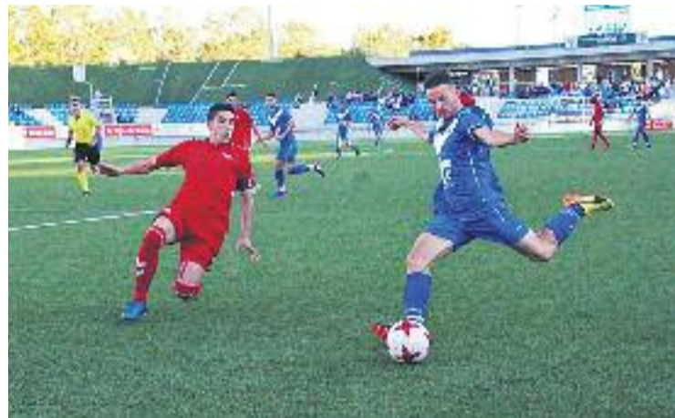
Un moment del darrer partit contra l'Atlético Saguntino.