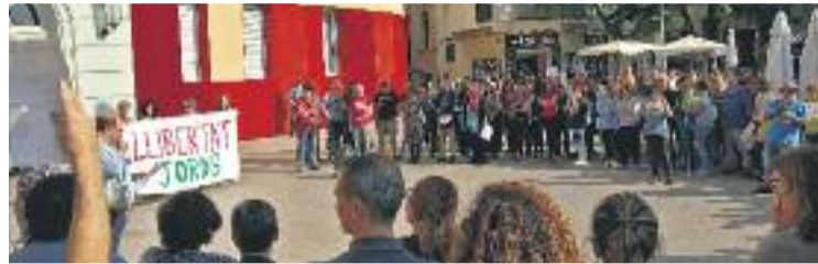
La ciutat ja s'ha mobilitzat en diverses ocasions els darrers dies.

L'espai neix arran d'una crida de Som a la qual han respost una vintena d'entitats i partits. Entre ells, ICV, EUiA, Podem, CUP, ERC, Òmnium, l'ANC, l'Assemblea Grogga, l'Assemblea d'Aturats, Arran o l'Ateneu Popular Julia Romera. Segons ha pogut saber Línia Nord , tots els integrants han assumit quatre punts de consensos. A banda de reivindicar el dret a l'autodeterminació i combatre la repressió, la plataforma defensa els drets fonamentals i treballar per combatre un eventual rebrot "feixista i d'extrema dreta" que hi pugui haver a Santa Coloma.