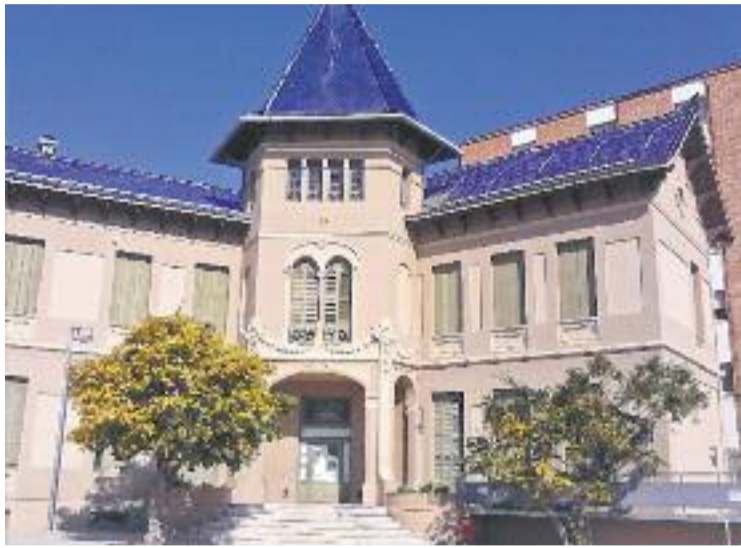
La gala se celebrarà a l'Auditori Can Roig i Torres.