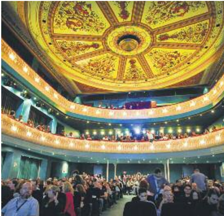
El Zorrilla es va omplir per la inauguració del Filmets.