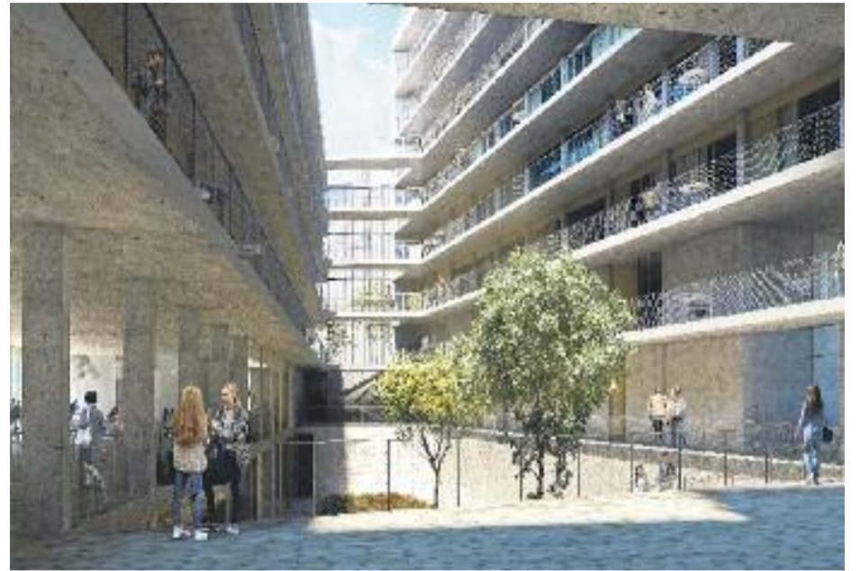
Representants de l'administració i la UPC van col·locar ahir la primera pedra (esquerra) de la residència que s'inaugurarà el curs 2019-2020.