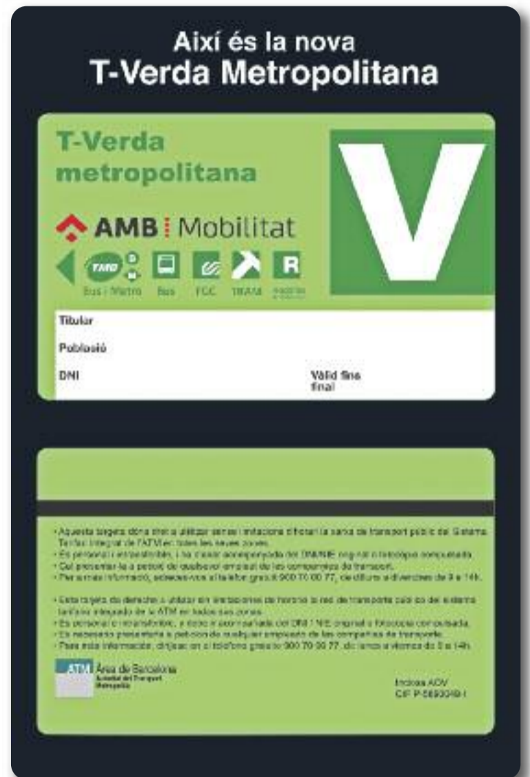
La T-Verda Metropolitana (dreta) permet viatjar gratuïtament en transport públic (esquerra) durant tres anys.