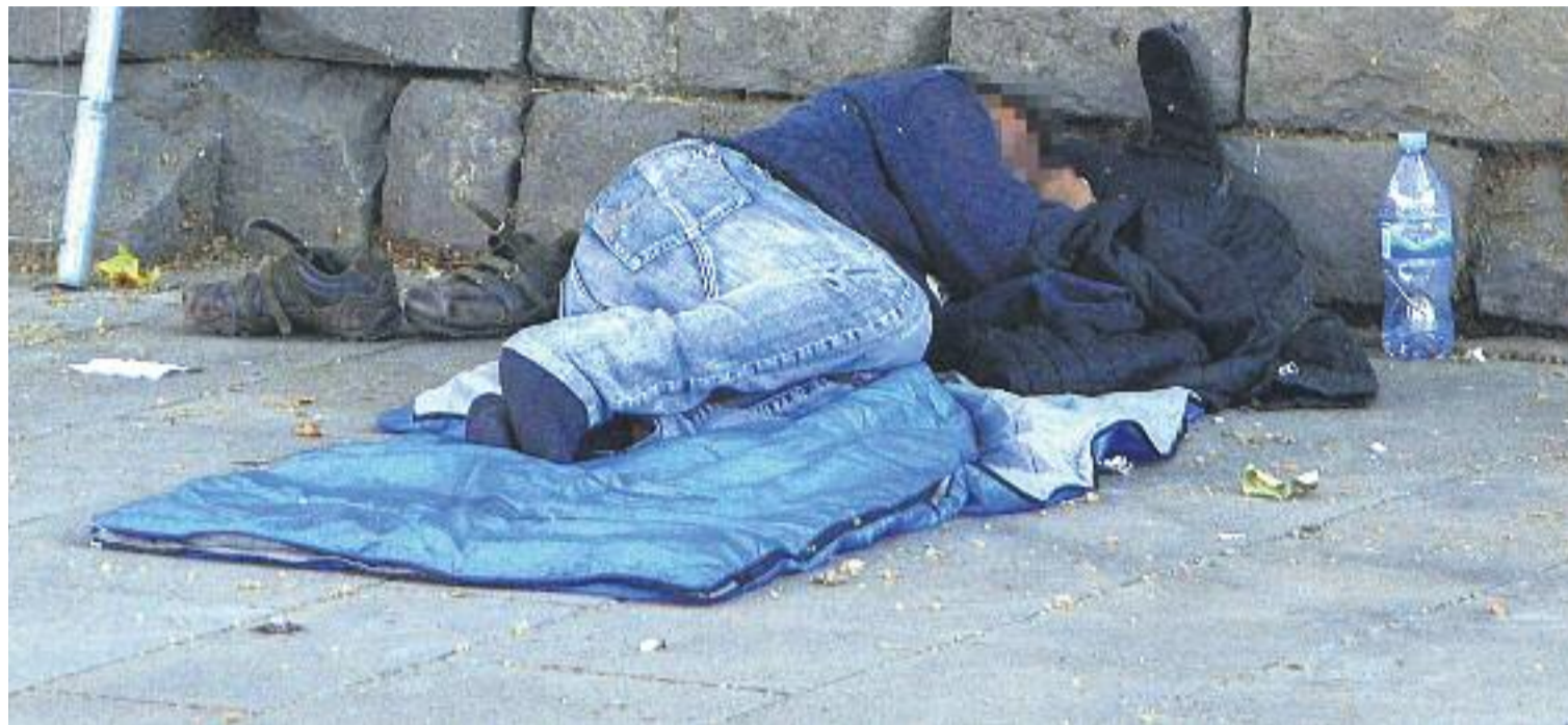
La pobresa i l'exclusió cada cop es cronifiquen més a la comarca.