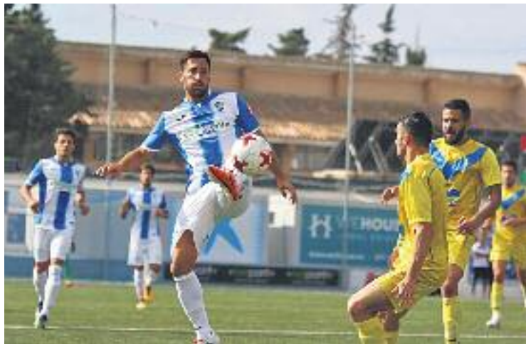
Un moment del darrer partit contra l'Atlètic Balears.

Robusté continuarà sent baixa a l'eix de la defensa escapulada. La del central vilassarenc és l'única absència de pes de González, que aquesta setmana ha volgut enviar els seus millors desitjos als afectats pels incendis de Galícia, la seva terra. "Moita forza a Galícia e a sua xente!" va