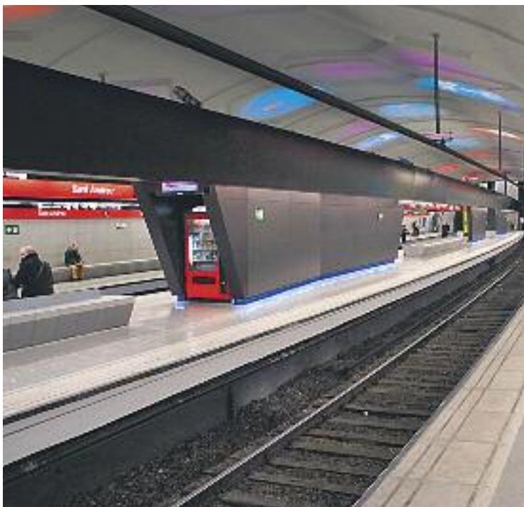
Badalona també tindrà L1 de metro.