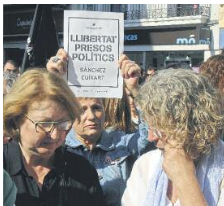
400 persones es van aplegar dimarts a la plaça de la Vila de Badalona per exigir l'alliberament de Cuixart i Sànchez.