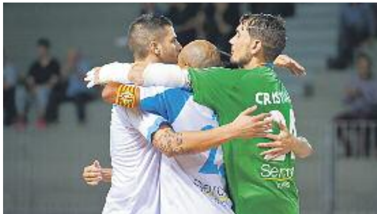
L'equip vol puntuar en terres gallegues.

L'enfrontament contra l'equip de Santiago de Compostel·la arribarà una setmana després que l'equip aconseguís un punt més en un partit amb molt pocs gols al Pavelló Nou contra el Peníscola (1-1). Les baixes de Pacheco i Míguez i les molèsties que