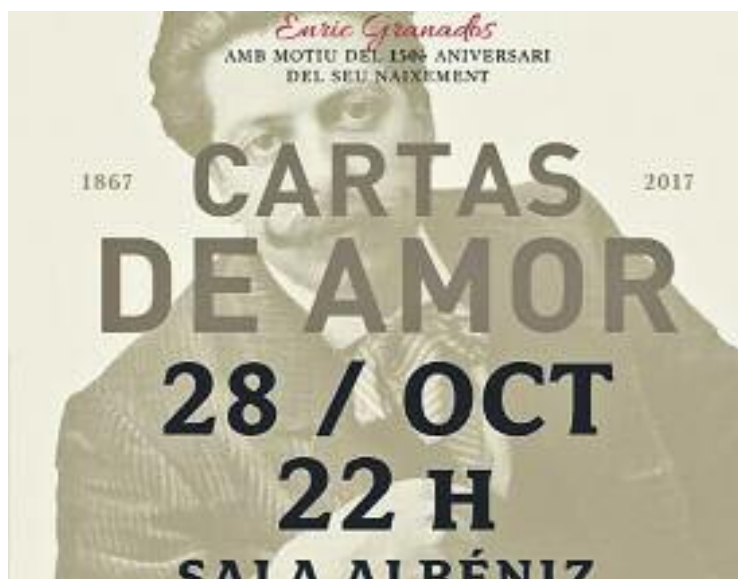
Cartas de Amor, el 28 d'octubre a la Sala Albéniz.

Cartas de amor és un espectacle de nova creació que mostra algunes de les composicions musicals d'Enric Granados. Les conegudes, d'altres que no ho són tant i també alguna curiositat. A la vegada, descobreix part de la seva correspondència personal. Amb la família i amb amics del seu entorn creatiu, sobre sentiments i anhels. I fins tot, descobrirem anotacions del seu diari particular. Mostrarà,