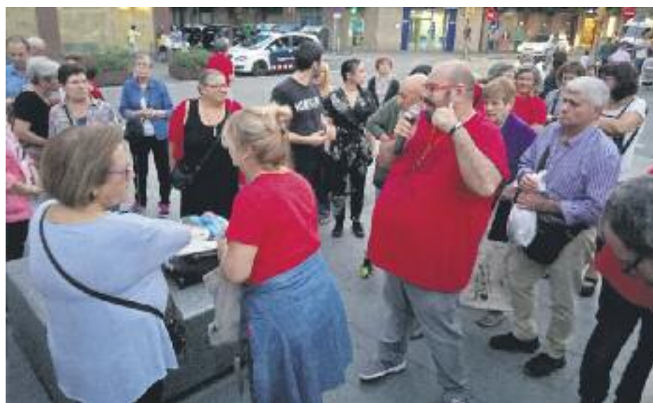
Stop Crematori va convocar dilluns la quinzena cassolada en un any i mig.