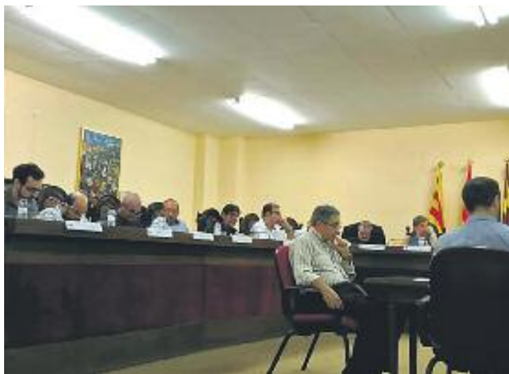
Una imatge del Ple de dilluns.

D'una banda el Ple va aprovar mostrar la solidaritat del consistori amb els municipis afectats per la repressió i les persones ferides per l'actuació de la policia l'1-O, així com exigir al Ministeri de l'Interior el rescabament pels danys materials causats per les càrregues policials i demanar la dimissió de tots els càrrecs polítics implicats en l'exercici de la violència i vulneració