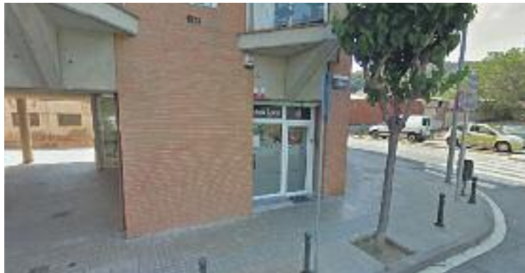
La Policia Local va detenir els dos joves el 7 d'octubre.

SUCCESSOS ▶ La jutgessa de guàrdia de Mataró va decidir el 10 d'octubre decretar presó provisional sense fiança per dos joves de 24 i 25 anys per un presumpte delictes de robatori amb força a un domicili de Montgat. Van ser detinguts el 7 d'octubre per agents dels Mossos d'Esquadra de la Unitat d'investigació de la comissaria de Premià de Mar coordinadament amb agents de la policia local de Montgat i Tiana.