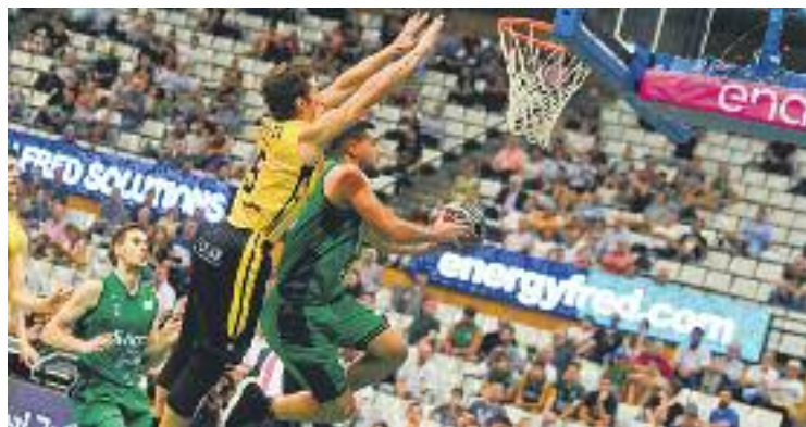
Ventura penetra a cistella en el darrer partit.

Aquesta primera victòria va estar a prop d'arribar diumenge passat a l'Olímpic, i durant molts minuts