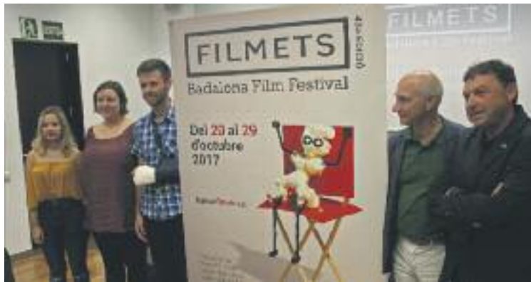
El Filmets es va presentar dimarts al Viver.