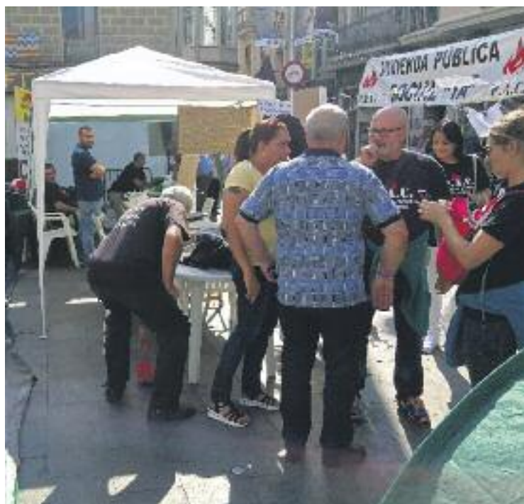
La PAC manté l'acampada després de 24 dies.