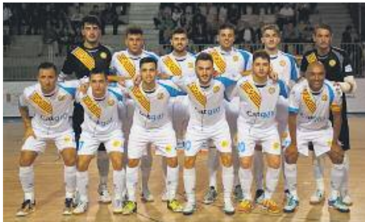
La plantilla 2017-18 del conjunt colomenc.