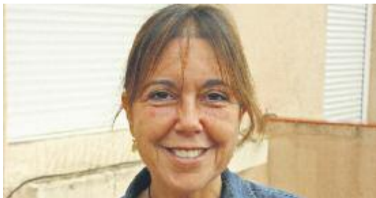
Funtané, en una imatge d'arxiu.

Maza, a més, demanava prioritzar les compareixences dels alcaldes de municipis amb més po-