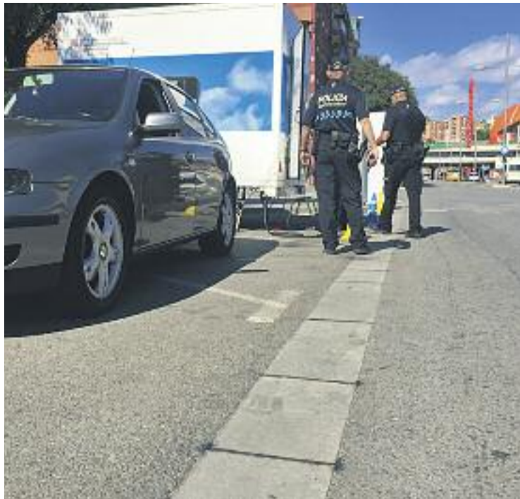
La Guàrdia Urbana mesura les emissions d'un vehicle.