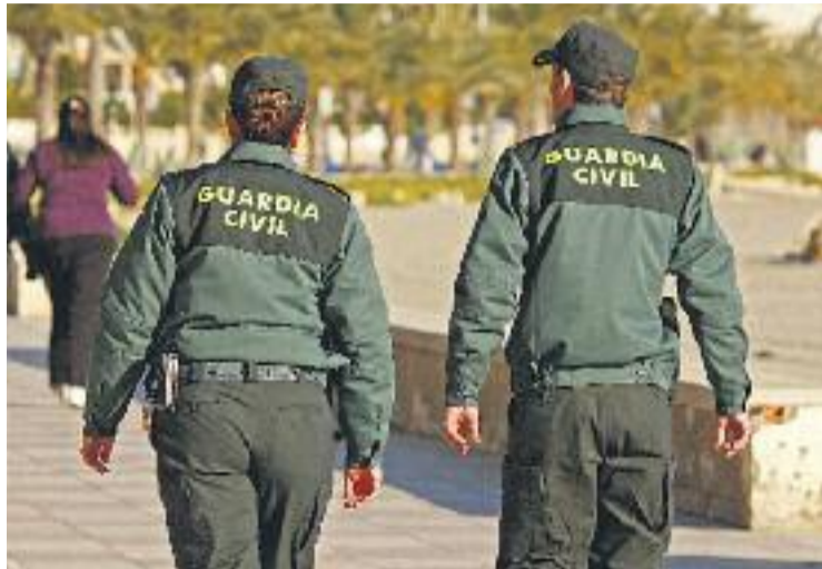
La Guàrdia Civil va requisar les planxes per fer cartells del referèndum a Sant Adrià i Alerta Solidària ha denunciat la policia local de Santa Coloma.

La recerca de material gràfic per fer campanya pel referèndum va portar el 15 de setembre la Guàrdia Civil a Badalona. Diversos agents d'aquest cos policial es van presentar a les portes de la impremta Gràfiques Gongraf, al ca-