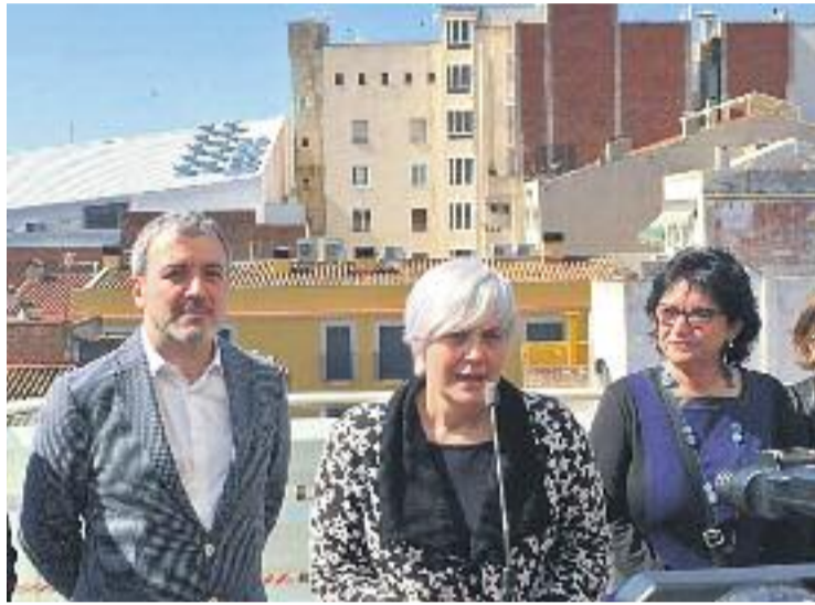
Els representants municipals es van reunir el 13 de setembre.