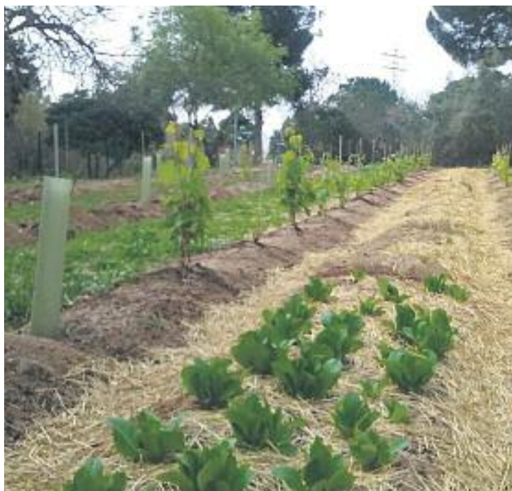
La Vinya d'en Sabater, a disposició de la UB.