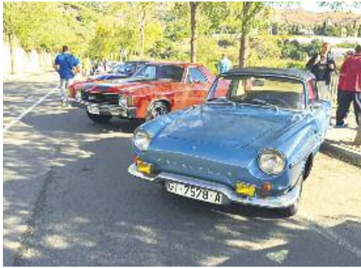
El Clàssics de l'any passat va ser un èxit.

Tot i que no hi ha una llista de participants inscrits, l'ACIST