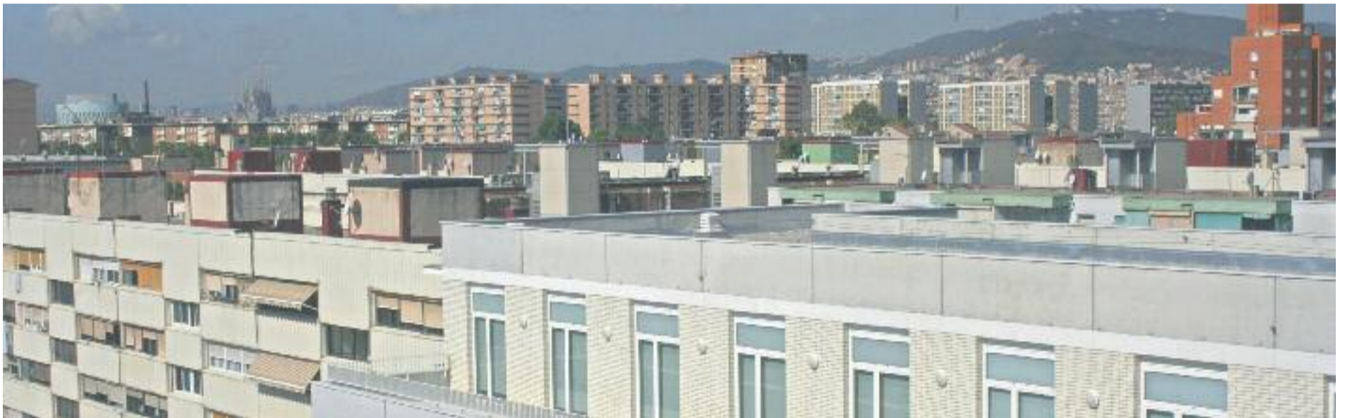
Les ocupacions a la Mina continuen i els clans es fan forts als blocs.

» Alguns dels ocupants dels pisos que el Consorci de la Mina té al barri paguen un lloguer als clans » L'Ajuntament no s'ha pronunciat oficialment des del juliol, quan va demanar ajuda a la Generalitat