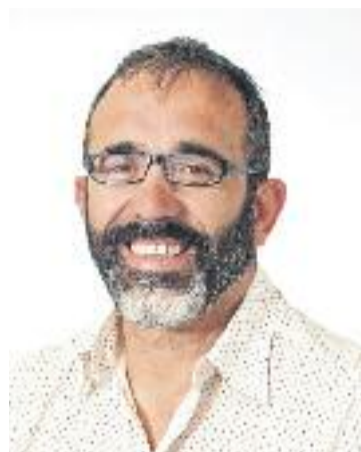
Callau i Ramos van preferir no comparèixer.

però també era la seva oportunitat d'explicar-se. Ara esperarem al que diguin als jutjats", afegeix. "Això és la conseqüència d'haver reobert la comissió massa d'hora", considera per la seva banda Pedro Sánchez, de Ciutadans. Mentrestant, fonts d'ERC acusen el govern municipal de "torpedinar per enèsima vegada" processos per a la transparència a l'Ajuntament.