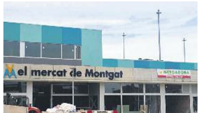
El mercat vol treure pit amb la seva cuina.

Però no es queda aquí, ja que els assistents podran participar en el sorteig d'una panera amb productes de diferents parades del mercat.