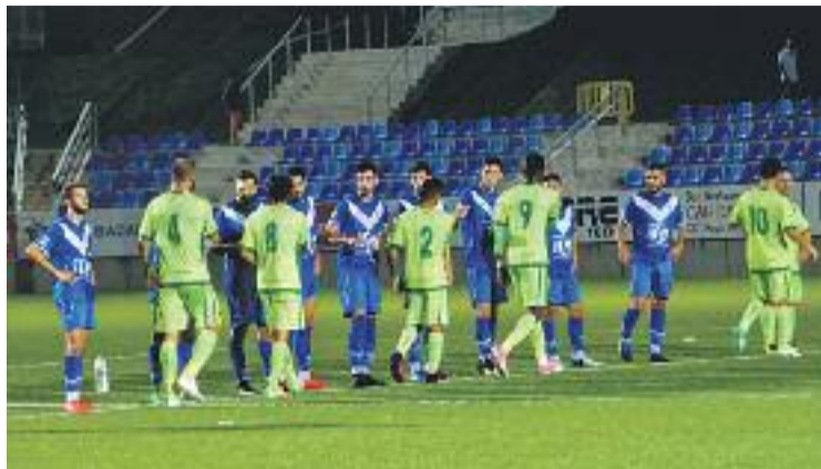
L'equip encara no ha perdut cap partit a casa a la lliga.

I és que el partit contra els aragonesos arriba en un bon moment per al club, que va tornar a mostrar una imatge molt sòlida diumenge passat al Rico Pérez d'A-