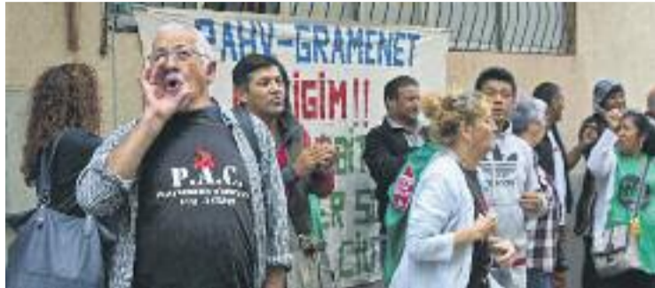
Concentració de la PAH al carrer Roviralta.

Dimarts n'hi havia previstos tres en un sol matí. El primer es va anul·lar perquè les dades de la comitiva judicial no coincidien amb les del domicili que havien de desallotjar, mentre que en els altres dos casos es van aturar sobre la botzina. En un d'ells el fons voltor Anticipa volia dur a terme l'execució hipotecària d'una dona que viu amb la seva filla menor d'edat en un pis de l'avinguda Pallaresa. A última hora i amb una trentena d'activistes de la PAH disposats a evitar el desnonament, es va arribar a un acord per negociar un