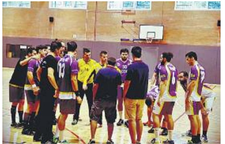
Els liles han sumat els primers dos punts de la temporada.

Amb els primers dos punts al sarró, l'equip començarà demà passat la temporada a domicili. El conjunt adrianenc encetarà la segona jornada al palau d'esports de Bordils contra el filial del Club Handbol Bordils.