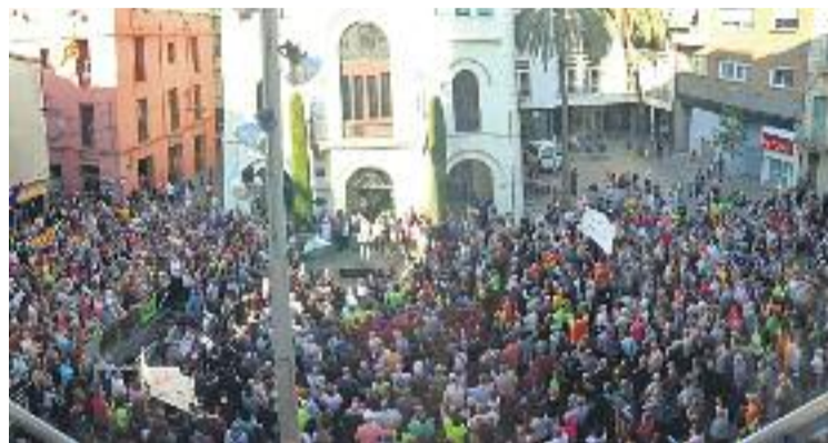
La plaça de la Vila, plena a vessar.

Sabater va optar per una demostració de força i va fer l'anunci ahir a la tarda davant de centenars de persones concentrades a la plaça de la Vila. Inicialment hi havia convocada una encartellada massiva per part del Pacte Local pel Referèndum, però les actuacions judicials i policials que es van viure al llarg del dia d'ahir a Barcelona van obligar a canviar els plans sobre la marxa i cedir bona