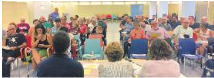
Imatge de l'assemblea de dissabte passat.

Les dues formacions van optar per presentar la seva pròpia