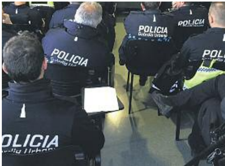
Hi ha 678 aspirants per a 12 places.

Les 12 persones seleccionades per cobrir les vacants a la Guàrdia Urbana rebran formació a l'Escola de Policia de Catalunya a Mollet del Vallès, men-