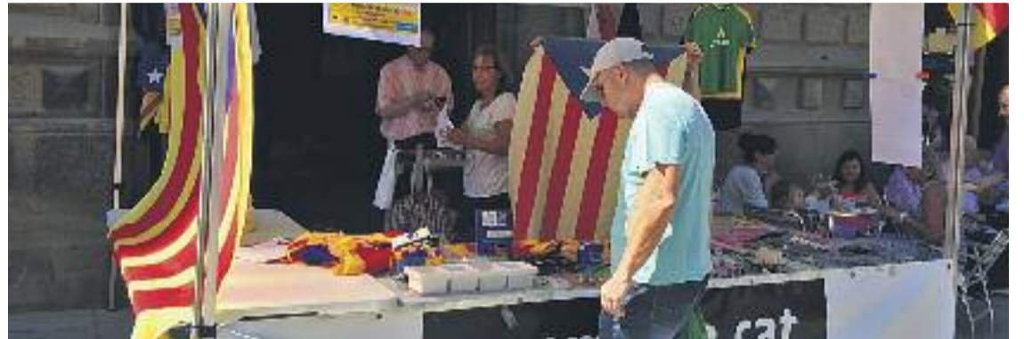
ANC i Òmnium intensifiquen la campanya pel Sí.

Més enllà del que passi a Barcelona, Badalona viurà l'acte institucional de la Diada el dia 11 a la plaça de la Plana, mentre que el dia 11 al matí la comissió Onze de Setembre organitzarà un acte que comptarà amb actes de cultura popular i els parlaments de l'escriptora Bel Olid i el polític i co-