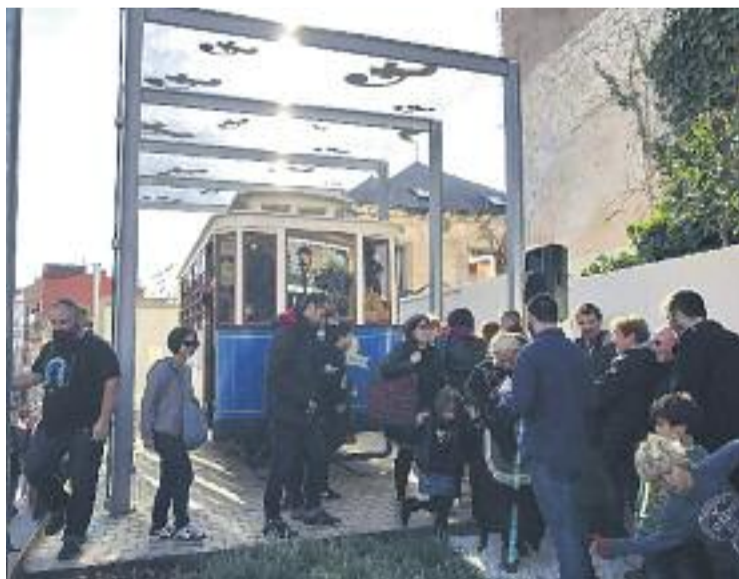
Diumenge hi haurà portes obertes del tramvia.

Abans d'aquest esdeveniment, però, la Festa Major donarà el tret de sortida demà amb la projecció de la pel·lícula