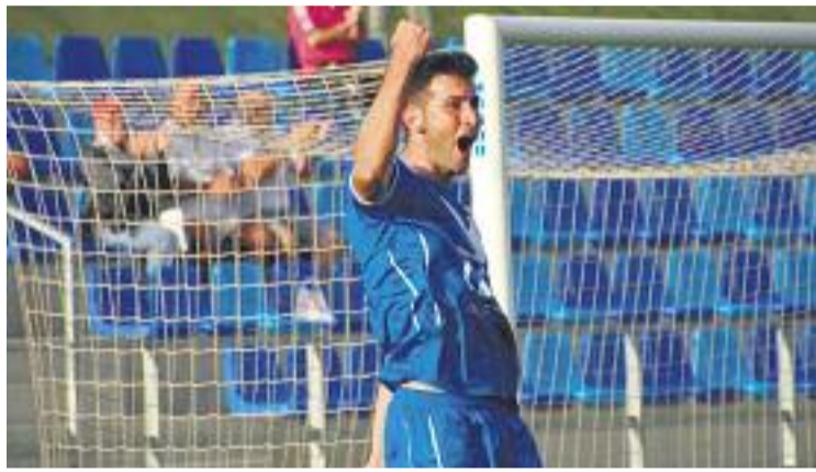
L'afició va poder gaudir de la primera victòria diumenge.

I és que malgrat que la temporada no ha començat com el