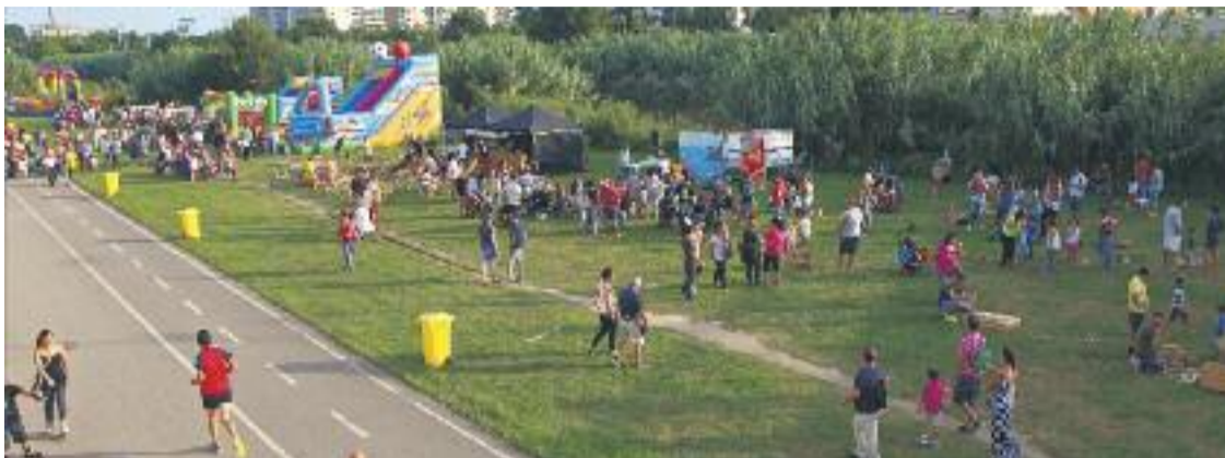
Dissabte se celebrarà la Festa del Riu.

Les activitats continuaran a la Rambleta des de les onze del matí a les dues de la tarda amb una festa de l'escuma en el marc de la Festa Radioaktiva. En aquest mateix marc, a les sis de la tarda s'organitzarà el torneig de monopati. A la mateixa hora, la plaça de la Vila acollirà el concert de l'Escola Municipal de Música Benet i Bails, a càrrec de l'alumnat del centre.