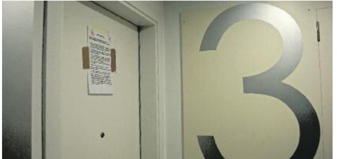
Un dels pisos ocupats al barri.

Un dels propietaris que resideix a l'edifici explica la seva versió. Ronda els 60 anys, prefereix mantenir l'anonimat i explica que va néixer al Camp de la Bóta. D'allà va anar a parar a un pis del carrer Mart, fins que un projecte de reforma el va portar a viure a Ramon Llull. "Jo ho tinc clar. Si algú intenta ocupar casa meua, aniré a tiro limpio", etziba al mateix temps que assegura que té armes a casa. "Si algú ho intenta, acabarà a l'hospital. Serà o ell o jo", afegeix. Tot i aquesta declaració d'inten-