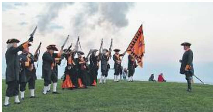
Una imatge d'arxiu de Montgat 1705 .

Hi haurà vaixells d'època, embarcacions lleugeres i nedadors, i la representació teatral de l'arribada del General Moragues a la platja de les Barques. Tot plegat es tancarà amb un mapping i el Cant dels Segadors. L'acte comptarà amb la participació de la Colla de Diables de Montgat, Duo Dance, els Miquelets de Badalona i els Cui-