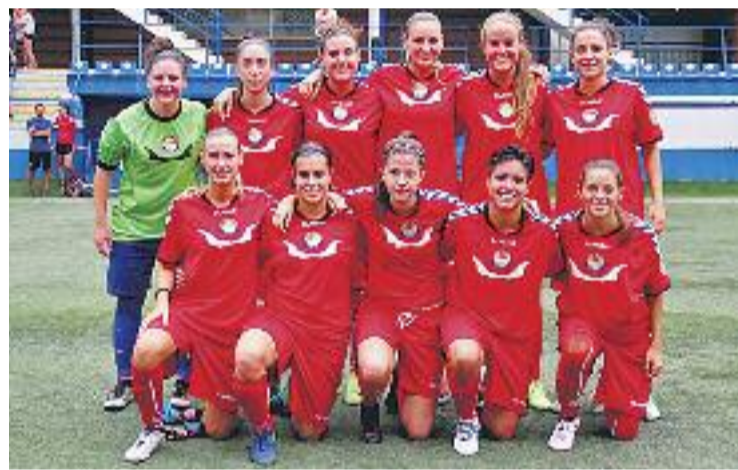
Les gavines tornen a ser candidates al 'play-off'.

Precisament les espanyolistes seran les pròximes rivals del Seagull (diumenge a les 12 del migdia a Badalona), mentre que el Sant Gabriel buscarà els primers punts del curs diumenge a les 4 de la tarda rebent el Son Sardina.