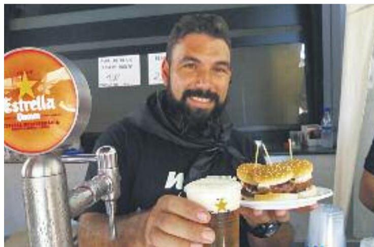
Els restauradors s'han bolcat amb el Corre-Tapa.

I què millor que aprofitar una Festa Major per reivindicar la cuina i la gastronomia cent per cent locals amb una ruta de tapes. Això és el que va fer Santa Coloma el passat cap de setmana, de la mà del Corre-Tapa, una ruta que va aplegar una cinquantena de bars i restaurants que van oferir una tapa i una beguda per tan sols 2,5 euros. La ruta estava dividida en tres zones de la ciutat diferents, i els colomencs que van visitar dos es-