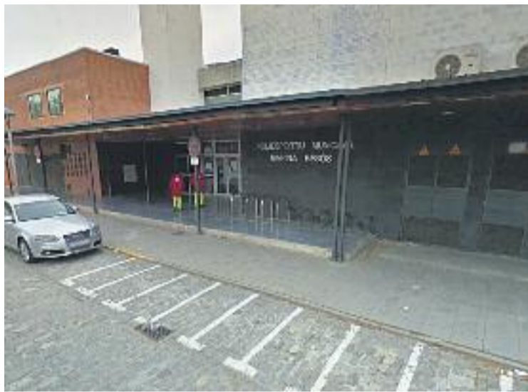
El Marina Besòs, en una imatge d'arxiu.

El Marina Besòs presenta ara diverses millores en les seves instal·lacions. S'ha instal·lat un equip de deshumectació destinat a incrementar la qualitat de l'aire de la piscina i a augmentar-ne