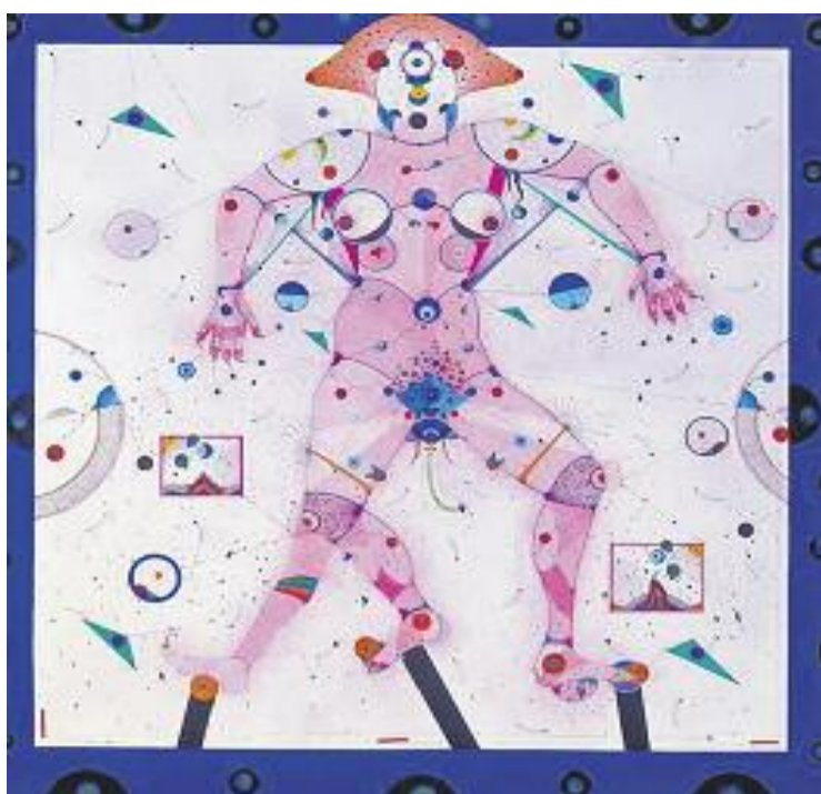
Una de les obres de l'exposició.