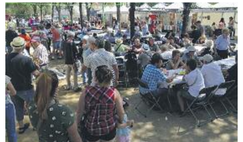
La fira va comptar amb una paella popular.

Hi van ser presents entitats com la cooperativa Capfoguer, Corneu Sereny, el grup de consum El Cabàs i algunes escoles.