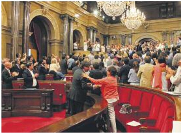
El Parlament va aprovar el 12 de juliol la Llei de renda garantida.

Quan acabi la fase de diagnòstic, l'Ajuntament i la Diputació