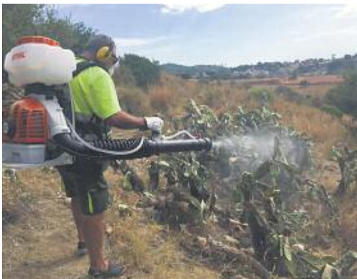
Els operaris ja han començat a treballar.

Un dels tractaments pautats per la Generalitat que s'havien seguit fins ara consistia a