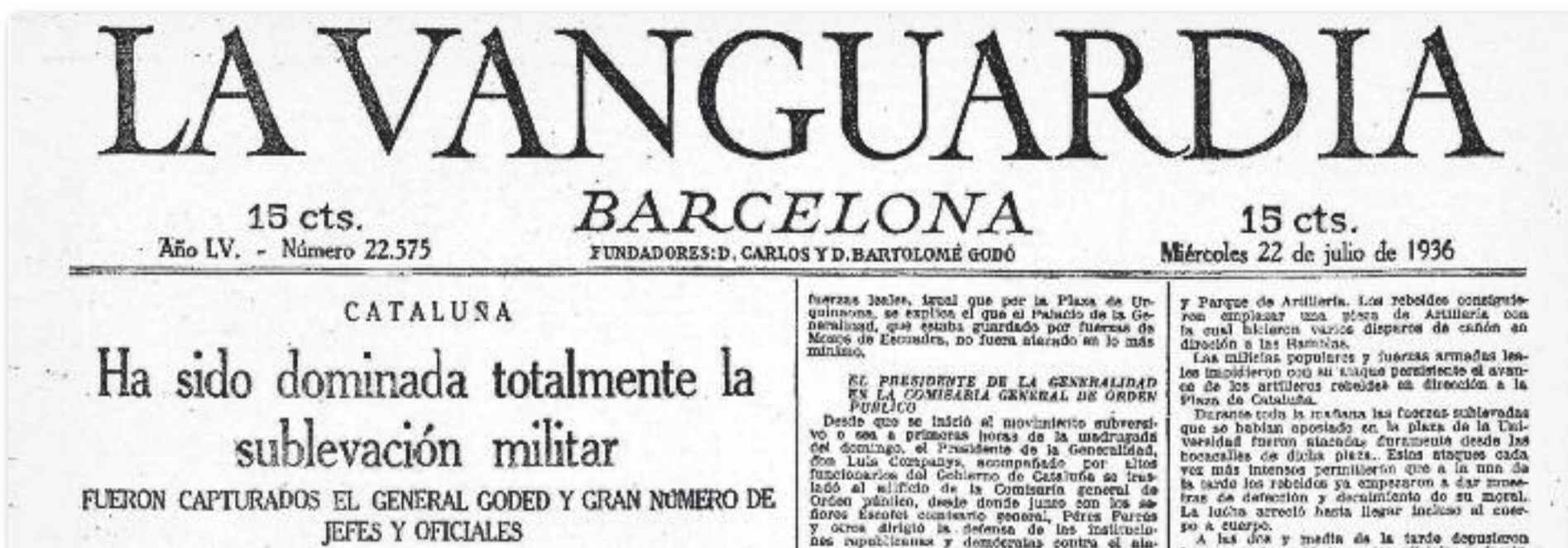
La premsa de l'època es feia ressò del fracàs inicial del cop d'estat del 1936 a Catalunya.