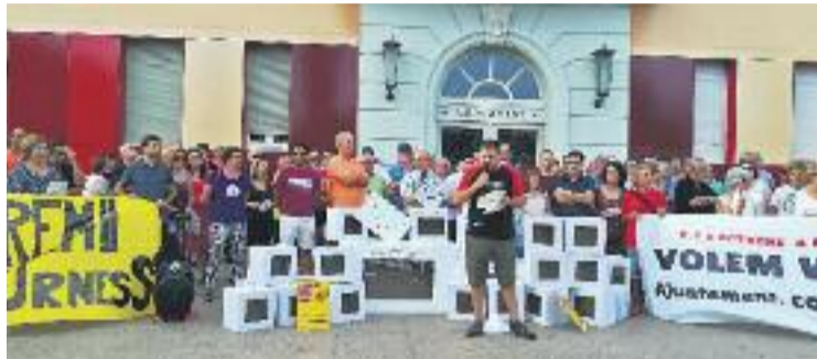
Una imatge de la concentració a la plaça de la Vila.