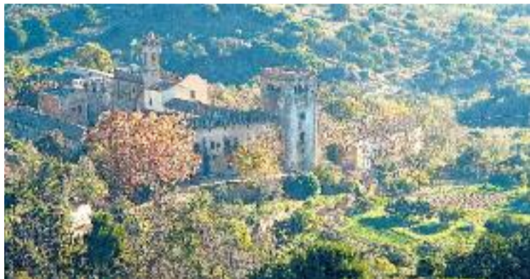
Una imatge d'arxiu de Sant Jeroni de la Murtra.

Un pla que la Diputació de Barcelona s'ha compromès a finançar. L'ens provincial, però, encara no ha rebut els permisos necessaris per part dels propietaris del monestir per entrar a la propietat i fer les tasques necessàries de diagnòstic per valorar l'estat actual de diversos elements pa-