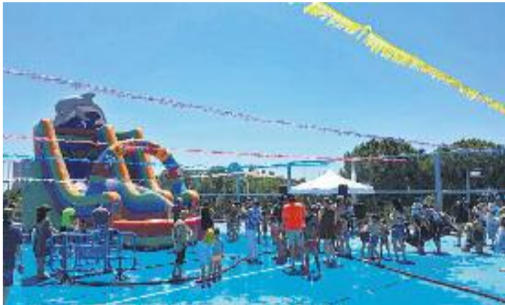
Una imatge de les festes de l'any passat.

El preu per als socis de l'associació de veïns és d'1,5 euros,