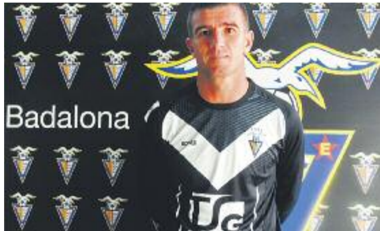
Morales complirà la seva tercera temporada al club.

La gespa de l'estadi ja acull els jugadors badalonins, que després de completar les primeres sessions de preparació durant aquests dies començaran a conèixer les seves sensacions dimecres que ve a la Ciutat Esportiva Dani Jarque, a Sant Adrià, en el primer amistós de la pretemporada contra l'Espanyol B. Després del matx contra el filial pe-