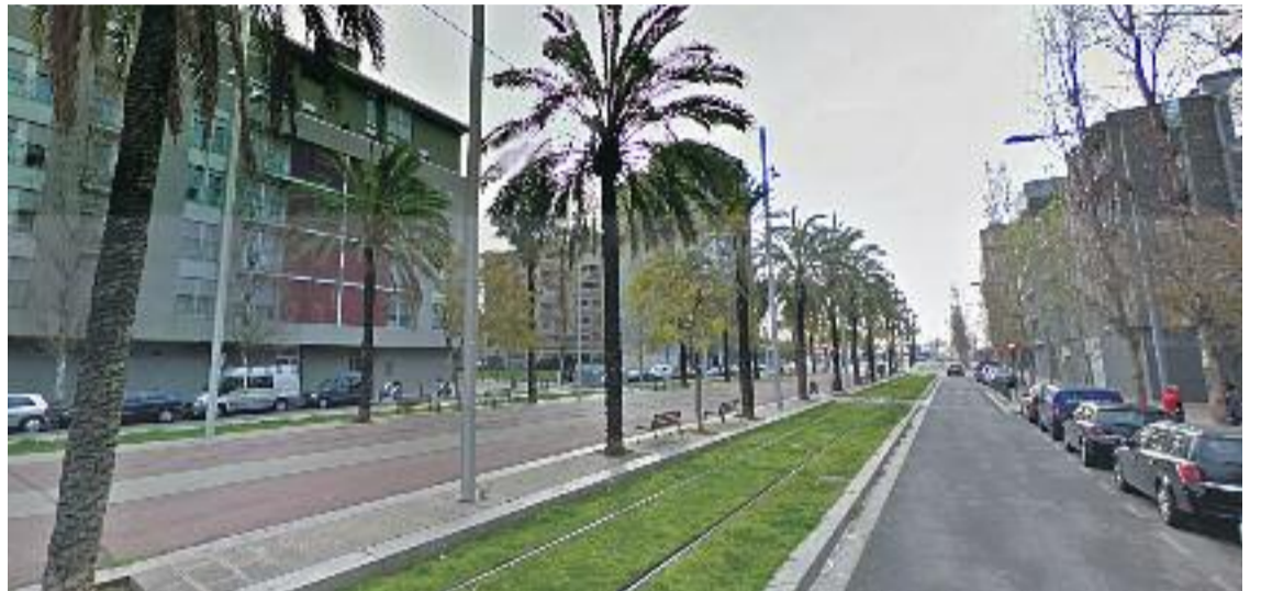
Alguns dels blocs ocupats són a la rambla de la Mina.

Els veïns d'aquest bloc que han atès Línia Nord asseguren no haver tingut problemes amb els ocupants però expliquen que altres veïns sí. "A mi m'és igual el que fa-