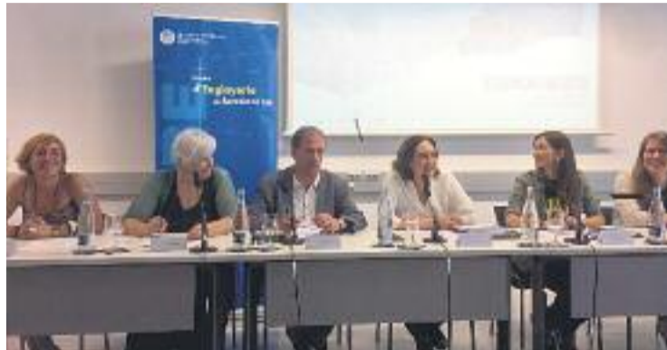
Representants dels municipis en la presentació de la proposta.

Més d'un milió de persones viuen en els 81 kilòmetres quadrats de l'àrea del Besòs, la qual cosa equival al 30% de la població de l'àrea metropolitana de Barcelona i el 12% de la població de tota Catalunya. Ara, els ajuntaments dels cinc municipis s'han posat d'acord per desenvolupar una estratègia d'inversions que, per exemple, se centraran en l'aigua del riu. En aquest sentit, es crearà una xarxa d'aprofitament d'aigua freàtica per als municipis.