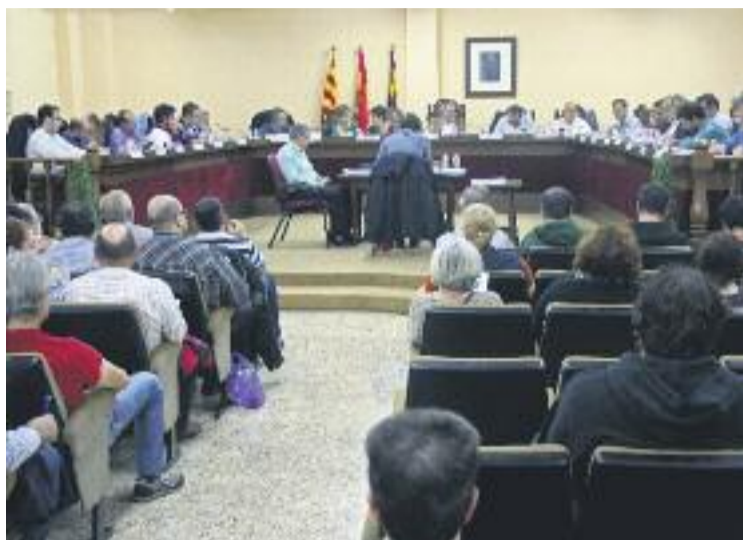
Una imatge d'arxiu del Ple municipal.

Un d'aquests processos judicials investiga l'obertura d'una discoteca a les piscines Marina Besòs el 2008. Precisament, aquesta polèmica és un altre dels punts de l'ordre del dia, ja que els partits demanen al govern que aclareixi el paper de l'Ajuntament en l'obertura de la discoteca i informi la resta de grups del moment en el qual es troba el procés judicial que, a banda de Ca-