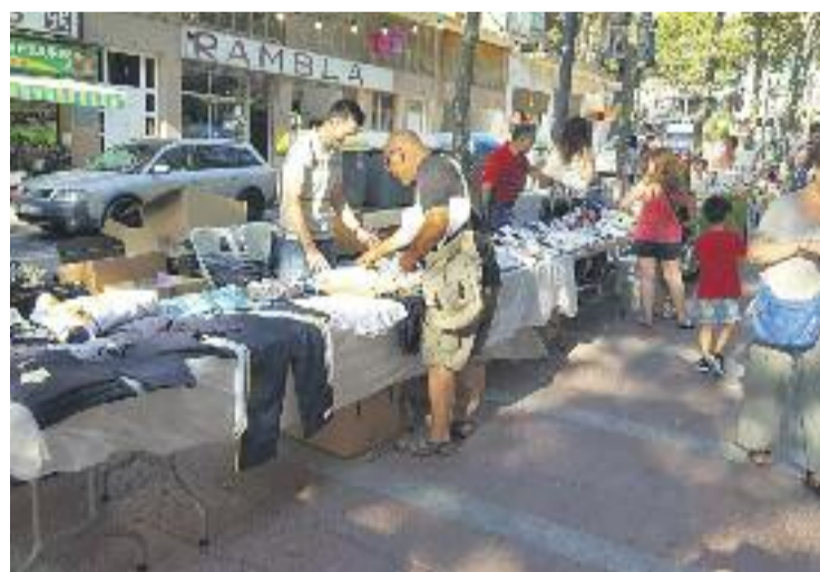
Les Rebaixes a la Fresca de l'any passat.

Les Rebaixes a la Fresca es desenvoluparan de sis a 11 de la nit per tal d'aprofitar les hores