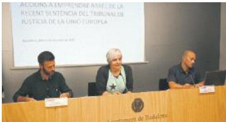
Un moment de la roda de premsa de dilluns.

El consistori defensa la legitimitat de la mesura per la darrera sentència del Tribunal de Justícia de la Unió Europea (TJUE), que al juny va establir que l'ex-