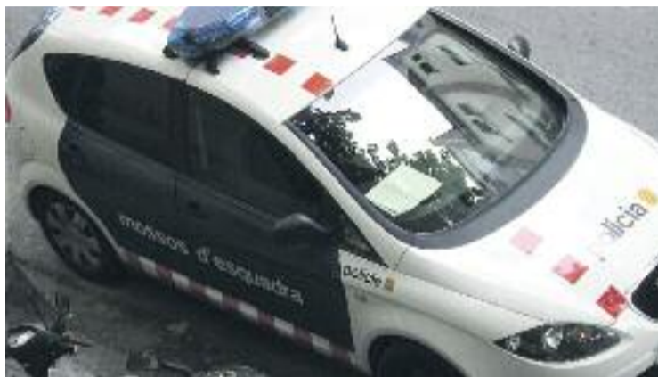
La detenció es va produir el 5 de juliol.

Ara, però, ha estat detingut per un robatori en una urbanització del poble. La Policia Local va avisar els Mossos i un cop al lloc, els agents van iniciar la recerca dels possibles autors fins que van localitzar un home que intentava fugir. Agents dels dos cossos policials van perseguir l'home, que feia cas omís de les seves indicacions, fins que finalment va ser interceptat. Els policies van comprovar que dos