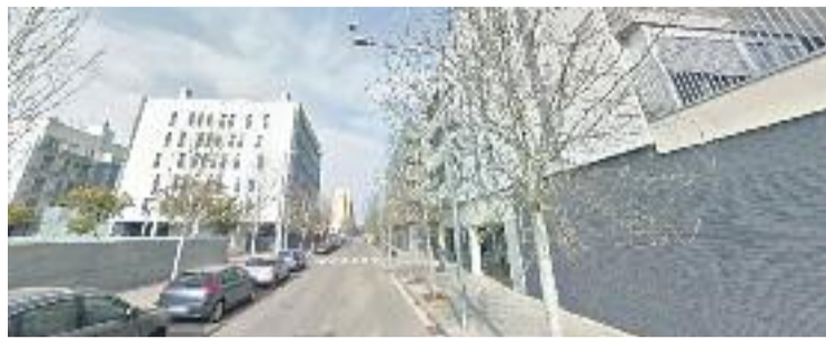
Part dels pisos ocupats són al carrer Anna Frank.

Segons fonts municipals, els 40 pisos estaven buits a l'espera de real·lotjar-hi veïns del bloc Venus, que des del 2002 esperen l'enderroc de l'immoble. Si aquest fet es confirmés, s'haurien ocupat gairebé dos terços dels habitatges propietat del Consorci dels 62 destinats a un futur real·lotjament. D'altra banda, l'Ajuntament ja havia canviat ahir els panys de 6 pisos dels 22 que