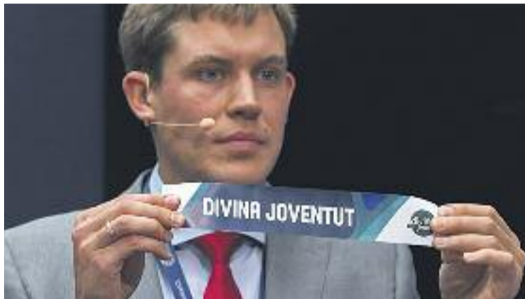
El moment en el qual va sortir la bola de la Penya al sorteig.

Si l'equip supera les rondes prèvies, entraria al grup D de la fase de grups juntament amb el