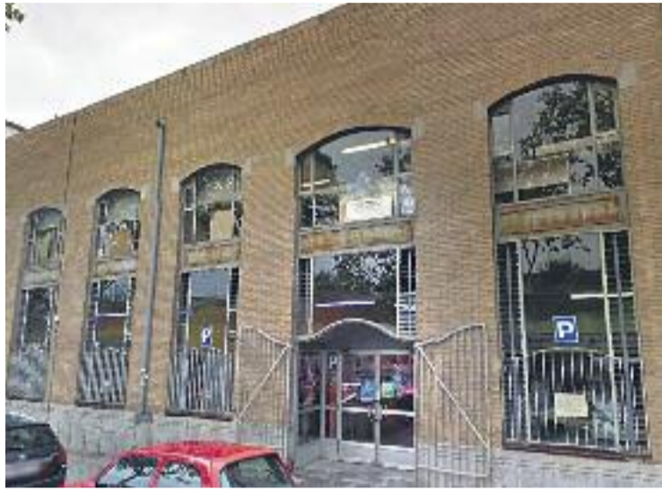
El mercat va ser inaugurat el 1987.

Com que el dia de l'aniversari cau en diumenge, els paradistes van decidir avançar la celebració als dos dies anteriors per aprofitar al màxim.