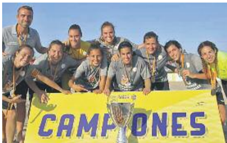
Pascu ha guanyat la Copa Catalunya amb el Roses.

Per la seva banda, Morera va formar part de la selecció espanyola que va acabar en cinquena posició al campionat d'Europa que es va disputar a Nazaré (Portugal). Les espanyoles no van poder revalidar el campionat que van conquerir l'any passat.