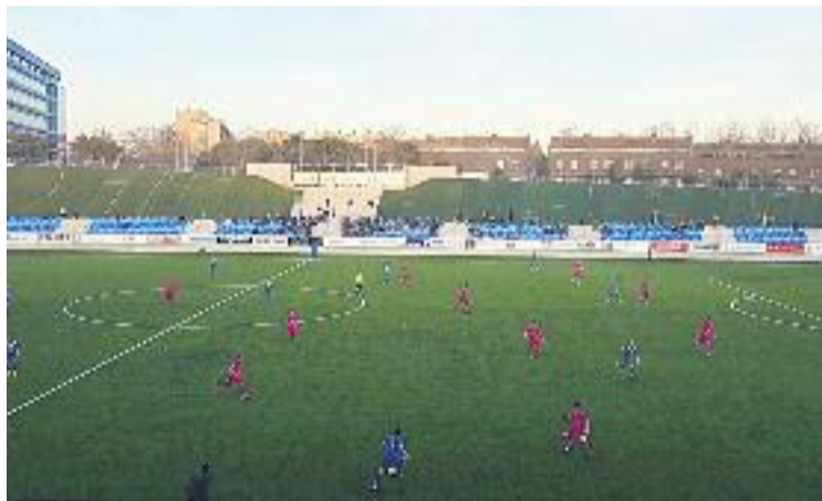
El club espera signar avui l'acord amb l'Ajuntament.