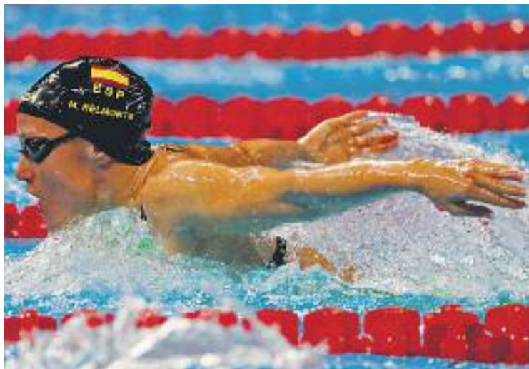
La badalonina viatjarà cap a Budapest en els pròxims dies.

BADALONA ▶ La gran cita de l'any 2017 ja és aquí. Demà al matí començaran els dissetens Campionats del món de natació a Budapest, la cita per a la qual els esportistes s'han estat preparant d'ençà que van acabar els Jocs Olímpics de Rio de l'any passat. I com no podia ser d'una altra manera, aquest és el cas de Mireia Belmonte que després d'haver-se recuperat completament de les molèsties a l'esquena que la van apartar del Mundial de Kazan de fa dos anys ja està a punt per afrontar un campionat que li arriba en un moment de plena maduresa.