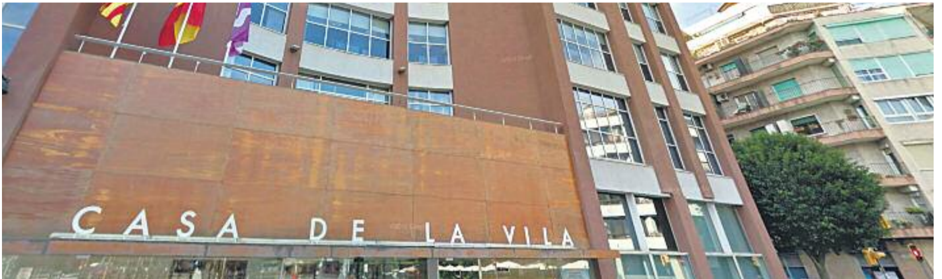
Els polítics i els tècnics municipals mantenen el seu silenci.