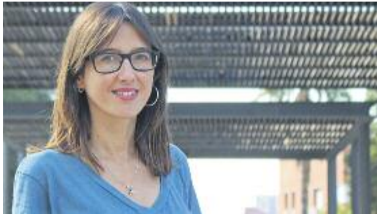
Els convocants volen que Parlon cedeixi locals municipals.

La convocatòria arriba després que al juny l'alcalde, Núria