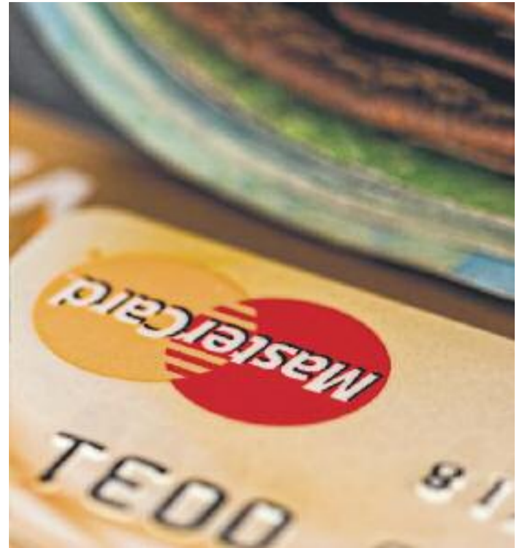
Les principals associacions de comerciants auguren un augment de vendes del 2-3%.