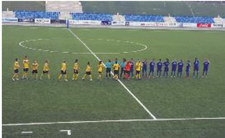
Els equips se saluden abans de començar el matx.