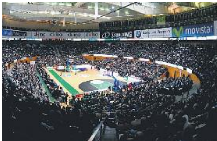
El club continua millorant la seva situació financera.