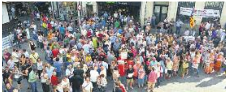
Centenars de badalonins van concentrar-se a la plaça de la Vila.

Els regidors de Guanyem i ERC van participar en la concentració i conjuntament amb el PDECAT van votar en contra de la moció impulsada pel PSC per rebutjar el calendari del procés sobirania i favorable a buscar un acord per una reforma constitucional. A banda dels socialistes, el PP va votar-hi a favor, mentre que Unió, Ciutadans i ICV-EUiA es van abstenir, amb la qual cosa el text es va