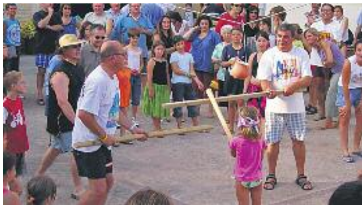
La Festa Major acabarà dissabte.

Dissabte, doncs, la Festa de l'Estiu agafarà el relleu de la Fes-