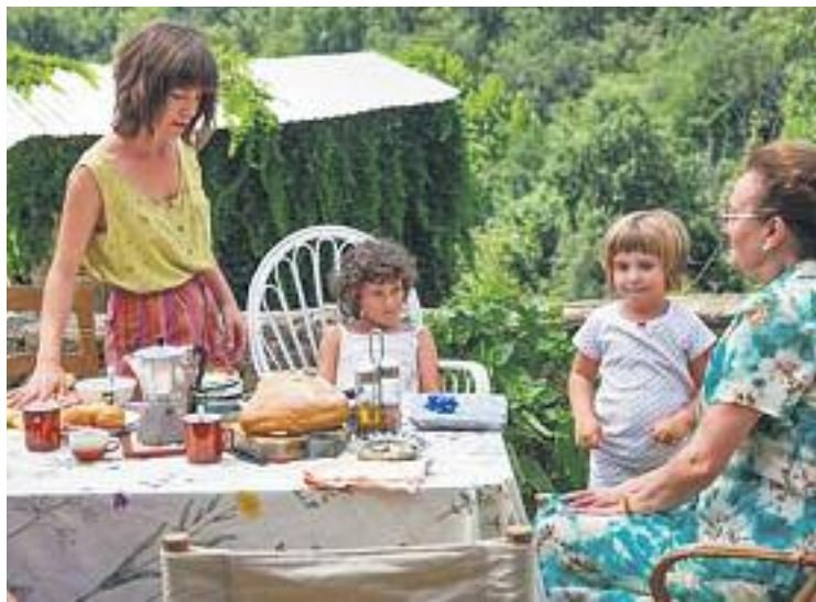
Una de les escenes de la pel·lícula. Foto: Estiu 1993

Simón ha reconstruït la seva història 25 anys després i la comparteix amb el públic havent pres la distància necessària. Els seus pares van ser dues víctimes