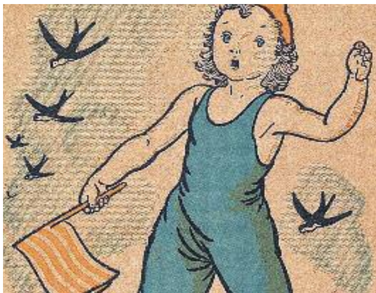
El Correllengua homenatja Lola Anglada.

D'altra banda, demà se celebraran diverses activitats al voltant de la figura de l'artista a diferents punts de Tiana, com una ruta guiada pel patrimoni arquitectònic de Tiana o un vermut a