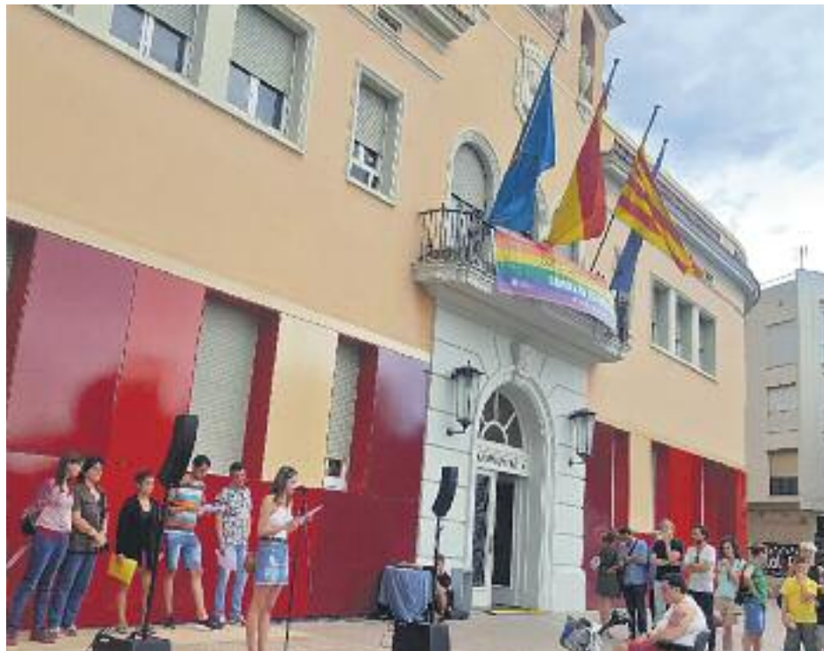
La comarca celebra el Dia Internacional de l'Alliberament LGTBI.