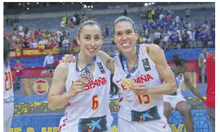
Les jugadores, eufòriques amb la seva medalla.