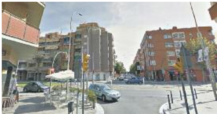
Sant Adrià lidera la ràtio de bars per cada miler de veïns.

L'estudi detalla la quantitat de bars per cada miler d'habitants de tots els municipis de l'Estat. En el cas de la comarca,