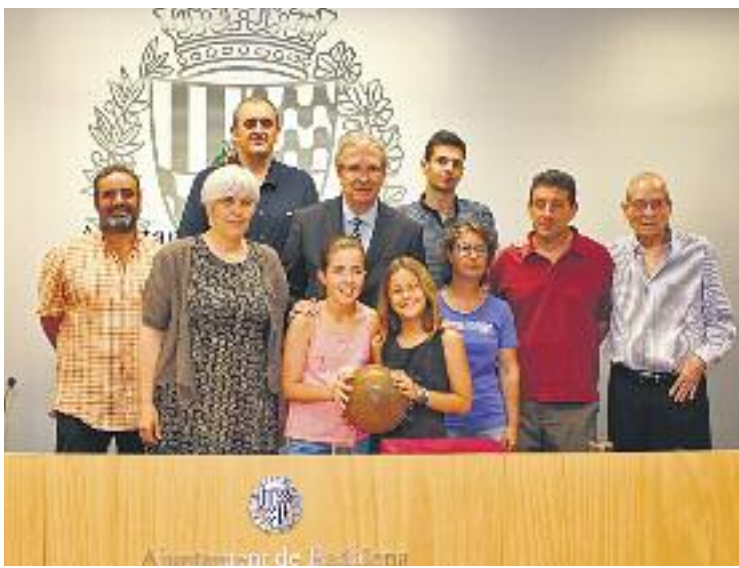
Un moment de la presentació de l'acord per construir el museu.