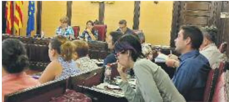
Una imatge del Ple de dilluns.

Per la seva banda, el govern va assegurar haver incorporat reclamacions veïnals al projecte de reforma i va defensar-lo, assegurant que obrirà la ciutat al parc fluvial.