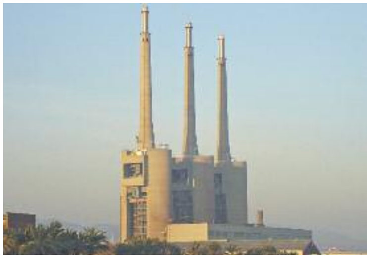
Badalona aprovarà el conveni al Ple de juliol.

A Sant Adrià va rebre el suport de tots els grups municipals, excepte Sant Adrià en Comú, que va manifestar la seva negativa al "model 22@", i el PP, que va qüestionar la inversió necessària