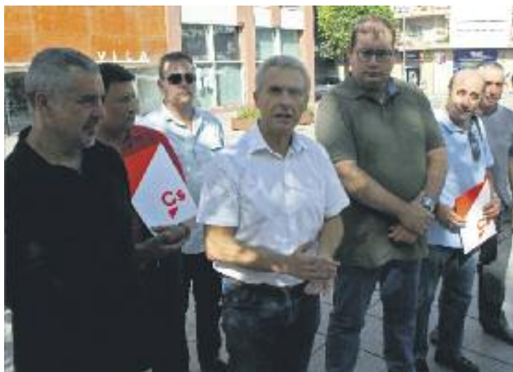
Pedro Sánchez (al mig) va demanar la dimissió de Callau el 14 de juny.

Ciutadans ha deixat clar que no vol Callau d'alcalde, tot i que preveu que la seva condició d'investigat en el marc del cas Marina Besòs s'acabarà arxivant.