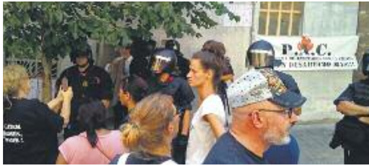
Els Mossos van carregar al carrer Autonomia el 21 de juny.

Ara, la PAC està tramitant una denúncia contra els Mossos ja que, al seu entendre, l'actuació de l'ARRO va ser desproporcionada. "Normalment, si volen fer fora la gent, fan un perímetre de seguretat i retiren les persones una per una. En aquest cas no va ser així", explica el president de la PAC, Llu-