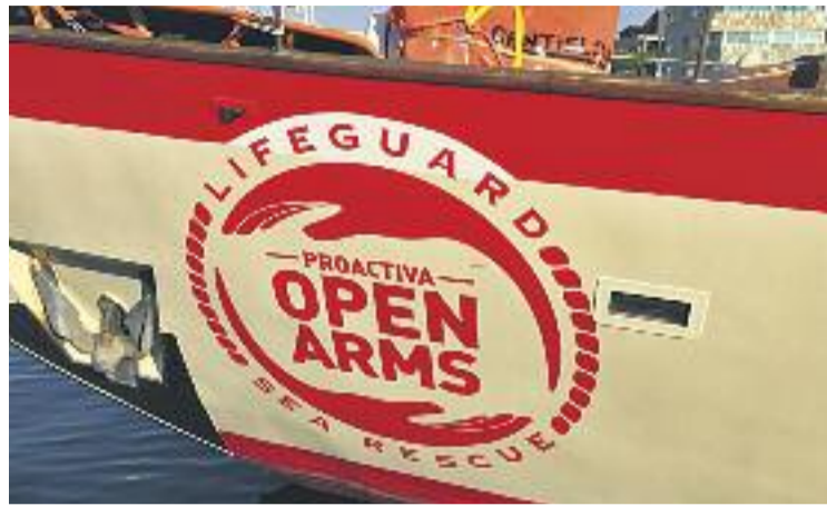
Proactiva, implicada en l'acord.

En una primera fase el conveni preveu reciclar les armilles per reduir aquest impacte. Al