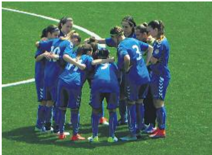
Les gavines han tornat a protagonitzar un gran curs.

En el partit d'anada, el conjunt d'Alacant va aconseguir una victòria per 3-1, l'únic triomf