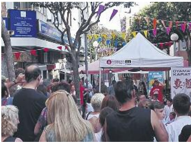
La fira va estar molt concorreguda. Foto: Passeig de la Salut

La voluntat de la mostra era que els clubs es donessin a co-