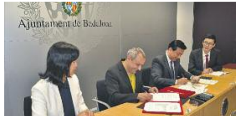
Ajuntament de Badalona

La delegació xinesa va estar acompanyada per la Cònsol General en funcions de la Xina, Tang Lingyun, també va mantenir una trobada amb representants del teixit empresarial al Badalona Centre Internacional de Negocis (BCIN).