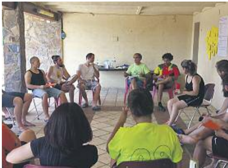
Els educadors en un moment de les jornades.

Durant les jornades a Badalona, 22 educadors de 17 països d'Europa i Àsia van visitar Badalona per intercanviar experiències sobre projectes d'educació social, igualtat de gènere i cooperació internacional a través de l'esport desenvolupats en les seves respectives associacions, institucions públiques, casals de joves o ONG. La xarxa està integrada per 40 entitats de 30 països diferents i totes tenen en comú que treballen l'educació no formal i l'esport de forma conjunta. "Ara els treballadors i voluntaris de La Rotllana aplicaran les conclusions extretes de la trobada i les metodologies de tre-