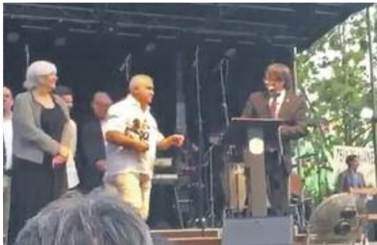
Puigdemont, xiulat durant el pregó de les festes de Sant Joan.

La xiulada va anar pujant de volum, mentre que al mateix temps també hi havia algun