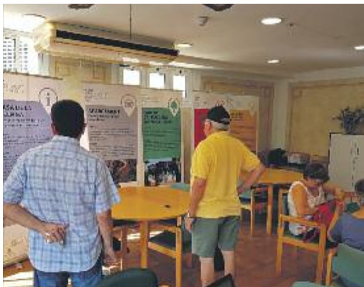
El procés ha durat del 12 al 18 de juny.

En tercer lloc els veïns van votar la millora urbanística del parc del Doctor Mascaró (470 punts), mentre que en