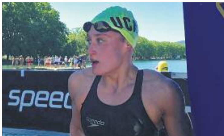
Belmonte, exhausta després de sortir de l'aigua.

BADALONA ▶ El compte enrere cap al mundial de Budapest continua, però Mireia Belmonte no perd el temps i aprofita l'espera per ultimar la seva preparació afegint més metalls al seu palmarès. El darrer va arribar diumenge passat, a Banyoles, en el campionat d'Espanya de 5 quilòmetres en aigües obertes, en una prova que es va decidir en els darrers metres a favor de la badalonina, que va aconseguir ser més ràpida que la júnior Paula Ruiz. Belmonte va aturar el cronòmetre en 57 minuts 52 segons i 9 dècimes.