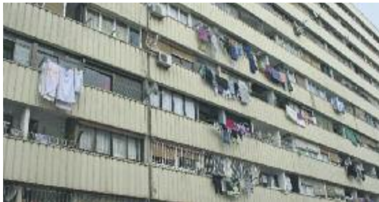
El bloc està pendent d'enderroc des del 2002.

Jiménez celebra que Puigdemont hagi complert amb la seva promesa però explica que aquesta vegada el president no va adquirir cap compromís. Això sí, el cap de l'executiu va escoltar novament les demandes dels veïns, que insisteixen en la necessitat d'enderrocar l'edifici. "Li vam demanar celeritat a l'hora de prendre la decisió. Aquí no s'hi pot es-