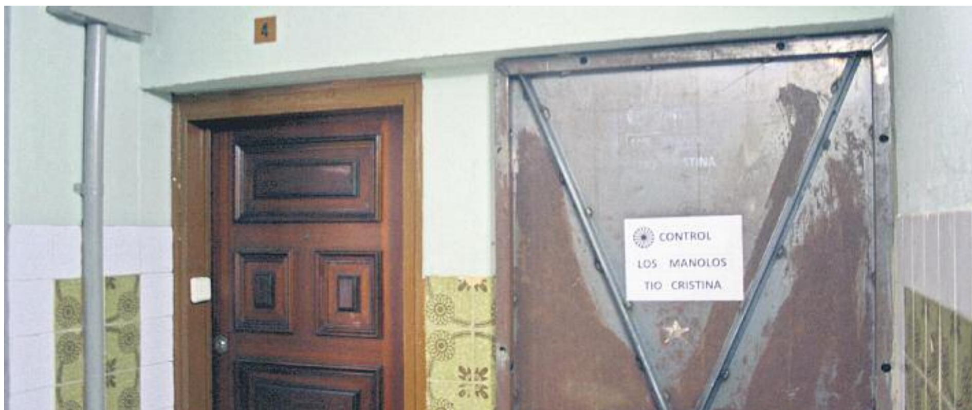
Una placa indica que un pis està vigilat pel Tío Cristina.