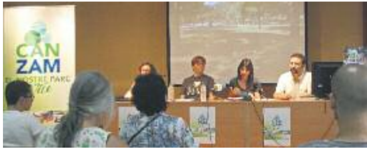
Una imatge de la roda de premsa de presentació.

A més, hi haurà una tercera via per recollir propostes. L'Ajuntament repartirà butlletes per tota la ciutat on hi ha vint propostes d'elements que es podrien instal·lar al parc, des d'una zona de tir amb arc fins a un rocòdrom, passant