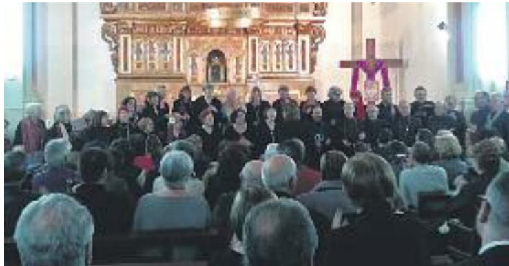
Una imatge del concert coral de l'any passat.

D'altra banda, el dia 24 començarà amb la traca i el repic de campanes als carrers del