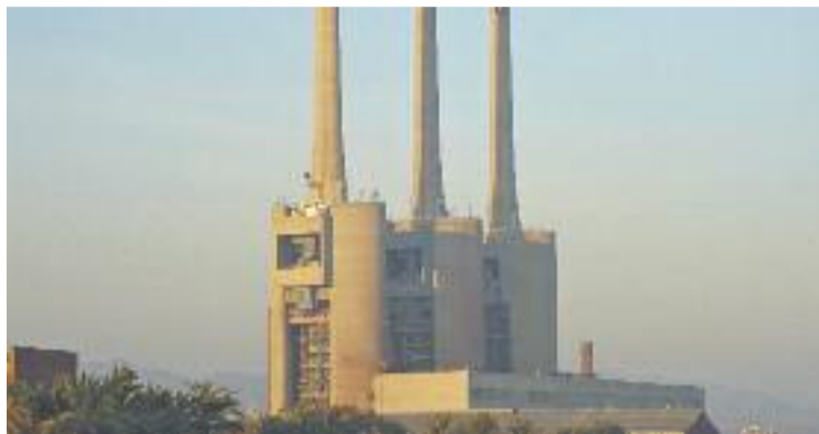
Les Tres Xemeneies, en una imatge d'arxiu.

Una intenció que va en contra de la postura inicialment plantejada per l'Ajuntament de Sant