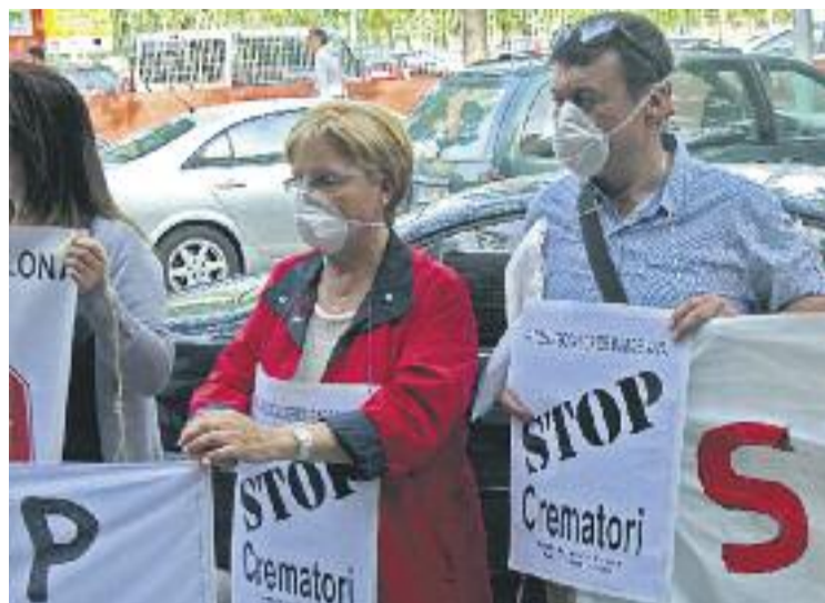
Les protestes contra el crematori continuaran.

La notícia va ser rebuda amb optimisme per aquells que s'oposen a la inclusió d'un crematori al projecte, una oposició liderada per la plataforma Stop Crematori. De tota manera, l'informe del secretari no és vinculant i l'Ajuntament va obrir la setmana passada un període d'audiència pública amb totes les parts interessades per escoltar els seus arguments, que acabarà la setmana que ve.