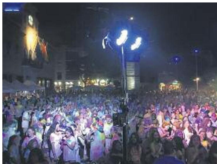
La festa Holi va posar el punt final a l'acte.