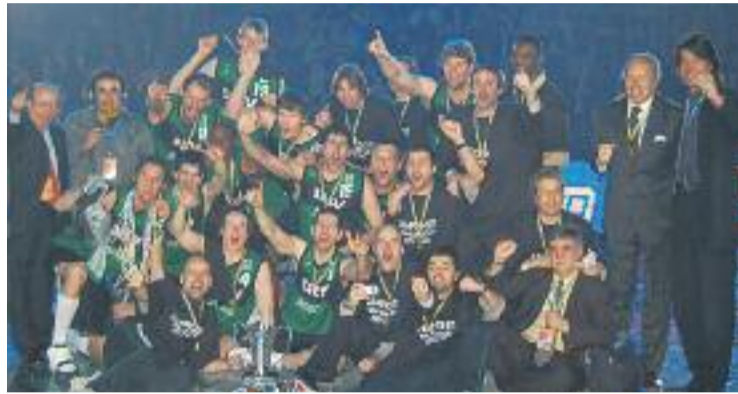
La celebració de l'Eurocup del 2006 a Kíev.

“És un repte molt il·lusiónant. És molt bo per als jugadors, per al club, que ha treballat molt i molt bé per rebre la invitació, per al cos tècnic i per a l'afició”, explica a Línia Nord l'entrenador Diego Ocampo. El tècnic d'Ourense considera que aquesta com-