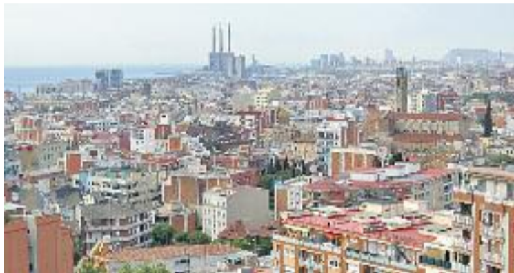
Badalona estrenarà aviat un parc públic d'habitatge.

El Consell Municipal d'Habitatge, coordinat per l'Ajuntament i del qual formen part entitats socials, actors econòmics i sindicats, hauran de decidir ara quina és la ubicació definitiva d'aquestes promocions. La voluntat és no construir els tres edificis en la mateixa zona i, al mateix temps, fonts municipals asseguruen en declaracions a aquesta publicació que la voluntat és evitar una guetització d'aquests pisos de lloguer social. És a dir, no ubicar-los en barris densament poblats i amb dificultats socioeconòmiques. En aquest sentit, alguns dels barris que com-