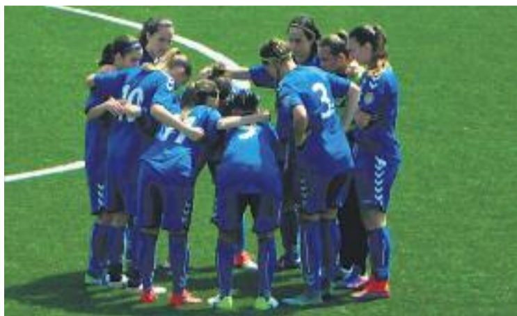
L'equip fa pinya abans del primer partit.

L'equip viatjarà demà passat cap a Alacant. "Anirem amb autocar, amb els pares i l'afició. No