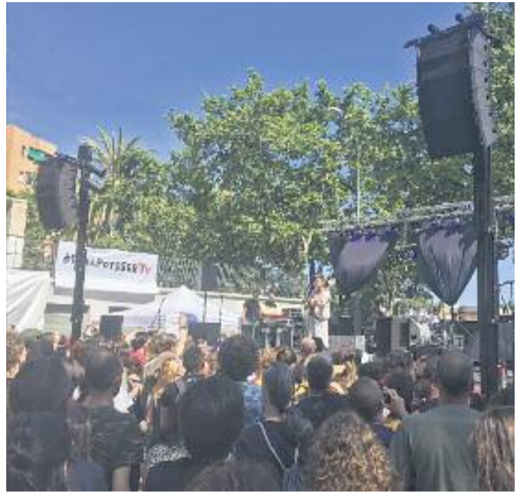
Albert Pla, durant el seu concert de diumenge.

Amb el crit final de "no tenim por", artistes i públic van cloure un acte multitudinari en forma d'autoinculpació col·lectiva. "Mai més no ens imputaran soles", va ser el missatge que durant el concert va publicar No Callarem a les xarxes socials.