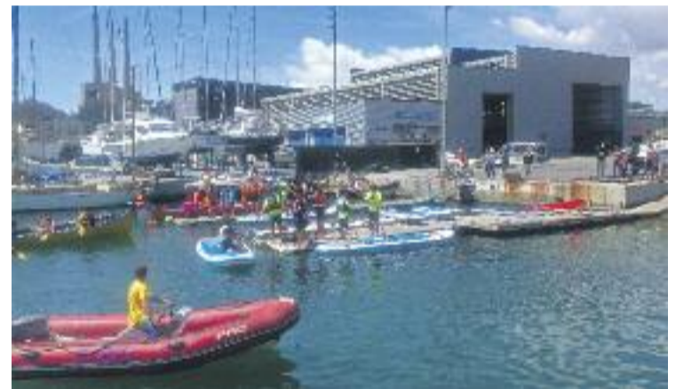
La rampa del port va registrar molta activitat.

Per tot plegat, els organitzadors consideren que la fira Inicia't s'ha consolidat.