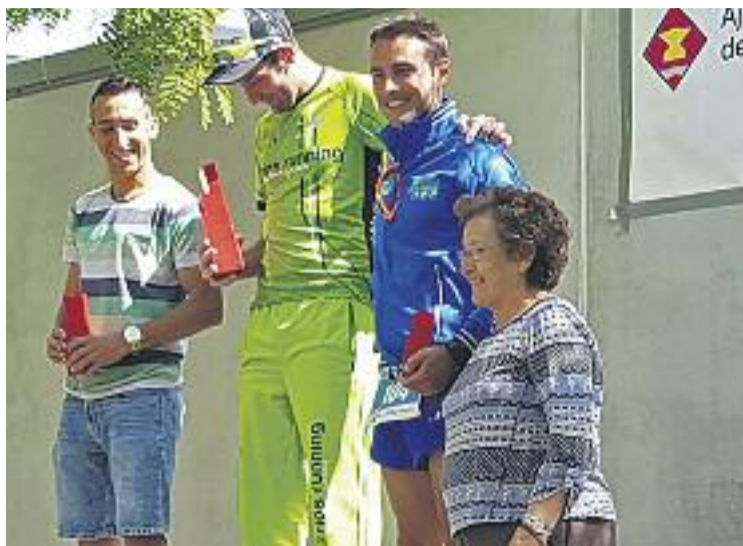
La cursa solidària va donar el tret de sortida a la Setmana Cultural.

El tret de sortida d'aquesta iniciativa cultural el va donar el 21 de maig la segona edició de la Cursa Solidària de la Mina. Des d'aleshores, s'han organitzat activitats d'horts urbans, s'ha fet una mostra d'entitats locals i s'ha presentat el programa de detecció precoç de càncer de còlon i recte. D'altra banda, els joves també han tingut protagonisme, amb la lectura del seu Manifest educatiu i demà a la tarda tornaran a la càrrega a la Rambla amb el Dia del Joc, organitzat per la Comissió d'Acció Comunitària del PEB MINA i que comptarà amb la participació de Fem Família, Espai jove, la capsa dels jocs i l'Associació Casal Infantil La Mina. Demà a partir de les cinc de la tarda també