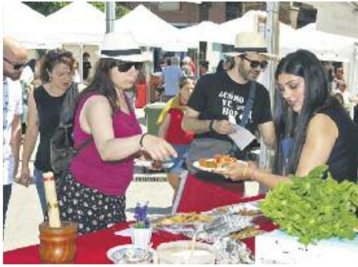
Un moment de l'edició de l'any passat.

De fet, el Sabors del Món és una bona oportunitat per conèixer la cuina de diferents països que es pot tastar a la ciutat, des de la marroquina fins a la hindú, passant per la italiana o la japonesa, entre altres.