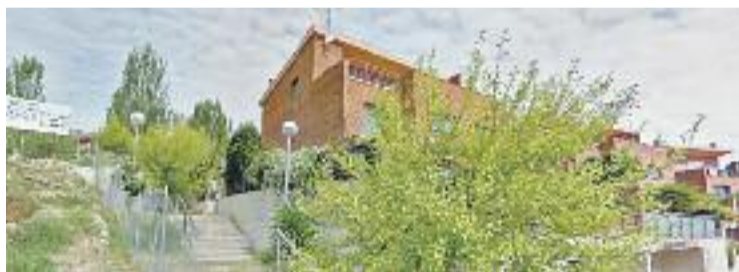
Una imatge d'arxiu de la urbanització.