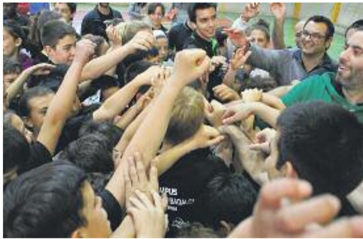
Una imatge d'un dels campus del club.

Totes aquelles persones que estiguin interessades en aquest