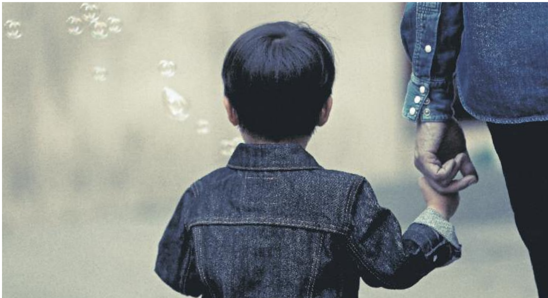
El Departament de Treball, Afers Socials i Famílies ha dissenyat un pla per aconseguir més famílies d'acollida.

» La Generalitat busca un centenar de famílies acollidores per a nens i nenes d'entre 0 i 6 anys