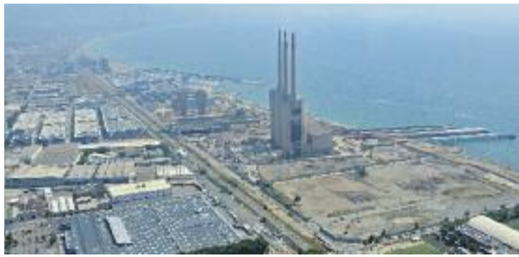
Les Tres Xemeneies encara són propietat d'Endesa.

En aquest sentit, els municipis del Besòs no volen acceptar la cessió proposada per la companyia elèctrica si abans aquesta no