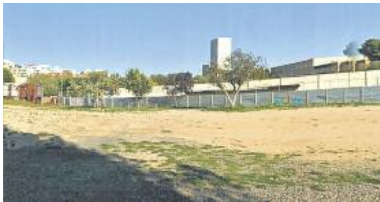
El parc de Can Zam, pendent del seu futur.

Per la seva banda, la Plataforma per a la Defensa de la Serra de Marina i Can Zam avança que també treballa en la proposta que presentarà al procés participatiu. En aquest cas, la plataforma reivindica establir