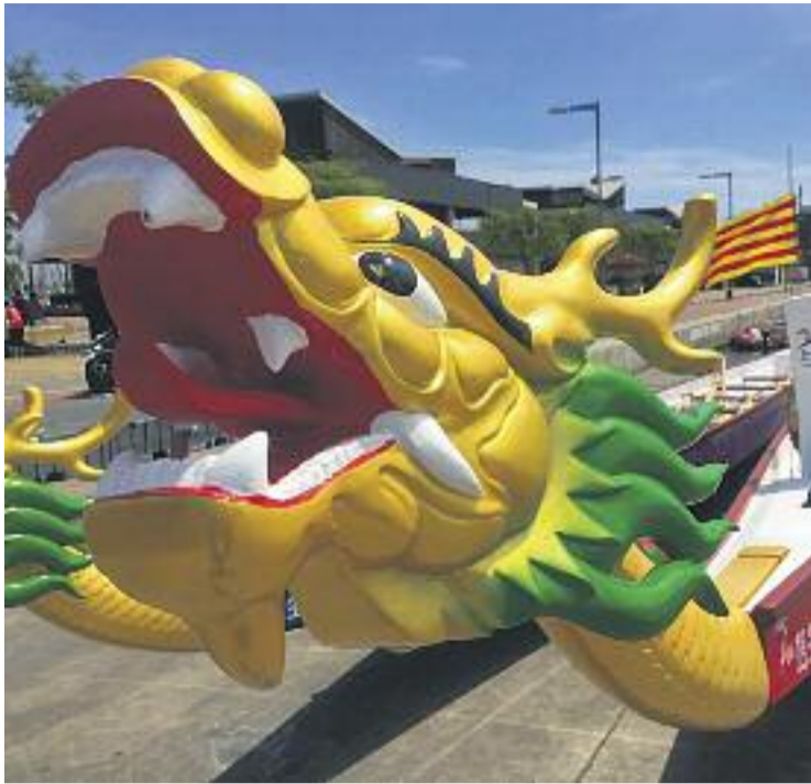
El Dragon Boat arriba a Badalona.