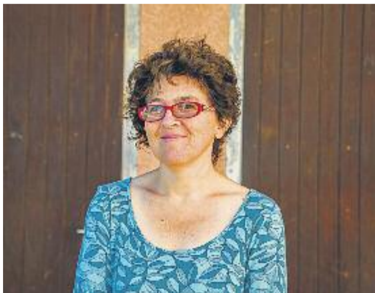
Castro, en una imatge d'arxiu.

Poc menys de 48 hores després de la presentació a Tiana, l'escriptora anunciava a través del seu compte de Twitter la seva dimissió del càrrec. "Vull tornar a les bases, a picar pedra, tornar a treballar de ple a la meua sectorial de Traductors i Intèrprets", va dir. "Tinc tres o quatre llibres a mig fer que crec que podrien ser útils a nivell estatal i internacional per la nostra causa", afegia. En aquest sentit, Castro vol donar continuïtat a la feina feta amb el llibre presentat a Tiana, un recull d'actes de