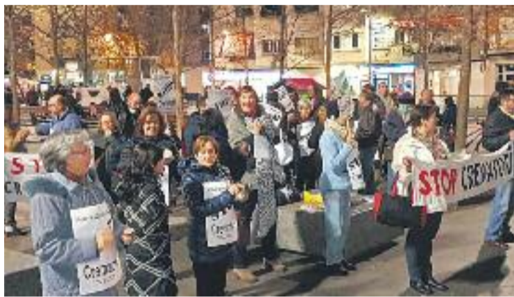
Stop Crematori va convocar dilluns una nova cassolada.

Cal recordar que, si bé l'empresa Tanatori del Litoral va ad-