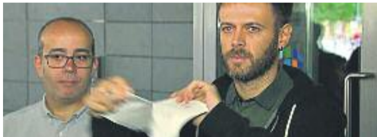
La imatge de l'estripada de Téllez que ha quedat per la memòria.

D'altra banda, la interlocutòria assegura que no ha pogut tenir accés a les gravacions de les càmeres de seguretat de la recepció del Viver i afegeix que, segons explica la Guàrdia Urbana,