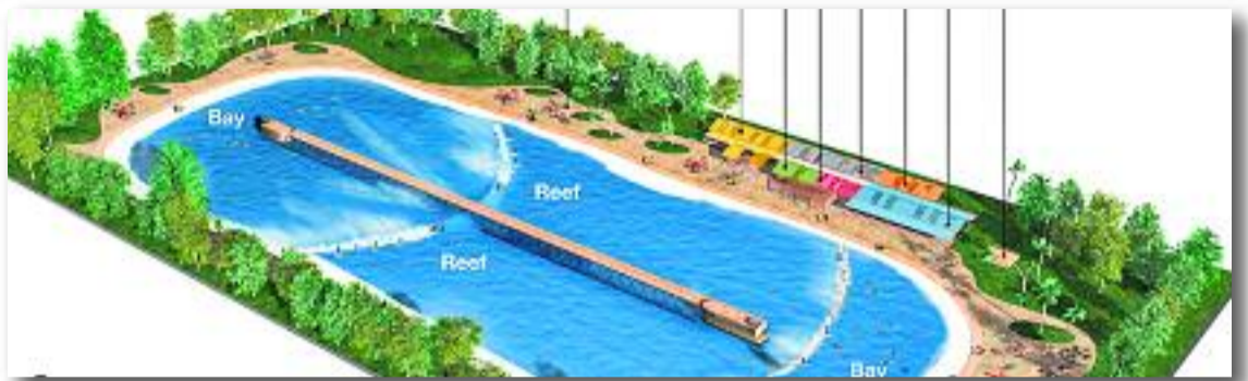
Una projecció de com seria el macrocomplex.

Sigui com sigui, ara tot depèn de l'Ajuntament. El govern municipal encara no ha entregat les llicències d'activitats i construcció necessàries per desenvolupar el projecte i la decisió haurà de passar pel Ple municipal. En declaracions a aquesta publicació, l'alcalde Rosa Funtané assegura que donaran llum verda al macroequipament si poden assegurar que no suposarà "cap molèstia" per als veïns. "No volem repetir els errors comesos en altres equipaments lú-