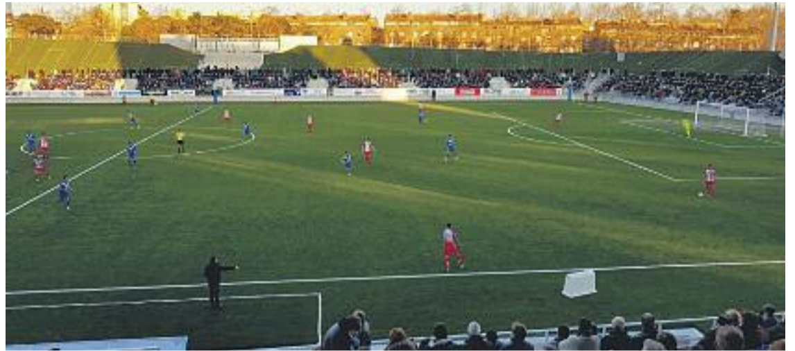
L'afició va poder gaudir de l'estrena de l'estadi en una jornada rodona.