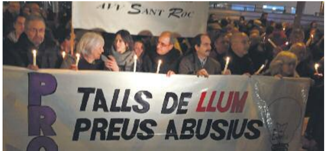
Una imatge de la concentració d'ahir a Badalona.

Per la seva banda, Santa Coloma va aprovar al Ple de dilluns una moció contra les "pràctiques abusives" del sector elèctric, presentada pel PSC. El govern municipal de Núria Parlon denuncia que des del 2008 les tarifes han pujat un 73% i en l'últim mig any un 25%. Amb aquest context, el Ple va aprovar instar el govern estatal a reduir l'IVA de la factura elèctrica, així com a acabar amb el sistema de subhasta actual, a través del qual es fixen els preus de l'electricitat.