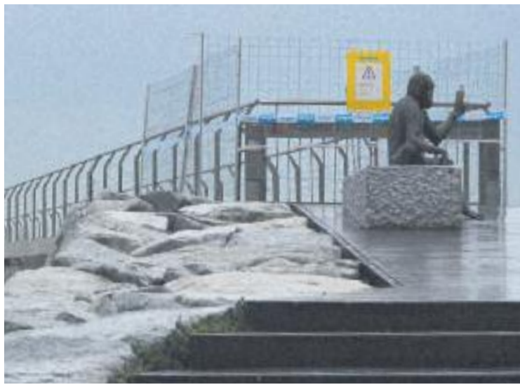
El vent va moure lleugerament l'estructura del pont.

Les parts del pont que, després de la primera avaluació, es creu que no s'han vist afectades