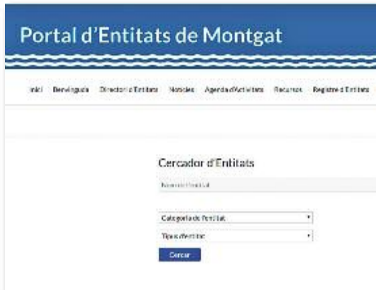
L'Ajuntament preveu inaugurar el portal l'1 de febrer.

Segons el pla de treball previst pel consistori, els dos grups