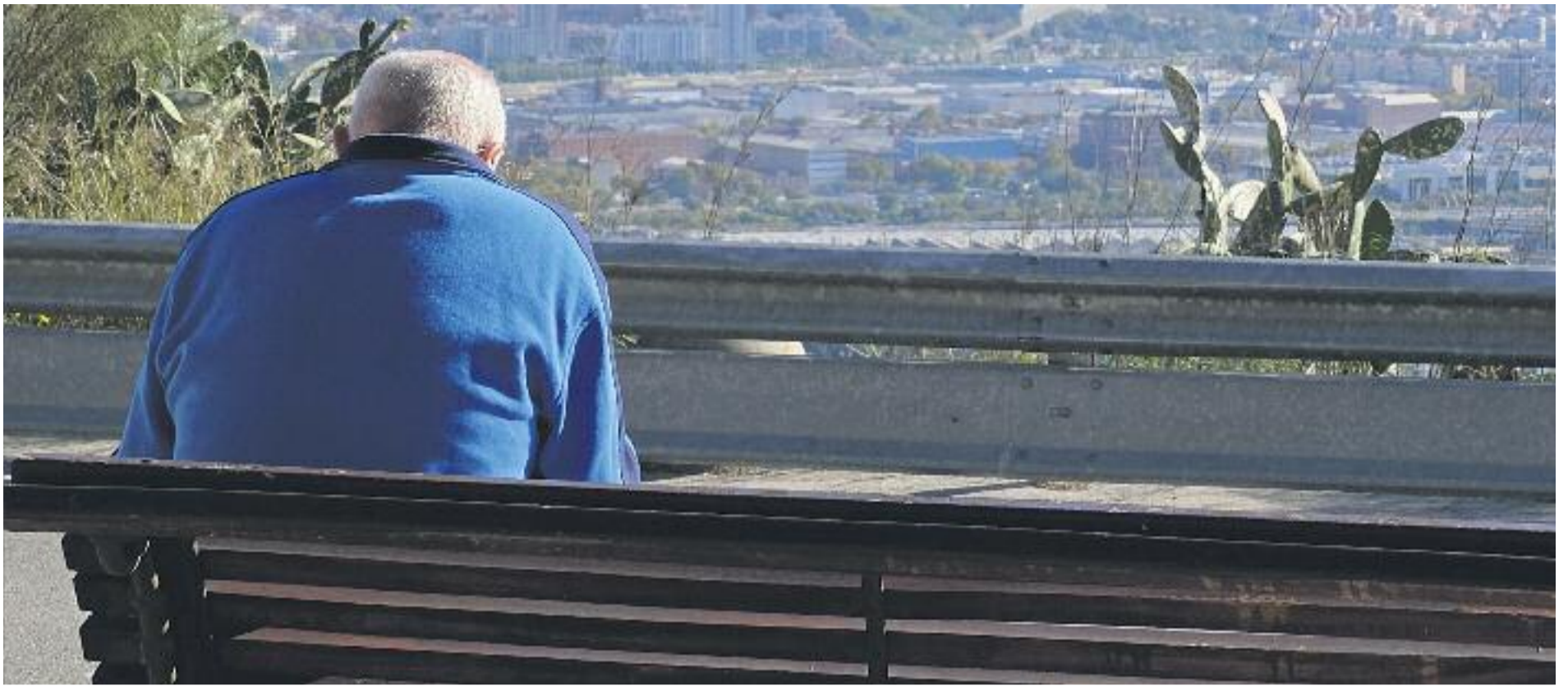
Les diferències en esperança de vida són una altra cara de la desigualtat.