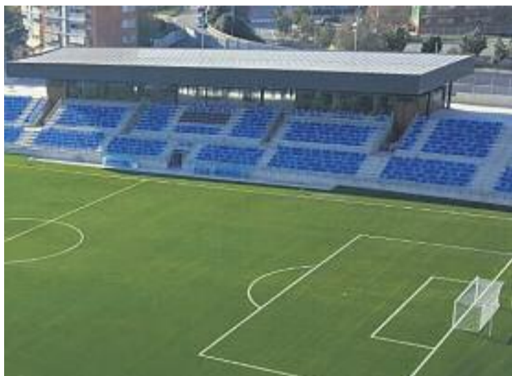
El nou estadi, preparat per l'estrena.