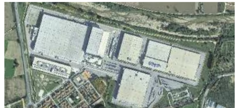
La planta actual de Bershka a Tordera.

EMPRESA ▶ L'empresa Bershka, que forma part del grup Inditex, podria instal·lar-se aviat a Sant Adrià. Concretament, als terrenys de l'antiga fàbrica Schott Ibérica, que va tancar el 2014. Segons informa el portal digital especialitzat en moda, Modaes.es , Bershka està negociant per traslladar les seves oficines centrals a la ciutat. Per la seva banda, l'empresa no ha confirmat ni desmentit la notícia i ha declinat fer cap comentari més.