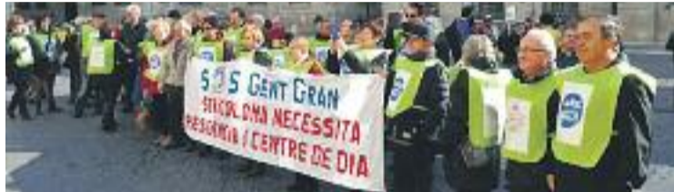
SOS Gent Gran es va manifestar dimarts a Barcelona.

Pel que fa a la residència, l'Ajuntament ja té reservats els terrenys on s'hauria de projectar. En relació amb el centre de dia, la Generalitat hauria de posar en funcionament l'espai ja construït i re-