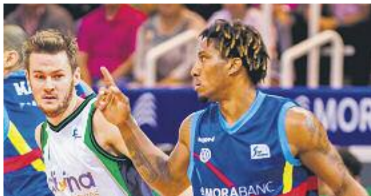
Una imatge del partit de la primera volta.

La victòria es va tornar a escapar in extremis . Els verd-i-negres no van gestionar bé el seu avantatge i van perdre diumenge passat a la