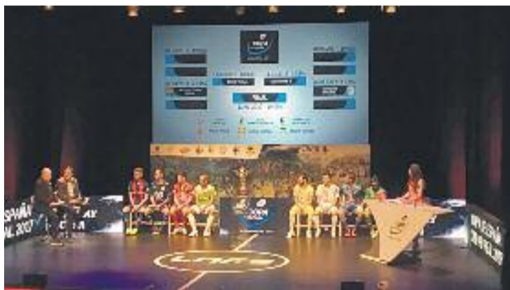
Un moment del sorteig d'ahir al migdia.

LA SELECCIÓ ENTRA EN ESCENA Amb la lliga aturada, el protagonisme serà per a la selecció. I és