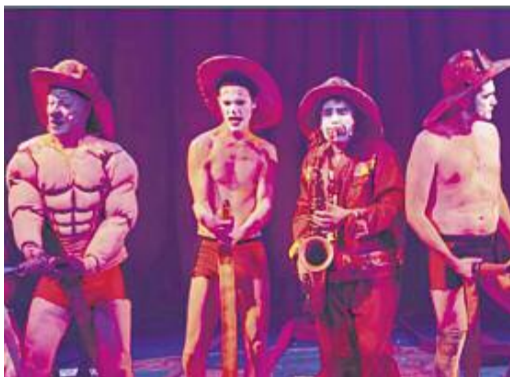
Rhümia va guanyar el Premi Zirkòlika 2016.

El muntatge de Rhum&Cia vol reivindicar que hi ha un altre món possible. Un món que se situa en una casa de pallassos, no gens diferent de qualsevol llar d'arreu del món. "El circ és qualsevol univers i cada casa és un circ on tothom hi té cabuda". Aques-