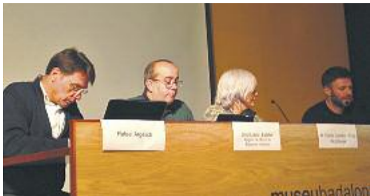
El govern local va presentar ahir l'alternativa de Montigalà.

En aquest sentit, la presidenta de la fundació recorda que amb el projecte inicial que ells defensen –el qual portaria dos supermercats més de Mercadona a la ciutat, a Sant Roc i a Morera, fet que preocupa els co-