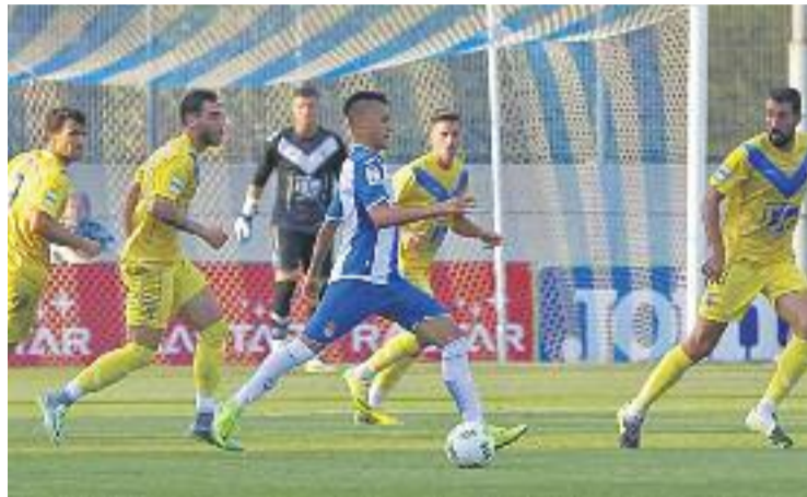
Un moment del partit de la primera volta.

A més, el partit contra el conjunt de David Gallego serà el primer que l'equip jugarà al nou Camp Municipal de Badalona, un cop s'ha aprovat el conveni d'ús d'aquest equipament [veure més informació a la pàgina 10]. El