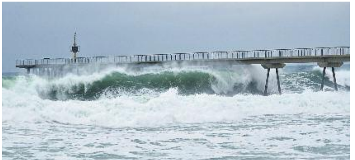
Les onades van arribar als 8 metres d'alçada.

El punt més afectat és el pont del Petroli, després que les onades danyessin les baranes de la plataforma del final de l'estructura i les fustes de la passarel·la. Ara, el consistori badaloní està a l'espera de conèixer els resultats d'un informe encarregat per veure si el pont també pa-