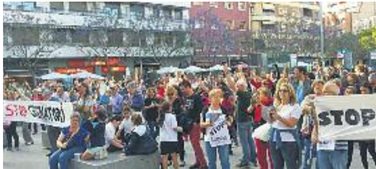
La plataforma Stop Crematori exigeix respostes.

La moció aprovada al Ple del mes de maig proposava "deixar sense efecte" la clàusula contractual que inclou el forn en el projecte de tanatori i més tard l'Ajuntament es va comprometre a encarregar un informe sobre la viabilitat econòmica d'un equipament funerari sense crematori. Un informe que també definiria si el consistori hauria de compensar Tanatori del Litoral per renunciar al forn. Fonts de la plataforma Stop Crematori lamenten el silenci institucional i asseguren no haver rebut cap informació sobre les ne-