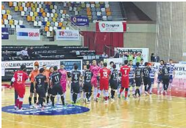
L'equip ha perdut els dos partits que ha jugat aquest any.