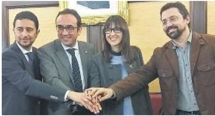
Imatge de la signatura al Saló de Plens de l'Ajuntament.

L'acord es va escenificar abans de Nadal amb la signatura del conseller de Territori i Sostenibilitat,