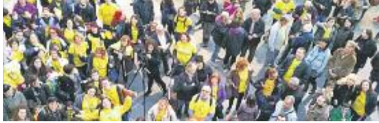
La comunitat educativa badalonina s'implicarà en la vaga del 9 de febrer.

Tot i que tant la comunitat educativa colomenca com la badalonina afirmen compartir les reivindicacions de totes dues convocatòries -bàsicament la reversió de les retallades-, el que ha decantat la balança a l'hora de decidir la seva implicació en les mobilitzacions han estat les dates. Per una banda, el dia 18 els partits presentaran les esmenes als