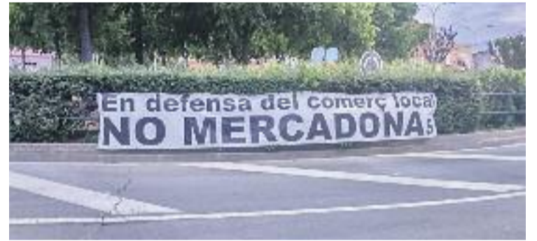
Els botiguers s'han mobilitzat contra Mercadona.

Els membres de la fundació protestaven per la decisió de l'equip de govern de no portar al Ple la qüestió del nou edifici de la fundació, que comportaria l'arribada de dos nous supermercats Mercadona, una possibilitat que ha fet aixecar la veu a veïns i comerciants.