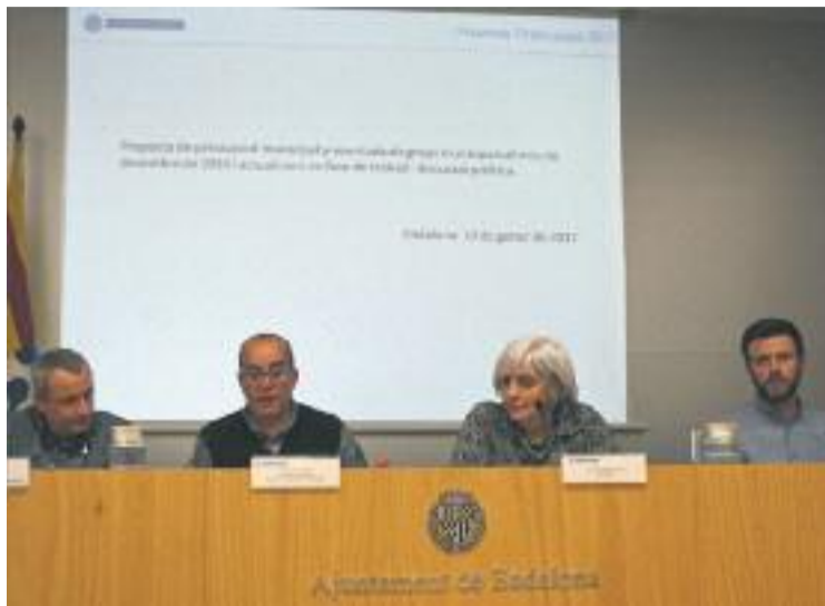
El govern va presentar la proposta dimarts.