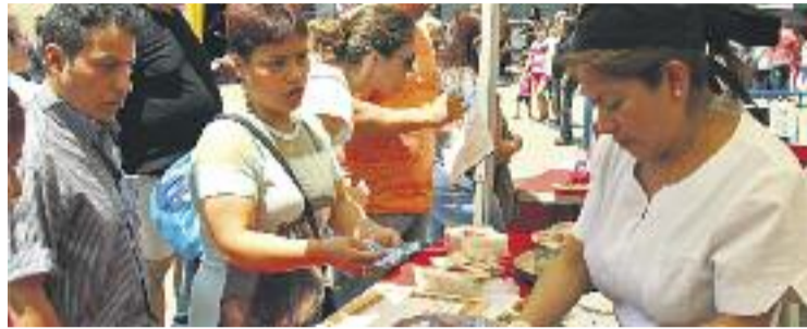
Sabors del Món és l'activitat estrella de Fondo Comerç.

I què passarà, aleshores, amb les activitats que organitzava