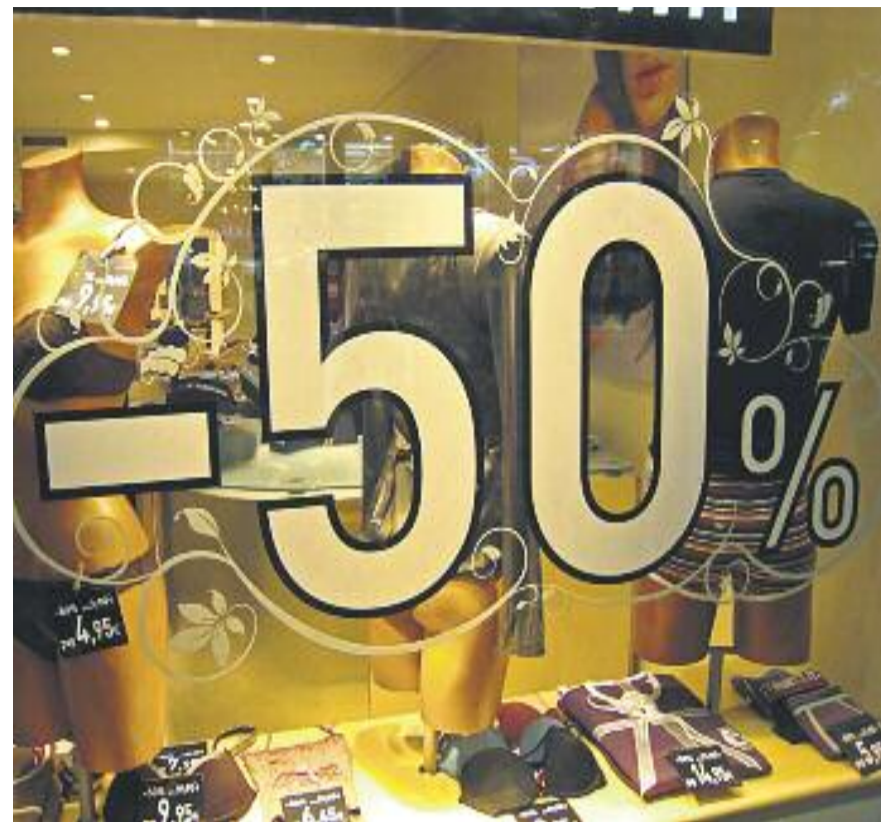
Els comerciants estan fent descomptes entorn del 50%.