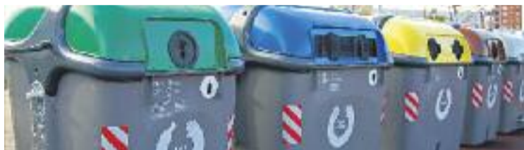
L'Ajuntament va denunciar un presumpte frau de 12,8 milions.

Un presumpte frau que el govern municipal va denunciar el 21 de novembre, després de rebre les conclusions d'una auditoria externa. Ara, la fiscal Teresa Duerdo ha demanat a l'Ajuntament que entregui el contracte, el seu plec de condicions, l'oferta presentada per FCC que va permetre adjudicar el servei a l'empresa i l'informe extern encarregat per l'executiu de Sabater. També demana al consistori que identifiqui el cap del departament de neteja urbana des que el contracte va en-