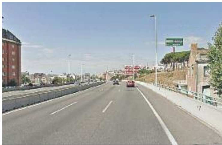
El govern municipal i la Generalitat es van reunir ahir.