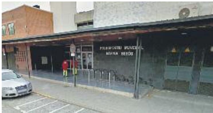
El pavelló va tancar les seves portes al novembre.