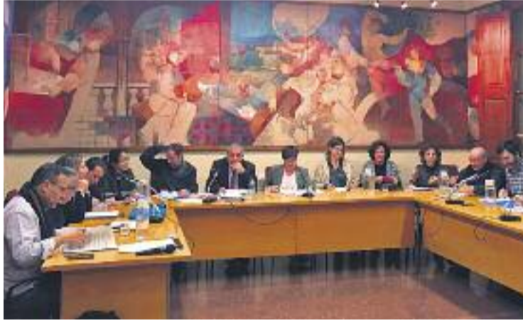
Imatge del Ple del 3 de gener.

En aquest sentit, l'Ajuntament aplicarà una tarifació social a l'Impost de Béns Immobles (IBI). "Estem convençuts que si des de l'oposició no haguéssim pressionat per fer l'IBI més social en aquest exercici, avui no estaríem aprovant aquestes bases",