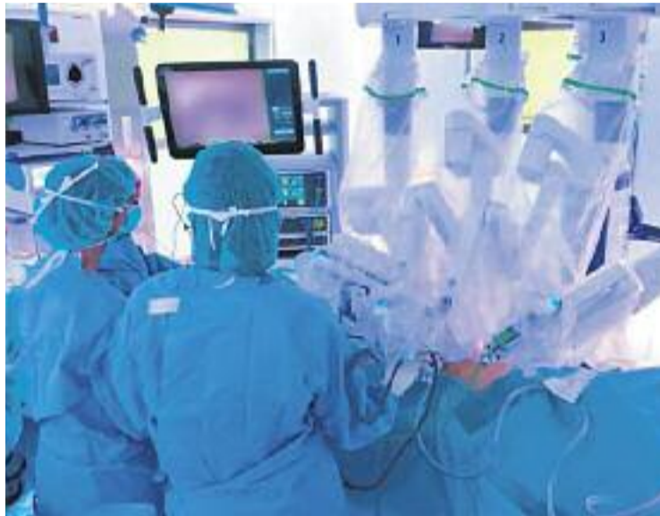
Amat és una excel·lència en el camp de la robòtica.

Entre els premis més destacats que ha rebut al llarg de la