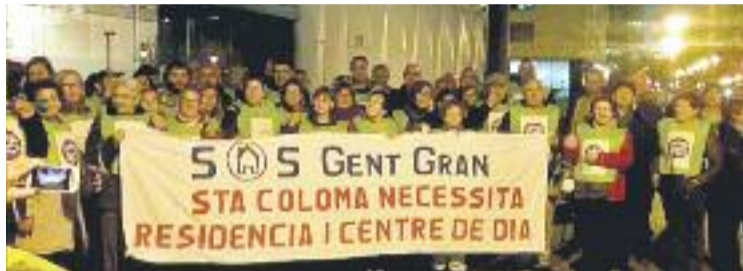
SOS Gent Gran es va manifestar dimarts a les portes del departament.

El centenar de veïns que van participar en la mobilització, doncs, van tornar a Santa Coloma amb un compromís de mínims del Govern, que satisfà parcialment les exigències que el Ple municipal havia posat unànimement sobre la taula de l'executiu de Carles Puigdemont el 28 de novembre.