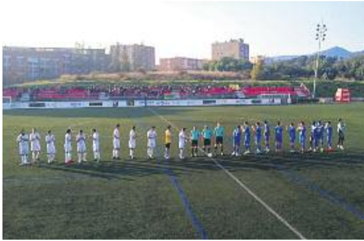
Els escapulats segueixen vius a la competició del KO.

Els pobletans van prémer l'accelerador a l'inici del segon temps i van aconseguir capgirar l'elimina-