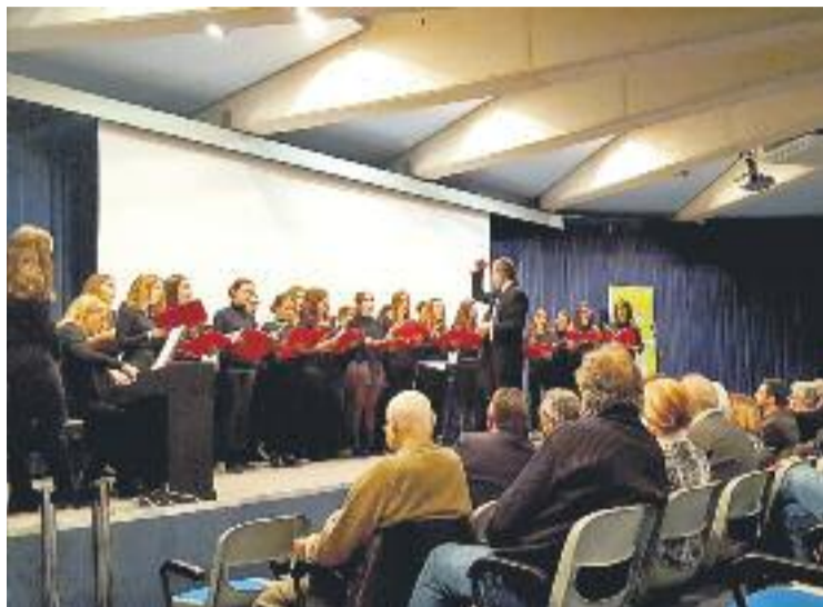
Actuació del Cor Jove del Conservatori a l'acte institucional.

L'acte va servir perquè les àrees de treball de l'associació presentessin la seva tasca al públic assistent. Així doncs, el grup d'assessorament, el jurídic, el d'habitatge i el de lleure van fer cinc cèntims de la feina desenvolupada per donar suport als joves amb discapacitat intel·lectual i les seves famílies.