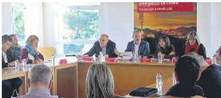
Imatge de la reunió celebrada el 2 de desembre.

Mentre això no s'apliqui, l'AMB demana a la Generalitat la signatura de convenis amb les empreses subministradores i proposa crear uns protocols municipals d'actuació unificats i estandarditzats.