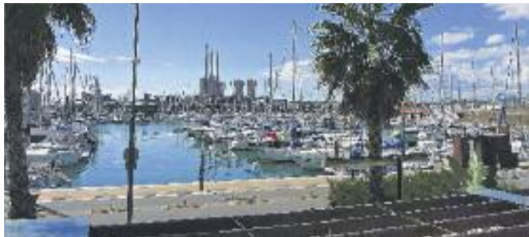
L'adjudicació de les obres es faria al febrer.

El 22 de desembre la mesa de contractació del projecte avaluarà l'oferta i en el cas que la valoració sigui positiva, l'hotel tirarà endavant. L'adjudicació del terreny del port és una concessió de 99 anys i no preveu que el promotor que assumeixi la construc-