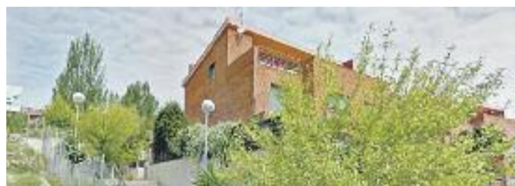
El barri de Les Costes, un dels més afectats pels robatoris.

L'impuls a les dues noves associacions de veïns arriba després que durant l'última setmana de novembre es denunciessin sis robatoris en les dues urbanitzacions, un dels quals, segons diuen els veïns, amb intimidació. "Els lladres entren per la part de dalt de les cases per buscar diners i joies",