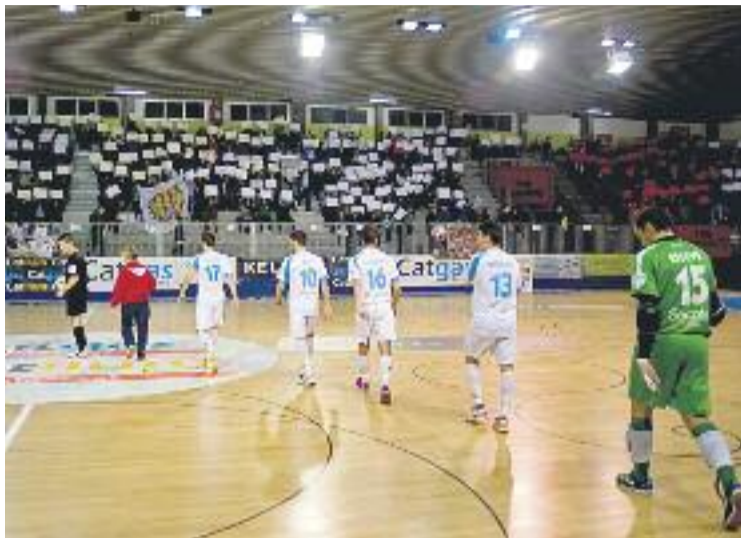
L'equip no va poder superar l'eliminàtoria abans-d'ahir.

El Catgas va tornar a la pista més endollat i novament Salgado va donar opcions a l'equip quan s'havia jugat poc més d'un minut de la represa. Però en aquesta ocasió, la reacció del Pozo va ser im-