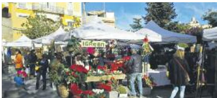
Tiana ja ha celebrat amb èxit la seva Fira de Nadal.

A Santa Coloma els comerciants també sortiran al carrer a celebrar Nadal. Fondo Comerç organitza la seva Fira de Nadal, fins al 23 de desembre –Fira de l'Arbre– i del 24 de desembre al 6 de gener –Fira de Reis–. Es fa