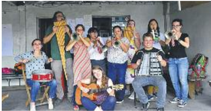
Imatge d'arxiu de l'Associació Nexes.

L'objectiu de la jornada és informar l'alumnat de primer i segon de batxillerat de l'Institut Thalassa sobre les diferents opcions per fer estades a l'estranger, ja sigui per