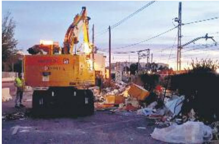
Dilluns van començar les tasques de neteja.

A banda de la demanda judicial, Sant Adrià també havia im-