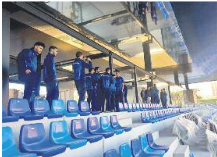
El primer equip va visitar el camp el 2 de desembre.

Ara bé, la preocupació al club és una altra, la firma del conveni d'ús amb l'Ajuntament. Després de rebre una primera proposta per part del govern municipal que la