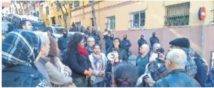
Desplegament policial al carrer Pau Claris.

A un quart d'onze la comitiva es va desplaçar a l'avinguda Pallaresa 60 i finalment estava previst acabar el recorregut al número 50 del carrer Pau Claris a dos quarts de dotze. Aquest va ser el punt més calent, ja que els Mossos d'Esquadra hi van acudir per garantir que la comitiva judicial pogués tirar endavant el desnonament. Finalment, la mediació entre els Mossos, els Serveis Socials