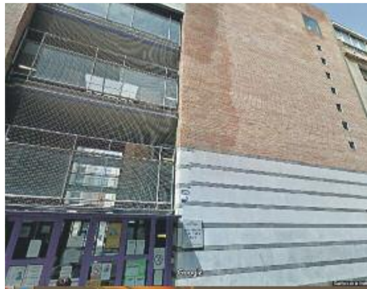
La segregació s'accentua en centres de màxima complexitat com l'Alexandre Galí a Badalona (esquerra) o la Wagner a Santa Coloma (dreta).