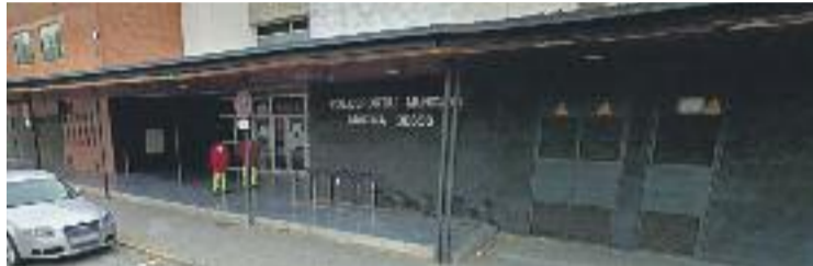
Gimesport presentarà una llista de greuges a l'Ajuntament.