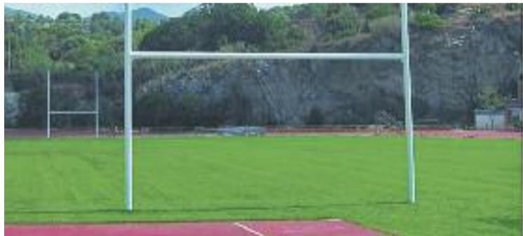
La pista esportiva de Bonavista és una de les opcions per invertir.

Per ara el consistori valora positivament la participació ciu-