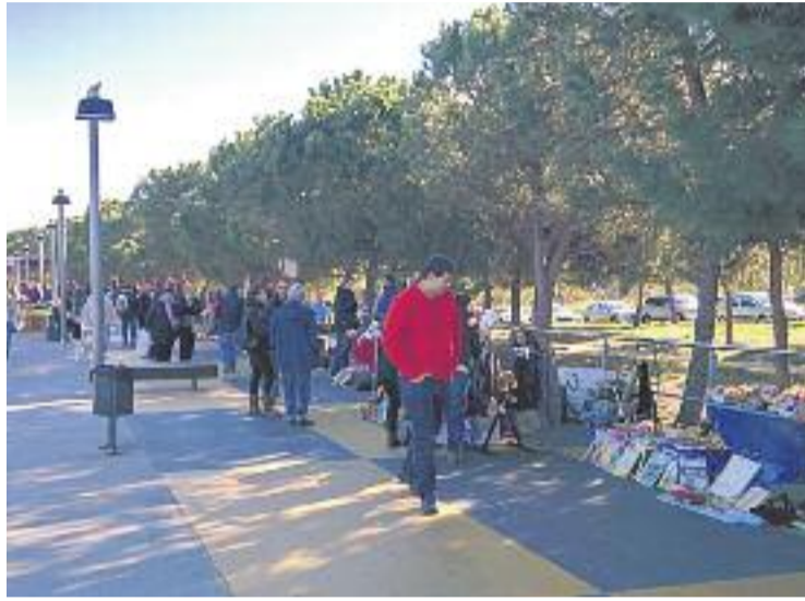
Imatge del mercat de l'any passat.

En el marc d'aquest programa europeu s'han organitzat diversos actes arreu del continent del 19 al 27 de novembre. En el cas de Montgat, l'Ajuntament ha programat visites als comerciants per fomentar la prevenció de residus i dissabte a la tarda els infants i joves de l'Esplai el Timó del Gat podran gaudir del taller de prevenció de residus organitzat per a aquesta entitat. El plat fort arribarà diumenge, amb la celebració del mercat de segona mà que