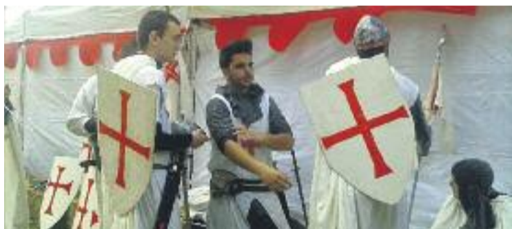
El passeig rememorarà el passat medieval. Foto: Passeig de La Salut

Tot i que el programa de la fira serà similar al de l'any passat, enguany hi haurà una no-