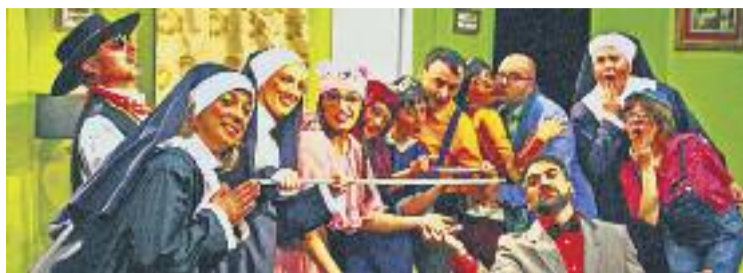
La Colmena programa Sardinas des de demà fins al 27.

En aquest sentit, els directors artístics de La Colmena ja han decidit que el muntatge de La casa de Bernarda Alba que la companyia de l'entitat representarà al març es programarà durant tres caps de setmana seguits.