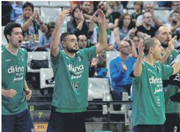
L'Ajuntament ha encarregat l'informe per determinar la quantitat a oferir.

Cap dels dos clubs vol dir encara quina quantitat esperen rebre de l'Ajuntament, però en el cas del Badalona, la seva junta directiva té molt clara la xifra que el consistori hauria d'oferir. El club es basa en les quantitats de diners que diversos clubs de Segona B reben a canvi de portar el nom dels seus municipis a la samarreta del primer equip i segons dades re-