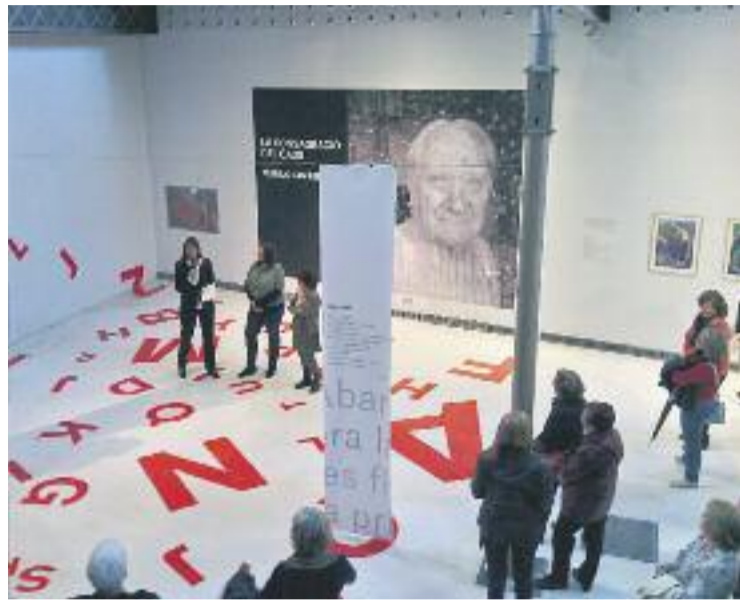
L'Espai Betúlia va inaugurar l'exposició el 12 de novembre.

De fet, l'Espai Betúlia proposa una espècie de maridatge en-