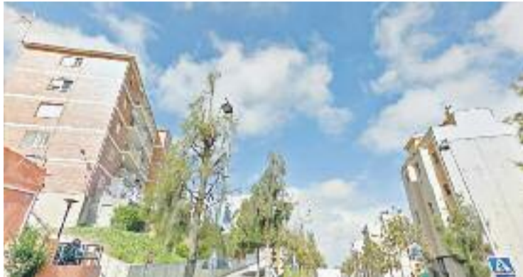
El Ple municipal va aprovar la moratòria per unanimitat.

Tal com va avançar Línia Nord , el govern municipal va manifestar la seva intenció de regularitzar tots els allotjaments turístics del municipi el novembre del 2015.