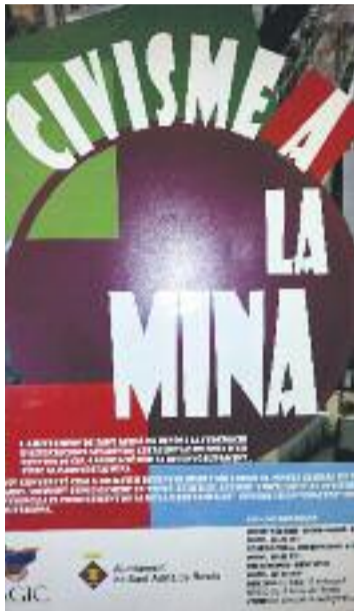
El cartell que l'anuncia.

gura desconèixer el mecanisme administratiu pel qual el conveni ha pogut tirar endavant. "Les coses s'han fet el millor possible", diu.