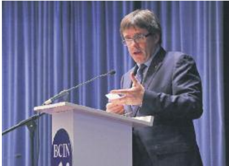
Puigdemont, durant l'acte de celebració.