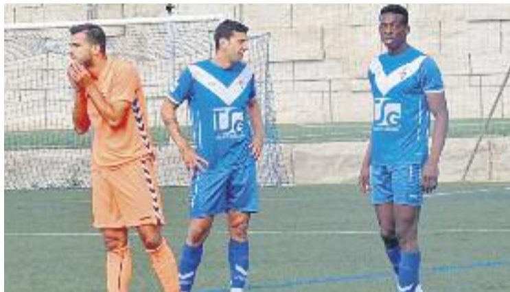
Tusgsal és l'actual patrocinador del Badalona.

Pròximament, el consistori encarregarà un informe extern per determinar quina seria la millor estratègia de patrocini, calcular el retorn econòmic que la inversió publicitària podria tenir per a la ciutat i, d'acord amb això, xifrar la quantitat que es podria pagar a la Penya i al Badalona. "Aquesta esponsorització ens permetria situar el nom de la ciutat fora del terme municipal", defensa Lladó.