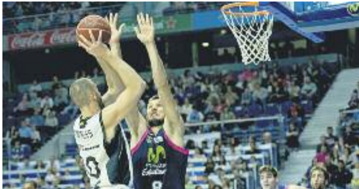
Un moment del matx de l'any passat, que va guanyar la Peña.