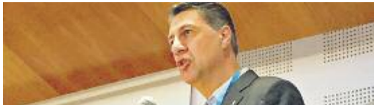
Guanyem considera que Albiol podria haver comès un delictes d'odi.

Guanyem considera aquesta piulada un atac "enormement greu" i creu que Albiol hauria comès un delictes d'incitació a l'odi. En primer lloc, la formació vol aclarir si aquest suposat linxament es va produir. "Responsables