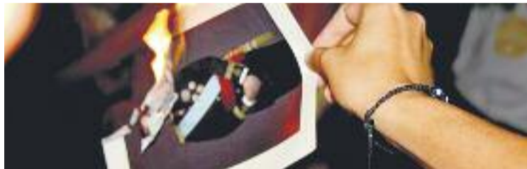
Desenes de persones van cremar fotos del rei l'11 de setembre.

En declaracions a Línia Nord , Blanc s'ha mostrat "perplex" per la