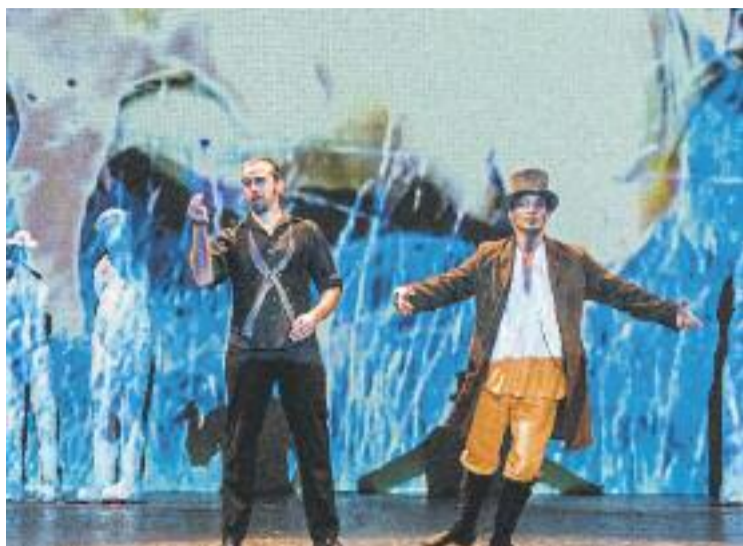
La fura aterrarà demà a les nou del vespre al Sagarra.

Ara, 74 anys després, la Fura s'atreveix a reinterpretar un clàssic marcat pel to burlesc, la celebració dels palers més mundans i la crítica social. La direcció va a càrrec de David Cid i Miki Espuma, que també s'ha