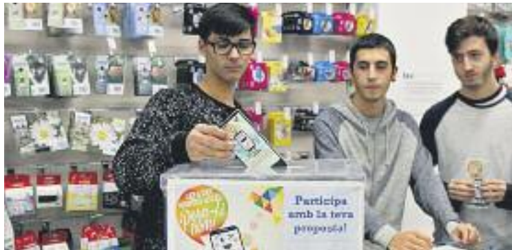
Ja s'han instal·lat urnes a diferents punts de la ciutat.

La campanya acabarà el 25 de novembre i entre totes les propostes rebudes, l'Ajuntament escollirà una persona guanyadora. Aquesta rebrà un xec equivalent a 500 euros en moneda local, per gastar als comerços de la ciutat que s'han adherit fins ara a la iniciativa. Un cop triat el nom, el projecte es posarà en marxa al llarg del