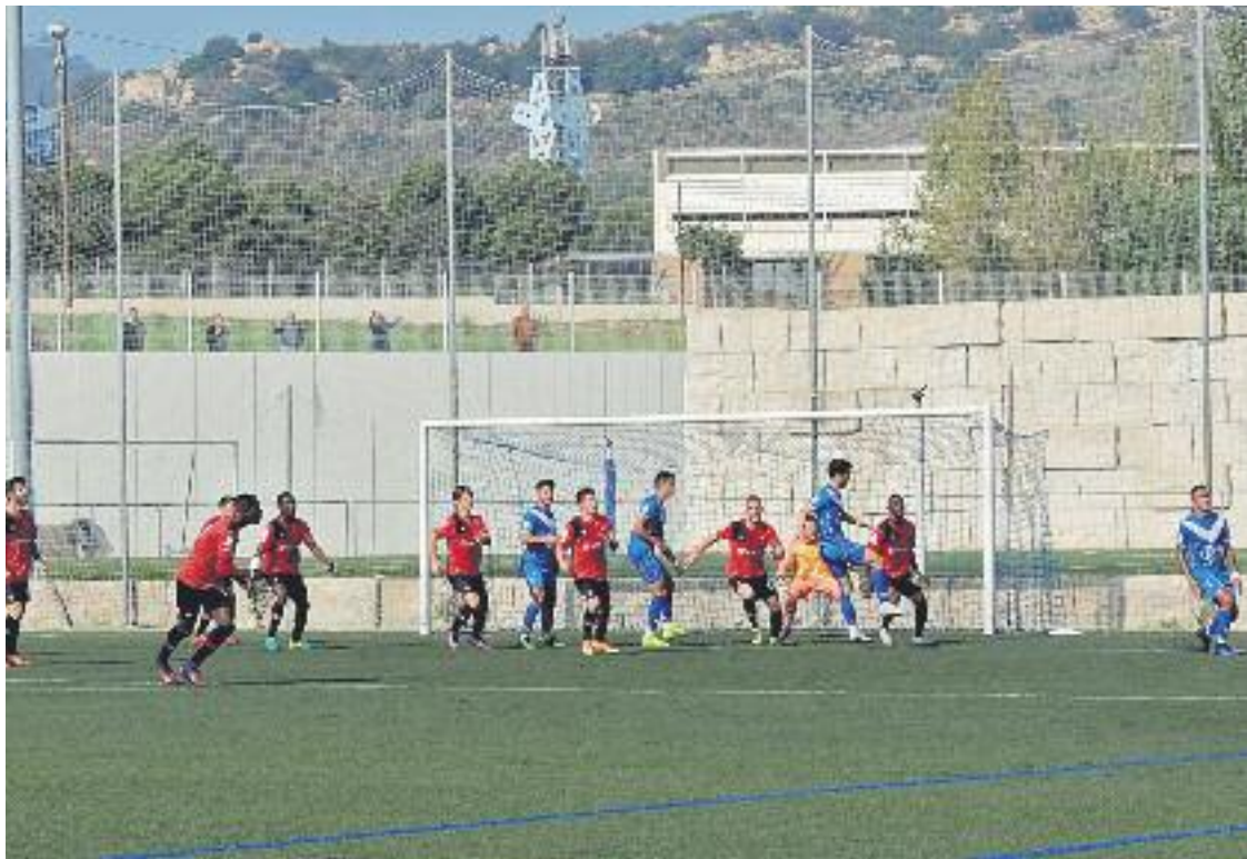
L'equip va tornar a empatar a zero contra el Mallorca B.

» Dimecres que ve el club jugarà la semifinal de la Copa Catalunya » La UD Poblense serà el primer rival de la Copa Federació