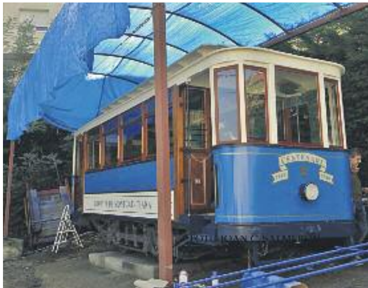
S'estan ultimant els treballs de restauració del tramvia.

Des del 2011 es donava per fet que durant la Festa Major d'enguany el tramvia quedaria exposat al costat de l'avinguda Isaac Albéniz, a dalt del doble re-