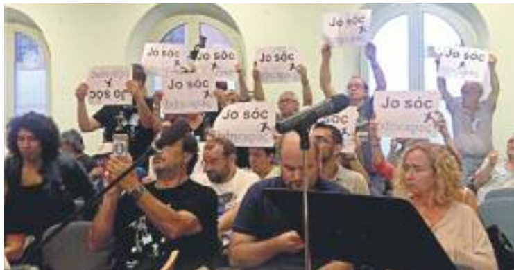
Protesta de BDN Capaç durant el Ple de setembre.

Un pas que des de BDN Capaç consideren urgent, ja que a finals d'any caducarà el preacord amb Mercadona per construir el nou centre de la fundació al barri de Morera. Des del govern municipal responen que entenen la preocupació i que treballen per "desbloquejar la situació al més aviat possible", tal com explica a Línia Nord el ti-