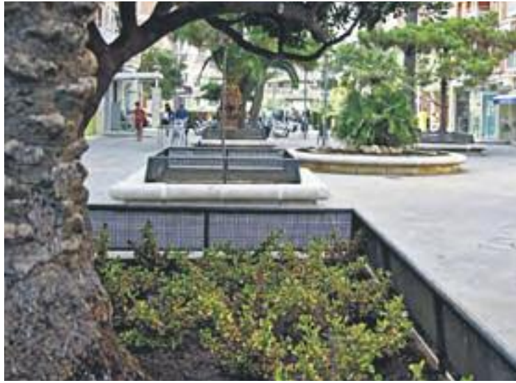
Aspecte de la rambla amb els nous espais verds.

Pel que fa a les jardineres, s'hi han mantingut els pins i les palmeres, mentre que a la rotonda central el margalló ocuparà un lloc preeminent, tot i que acompanyat d'una planta vi-