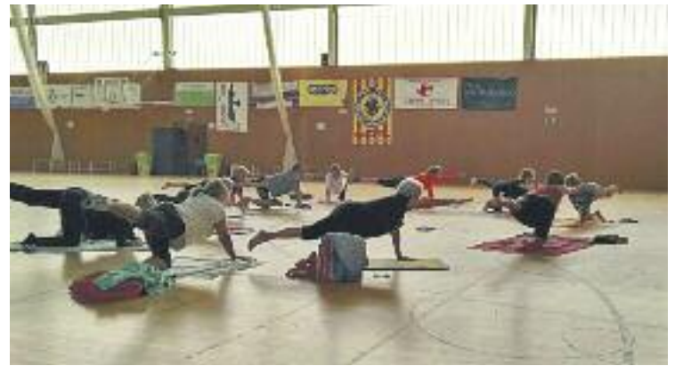
Primera activitat de ioga del Repte Saludable.

Per participar en el projecte cal descarregar-se una aplicació de tracking esportiva per registrar l'activitat diària i registrar-se a la plataforma esportianitzat.cat i vincular el perfil creat al de l'aplicació descarregada.