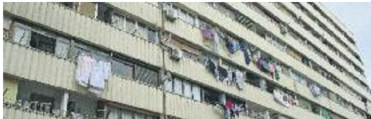
El bloc Venus fa una setmana que és a les fosques.

defensa que el tall no havia de ser notificat. "L'estat de la instal·lació elèctrica i de les sales de comptadors posava en risc la seguretat de les persones", argumenten fonts de la companyia. Una degradació que ve de lluny i és responsabilitat de l'empresa municipal Pla Besòs SA.