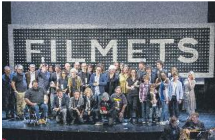
Una imatge de la Nit de les Venus al Zorrilla.

De totes maneres, Argelich posa de manifest la "bona acollida" que han tingut les ses-