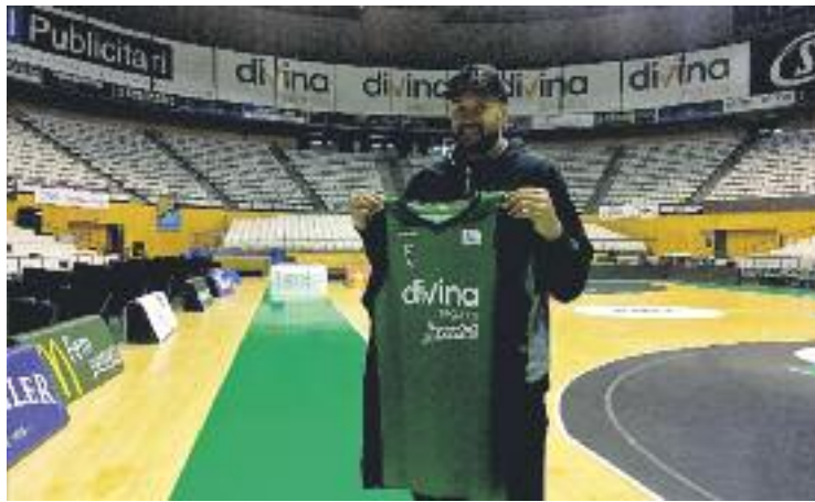
La primera imatge del pivot amb la seva nova samarreta.

S'ha acabat la mala ratxa. Després de cinc derrotes seguides, l'equip va sumar la primera victòria del curs diumenge passat al derbi contra el Manresa (81-85). El