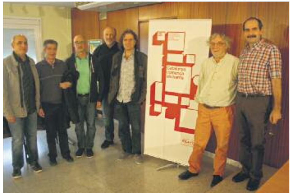
Els representants veïnals han atès Línia Nord (esquerra) per explicar els objectius de la taula metropolitana impulsada pel consell federal de la Confavc (dreta).