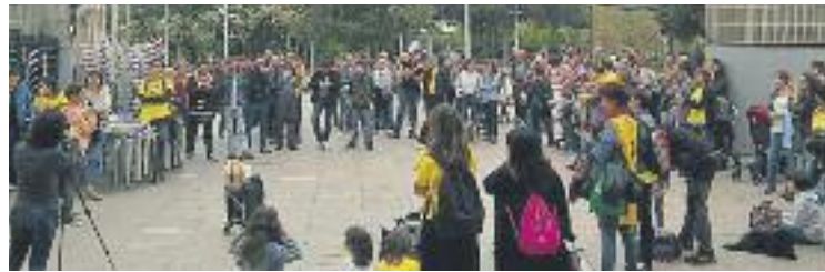
Imatge de la concentració prèvia al Ple.

Pel que fa a impostos i taxes, la majoria es congelen, tot i que els preus per la utilització dels serveis del Patronat Municipal de la Música, que augmentaran un 2%.