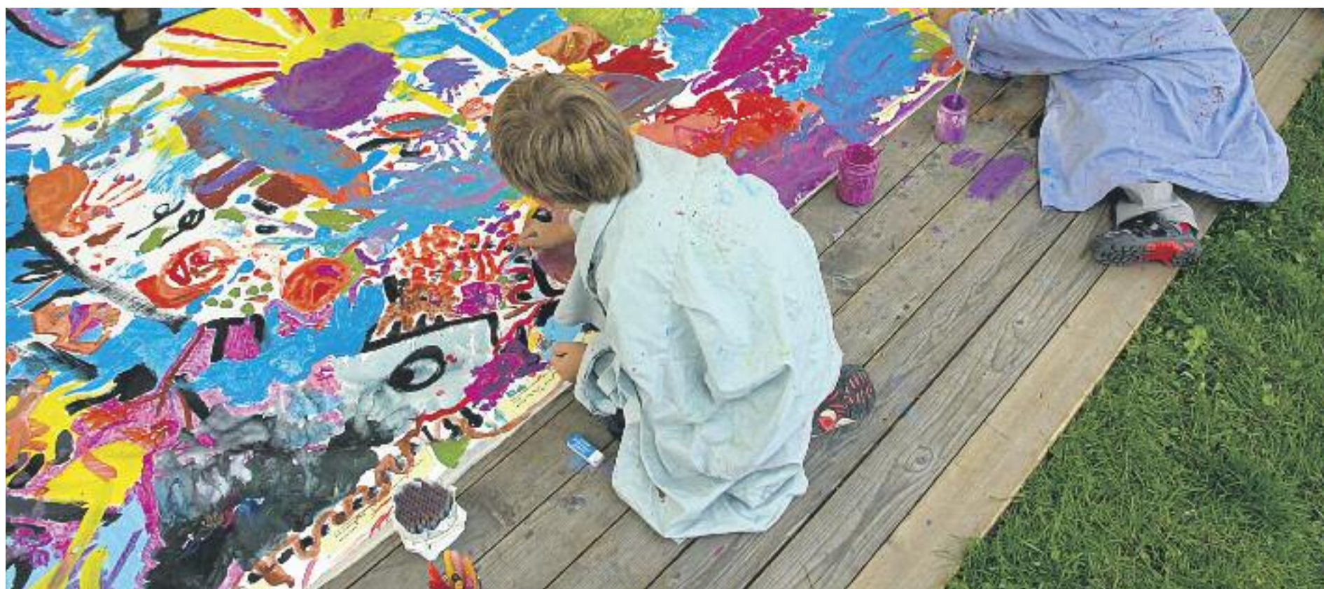
El programa Escola Nova 21 impulsa l'aprenentatge per projectes, valors i habilitats.