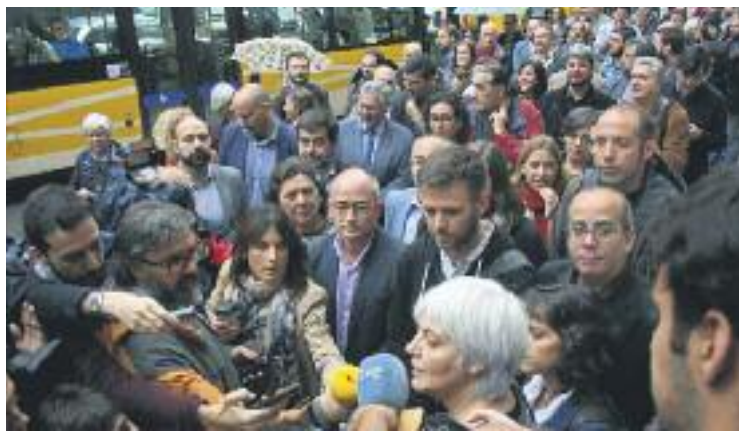
Una àmplia comitiva va acompanyar els regidors dimarts a declarar.

L'assumpció d'un acte de desobediència significaria una autoinculpació per part dels regidors. Al mateix temps, negar la desobediència els podria servir per de-