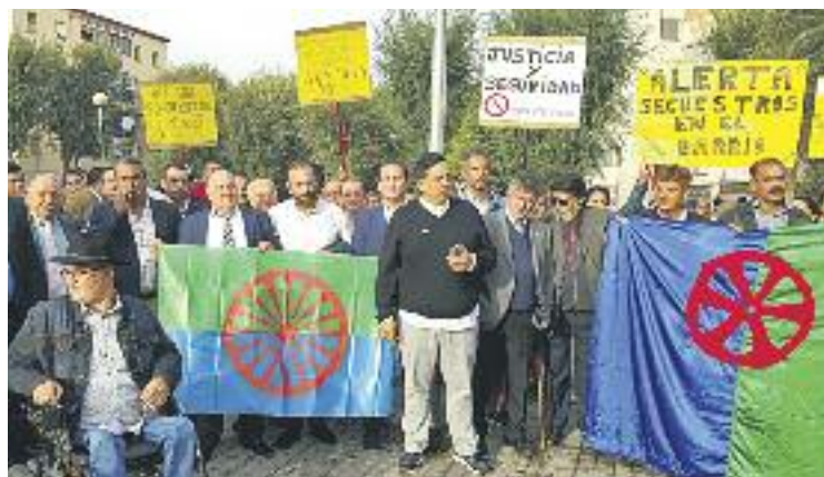
La manifestació de dimarts reclamava més seguretat.