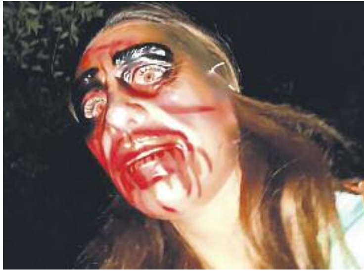
El parc del Turonet acollirà el Túnel del Terror.

D'altra banda, a Rambla Turó del Mar serà l'epicentre dels de-