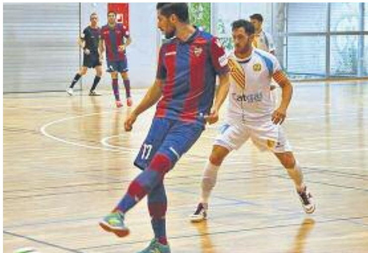
Els equips ja es van veure les cares durant la pretemporada.

L'últim partit de lliga va ser un empat contra el Peñíscola (4-4). El partit va ser frenètic des del xiulet inicial i Prieto va fer una gran aturada abans que Corvo, al minut 3, avancés els d'Óscar Redondo aprofitant un refús d'Iker. L'alegria va durar poc, ja que els castellonencs van remuntar en dos mi-