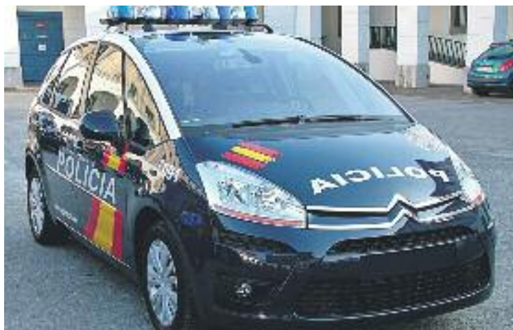
En total, la policia ha detingut 9 persones des del 2012.

Tot i la contundència de les dades, Badalona no ha viscut cap detenció d'aquestes característiques des del 3 d'octubre del 2015, quan la policia espanyola va detenir a la Salut un jove de 20 anys que, segons el Ministeri d'Interior,