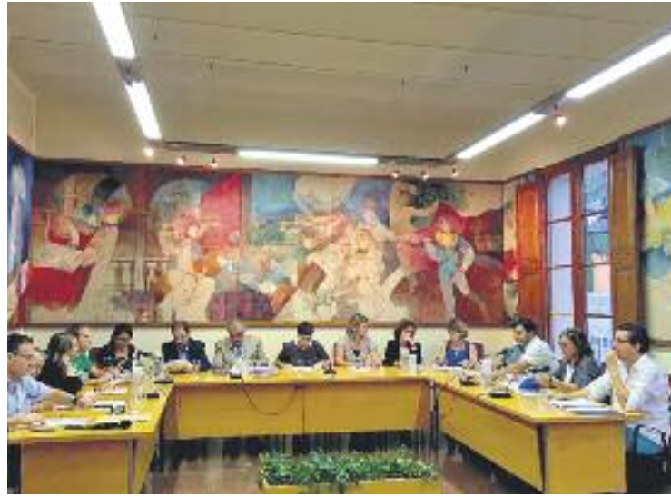
Els integrants del Ple, en una imatge d'arxiu.

A banda de l'IBI, el Ple va tirar endavant una modificació de l'ordenança de plusvàlua, que grava les transmissions de béns patrimonials. Concretament, es va aprovar un canvi en la subvenció de l'impost de plusvàlua en els casos que la transmissió es