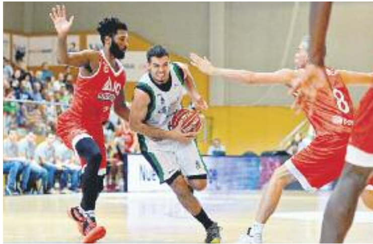
Els verd-i-negres volen començar a reaccionar a Manresa.