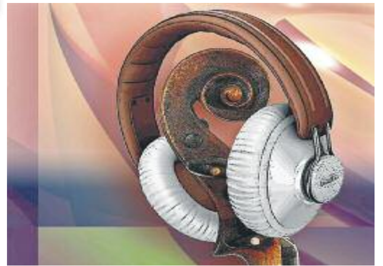
Es vol apropar al gran públic la música clàssica en formats innovadors.

El cicle Concerts Pedagògics es duu a terme a diversos municipis catalans a càrrec de les respectives escoles de música i un dels seus principals objectius és apropar al gran públic la música clàssica en formats innovadors.