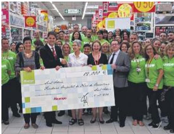
Lliurament del xec de l'Alcampo de Sant Adrià.

L'Alcampo de Sant Adrià ha donat 12.000 d'aquests euros a una iniciativa de la Fundació Hospital de Nens de Barcelona (FHNB) d'assistència psicoterapèutica a 115 infants i joves. Aquest projecte consisteix en un dispositiu de suport creat fa dos anys i basat en sessions de psicoteràpia individual i fami-