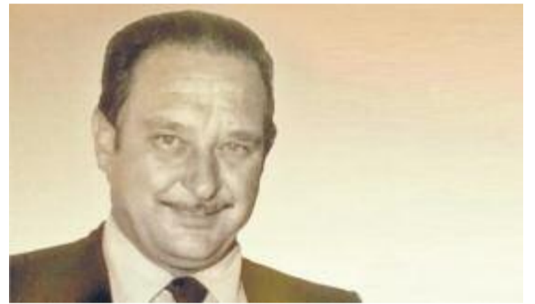
París, en una imatge d'arxiu.

Durant el seu mandat, Tiana va ser el primer Ajuntament que es va fer seva la consigna de l'Assemblea de Catalunya "Llibertat, amnistia i estatut d'autonomia", tot i que el consistori va haver de fer marxa enrere.