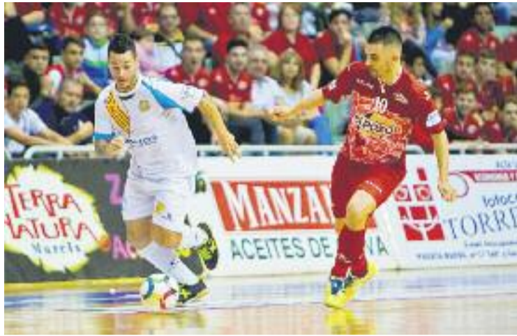
L'equip va derrotar El Pozo a Múrcia.