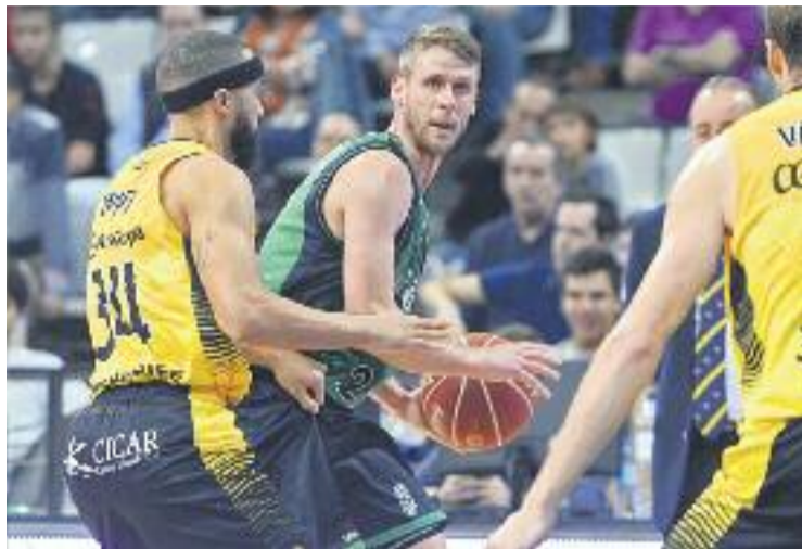
L'últim quart va condemnar el Joventut contra el Tenerife.

La història més recent, però, està del bàndol de la Peña, que vol aconseguir la quarta victòria contra els vitorians en les darreres cinc temporades. Recentment, només el curs passat el Baskonia