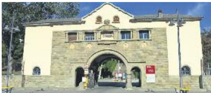
Torribera és la ubicació escollida per l'Ajuntament de Santa Coloma.

L'anunci arriba després que el Servei Català de la Salut proposés a l'Ajuntament obrir un centre de detecció, diagnòstic, tractament i derivació de persones amb problemes relacionats amb l'ús, abús