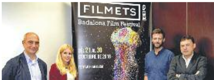
Acte de presentació del Festival Filmets.

Fins al dia 30, el Zorrilla, el Teatre Blas Infante, el Centre Cultural el Carme, el Museu, les Biblioteques de la ciutat i l'Institut Francès de Barcelona seran l'escenari de les activitats programades pel festival, entre les quals destaca el concurs internacional de curtmetratges. Enguany hi participaran 232 curtmetratges de 36 països, que seran projectats en 26 sessions. Per anar fent boca, Marcianos de Marte , de Fernando Trullols, guanyador d'un premi Goya, serà la pel·lícula que obrirà