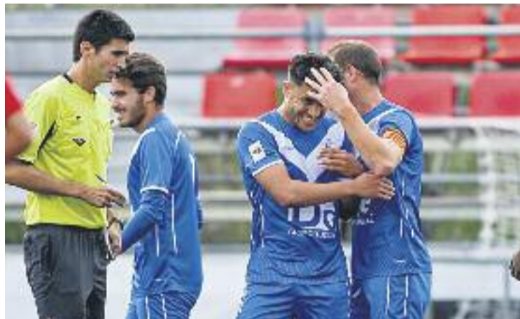
Els escapulats van certificar la classificació a casa.

El matx es va decantar a favor dels escapulats ben aviat, quan Moha va inventar-se un golàs de falta des de la frontal de l'àrea. Perales no va poder aturar el xut del '9' del Badalona. Gairebé sense temps perquè els de Martín Posse poguessin reaccionar, l'equip va sentenciar amb el segon cinc minuts després. Iván Agudo va desfer-se de tots els defenses que intentaven robar-li la pilota però la seva rematada va picar contra el pal. Afortunadament per al Bada, Víctor García acompanyava la ju-