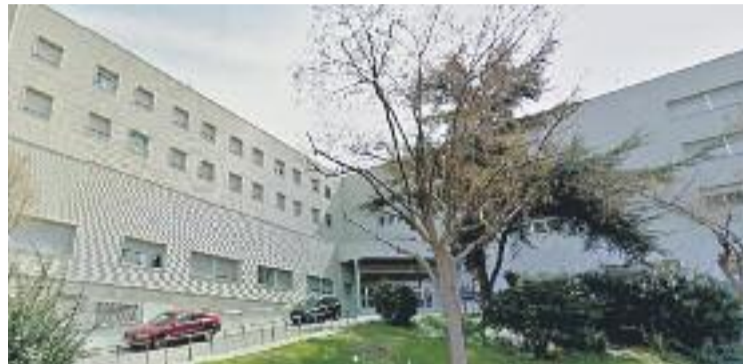
La residència Ramon Berenguer ofereix 143 places actualment.

De fet, Santa Coloma no té cap centre de dia públic i la residència Ramon Berenguer té capacitat