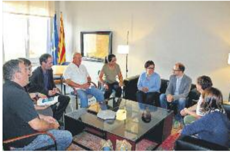
El consell avaluador d'Unicef va visitar Tiana el 27 de setembre.