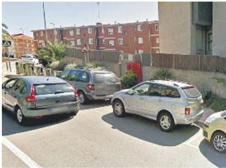
La policia local impulsa una campanya de seguretat viària.

D'altra banda, la campanya també vol conscienciar els conductors sobre la necessitat de garantir la seguretat dels infants, sobretot assegurant-se l'homologació de sistemes de retenció com les cadiretes. En aquest sentit, recorden que el parc mòbil català és cada vegada més vell i, entre altres aspectes, el percentatge de vehicles que es troba al dia de l'ITV disminueix any rere any.