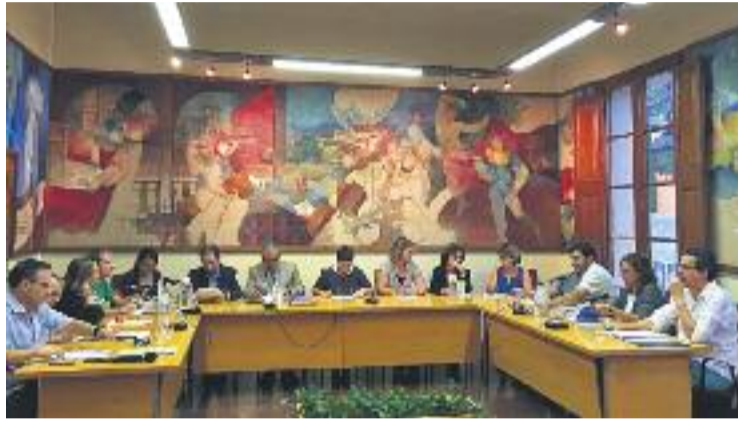
El Ple d'octubre es va celebrar dimarts.