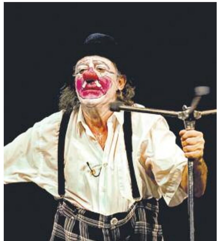
Santa Coloma ja ha protagonitzat accions a favor de l'acollida de refugiats (esquerra) i dissabte acollirà la gala de Pallassos Sense Fronteres (dreta).