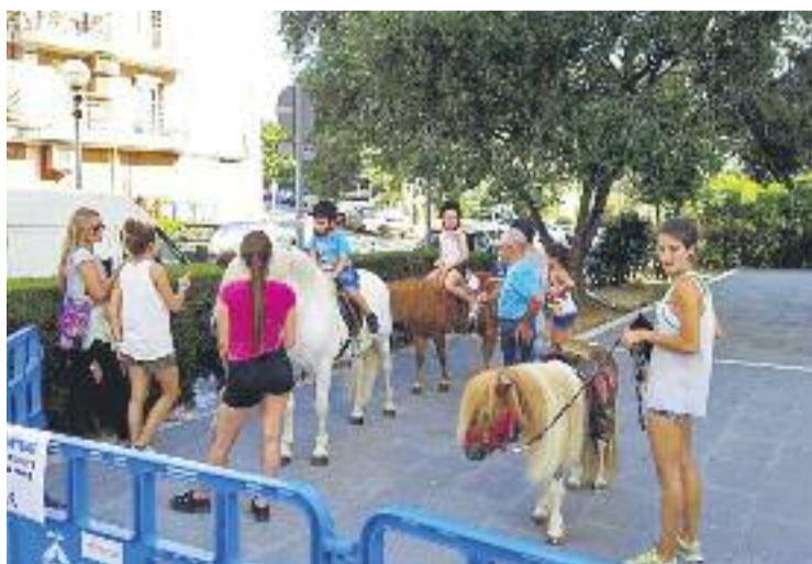
La passejada en poni, un dels principals reclams.

Però a banda d'això, en el marc de la fira també se celebrarà una mini ruta de tapes per vuit bars, restaurants i granges