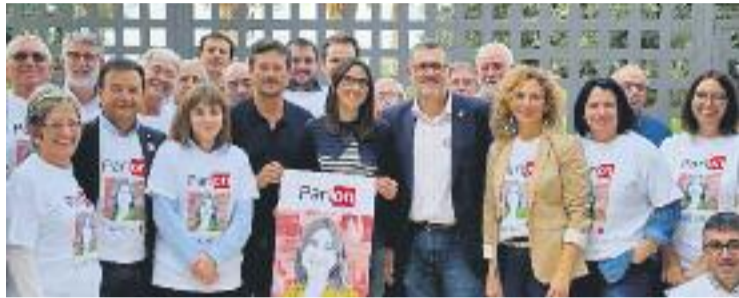
Parlon durant l'acte a Amposta.

En un temps mort entre actes, Parlon va atendre Línia Nord i va reiterar la necessitat de "rearmar ideològicament el PSC" per recuperar l'espai perdut entre les esquerres. L'alcalde colomenc defensa tenir un model clarament diferenciat al d'Iceta, igual que a l'hora d'aportar solucions a