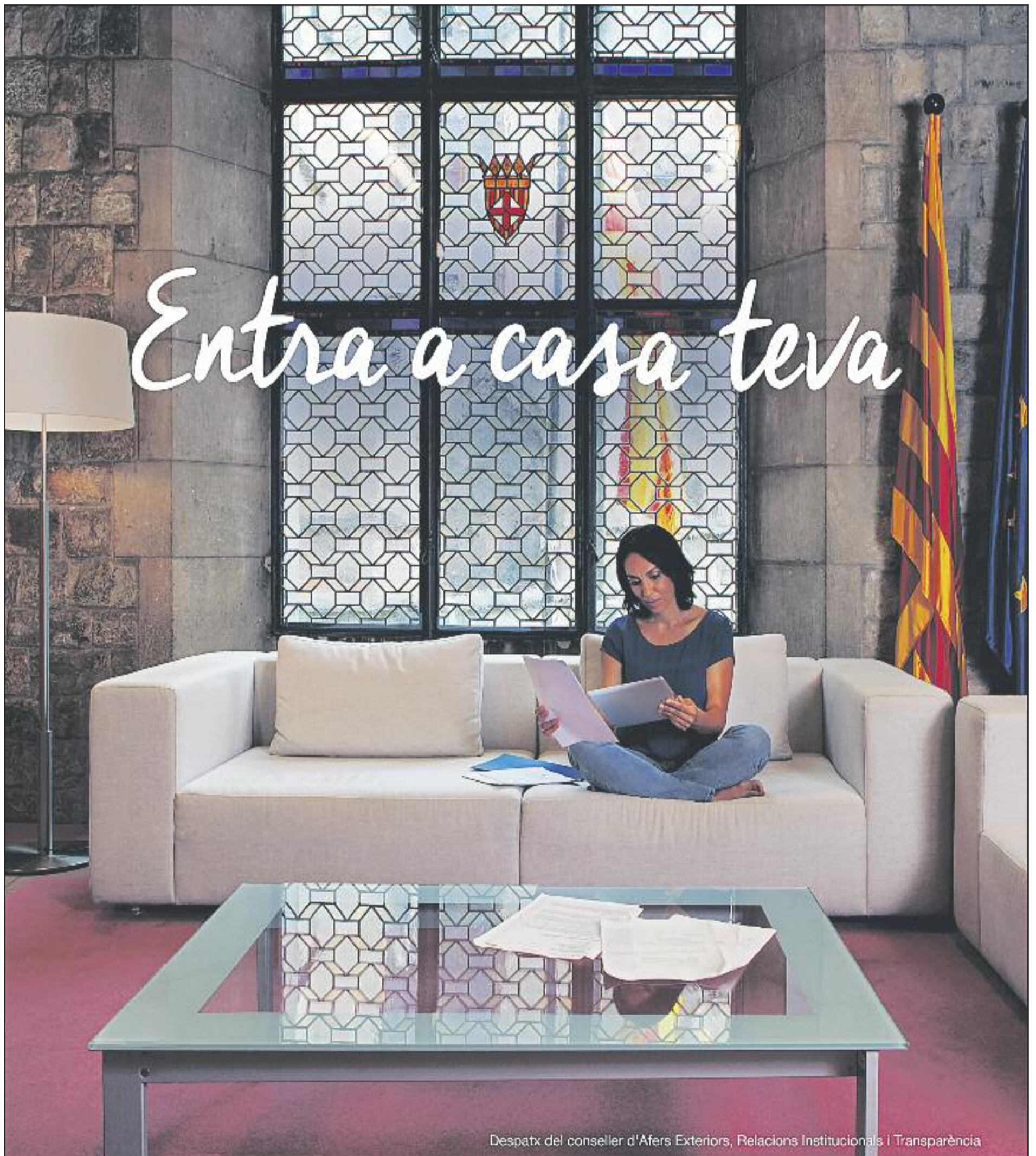
Despatx del conseller d'Afers Exteriors, Relacions Institucionals i Transparència

Al portal governobert trobaràs informació de Transparència, Dades Obertes i Participació.