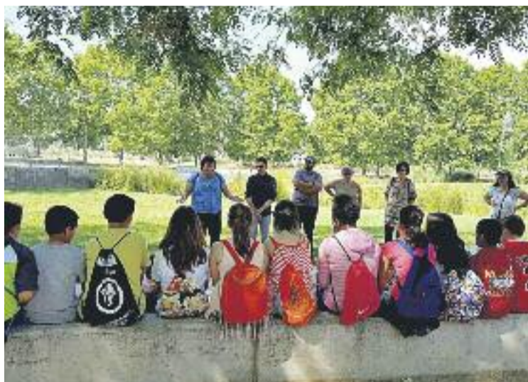
El consistori preveu impulsar l'Observatori de l'Escolarització el 2017.

I és que segons González, actualment la informació que l'Ajuntament rep per part d'Ensenyament és deficitària i assegura que el consistori té constància de moltes dades sobre alumnes i es-