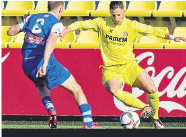
Els escapulats van perdre en la seva darrera visita als groguets.