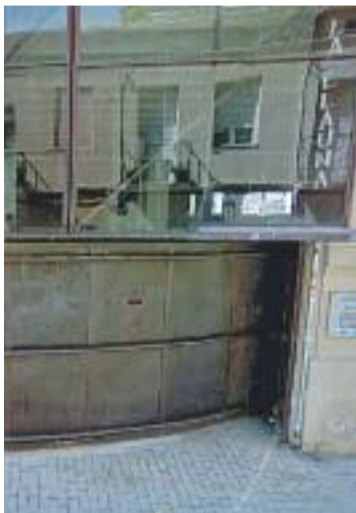
La Llauna, en el recorregut.

tat convidada. Els edificis que es podran visitar de forma gratuïta són el Fòrum romà, la fàbrica de l'Anís del Mono, l'Institut La Llauna, el Teatre Principal o el Pavelló Olímpic. En total seran 16 els edificis badalonins que estaran oberts al públic, que es podran visitar a través de quatre rutes diferents. Una que recorrerà el centre històric, una sobre el patrimoni industrial i dues més centrades en els Jocs Olímpics del 1992.