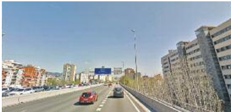
El govern municipal assegura que està enllestit el PMUS.

El PMUS parteix de la diagnosi de la mobilitat a la ciutat que ha fet l'Àrea Metropolitana de Barcelona (AMB) i que ha detectat una sèrie de deficiències. Entre altres, l'efecte barrera que exerceix l'autopista C-31, igual que les rondes i la