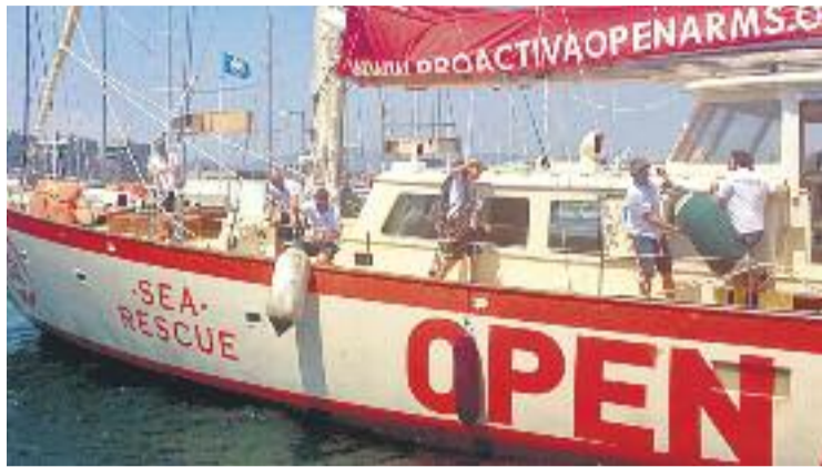
L'Astral va salpar de Badalona a finals de juny.

Évole i el seu equip es van embarcar a l'Astral quan l'embarcació va salpar a finals de juny des de Badalona. L'objectiu de Proactiva