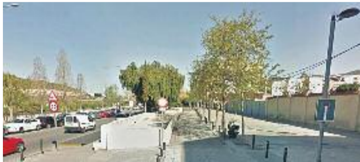
Part dels diners serviran per reurbanitzar el passeig Salzereda.

L'Ajuntament assegura que aquests diners permetran tirar endavant projectes que ja estan dissenyats i que s'han de desenvolupar fins al 2020. Entre altres, el govern municipal avança que els 15 milions serviran per reurbanitzar el passeig Salzereda i els carrers Jacint Verdaguer i Llorenç Serra -en el marc del projecte de Pinta Verda-, per la reordenació del trànsit de vehicles i vianants prevista al Pla de Mobilitat i per desenvolupar el centre de formació ocupacional a l'antic Hospital de l'Esperit Sant. "És una mostra del treball ben fet per l'Ajuntament amb la implicació imprescindible del teixit associatiu", ha considerat l'alcalde, Núria Parlon, a través d'un comunicat. "Darrere d'a-