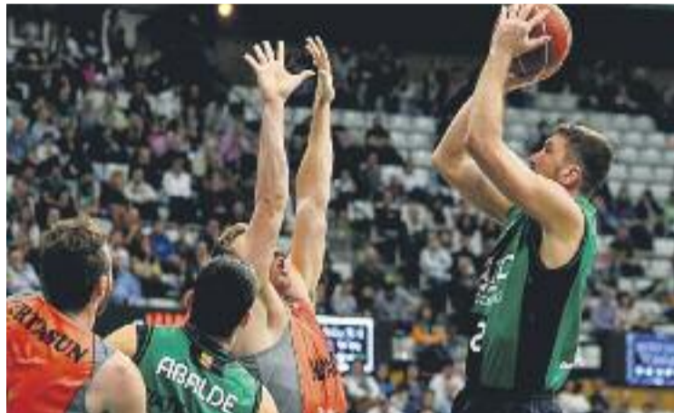
El Joventut va guanyar contra els madrilenys l'any passat.

Per la seva banda, els madrilenys es plantaran a la ciutat amb tots els seus homes dispo-