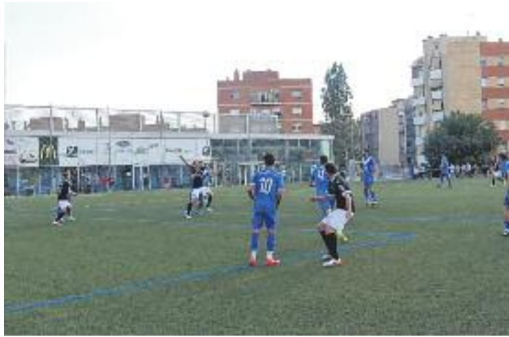
Els escapulats estan mostrant la seva versió més sòlida.