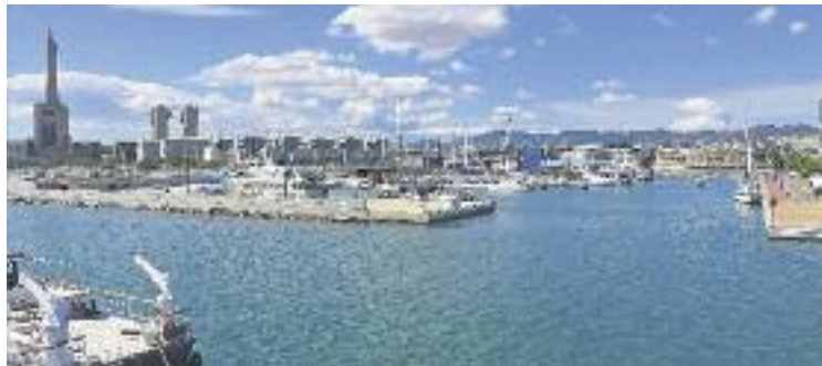
La parcel·la té un preu de sortida de 8,4 milions.

D'altra banda, el govern municipal assegura que tindrà en compte aspectes més enllà de l'oferta econòmica que posin sobre la taula les empreses aspirants. Segons explica Lladó, es valoraran aspectes com la sostenibilitat, la qualitat arquitectònica del projecte