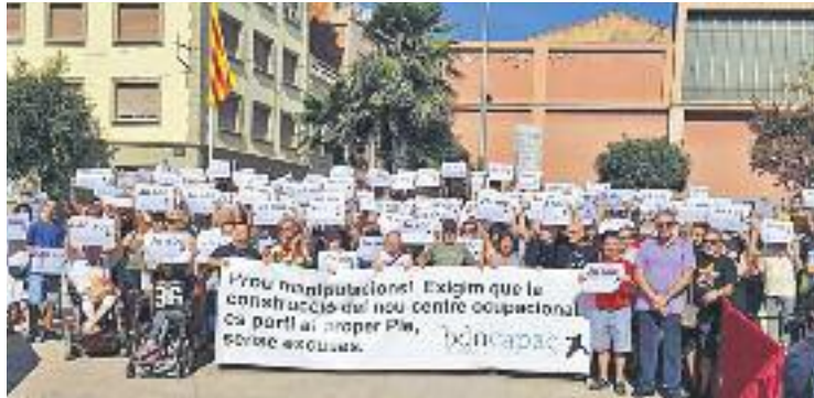
Des de la fundació exigeixen que el projecte es desencalli.

Les forces de l'oposició, majoria al Ple, votaran a favor d'aquesta demanda que vol tirar endavant una actuació que el govern municipal va frenar en sec al juliol, després de les reticències que va aixecar entre veïns, comerciants, ecologistes i alguns sectors del mateix consistori. Aleshores, el govern es va imposar el 30 de setembre com a data límit per estudiar alternatives perquè la nova seu de la Fundació Badalona Capaç no anés lligada a l'arribada de dos Mercadona més a la ciutat, tal com contempla el projecte actual.