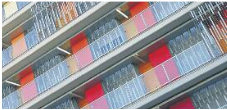
Es prioritzaran els immobles en mans de grans tenidors.

La nova ordenança es basa en la llei catalana d'Habitatge del 2007, que defineix com a habitatges buits aquells que estiguin desocupats sense causa justificada durant més de dos anys. Això sí, el govern municipal planteja diverses excepcions, com el desplaçament dels propietaris per motius laborals, canvis de domicili per raons de dependència o desavinences legals després de rebre una herència. Si els propietaris no poden justificar que l'immoble estigui buit per cap d'aquestes raons, se'ls farà pagar una taxa. Inicialment s'havia calculat que la