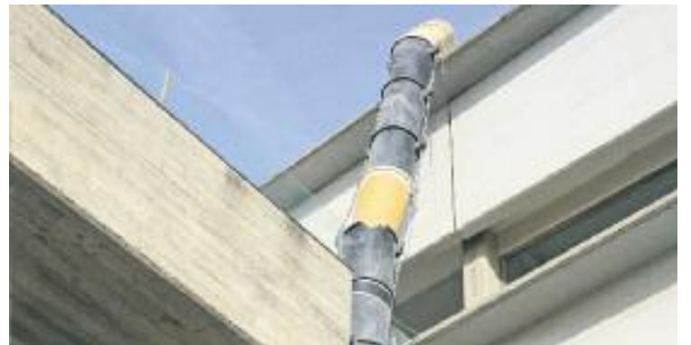
L'empresa Limber 1968 SL ha començat a aixecar els terres de l'edifici i a retirar-ne la runa.