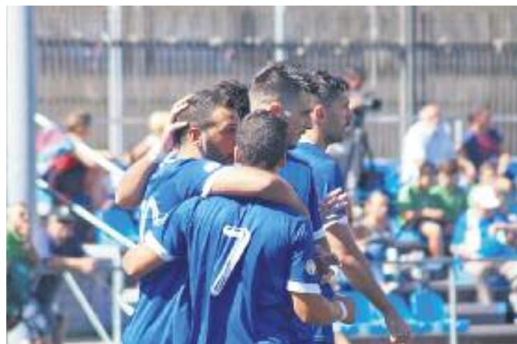
L'equip celebra el gol de Baby.

L'Hermes buscarà guanyar el seu primer partit demà passat a dos quarts de 7 de la tarda al municipal de Montgat, quan rebrà la visita del filial de la Unió Esportiva Llagostera.