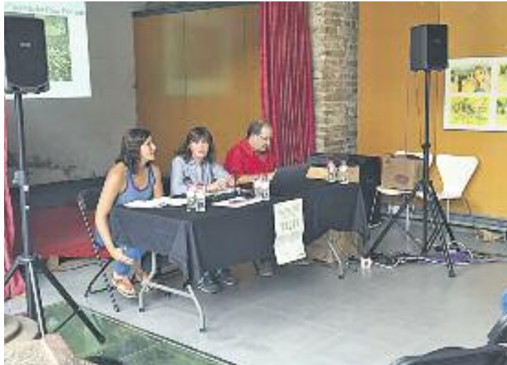
Representants de les festes de Santa Tecla i la Patum durant l'acte.

Una voluntat que s'ha consolidat després d'escoltar els