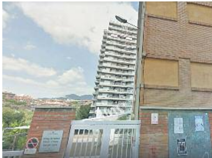
Imatge d'arxiu de l'escola Salvador Espriu.

L'objectiu d'aquests plans és determinar les accions que han de desenvolupar les escoles per analitzar l'estat del seu edifici, així com fer el manteniment necessari, identificar els riscos en matèria de seguretat, dimensionar recursos humans i econòmics i analitzar el manteniment i la prevenció que cal aplicar. Un dels punts importants d'aquest pla és la conservació dels edificis en condicions òptimes, d'acord amb les característiques amb les quals van ser dissenyats i construïts. També es