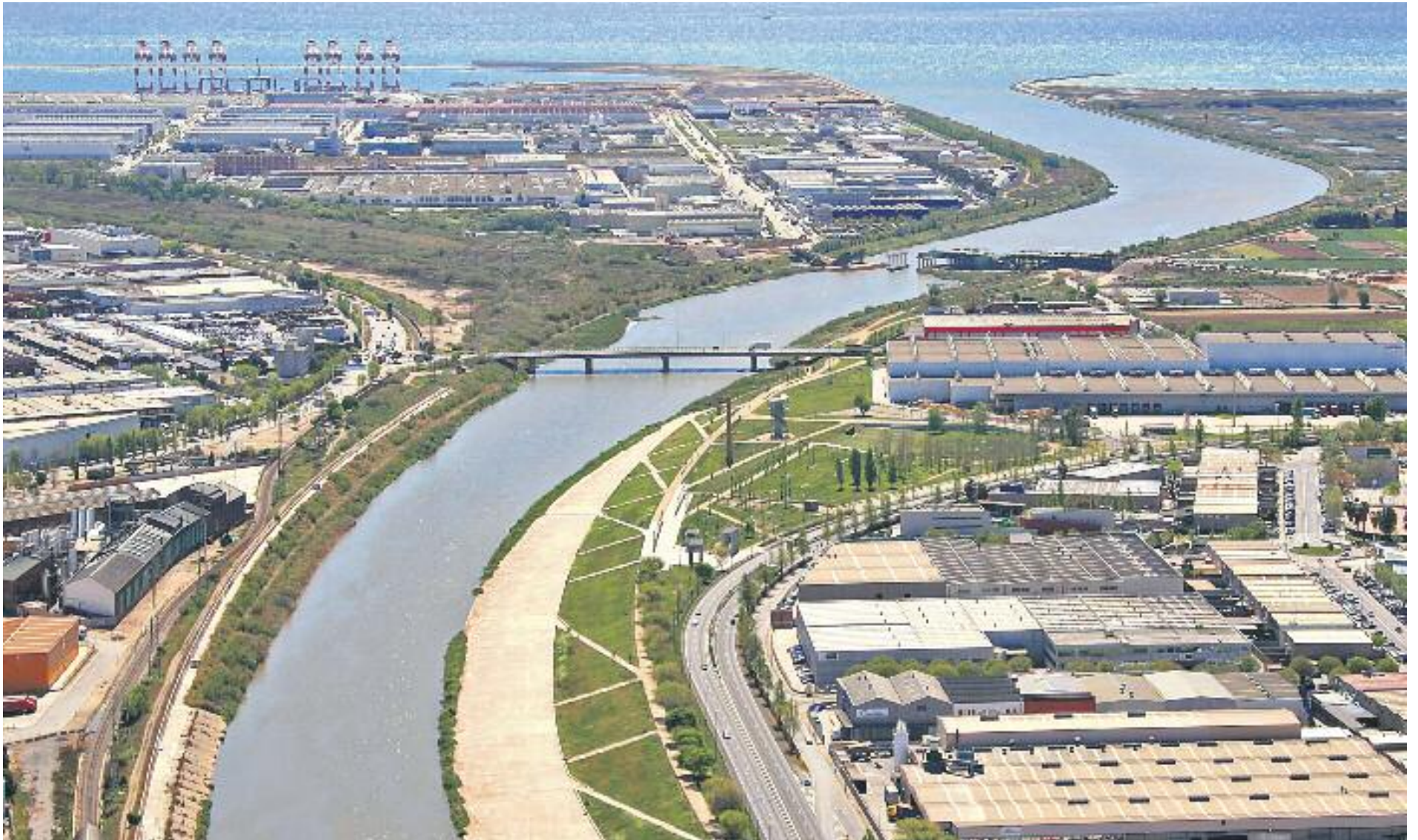
L'AMB destaca la importància econòmica i de generació d'ocupació dels polígons industrials.

» L'Àrea Metropolitana de Barcelona (AMB) dedica 30 milions a subvencionar-hi millores » Les ajudes volen promoure la competitivitat, dinamitzar aquests espais i generar ocupació