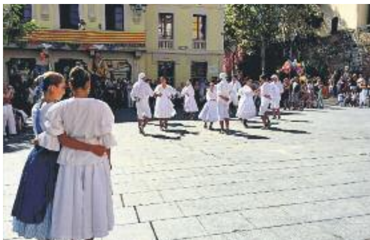
Les danses populars van ser protagonistes d'enguany.

L'Ajuntament valora positivament la participació en tots els actes d'unes festes que es van iniciar el segon cap de setmana de setembre. "Hem separat els actes en tres caps de setmana perquè no coincideixin tots", assenyala Blasco, que destaca la consolidació total de la mongetada i el concurs de paelles, així com la re-