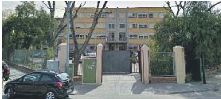
Imatge d'arxiu de l'Institut Puig Castellar.

Precisament el Puig Castellar ha vist com aquest curs el Departament d'Ensenyament de la Generalitat ha col·locat un bolet -una línia suplementària a les previstes- a ir d'ESO. Un fet que, segons l'Assemblea Grogga, és només un exemple de la massificació a les aules colomenques. "Hi ha instituts