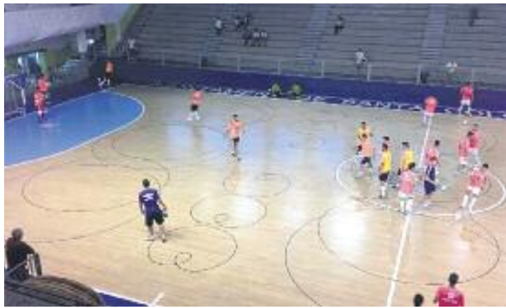
L'equip va oferir una bona imatge ahir al Pavelló Nou.

El Catgas va tornar a la pista amb la mateixa intenció de trobar la porteria de Barrón i Rafa va restablir l'empat després d'una jugada col·lectiva amb Javi i Corvo. Al minut 30 de partit Salgado va topa després d'una sortida a destemps