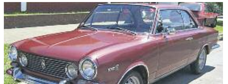
Un Torino dels 70, un dels possibles cotxes que podrien participar-hi.

Per altra banda, l'associació va celebrar el cap de setmana passat el Tiana Market, dues jornades comercials al carrer en el marc de la Festa Major que van omplir de parades el carrer Matas. Fonts de l'ACIST celebren la "bona afluència de visitants" i destaquen l'èxit dels tres foodtrucks que s'hi van instal·lar.