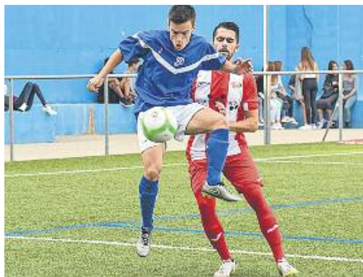
Els blanc-i-vermells van perdre contra l'Europa B.